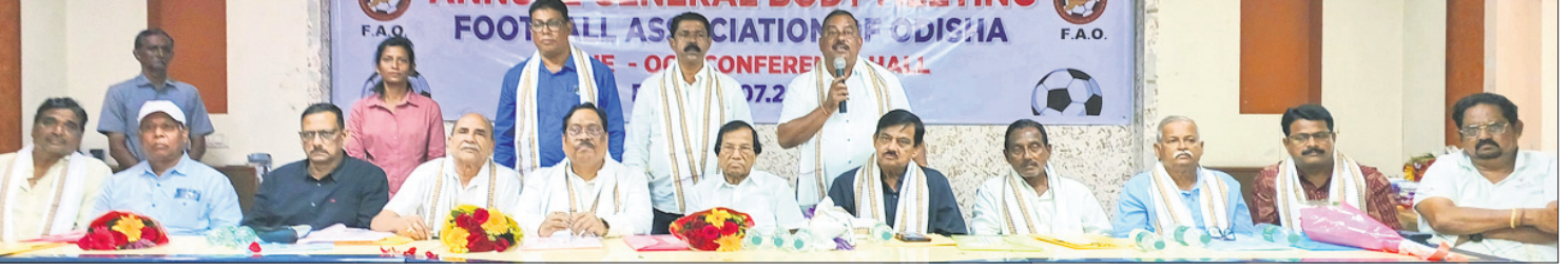
ପୁରୁଷଲ ଆସୋସିଏସନ ଅଫ୍ ଓଡ଼ିଶାର ନବନିର୍ବାଚିତ କର୍ମକର୍ତ୍ତା ଓ ଅନ୍ୟମାନେ ।

ଭୁବନେଶ୍ୱର, ୨୧।୭ (ତପନ ସାଲ) ପୁରୁଷଲ ଆସୋସିଏସନ ଅଫ୍ ଓଡ଼ିଶା (ଫାଓ)ର ବାର୍ଷିକ ସାଧାରଣ ବୈଠକ ଏବଂ ନିର୍ବାଚନ ରବିବାର ଓସିଏ କନ୍ଫରେନ୍ସ ହଲରେ ଅନୁଷ୍ଠିତ ହୋଇଯାଇଛି। ଆନ୍ଧ୍ରଜିଲ୍ଲା ପୁରୁଷ ସାହାଣୀ କର୍ମ ପୁରୁଷଲ ୨ଟି ଜୋନ୍‌ରେ ଅନୁଷ୍ଠିତ ହେବ। ଏହା ବ୍ୟତୀତ ଆନ୍ଧ୍ରଜିଲ୍ଲା ସିନିୟର ମହିଳା ପୁରୁଷଲ ଚାମ୍ପିୟନଶିପ୍ ‘ପି.ସି. ଚନ୍ଦ୍ର ଟ୍ରଫି’ ମଧ୍ୟ ଆୟୋଜନ ହେବ ବୋଲି ଉଚ୍ଚ ବୈଠକରେ ନିଷ୍ପତ୍ତି ନିଆଯାଇଛି। ଚାମ୍ପିୟନଶିପ୍