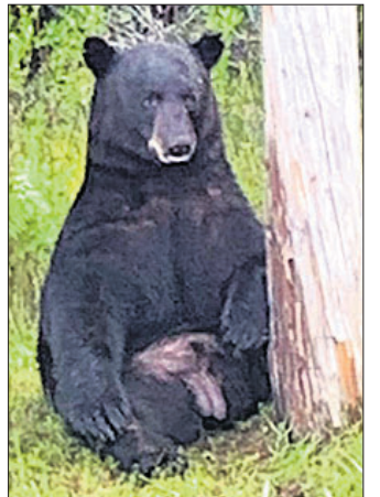
ସ୍ଥାନୀୟ ଲୋକଙ୍କୁ ଫ୍ଲୋରିଡ଼ା ପୋଲିସର ନିରେଦନ

ଜନସାଧାରଣଙ୍କୁ ଅନୁରୋଧ କରିଥିଲା। ଭାଲୁଟି ଚାପଗ୍ରସ୍ତ, ଉଦାସୀନ ଥିବା ପରି ଜଣାପଡ଼ୁଥିଲା ଏବଂ ଲୋକମାନେ ତା' ସହ ଫଟୋ ଉଠାଉଥିଲେ ମଧ୍ୟ ସେ ଏଥିପାଇଁ ଆଗ୍ରହ ଦେଖାଉ ନ ଥିଲା ବୋଲି ଫ୍ଲୋରିଡ଼ା ପୋଲିସର ଜଣେ ଅଧିକାରୀ କହିଛନ୍ତି। ପୋଲିସର ଅନୁରୋଧ କ୍ରମେ ସ୍ଥାନୀୟ ଲୋକେ ଉଦାସୀନ ଭାଲୁ ନିକଟକୁ ଯିବା ବନ୍ଦ କରିଥିଲେ। ଏହାପରେ ପୋଲିସ ଆୟୋଗ (ଏଫଡିଏସ୍‌ସି)କୁ ଘଟଣାଗୁଚ୍ଚକୁ ତକାଇଥିଲା। ତେବେ ଏଫଡିଏସ୍‌ସି ପହଞ୍ଚିବା ବେଳକୁ ଉଦାସୀନ ଭାଲୁ ସେହି ଅଞ୍ଚଳ