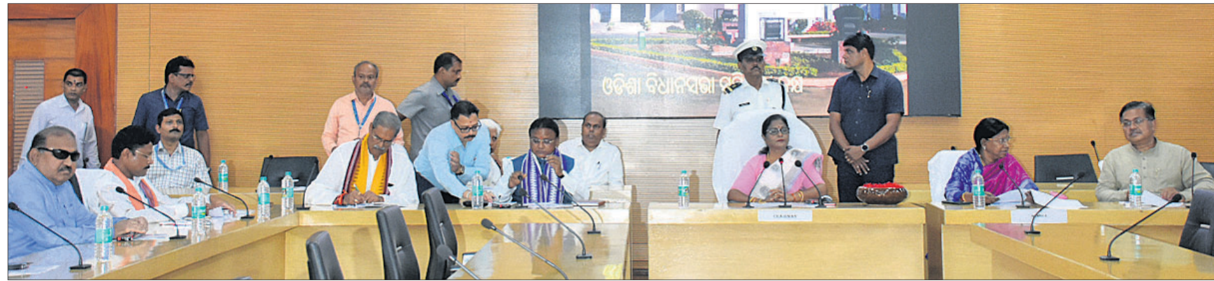
ବୀରଭଦ୍ର ପୁରମା ପାଠାଳୟରେ ବିଧାନସଭା ପରିସରରେ ରବିବାର ଅନୁଷ୍ଠିତ ସର୍ବଦଳୀୟ ବୈଠକରେ ପୁଖ୍ୟମନ୍ତ୍ରୀ ମୋହନ ଚରଣ ମାଝୀ, ଉପପୁଖ୍ୟମନ୍ତ୍ରୀ କନକବର୍ଦ୍ଧନ ସିଂହେଡ଼, ବିରୋଧୀ ଦଳ ପୁଖ୍ୟ ସଚେତକ ପ୍ରମିଳା ମଲ୍ଲିକଙ୍କ ସମେତ ଅନ୍ୟମାନେ।