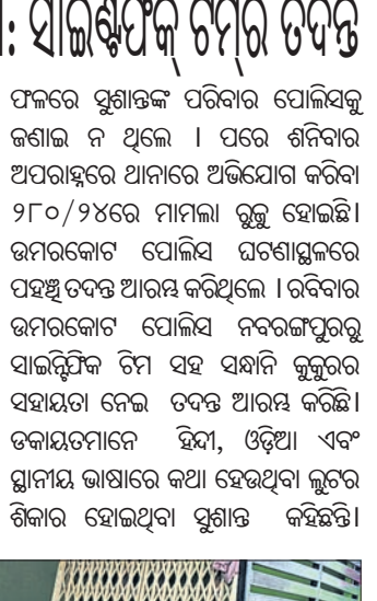
ନବରଙ୍ଗପୁର ସାଇଣ୍ଟିଫିକ୍ ଚିମ୍ପ ସହ ସନ୍ଧାନ କୁକୁର ତଦନ୍ତ କରୁଛି ।

ନବରଙ୍ଗପୁର ଜିଲ୍ଲା ଉତ୍ତରକୋଟ ପୁଲିସ୍ ଠାଣ୍ଡିରୁ ପୁରାଣ ଖରାକ ଘରୁ ଗତ ଶୁକ୍ରବାର ସନ୍ଧ୍ୟାରେ ଜଣେ ଯୁବକ ନିଜକୁ ଡେଇଁକରି ବନ୍ଧୁକ ପରିଷଦ ଦେଇ ଘର ଭିତରେ ପଶି ବନ୍ଧୁକ ଦେଖାଇ ଲକ୍ଷାଧିକ ଟଙ୍କାର ସୁନା ରହଣା ଲୁଚି ନେଇଥିଲେ । ଏହି ଘଟଣାରେ ରବିବାର ସାଇଣ୍ଟିଫିକ୍ ଚିମ୍ପ ସହ ସନ୍ଧାନ ଆସି ତଦନ୍ତ କରାଯିବ ବୋଲି ଅନୁଯାୟୀ ଶୁକ୍ରବାର ସନ୍ଧ୍ୟାରେ ଜଣେ ଦୁର୍ଭେଦ ପୁରାଣ ଖରାକ ଘରରେ ପଶି ବନ୍ଧୁକ ଦେଖାଇ ନଗଦ ୬ ଲକ୍ଷ ୬ ହଜାର ଟଙ୍କା ସହ ପ୍ରାୟ ୬ଲକ୍ଷ ଟଙ୍କାର ସୁନା ରହଣା ଲୁଚି ନେଇଥିଲେ । ଲୁଚି ବିଷୟରେ ପୋଲିସକୁ ଜଣାଇଲେ ସ୍କୁଲ ଗଲାବେଳେ ଚୁଲିକରି ଜୀବନରୁ ମାରି ଦେବାକୁ ଧମକ ଦେଇଥିଲେ । ନବରଙ୍ଗପୁର ସାଇଣ୍ଟିଫିକ୍ ଚିମ୍ପ ସହ ସନ୍ଧାନ କୁକୁର ତଦନ୍ତ କରୁଛି ।