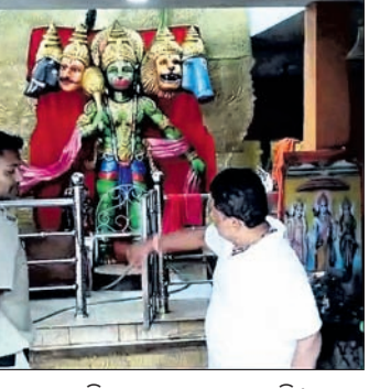
ପୋଲିସ ମନ୍ଦିରରେ ଚୋରି ଘଟଣାର ତଦନ୍ତ କରୁଛି ।

ନବରଙ୍ଗପୁର ବ୍ଲକ ଅଧିକ କେଶରୀଗୁଡ଼ା ଛକ ପାର୍ଶ୍ୱରେ ଥିବା ପଞ୍ଚମୁଖୀ ହନୁମାନ ମନ୍ଦିରରୁ ଶନିବାର ବିକଳିତ ରାତିରେ ଚୋରି ହୋଇଥିବା ଅଭିଯୋଗ ହୋଇଛି । ପଞ୍ଚମୁଖୀ ହନୁମାନଙ୍କ ରୁପା ମୁକୁଟ ଦୁର୍ଭେଦ ଚୋରି କରିନେଇଥିବା ନବରଙ୍ଗପୁର ଥାନାରେ ଅଭିଯୋଗ ହୋଇଛି । ମନ୍ଦିରରୁ ଏହା ଚିହ୍ନିତ ଧର ପାଇଁ ଚୋରି ହୋଇଥିବା କେଶରୀଗୁଡ଼ା ଗ୍ରାମବାସୀ କହିଛନ୍ତି । ଗାଁ ଲୋକେ ସକାଳେ ମନ୍ଦିରକୁ ପୂଜା କରିବା ପାଇଁ ଯିବାବେଳେ ଚୋର ଚାଲି ଭାଙ୍ଗି ଚଳେ ପଡ଼ିଥିବା ଦେଖି ନବରଙ୍ଗପୁର ଥାନାରେ ଅଭିଯୋଗ କରିଥିଲେ । ପୋଲିସ ଘଟଣାସ୍ଥଳରେ ପହଞ୍ଚି ତଦନ୍ତ ଆରମ୍ଭ କରିଛି । ୨ବର୍ଷ ତଳେ ମନ୍ଦିରରୁ ଚୋରି