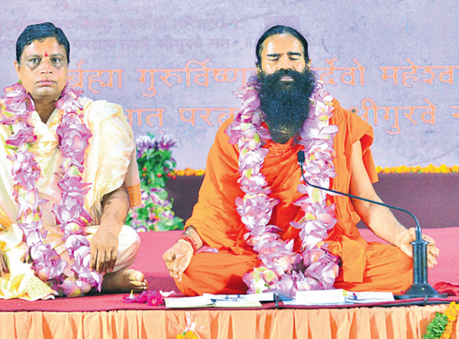
ଶିଷ୍ୟ ଏକତ୍ର ହୋଇଥିଲେ। ସେହିଭଳି ନିୟମ ମଧ୍ୟରେ ଏହି ଦିବସ ମହାଆଡ଼ମ୍ଭର ସହକାରେ ପାଳିତ ହୋଇଥିଲା।

ପ୍ରତି ବର୍ଷ ଭଳି ଚଳିତ ବର୍ଷ ମଧ୍ୟ ପତଞ୍ଜଳି ଯୋଗପୀଠ ହରିଦ୍ୱାରଠାରେ ଗୁରୁପୂର୍ଣ୍ଣିମା ପାଳିତ ହୋଇଯାଇଛି।