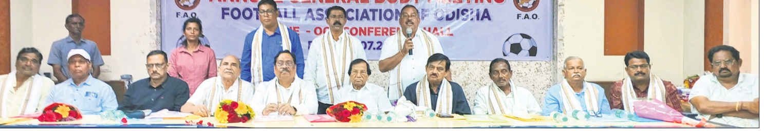
ଦୁଇଟି ଜୋନ୍‌ରେ ହେବ ସାହାଣୀ କର୍ମ ପୁରୁଷଲ ଆସୋସିଏସନ ଅଫ ଓଡ଼ିଶାର ନବନିର୍ବାଚିତ କର୍ମକର୍ତ୍ତା ଓ ଅନ୍ୟମାନେ ।