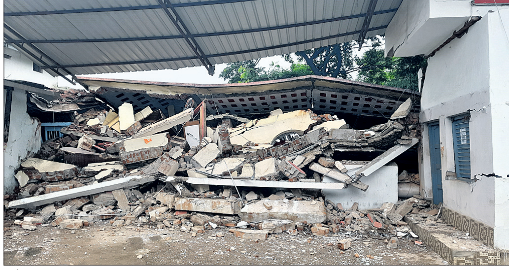
ବର୍ଷା ଯୋଗୁ ଭୁଶୁଡ଼ି ପଡ଼ିଥିବା ଗୋଦାନ ଘର ।

ଗତ ୩ ଦିନ ଧରି ନବରଙ୍ଗପୁର ଜିଲ୍ଲାରେ ହୁହାକୁ ହୁହା ବର୍ଷା ଲାଗି ରହିଛି । ଲଗାଣ ବର୍ଷା ପ୍ରଭାବରେ ଜିଲ୍ଲାର ବିଭିନ୍ନ ସ୍ଥାନରେ କ୍ଷୟକ୍ଷତି ଘଟୁଛି । ବର୍ଷା ଯୋଗୁ ଶନିବାର ରାତିରେ ନବରଙ୍ଗପୁର ସହର ଘରୋଇ ବସଷ୍ଟାଣ୍ଡ ନିକଟସ୍ଥ ବଜରଙ୍ଗା ରାଇସ୍ ମିଲର ଚାଉଳ ଗୋଦାନ ଗୃହ ଭୁଶୁଡ଼ି ପଡ଼ିଛି । ଫଳରେ ଲକ୍ଷାଧିକ ଟଙ୍କାର ଚାଉଳ ଦବିଯାଇଥିବା ଜଣାପଡ଼ିଛି । ଗୋଦାନ ଗୃହ ଭିତରେ ୩ ହଜାର କୁଇଣ୍ଟାଲ ସରକାରୀ ଚାଉଳ ସହ ଧାନ ରହିଥିବାବେଳେ ପାଣି ପଶି ଧାନ ଓ ଚାଉଳ ନଷ୍ଟ ହୋଇଯିବା ଆଶଙ୍କା ସୃଷ୍ଟି ହୋଇଛି । ଉକ୍ତ ଚାଉଳର ଆନୁମାନିକ ମୂଲ୍ୟ ପ୍ରାୟ ୩୦ ଲକ୍ଷ ଟଙ୍କା ହେବ ବୋଲି ଆକଳନ କରାଯାଇଛି । ଉକ୍ତ ଚାଉଳ ସରକାରଙ୍କ ତରଫରୁ ହିସାବକାରୀଙ୍କୁ ଯୋଗାଣ ପାଇଁ ରହିଥିଲା ବୋଲି