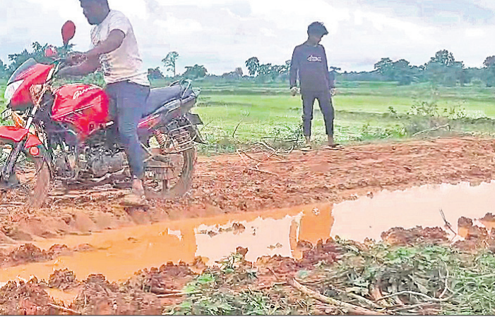
କଷ୍ଟ ଗ୍ରାମବାସୀ କାଦୁଅଭର୍ତ୍ତି ରାସ୍ତାରେ ବାଇକ୍ ଯୋଗେ ଯାଉଛନ୍ତି ।

ସମ୍ମୁଖୀନ ହେଉଥିବା କହିଛନ୍ତି । ଗାଁର ନାଗର ପକ୍ଷରୁ ସମ୍ପର୍କରେ ପ୍ରଶ୍ନାବନଠାରୁ ଆରମ୍ଭ କରି ଜନପ୍ରତିନିଧିଙ୍କ ନିକଟରେ ବାରମ୍ବାର ଅଭିଯୋଗ କଲେ ମଧ୍ୟ କେହି କର୍ତ୍ତୃପାତ୍ର କରୁ ନ ଥିବା ଅଭିଯୋଗ ହେଉଛି । ଅନ୍ୟପକ୍ଷେ ଲଗାଣ ବର୍ଷା ହେଲେ ୩ ଖଣ୍ଡ ଗାଁ ପଲାଇ ପାଠପଢ଼ା ବନ୍ଦ ରହିଛି । ରାସ୍ତା ଖରାପ ଯୋଗୁ ସ୍କୁଲକୁ ଶିକ୍ଷକ ଆସିପାରୁ