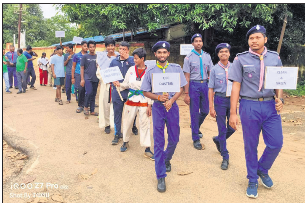
କଟଣା: ରେଡ଼କଲୋନୀ ସେବା କ୍ଳବ ପକ୍ଷରୁ ଅନୁଷ୍ଠିତ ସଚେତନତା କାର୍ଯ୍ୟକ୍ରମରେ ସ୍ୱାଭିମ୍ବ ଗାଲଡ଼ୁ ଛାତ୍ରାଛାତ୍ରୀ ଏବଂ ଅନ୍ୟମାନେ।