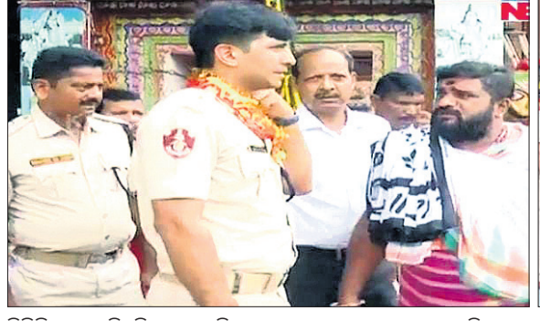
ଡିପିଏ ପ୍ରତୀକ ସିଂ ଲିଙ୍ଗରାଜ ମନ୍ଦିର ପୁରୁଣା ବ୍ୟବସ୍ଥା ଅନୁଧ୍ୟାନ କରୁଛନ୍ତି।