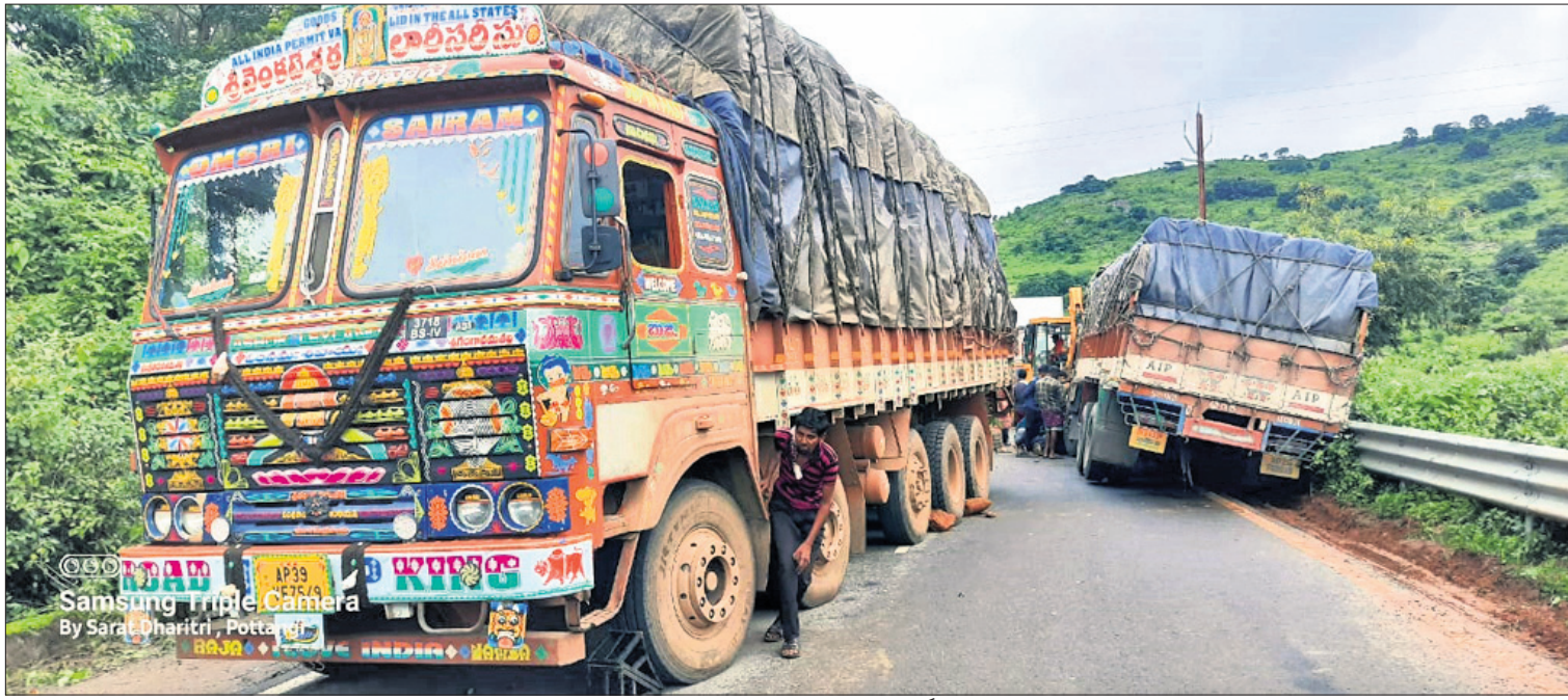
କୋରାପୁଟ ଜିଲ୍ଲା ପଟ୍ଟାଙ୍ଗି ବ୍ଲକ ୨୬ ନମ୍ବର ଜାତୀୟ ରାଜପଥର କାଉଗୁଣ୍ଡା ଘାଟିରେ ରବିବାର ପୂର୍ବରୁ ଅଟକି ରହିଥିବା ଏକ ଟ୍ରକକୁ ଅନ୍ୟ ଏକ ଟ୍ରକ ଅଟକିବା କରାଯାଇଛି।