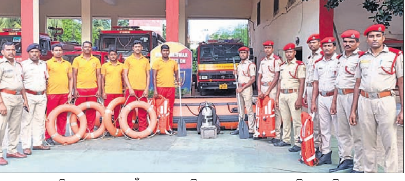
କାଉଡ଼ିଆଙ୍କ ପୁରୁଣା ପାଇଁ ଶେଡୁଲ୍‌କୁ ଯିବାକୁ ପ୍ରସ୍ତୁତ ହେଉଥିବା ଅଭିଯୋଗ ବାହିନୀ।