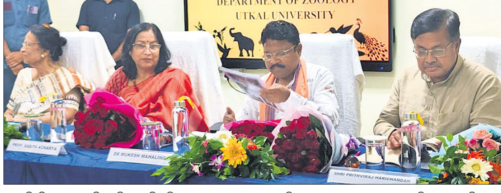
ଉତ୍କଳ ବିଶ୍ୱବିଦ୍ୟାଳୟ ପ୍ରାଣାବିଜ୍ଞାନ ବିଭାଗର ପ୍ରତିଷ୍ଠା ଦିବସରେ ଆଇନ ମନ୍ତ୍ରୀ ପୃଥ୍ୱୀରାଜ ହରିଚନ୍ଦନ ଓ ସାଧ୍ୱ୍ୟ ମନ୍ତ୍ରୀ ଡ. ପୁରୁଷୋତ୍ତମ ମହାଲିଙ୍ଗ ଓ ଅନ୍ୟ ଅତିଥିମାନେ।