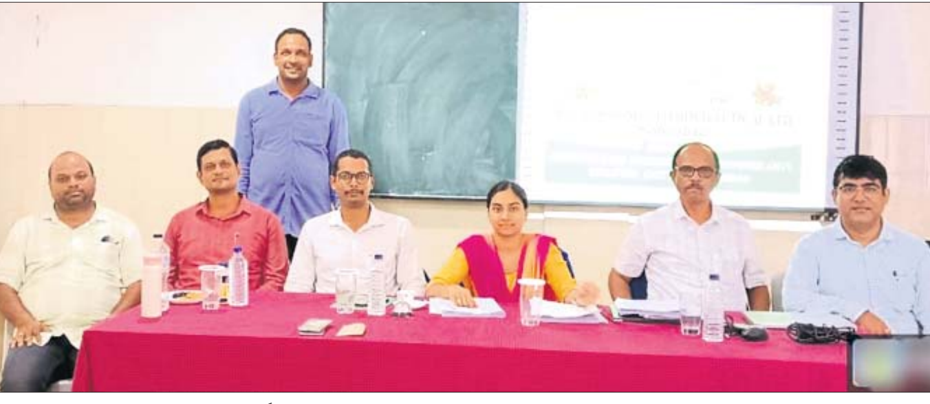
ସାଲେପୁର ସ୍ଥିତ ଇନ୍ଦ୍ରିୟ ଅଫ୍ ଫାର୍ମାସୀ ଏଣ୍ଡ ଚେକନୋଲୋଜି ତରଫରୁ ରବିବାର ଆୟୋଜିତ କ୍ୟାମ୍ପସ୍ ତରଫରୁ ଶିବିରରେ ଯୋଗଦେଇଥିବା ଅତିଥିମାନେ।

ରାସ୍ତାର ବିଭିନ୍ନ ସ୍ଥାନ ଖୋଳି ପକାଇଛି। ଫଳରେ ବର୍ଷା ଦିନେ ଖୋଳାଯାଇଥିବା ରାସ୍ତାରେ ପାଣି ଜମି ରହୁଛି। ଏନେଇ ଅଧିକାରୀ ସମୟରେ ପୂର୍ଣ୍ଣଚନ୍ଦ୍ର ଯତ୍ନେ। ସେହିପରି ରାସ୍ତାର ବିଭିନ୍ନ ସ୍ଥାନରେ ଗର୍ଭ ସୃଷ୍ଟି ହୋଇଥିବାରୁ ଜରୁରିକାଳୀନ ଯାନବାହନ ଉକ୍ତ ରାସ୍ତା ଦେଇ ଯାତାୟତ କରିପାରୁନାହିଁ। ରାସ୍ତା ନିର୍ମାଣ କାର୍ଯ୍ୟ ଅଧ୍ୟକ୍ଷ ନିମ୍ପାନର ହୋଇଛି। ଠିକାଦାରଙ୍କ ରୁଚ୍ଛିପତ୍ର ଅନୁଯାୟୀ, ରାସ୍ତା ନିର୍ମାଣ କାର୍ଯ୍ୟର ଅବଧି ଶେଷ ହୋଇଥିଲେ ମଧ୍ୟ ଅଧ୍ୟକ୍ଷ ରାସ୍ତା ନିର୍ମାଣ କାର୍ଯ୍ୟ ଅଧ୍ୟାପକରୁ ଖାମଖୁଆଳ ନାତି ଠିକାଦାରଙ୍କୁ ହୋଇ ରହିଯାଇଛି। ଆସନ୍ତା ୧୫ ଦିନ ମଧ୍ୟରେ ଏହି ରାସ୍ତା ନିର୍ମାଣ କାର୍ଯ୍ୟ ଶେଷ କରିବାକୁ ସ୍ୱାଇଁ ଦାବି କରିଛନ୍ତି।