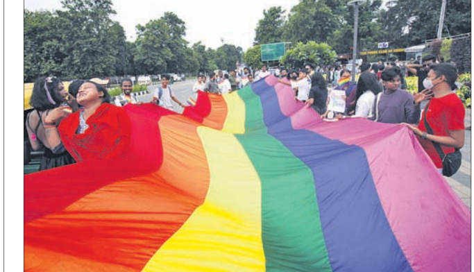
ଏକଜିବିଟିକ୍ୟୁ+ ପକ୍ଷରୁ ଅନୁଷ୍ଠିତ ସପ୍ତରଙ୍ଗୀ ଶୋଭାଯାତ୍ରା।

ଭୁବନେଶ୍ୱର, ୨୧।୭ (ଶର୍ମିଷ୍ଠା ପାଣିଗ୍ରାହୀ) ସମାଜର ଓ ସମବେଦନାର ଛବି ମନକୁ ଆସେ, ଯେବେ ସେମାନଙ୍କୁ ଏକା ସାଙ୍ଗରେ ନିଜର ଅଧିକାର ପାଇଁ ଲଢ଼େଇ କରିବାର ଦେଖିବାକୁ ପାଇଁ। ବିଭିନ୍ନ ବର୍ଗରେ ସେମାନଙ୍କୁ ବିଭକ୍ତ କଲେ ମଧ୍ୟ ସେମାନେ ବନ୍ଧା ଏକ ପୁରାଣେ। ସେମାନେ ହେଉଛନ୍ତି ଏକଜିବିଟିକ୍ୟୁ+। ରବିବାର ସେମାନେ