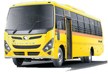
ପ୍ରାଧିକରଣ ପକ୍ଷରୁ ସ୍ୱତନ୍ତ୍ର ନିର୍ଦ୍ଦେଶନାମା ଜାରି ହୋଇଛି। କେନ୍ଦ୍ରୀୟ ମୋଟର ଯାନ ନିୟମ(ସିଏମ୍‌ଜିଆର୍) ୧୯୮୯ର ଧାରା ୧୨୫ସି ଅନୁଯାୟୀ ସମସ୍ତ ସ୍କୁଲ ବସରେ

ଭୁବନେଶ୍ୱର, ୨୧।୭(ଅସମାପିତା ସାହୁ) ରାଜ୍ୟରେ ଚାଲୁଥିବା ସ୍କୁଲ ବସଗୁଡ଼ିକରେ ଛାତ୍ରଛାତ୍ରୀଙ୍କୁ ବିପଦସଙ୍କୁଳ ଅବସ୍ଥାରେ ପରିବହନ କରାଯାଉଛି। ଏପରିକି ସେଥିରେ ଅଗ୍ନି ନିରାପତ୍ତା ବ୍ୟବସ୍ଥା ନ ଥିବା ଓ ନିର୍ଦ୍ଧାରିତ କ୍ଷମତାଠାରୁ ଅଧିକ ଛାତ୍ରଛାତ୍ରୀ ନିଆଯାଉଥିବା ନେଇ ଦାୟିତ୍ୱ ହେବ ଅଭିଭାବକମାନେ ଅଭିଯୋଗ କରି ଆସୁଛନ୍ତି। ଏନେଇ ଏକାଧିକ ଅଭିଯୋଗ ଆସିବା ପରେ ବିଳମ୍ବରେ ହେଲେ ବି ପରିବହନ ବିଭାଗର ଚେତା ପଶିଛି। ସ୍କୁଲ ବସରେ ଅଗ୍ନି ନିରାପତ୍ତା ନିୟମ ପାଳନକୁ ସୁନିଶ୍ଚିତ କରିବା ଦିଗରେ ରାଜ୍ୟ ପରିବହନ ସମସ୍ତ ଆରଟିଓଙ୍କୁ ପରିବହନ କମିଶନରଙ୍କ ଠିକି ଅଗ୍ନି ନିରାପତ୍ତା ବ୍ୟବସ୍ଥା ନେଇ ଅନିବାର୍ଯ୍ୟ। ତେଣୁ ଖୁଲ୍ଲପକାରୀଙ୍କ ବିରୋଧରେ ଦୃଢ଼ କାର୍ଯ୍ୟାନୁଷ୍ଠାନ ଗ୍ରହଣ କରିବାକୁ ସମସ୍ତ ଆଞ୍ଚଳିକ ପରିବହନ ଅଧିକାରୀ(ଆରଟିଓ)ଙ୍କୁ ରାଜ୍ୟ ପରିବହନ କମିଶନର ଅନିବାର୍ଯ୍ୟ ଠାକୁର ନିର୍ଦ୍ଦେଶ ଦେଇଛନ୍ତି। ସ୍କୁଲ ବସଗୁଡ଼ିକର ଅଗ୍ନି ନିରାପତ୍ତା ବ୍ୟବସ୍ଥା ଉପରେ ଟାଣ୍ଡ ନଜର ରଖାଯିବ। ସମସ୍ତ ଲୋଡ଼ ଉପପରିବହନ ଆୟତ୍ତ ଏବଂ ଆଞ୍ଚଳିକ ପରିବହନ ଅଧିକାରୀମାନେ ନିୟମିତ ଭାବେ ଏହାର