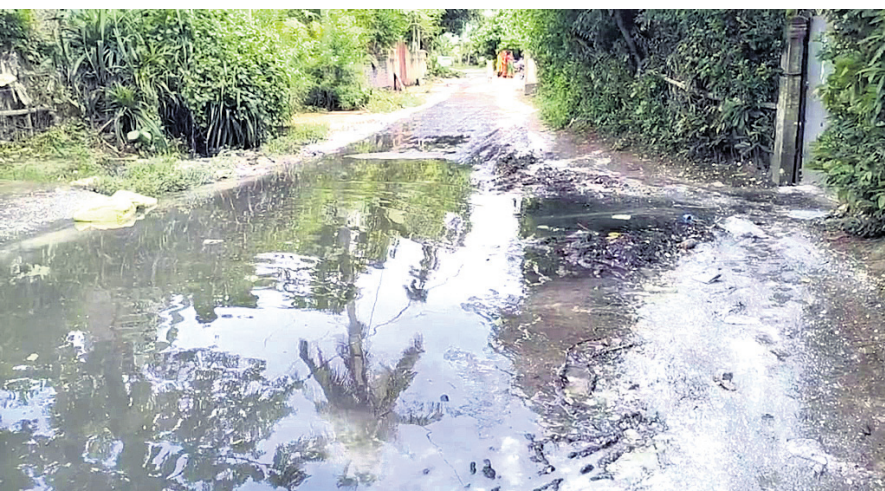
ଗାଁ ଦାଣ୍ଡରେ ବର୍ଷା ପାଣି ଜମି ରହିଛି।