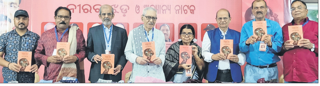
ଅତିଥିମାନେ 'ନୀରବ ଝଡ଼ ଓ ଅନ୍ୟାନ୍ୟ ନାଟକ' ପୁସ୍ତକ ଉନ୍ମୋଚନ କରୁଛନ୍ତି।