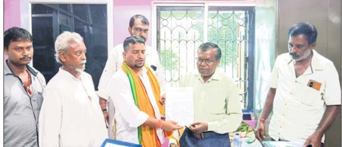
ପୂର୍ବବିଭାଗ ଅଧିକାରୀଙ୍କୁ ଦାବିପତ୍ର ଦିଆଯାଇଛି।

କୁଆଁପାଳ-ସାଲେପୁର ରାସ୍ତା ନିର୍ମାଣ ଅବଧି ଶେଷ ହୋଇଥିଲେ ମଧ୍ୟ ନିର୍ମାଣ କାର୍ଯ୍ୟ କଳ୍ପେ ଗତରେ ଚାଲିଛି। ଅଧ୍ୟକ୍ଷ ରାସ୍ତା ନିର୍ମାଣ କାର୍ଯ୍ୟ ଅଧ୍ୟାପକରୁ ଆ ହୋଇ ପଡ଼ିବୁଛି। ଏନେଇ ଆସନ୍ତା ୧୫ଦିନ ମଧ୍ୟରେ ରାସ୍ତା ନିର୍ମାଣ କାର୍ଯ୍ୟ ଶେଷ କରିବାକୁ ଦାବି କରାଯାଇଛି। ନଚେତ୍ କଟକ-ସାଲେପୁର ରାସ୍ତା ଦୀର୍ଘ ସମୟ ଧରି ଅବରୋଧ କରାଯିବ। ସହ