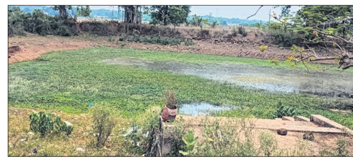
ବେଗୁନିଆ, ୨୧୧୭(ସନ୍ଧ୍ୟାକାଳୀନ ଫିଲ୍ମ)

ବେଗୁନିଆ ପୋଖୀ ଅପିଏ ସମ୍ମୁଖ ତଥା ୫୭୯୯. କାମାୟ ରାଜପଥ କଡ଼ରେ ଥିବା ଗୋଡ଼ିପୋଖରୀ ପରିତ୍ୟକ୍ତ ଅବସ୍ଥାରେ ରହିଥିବା ଦେଖିବାକୁ ମିଳିଛି। ଗ୍ରାମବାସୀଙ୍କ ସହର ଗୋଡ଼ି ପୋଖରୀ ଉପରେ ନିର୍ଭର କରୁଥିବା ଲୋକେ ଅଧିକାଂଶ ସମ୍ପୂର୍ଣ୍ଣ ହେଉଛନ୍ତି। ପୋଖରୀର ପାହାନ୍ତରୁକି ମଧ୍ୟ ନଷ୍ଟ ପୋଖରୀ ଉପରେ ନିର୍ଭର କରିଥାନ୍ତି। ପଞ୍ଚାୟତ ପକ୍ଷରୁ ଏହି ପୋଖରୀଟି ନିର୍ମୂଳ ଦିଆଯାଉଥିବା ବେଳେ ସେ ବାବଦରେ ପଞ୍ଚାୟତ ତହସିଲକୁ ପ୍ରତିବର୍ଷ କିଛି ଅର୍ଥ ଆସିଥାଏ। ତେବେ ପୋଖରୀର ଉପଯୁକ୍ତ ରକ୍ଷାକାରଣ ଆବଶ୍ୟକ ଅଭାବରୁ ଏବେ ଗୋଡ଼ିପୋଖରୀ କମ୍ ଥିବାବେଳେ ଦଳ ଏବଂ ଅନାବନା ଗଛରେ ଭରି ହୋଇଛି। ଫଳରେ ପୋଖରୀ ଉପରେ ନିର୍ଭର କରୁଥିବା ଲୋକେ ଅଧିକାଂଶ ସମ୍ପୂର୍ଣ୍ଣ ହେଉଛନ୍ତି। ପୋଖରୀର ପାହାନ୍ତରୁକି ମଧ୍ୟ ନଷ୍ଟ ହୋଇଗଲାଣି। ପୋଖରୀରୁ ଦଳ ସଫା କରାଯିବା ସହ ମାଟି ଉଠାଇବା ପାଇଁ ପଦକ୍ଷେପ ନିଆଗଲେ ଗ୍ରାମବାସୀ ଉପକୂଳ ହୋଇପାରନ୍ତେ। ଏଥିପ୍ରତି ଗ୍ରାମୀୟ ପ୍ରଶାସନ ଦୃଷ୍ଟି ଦେବାକୁ ଦାବି ହେଉଛି।