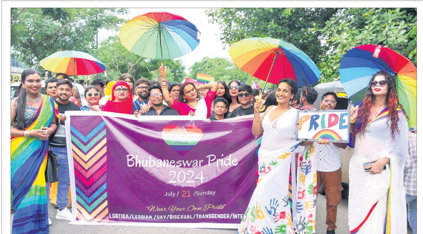
ଭୁବନେଶ୍ୱର ଜନପଥରେ ରବିବାର ଆୟୋଜିତ ସପ୍ତରଙ୍ଗୀ ଶୋଭାଯାତ୍ରା 'ଭୁବନେଶ୍ୱର ପ୍ରାଇଡ'ରେ ସାମିଲ ହୋଇଥିବା ଏକଜିବିଟିକ୍ୟୁ+ମାନେ।

ନ ଥିଲା। ଫଳରେ ପରିବାର ଲୋକେ ଚିନ୍ତାରେ ଥିଲେ। ଶନିବାର ସକାଳେ ଅପହରଣୀମାନେ ନାବାଳକଙ୍କୁ ଉଚ୍ଚ ଗ୍ଲାନକୁ ଅନ୍ୟ ଏକ ଗ୍ଲାନକୁ ନେବାବେଳେ ଏକ ବଜାର ପାଖରେ ଅଟକିଥିଲେ। ଏହି ସୁଯୋଗରେ ନାବାଳକ ଜଣକ ଅପହରଣ କବଳରୁ ଖସି କିଛି ଦୂରରେ ଛିଡ଼ା ହୋଇଥିବା ଏକ ଟ୍ରେନ୍ରେ ଚଢ଼ି ଯାଇଥିଲେ। ଶନିବାର ରାତିରେ ଟ୍ରେନ୍ଟି ରକ୍ଷା ନିକଟ ଷ୍ଟେସନରେ ଧୀରେ ଯାଇଥିବା ସୁଯୋଗରେ ଗାଡ଼ିରୁ ଚେଇଁପଡ଼ି ସମ୍ପର୍କିତ ଘରକୁ ଯାଇ ଅପହରଣର ଘଟଣା ବିଷୟରେ ସବୁ କହିଥିଲେ। ରବିବାର ସକାଳେ ପୁଅ ଘରେ ପହଞ୍ଚିବା ପରେ ପରିବାର ଲୋକେ ତାଙ୍କୁ ଧରି ଥାନାରେ ପହଞ୍ଚିଥିଲେ। ପୋଲିସ ଘଟଣା ବିଷୟରେ ପଚାରିବୁଦ୍ଧିତଦତ୍ତକାରୀରଖିଛି।