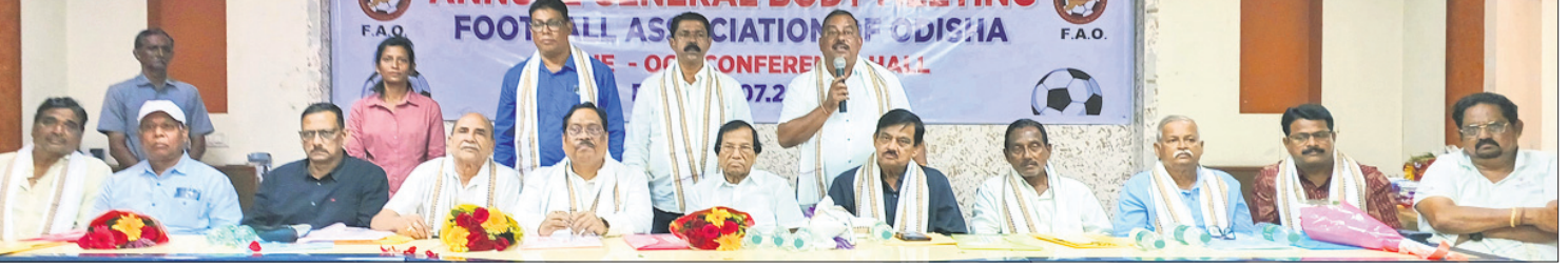
ପୁରୁଷଲ ଆସୋସିଏସନ ଅଫ ଓଡ଼ିଶାର ନବନିର୍ବାଚିତ କର୍ମକର୍ତ୍ତା ଓ ଅନ୍ୟମାନେ ।