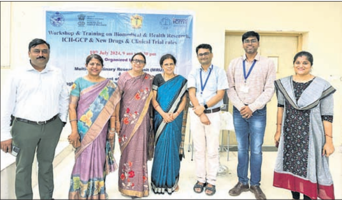
ଭୁବନେଶ୍ୱର, ୨୨।୭