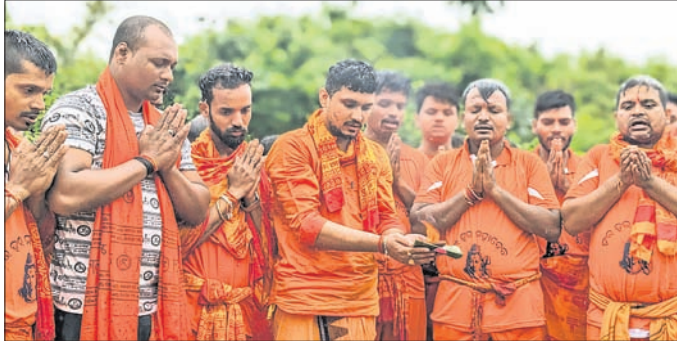
ଚିକିରି ନଦୀ କୂଳରେ ବୋଲବମ୍ ଭକ୍ତ ପୂଜାର୍ଚ୍ଚନା କରୁଛନ୍ତି।