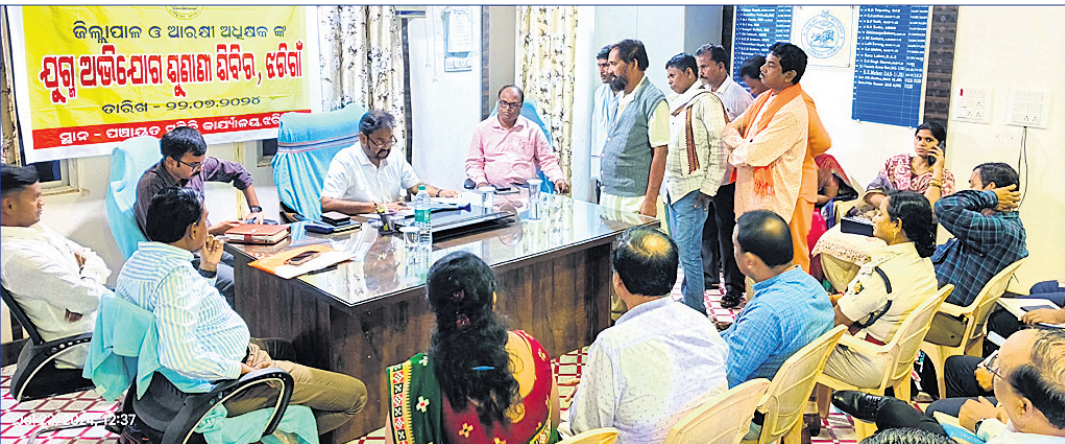
ଜିଲାପାଳ ଲୋକମାନଙ୍କ ଅଭିଯୋଗ ଶୁଣୁଛନ୍ତି।

ଝରିଗାଁ ବ୍ଲକ୍ ପଲସଗାଁରେ ରହିଥିବା ରମାଦେବୀ ଆବାସିକ ବାଳିକା ଉଚ୍ଚ ବିଦ୍ୟାଳୟରେ ଅଷ୍ଟମରୁ ଦଶମ ଶ୍ରେଣୀ ପର୍ଯ୍ୟନ୍ତ ରହିଛି। ସେଠାରେ ୨୫୬ ଜଣ ଛାତ୍ରୀ ପଢ଼ୁଛନ୍ତି। ସେମାନଙ୍କ ପାଇଁ ମାତ୍ର ୨ଜଣ ଶିକ୍ଷକ ଶିକ୍ଷକ ଅଛନ୍ତି। ଫଳରେ ପିଲାଙ୍କୁ ଗୁଣାତ୍ମକ ଶିକ୍ଷା ମିଳୁନାହିଁ। ଉଚ୍ଚ ବିଦ୍ୟାଳୟରେ ରହିଥିବା ଶିକ୍ଷକ ସମସ୍ୟା ନେଇ ପ୍ରଧାନ ଶିକ୍ଷକମଣ୍ଡଳ ରଥ ଜିଲାପାଳଙ୍କୁ ଲିଖିତ ଅଭିଯୋଗ କରିଥିଲେ। ସେହିପରି ବକଡ଼ାବେଡ଼ା ରାଜସ୍ୱ ନିରୀକ୍ଷକଙ୍କ କାର୍ଯ୍ୟାଳୟ ସକାଶେ ନୂତନ ରାଜସ୍ୱ ନିରୀକ୍ଷକଙ୍କୁ ତୁରନ୍ତ ନିଯୁକ୍ତି କରିବା ନେଇ ଅଞ୍ଚଳବାସୀ ଦାବି କରିଥିଲେ। ଧନମାଗୁଡ଼ା