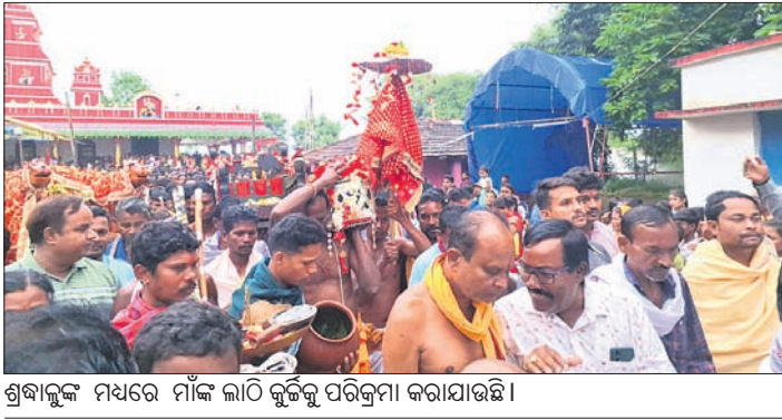
ଶ୍ରୀବତ୍ସ ମାସରେ ମା'ଙ୍କ ଲାଠି କୁଟି ପରିକ୍ରମା କରାଯାଇଛି।

ସକାଳୁ ରାତିକାଟି ଅନୁଯାୟୀ ମା' ପେଣ୍ଡରାଣୀଙ୍କ ପୂଜା କରାଯାଇଥିଲା। ମହାଆଡ଼ମ୍ବର, ଷୋକସ ଉପକରଣ, ପଣା