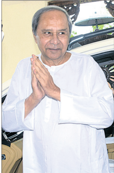
ସପ୍ତବଶି ବିଧାନସଭାର ବଜେଟ୍ ଅଧିବେଶନ ସୋମବାର ଆରମ୍ଭ ହୋଇଥିବାବେଳେ ଗୃହକୁ ଯାଉଛନ୍ତି ବାମନୁ ମୁଖ୍ୟମନ୍ତ୍ରୀ ମୋହନ ଚରଣ ମାଝୀ, ବାଚସ୍ପତି ସୁରଜା ପାଢ଼ୀ, ଉପମୁଖ୍ୟମନ୍ତ୍ରୀ ପ୍ରଭାତୀ ପରିଡ଼ା ଓ ବିରୋଧୀ ଦଳ ନେତା ନବୀନ ପଟ୍ଟନାୟକ ।