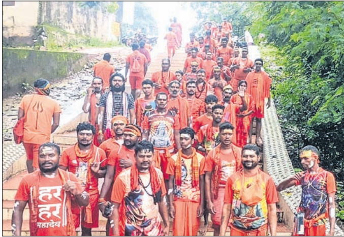
ମୁନିଗୁଡ଼ାର ଲୁମ୍ପୁଡ଼ାବାଲିସ୍ଥିତ ବାଲୁକେଶ୍ୱର ମନ୍ଦିରରେ କାଉଡ଼ିଆଙ୍କ ଭିଡ଼।

ଓ ପାଇପ କନେକ୍ସନ ରହିଥିଲେ ମଧ୍ୟ ବିଦ୍ୟୁତ୍ ବ୍ୟବସ୍ଥା ହୋଇ ନ ଥିବାରୁ ଏହା କାର୍ଯ୍ୟକ୍ଷମ ହୋଇପାରିନାହିଁ। ଫଳରେ ହାଣ୍ଡିଏ ପାଣି ପାଇଁ ଡହଳବିକଳ ହେଉଛନ୍ତି ଲୋକେ। ଅନ୍ୟପଟେ ନଳକୂପ ଅଥବା ପାଇପ ଖରାପ ହେଲେ ବିଭାଗୀୟ କର୍ମଚାରୀ ମରାମତି କରିବା ପାଇଁ ଟଙ୍କା ମାଗୁଛନ୍ତି। ତେଣୁ ଜିଲ୍ଲା ପ୍ରଶାସନ ଏଥିପ୍ରତି ଦୃଷ୍ଟିଦେଇ ଏହାର ସମାଧାନ କରିବାକୁ ମହିଳାମାନେ ଦାବି କରିଛନ୍ତି। ତେବେ ଅତିରିକ୍ତ ଜିଲ୍ଲାପାଳ ରୟତ ଏ ନେଇ ବିଡ଼ିଓଙ୍କ ସହିତ ଫୋନରେ ଆଲୋଚନା କରି ଶୀଘ୍ର ବିଦ୍ୟୁତ୍ ଯୋଗାଣ ବ୍ୟବସ୍ଥା କରି ଗାଁରେ ପାନୀୟ ଜଳ ଯୋଗାଣ ବ୍ୟବସ୍ଥା ସୁଧାରିବାକୁ ନିର୍ଦ୍ଦେଶ ଦେଇଛନ୍ତି।