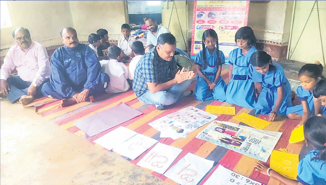
ଡିଜିଟାଲ ଏବଂ ବିଡିଓ କୋଷାଗୁଡ଼ିକ ଏକ୍ସ ବୋର୍ଡ ଉପ ପ୍ରାଥମିକ ବିଦ୍ୟାଳୟରେ ଶିକ୍ଷା ଉପକରଣ ପ୍ରଦର୍ଶନ ଦେଖୁଛନ୍ତି।