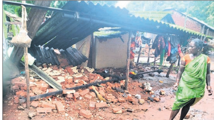
ନୟପୁର ବ୍ଲକ୍‌ରେ ବର୍ଷା ଯୋଗୁ ଭାଙ୍ଗିଥିବା ଏକ ଘର।

କୋରାପୁଟ ଜିଲ୍ଲାରେ ଗତ କିଛି ଦିନ ହେଲା ପ୍ରବଳ ବର୍ଷା କାରି ରହିଛି। ଏଥିଯୋଗୁ ଜିଲାର ବିଭିନ୍ନ ସ୍ଥାନରେ ବହୁ ଗଛ ଓ ଘର ଭାଙ୍ଗିଛି। ଗତ ୩ ଦିନ ମଧ୍ୟରେ ଜିଲ୍ଲାରେ ମୋଟ ୪୦ଟି ଘର ଭାଙ୍ଗିଥିବା ଜଣାଯାଇଛି। ଜିଲା ଜରୁରୀକାଳିନ ବିଭାଗର ରିପୋର୍ଟ ଅନୁଯାୟୀ ଗତ ଶନିବାର ଜିଲାର ୫ଟି ବ୍ଲକ୍‌ରେ ୧୩ ଟି ଘର(ବୈସାଖପୁର, ବ୍ଲକ୍‌ର ଗାଟି, କୋରପାଡ଼ ବ୍ଲକ୍‌ର ୫ଟି, ଜୟପୁର ବ୍ଲକ୍‌ର ଗୋଟିଏ, ସେମିଲିଗୁଡ଼ା ବ୍ଲକ୍‌ର ୨ଟି ଓ ଲମତାପୁର ବ୍ଲକ୍‌ର ୨ଟି) ଭାଙ୍ଗିଥିବା ବେଳେ ରବିବାର ୧୬ଟି ଘର (କୋରାପୁଟ ବ୍ଲକ୍‌ର ଗାଟି, କୋରପାଡ଼ ବ୍ଲକ୍‌ର ୪ଟି, କୁରୁଡ଼ା ବ୍ଲକ୍‌ର ଗାଟି, ଲମତାପୁଟ