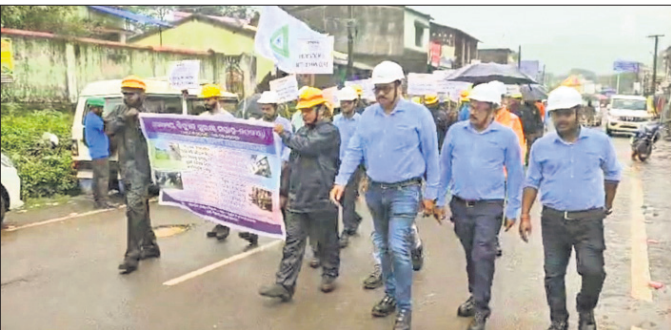
ଶୋଭାଯାତ୍ରା ମାଧ୍ୟମରେ ଲୋକଙ୍କୁ ସଚେତନ କରାଯାଉଛି।

ରାୟଗଡ଼ା ଜିଲ୍ଲା କାଶୀପୁର ବ୍ଲକ୍ ବିଦ୍ୟୁତ୍ ବିଭାଗ ପକ୍ଷରୁ ଜାତୀୟ ବିଦ୍ୟୁତ୍ ସୁରକ୍ଷା ସପ୍ତାହ ପାଳିତ ହୋଇଯାଇଛି। ଏହି ଅବସରରେ କାଶୀପୁରରେ ଏକ ସଚେତନତା ରାଲି ଅନୁଷ୍ଠିତ ହୋଇଥିଲା। ଏବେ ବର୍ଷା ଋତୁ ଚାଲିଥିବାରୁ ବିଦ୍ୟୁତ୍ ଆଘାତରୁ ରକ୍ଷା ପାଇଁ କିପରି ସଚେତା ଅବଲମ୍ବନ କରିବେ ସେ ନେଇ ଲୋକଙ୍କୁ ସଚେତ କରାଯାଇଥିଲା। କାଶୀପୁର ସଦର ମହକୁମାରେ ଏକ ସଚେତନତା ରାଲି ଜଗନ୍ନାଥ ମନ୍ଦିର ପରିସରକୁ ବାହାରି ଲୁକ୍ ଛକ ପର୍ଯ୍ୟନ୍ତ ଯାଇ ଲୋକଙ୍କୁ ସୁରକ୍ଷା ବାର୍ତ୍ତା ଦେଇଥିଲେ। ବର୍ଷାଦିନେ କୌଣସି ବିଦ୍ୟୁତ୍ ଫୁଟ୍ ଛୁଇଁବେ ନାହିଁ, ଯଦି କୌଣସି ଜାଗାରେ ବିଦ୍ୟୁତ୍ ତାର ଛିଣ୍ଡିଛି, ତା' ପାଖକୁ ନିର୍ଦ୍ଦେଶ ନାହିଁ। ଏ ନେଇ ଗୁରୁତ୍ୱ ବିଦ୍ୟୁତ୍ ବିଭାଗ କର୍ମଚାରୀଙ୍କୁ ଜଣାଇଦେ, ବିଦ୍ୟୁତ୍ ତାର ତଳେ କେବେ ଗଛ ଲାଗାନ୍ତୁ ନାହିଁ