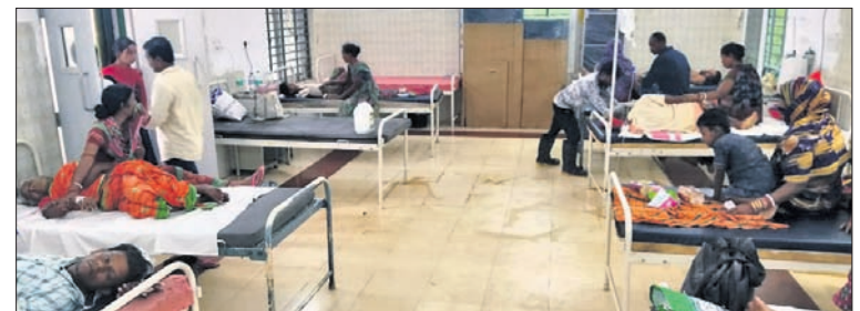
ବଡ଼ଟଣା ଗୋଷ୍ଠୀ ସ୍ୱାସ୍ଥ୍ୟକେନ୍ଦ୍ରରେ ଝାଡ଼ାବାନ୍ତିରେ ଆକ୍ରାନ୍ତ ରୋଗୀଙ୍କ ଚିକିତ୍ସା ଚାଲିଛି ।