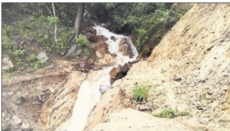
ବାୟାପଡ଼ା ଯିବାକୁ ରାସ୍ତାରେ ହୋଇଥିବା ଭୁଲ୍ଲନ।

ରୁକୁ କହିଛନ୍ତି, ଉଚ୍ଚ ରାସ୍ତାଟି ଗ୍ରାମ୍ୟ ଉନ୍ନୟନ ବିଭାଗ ମାଲକାନଗିରି ଅଧୀନରେ ଥିବାରୁ ବିଭାଗୀୟ ଅଧିକାରୀଙ୍କୁ ଏବେକି ଅବଗତ କରାଯାଇଛି। ଏବେକି ଆମେ ଗ୍ରାମ୍ୟ ଉନ୍ନୟନ ସଂସ୍ଥା ମାଲକାନଗିରି କମିଷ୍ନି ଯନ୍ତ୍ରାଳୟ ଯୋଗାଯୋଗ କରିବାକୁ ଚେଷ୍ଟା କରିଥିଲେ ମଧ୍ୟ ତାହା ସମ୍ଭବ ହୋଇପାରି ନ ଥିବାରୁ ଅଧିକାରୀଙ୍କ ପ୍ରତିକ୍ରିୟା ମିଳି ପାରି ନାହିଁ।