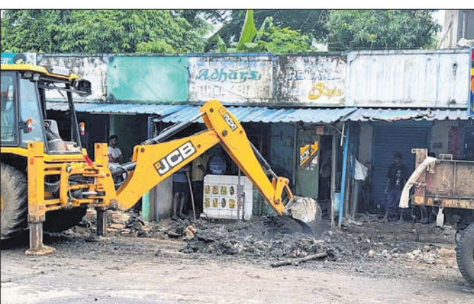
ଜେସିବି ମେଶିନ ଦ୍ୱାରା ଡ୍ରେନ୍ ଉଦ୍ଧାରଯାଉଛି।

ରାୟଗଡ଼ା ସହରର ଡ୍ରେନେଜ ସମସ୍ୟା ଦିନକୁ ଦିନ ବଢିବାରେ ଲାଗିଛି। ଡ୍ରେନ୍‌ରେ ଜଳ ନିଷ୍କାସନ ନ ହୋଇ ଘର ଭିତରେ ଭସ୍ମ କରୁଥିବା ପରିଲକ୍ଷିତ ହୋଇଛି। ବର୍ତ୍ତମାନ ଲଗାଣ ବର୍ଷା ଯୋଗୁଁ ଏହି ସମସ୍ୟା ଆହୁରି ଅଧିକ ଜଟିଳ ହୋଇପଡ଼ିଛି। ତେବେ ପୌର ପରିଷଦ ପକ୍ଷରୁ ଗୁଣ୍ଡିଚା ଛକରେ ଡ୍ରେନ୍ ନିର୍ମାଣ ସମୟରେ ତ୍ୱରିତ ଯୋଗୁଁ ସେଥିରେ ପାଣି ନିଷ୍କାସନ ହୋଇପାରୁ ନ ଥିଲା। ଫଳରେ ବାଧ୍ୟହୋଇ ପୌର ପରିଷଦ ପକ୍ଷରୁ ଲକ୍ଷାଧିକ ଟଙ୍କା ବ୍ୟୟରେ ନିର୍ମାଣ କରାଯାଇଛି। ପୌର ପରିଷଦ ସମ୍ପାଦକ ଦୁରଦୃଷ୍ଟି ଅଭାବ ଓ ଠିକାଦାର ପ୍ରାତି କାରଣରୁ ଏଭଳି ପରିସ୍ଥିତି ସୃଷ୍ଟି ହୋଇଥିବା ଆଲୋଚନା ହେଉଛି। ମିଳିଥିବା ସୂଚନା ଅନୁଯାୟୀ, ଗୁଣ୍ଡିଚା ଛକରେ ୨୦୨୨ ନଭେମ୍ବରରେ ପୂର୍ବ ବିଭାଗ ରାସ୍ତା ଉପରେ ପୌର ପରିଷଦ ତରଫରୁ ଡ୍ରେନ୍ ନିର୍ମାଣ ହୋଇଥିଲା।