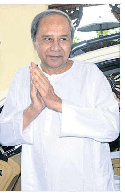
ସପ୍ତକ୍ଷତ୍ର ବିଧାନସଭାର ବଜେଟ୍ ଅଧିବେଶନ ଯୋଜନାର ଆରମ୍ଭ ହୋଇଥିବାବେଳେ ଗୃହମନ୍ତ୍ରୀ ଉପସଭାପତି ପ୍ରଭାତୀ ପରିଡ଼ା ଓ ବିରୋଧୀ ଦଳ ନେତା ନବୀନ ପଟ୍ଟନାୟକ ।