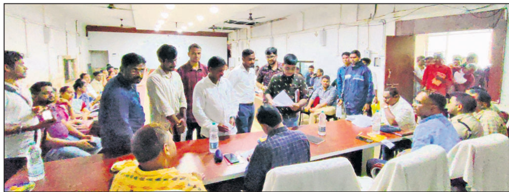
ଲୋକଙ୍କ ଅଭିଯୋଗ ଶୁଣାଣି କରୁଛନ୍ତି ଅଧିକାରୀ।