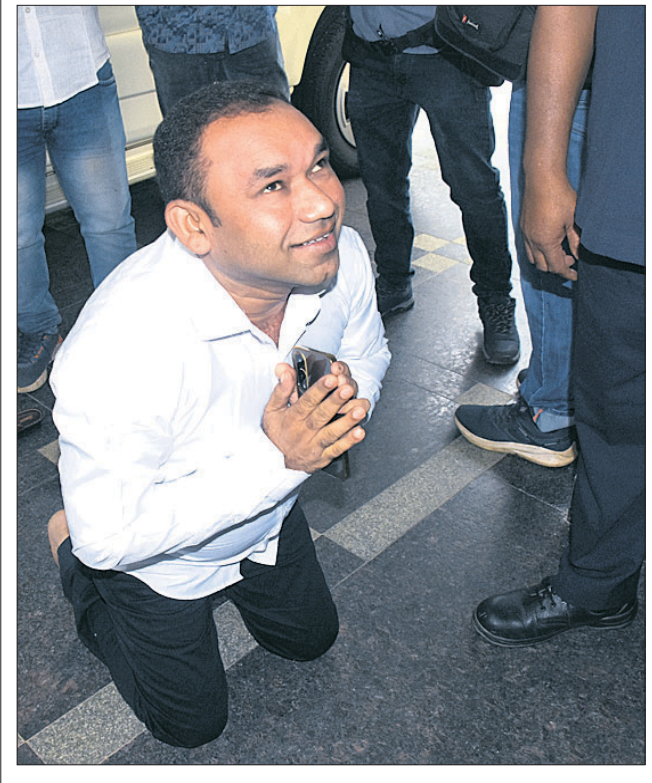
ରାଜ୍ୟରେ ଭାଜପା ସରକାରର ପ୍ରଥମ ବିଜେଡି ଅଧିବେଶନରେ ସୋମବାର ବିଧାନସଭା ଭିତରକୁ ପ୍ରବେଶ କରିବାବେଳେ ୨ ବିଧାୟକଙ୍କ ଅଜିନିଦ ପ୍ରଦର୍ଶନ।