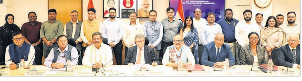
ଅଟଳ ଇନୋଭେଶନ ମିଶନ ଏବଂ ଓପିଓ ମଧ୍ୟରେ ଏଲ୍‌ଏଆଇ ସ୍ୱାକ୍ଷରିତ ହୋଇଛି। ଏଥିରେ ଉପସ୍ଥିତ କେନ୍ଦ୍ର ଶିକ୍ଷାମନ୍ତ୍ରୀ ଧର୍ମେନ୍ଦ୍ର ପ୍ରଧାନ ଓ ଅନ୍ୟମାନେ।

ଏବଂ ଓପିଓ ମଧ୍ୟରେ ଏହି ଭାଗାଂଗି ଅନ୍ୟ ରାଷ୍ଟ୍ର ପାଇଁ ପଥପ୍ରଦର୍ଶକ ସାଜିବ। ଶିକ୍ଷା କ୍ଷେତ୍ରରେ ଭାରତର ଅଜିନିଦ ମଡେଲଗୁଡ଼ିକ ବିକାଶଶୀଳ ରାଷ୍ଟ୍ରରେ ଉପଯୋଗ ହେବ। ବିଦ୍ୟାଳୟ ସ୍ତରରୁ ଆଇପିଆର୍ (ଇଣ୍ଡୋଲୋଜିଆଲ୍ ପ୍ରପର୍ଟି ରାଇଟ୍) ବିଷୟରେ କୁଶଳମଣା ଏବଂ ସଚେତନତା ବ୍ୟାପକ ହେବ। ବିଶ୍ୱରେ ଇନୋଭେଶନ କ୍ଷେତ୍ରରେ ଥିବା ସମ୍ଭାବନାର ଅବିଷ୍ଣୁତା କିଛି ଘଣ୍ଟା ଏବଂ ସମାବେଶୀୟ ଆର୍ଥିକ ଅଭିବୃଦ୍ଧି ପାଇଁ ଉଭୟ ସଂସ୍ଥା କାର୍ଯ୍ୟ କରିବେ ବୋଲି ଧର୍ମେନ୍ଦ୍ର କହିଛନ୍ତି।