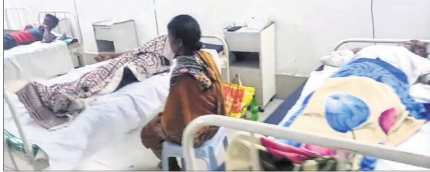
ଆକ୍ରାନ୍ତମାନେ ଚିକିତ୍ସିତ ହେଉଛନ୍ତି ।