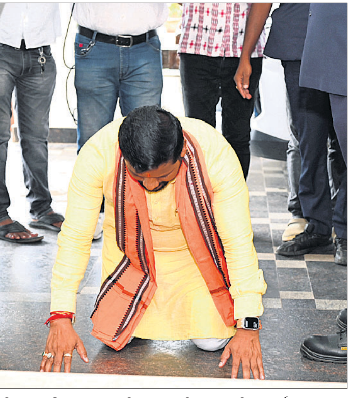
ରାଜ୍ୟରେ ଭାଜପା ସରକାରର ପ୍ରଥମ ବିଜେଡି ଅଧିବେଶନରେ ସୋମବାର ବିଧାନସଭା ଭିତରକୁ ପ୍ରବେଶ କରିବାବେଳେ ୨ ବିଧାୟକଙ୍କ ଅଜିନିଦ ପ୍ରଦର୍ଶନ।