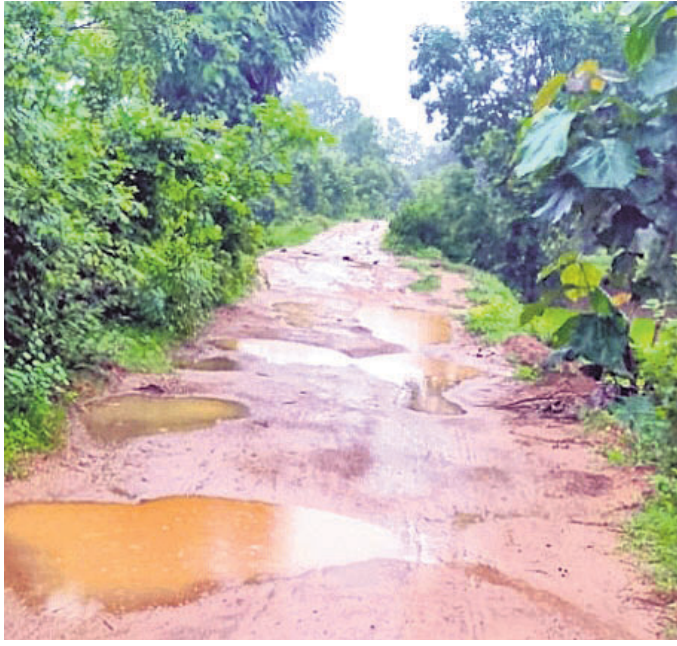
ଗାଁ ରାସ୍ତା ଶୋଚନୀୟ ହୋଇପଡିଛି।