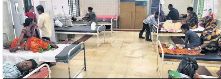
ବଡ଼ତଣା ଗୋଷ୍ଠୀ ସ୍ୱାସ୍ଥ୍ୟକେନ୍ଦ୍ରରେ ଝାଡ଼ାବାଡ଼ିରେ ଆକ୍ରାନ୍ତ ରୋଗୀଙ୍କ ଚିକିତ୍ସା ଚାଲିଛି ।

ଝାଡ଼ାବାଡ଼ି, ୨୨।୭ (ପ୍ରତାପ କୁମାର ପୁଷ୍ପ) ସ୍ୱାସ୍ଥ୍ୟକେନ୍ଦ୍ରରେ ଯୋଗାଣ ଭର୍ତ୍ତି ହୋଇଛନ୍ତି । ୩ ଜଣଙ୍କ ଅବସ୍ଥା ଅଧିକ ଗୁରୁତର ହେବାକୁ ସେମାନଙ୍କୁ କଟକ ବଡ଼ ମେଡିକାଲକୁ ସ୍ଥାନାନ୍ତର କରାଯାଇଛି । ବଡ଼ତଣା ଗୋଷ୍ଠୀ ସ୍ୱାସ୍ଥ୍ୟକେନ୍ଦ୍ରର ଏକ ଡାକ୍ତରୀ ଦଳ ପଞ୍ଚାୟତର ବିଭିନ୍ନ ଗ୍ରାମକୁ ଯାଇ ସଚେତନ କରାଇବା ସହ ଡିଫି ପାଠପଢ଼ି ସିଞ୍ଚନ କରିଛନ୍ତି । କୌଣସି ଲୋକ ଝାଡ଼ାବାଡ଼ିରେ ଆକ୍ରାନ୍ତ ହେଲେ ତୁରନ୍ତ ତାଙ୍କୁ ମେଡିକାଲ ସେବାକୁ ଆଣା ଓ ଅଜ୍ଞାନଫୁଲ କର୍ମୀମାନେ ଗାଁକୁ ବୁଲି ଲୋକଙ୍କୁ ବୁଝାଇଛନ୍ତି । ଏଥିପ୍ରତି ସ୍ୱାସ୍ଥ୍ୟ ଓ ପାନୀୟ ଜଳ ଯୋଗାଣ ବିଭାଗ ପକ୍ଷରୁ ବ୍ୟାପକ ପଦକ୍ଷେପ ନେବାକୁ ସ୍ଥାନୀୟ ଅଞ୍ଚଳବାସୀ ଦାବି କରିଛନ୍ତି । କିଛି ଦିନ ତଳେ ଏହି ରୁକ ଅନ୍ତର୍ଗତ ଝାଡ଼ାବାଡ଼ିରେ ଆକ୍ରାନ୍ତ ହୋଇ ବଡ଼ତଣା ଗୋଷ୍ଠୀ