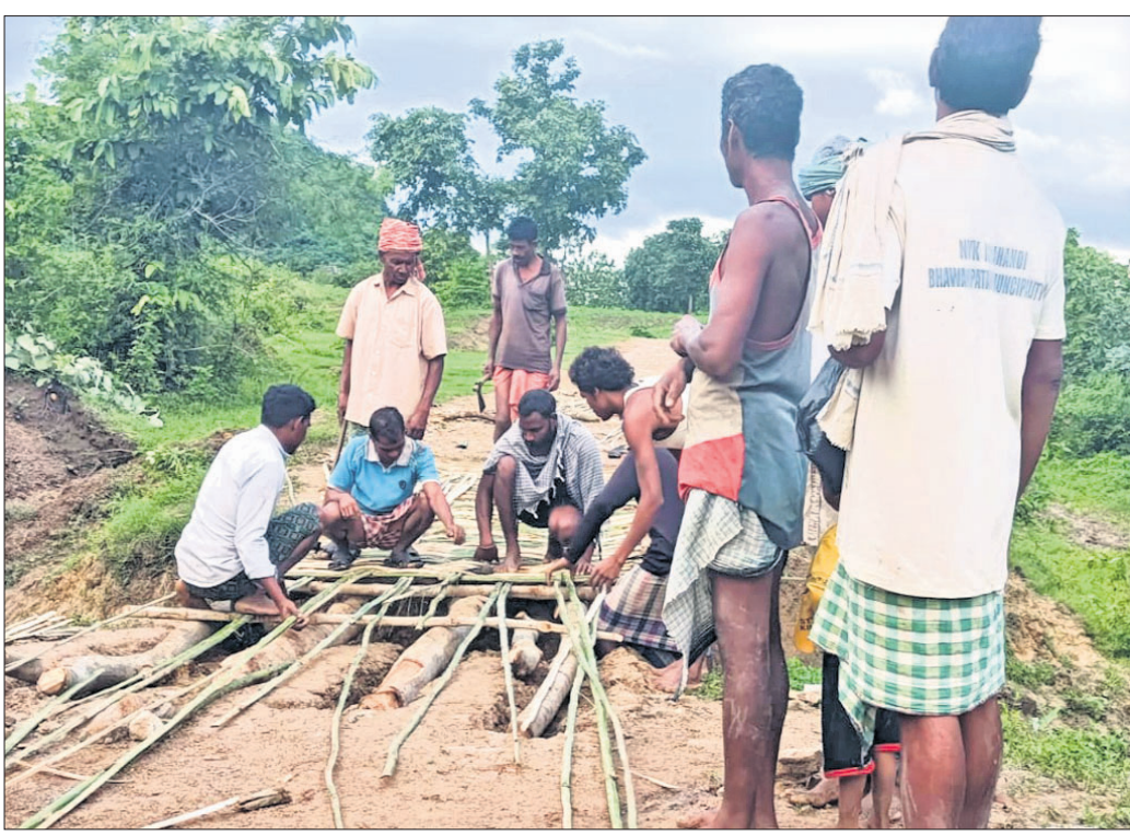
କାଠ ଓ ବାଉଁଶ ସାହାଯ୍ୟରେ ପୋଲ ତିଆରି କରୁଛନ୍ତି ଗ୍ରାମବାସୀ।

କଳାହାଣ୍ଡି ଜିଲ୍ଲା ଭବାନୀପାଟଣା ସଦର ବ୍ଲକ୍ ରିଷିଗାଁ ପଞ୍ଚାୟତ ଅନ୍ତର୍ଗତ ବିକ୍ରାପଡା ଗ୍ରାମ ପୁଞ୍ଜାପଲାଇ ସଂଯୋଗ କରୁଥିବା ରାସ୍ତା ବର୍ଷା ଯୋଗୁ ଶୋଚନୀୟ ହୋଇପଡିଛି।