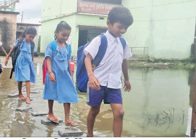
ସ୍କୁଲ ପରିସରରେ ପାଣି ଜମିପଡିଛି।