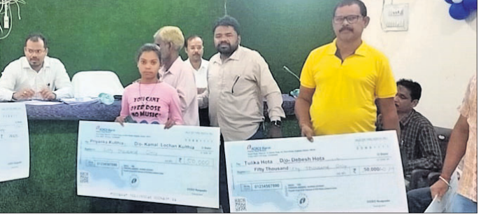
ଶିବିରରେ ଉଚ୍ଚଶିକ୍ଷା ପାଇଁ ସହାୟତା ପାଇଥିବା ଛାତ୍ରଛାତ୍ରୀ।