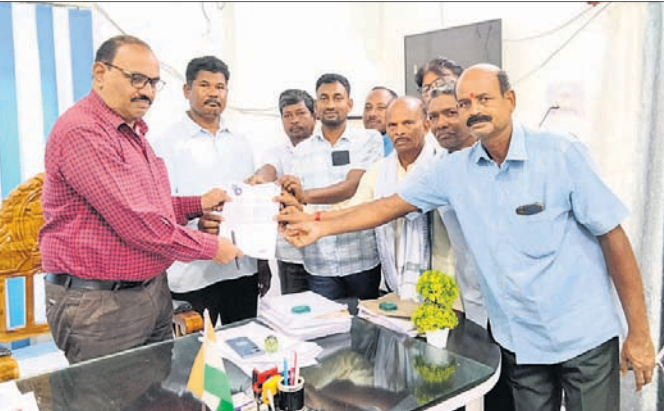
ତହସିଲଦାରଙ୍କୁ ଦାବିପତ୍ର ପ୍ରଦାନ କରାଯାଇଛି।