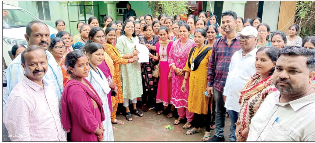
ସଂଘ ପକ୍ଷରୁ ମେୟରଙ୍କୁ ଦାବି ପତ୍ର ପ୍ରଦାନ କରାଯାଇଛି।

ବ୍ରହ୍ମପୁର ମହାନଗର ନିଗମ ସ୍ୱଚ୍ଛ ସାଥୀ ଓ ସୁପରଭାଇଜର ସଂଘ ପକ୍ଷରୁ ରୁଧିବାର ୧୦୦୮୩ ଦାବି ନେଇ ବିଭିନ୍ନ ସମସ୍ୟା ସଂଘମିତ୍ରା ଦଳେଇ ଓ ତେପୁଟି କମିଶନ ଆଶୀର୍ବାଦ ପରିତାଙ୍କୁ ଦାବିପତ୍ର ପ୍ରଦାନ କରାଯାଇଛି।