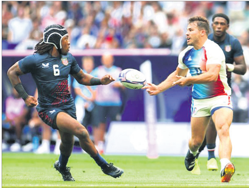
ଫ୍ରାନ୍ସ ଓ ଆମେରିକା ମଧ୍ୟରେ ଅନୁଷ୍ଠିତ ରଗ୍‌ବୀ ସେଲେନ୍ ଏ ସାଲ୍‌ସ୍ ମ୍ୟାଚ୍ ଏକ ଉଜ୍ଜ୍ୱଳ ପୂର୍ଣ୍ଣ।