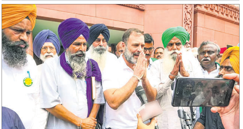
ଲୋକ ସଭାରେ ବିରୋଧୀ ଦଳ ନେତା ରାହୁଲ ଗାନ୍ଧୀ କୃଷକ ନେତାମାନଙ୍କୁ ପାର୍ଲିମେଣ୍ଟ ପରିସରରେ ଭେଟିବା ପରେ ଗଣମାଧ୍ୟମକୁ ସମ୍ବୋଧିତ କରୁଛନ୍ତି।