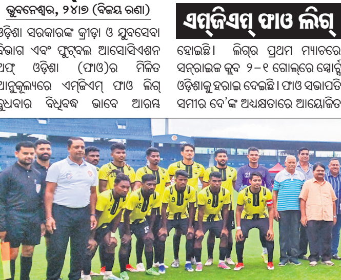
ଏମ୍‌ଜିଏମ୍ ଫାଓ ଲିଗ୍ ଉଦ୍‌ଘାଟନୀ ମ୍ୟାଚ୍ ଅବସରରେ ଉଭୟ ଦଳର ଖେଳାଳିଙ୍କ ସହ ଅଭିଭାବ ଓ କର୍ମଚାରୀ।

ଭୁବନେଶ୍ୱର, ୨୫(ବିଜୟ ରଣା) ଓଡ଼ିଶା ସରକାରଙ୍କ କ୍ରୀଡ଼ା ଓ ଯୁବସେବା ବିଭାଗ ଏବଂ ପୁରୁବଲ ଆୟୋଗର ସହଯୋଗରେ ଏହି ଓଡ଼ିଶା (ଫା)ଓର ମିଳିତ ଆନୁକୂଲ୍ୟରେ ଏମ୍‌ଜିଏମ୍ ଫାଓ ଲିଗ୍ ରୁଷ୍‌ବାର ବିଧିବଦ୍ଧ ଭାବେ ଆରମ୍ଭ ହୋଇଛି। ଲିଗ୍‌ର ପ୍ରଥମ ମ୍ୟାଚ୍‌ରେ ସନ୍‌ରାଈଜ କୁର ୨-୧ ଗୋଲରେ ସୋର୍ଡ୍ ଓଡ଼ିଶାକୁ ହରାଇ ଦେଇଛି। ଫାଓ ସଭାପତି ସମୀର ବେ'କ୍ ଅଧ୍ୟକ୍ଷତାରେ ଆୟୋଜିତ