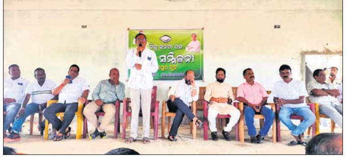
କର୍ମୀ ସମିଳନୀରେ ବିଜେଡି ନେତୃତ୍ୱ

ଅନ୍ୟାୟ ବିରୋଧରେ ଲଢ଼ିବା ବୋଲି ବିଜେଡିର ମତପ୍ରକାଶ ପାଇଥିଲା। ମୋହନ ସରକାର ରାଜ୍ୟକୁ ଚଳାଇ ପାରିବେ ନାହିଁ।