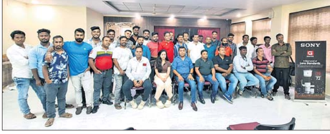
ଶିବିରରେ ଉପସ୍ଥିତ ଫଟୋଗ୍ରାଫରମାନେ।

ଭଞ୍ଜନଗର,୨୪୧୭(ବାବୁଲୀ ପ୍ରଧାନ): ନିଜ କୃତିକୁ ଜୀବିତ ରଖିବା ପାଇଁ ନୂତନ ଉତ୍ତୋଳନ ଫଟୋ ଉତ୍ତୋଳନ ପାଇଁ ବିଭିନ୍ନ ମଡେଲର କ୍ୟାମେରା ବ୍ୟବହାର କରାଯାଇଛି।