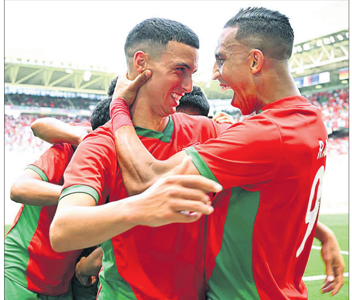
ଗୋଲ୍ ଖେଳିବା ପରେ ଉଜ୍ଜ୍ୱଳ ମରାକୋ ଖେଳାଳି।

ପ୍ୟାରିସ୍ ଅଲିମ୍ପିକ୍ସର ଜାତୀୟ ମହାକୁମ୍ଭର ଉଦ୍‌ଘାଟନା ସମାରୋହକୁ ଆଉ ଦିନେ ବାକି ରହିଥିବା ବେଳେ ରୁଷ୍‌ବାର ଠାରୁ ଆରମ୍ଭ ହୋଇଛି ପୁରୁବଲ ଓ ରଗ୍‌ବୀ ଚୁନାମେଣ୍ଟ। ପୁରୁବଲରେ ପ୍ରଥମ ଦିନ ଶ୍ରୀଲଙ୍କା ଆର୍ଜେଣ୍ଟିନା ଓ ସ୍ପେନ୍ ନିଜର ଅଭିଯାନ ଆରମ୍ଭ କରିଥିଲେ। ଆର୍ଜେଣ୍ଟିନା ଏହାର ମ୍ୟାଚ୍ ମରାକୋ ବିପକ୍ଷରେ ଖେଳିଥିବା ବେଳେ ସ୍ପେନ୍ ଏହାର ମ୍ୟାଚ୍ ଉଜବେକିସ୍ତାନ ବିପକ୍ଷରେ ଖେଳିଥିଲା। ଗୁରୁ ଦିନେ ଗ୍ଲାନ ପାଇଥିବା ସ୍ପେନ୍ ପ୍ରଥମ ମ୍ୟାଚ୍‌ରେ ଉଜବେକିସ୍ତାନକୁ ୨-୧ ଗୋଲରେ ପରାସ୍ତ କରିଛି। ଅନ୍ୟ ପକ୍ଷରେ ଅଲିମ୍ପିକ୍ସର ପ୍ରଥମ ବିପର୍ଯ୍ୟୟ ଘଟାଇଛି ମରାକୋ। ବିଶ୍ୱ ଚାମ୍ପିୟନ ତଥା କୋପା ଆମେରିକା ଚାମ୍ପିୟନ ଆର୍ଜେଣ୍ଟିନା ସହ ମ୍ୟାଚ୍ ୨-୨ରେ ଟ୍ରା ରଖି ପଏଣ୍ଟ ବାଣ୍ଟି ନିର୍ବାହୀ।