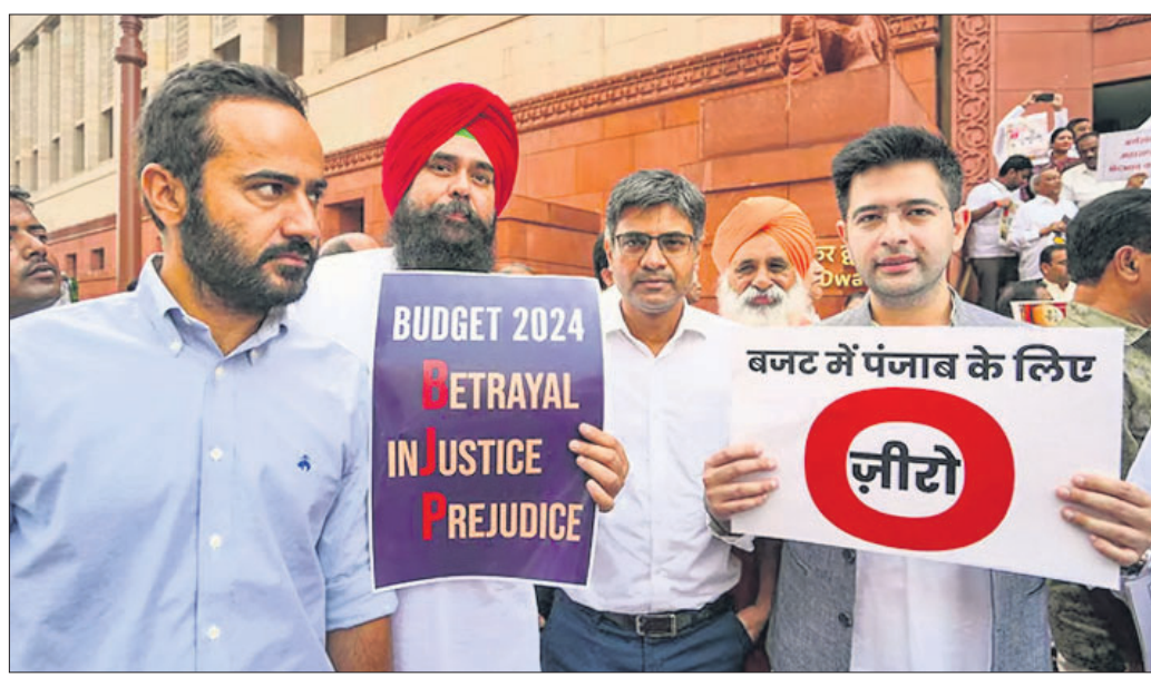
ଆର୍ ଏମ୍ପି ରାଘବ ଚଡ଼ା ଏବଂ ଅନ୍ୟ ବିରୋଧୀ ଏମ୍ପିମାନେ ପାର୍ଲିମେଣ୍ଟ ପରିସରରେ ବିରୋଧୀ ପ୍ରଦର୍ଶନ କରୁଛନ୍ତି।

ପ୍ରଶ୍ନପତ୍ର ପ୍ରସ୍ତୁତ କଲେ ୧୦ ବର୍ଷ ଜେଲ, ୧ କୋଟି ଜରିମାନା ବିହାର ବିଧାନସଭାରେ ବିଧେୟକ ପାରିତ