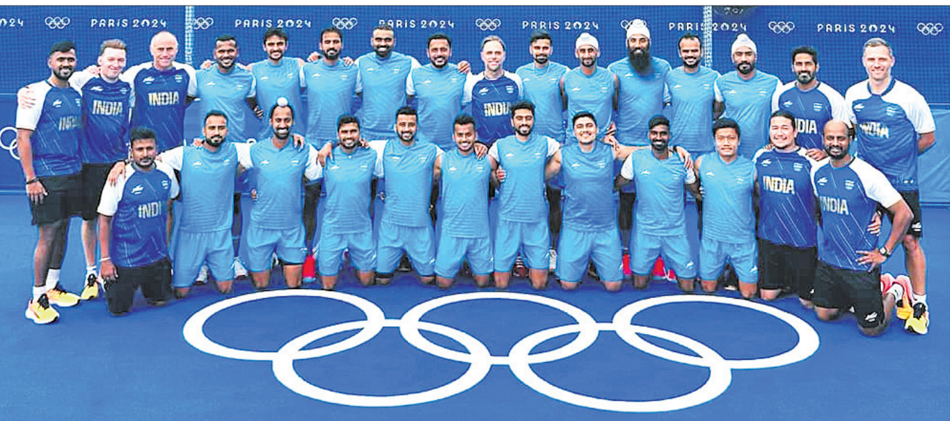
ଅଲିମ୍ପିକ୍ ଗେମ୍ସ ଭିଲେଜ୍‌ରେ ପହଞ୍ଚିବା ପରେ ଭାରତୀୟ ହକି ଦଳର ଖେଳାଳି ଓ କର୍ମଚାରୀ।

ଅଯୋଷିତ ହିରୋ ପିଅର୍ ଡି କୋର୍ବେଟିନ୍ ପ୍ୟାରିସ୍, ୨୫(ପି.ଟି.) ପ୍ୟାରିସ୍ ଅଲିମ୍ପିକ୍ସର ଜାତୀୟ ମହାକୁମ୍ଭ ଆରମ୍ଭ ହୋଇଯାଇଛି। ତେବେ ମତର୍ନ ତେ ଅଲିମ୍ପିକ୍ସର ବାସ୍ତବ ପୃଷ୍ଠା ପିଅର୍ ଡି କୋର୍ବେଟିନ୍ ଇତିହାସ ପୃଷ୍ଠାରେ କେଉଁ ଅନ୍ତର୍ଦ୍ଧାନ ହୋଇ ଯାଇଛି। ବ୍ରିଟିଶ ଇତିହାସକାର ତଥା ଶିକ୍ଷାବିତ ଥୋମାସ୍ ଆନୋଲ୍‌ଲୁକ୍ ହାରା ଅନୁପ୍ରାଣିତ ହୋଇ ପିଅର୍ ଡି କୋର୍ବେଟିନ୍ ଫ୍ରାନ୍ସରେ ଜାତୀୟ ପ୍ରଚଳନ କରିଥିଲେ। ଏହାଦ୍ୱାରା ଶିକ୍ଷାରେ ବିପ୍ଳବ ଆଣିବା ଡାକ୍ତର ଏକମାତ୍ର ଲକ୍ଷ୍ୟ ରହିଥିଲା। ୧୮୯୪ରେ ମତର୍ନ ଅଲିମ୍ପିକ୍ସ ପ୍ରତିଷ୍ଠା ହେବା ପରଠାରୁ କୋର୍ବେଟିନ୍‌ଙ୍କ ସ୍ୱପ୍ନ ବାସ୍ତବ ରୂପ ନେବା ଆରମ୍ଭ କରିଥିଲା। ବିଭିନ୍ନ ଅନ୍ତର୍ଜାତୀୟ ଜାତୀୟ ସଂଗଠନ ସହ ଆଲୋଚନା କରି ସେ ମତର୍ନ ଅଲିମ୍ପିକ୍ସ ଆରମ୍ଭ କରିଥିବା ବେଳେ ତାଙ୍କ ସ୍ୱପ୍ନ ସାକାର ହୋଇଥିଲା। ଅନ୍ତର୍ଜାତୀୟ ଅଲିମ୍ପିକ୍ସ କମିଟି(ଆଇଓସି)ର ସହ ପ୍ରତିଷ୍ଠାତା ଭାବରେ ସେ ରହିଥିଲେ। ୧୮୯୬ରେ