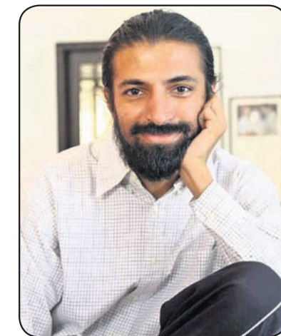
ବର୍ତ୍ତମାନ ହିନ୍ଦୀସାଧ୍ୟ ପ୍ରଡ଼୍ୟୁସର 'କଲକି ୨୮୯୮ ଏଡି'ର ନିର୍ଦ୍ଦେଶକ ନାବା ଅଶ୍ୱିନ ନିଜ ସମ୍ପର୍କରେ ଯାହା କହନ୍ତି....

ବର୍ତ୍ତମାନ ବକ୍ସ ଅଫିସରେ ପ୍ରବେଶ କରିଥିବା ହିନ୍ଦୀ ସିନେମା 'କଲକି ୨୮୯୮ ଏଡି'ର ନିର୍ଦ୍ଦେଶନା ଦେଇଛନ୍ତି ନାବା ଅଶ୍ୱିନ। ୧୯୮୬ ଏପ୍ରିଲ ୨୩ରେ ସେ ତେଲଙ୍ଗାନାରେ ଜନ୍ମ ଗ୍ରହଣ କରିଥିଲେ। ୨୦୧୫ରେ ସେ ଚଳଚ୍ଚିତ୍ର ଭୁମିଆରେ ପ୍ରବେଶ କରିଥିଲେ। ଜଣେ ସହନିର୍ଦ୍ଦେଶକ ଭାବରେ ତାଙ୍କୁ ପ୍ରଥମେ ସୁଯୋଗ ମିଳିଥିଲା। ତାଙ୍କ ନିର୍ଦ୍ଦେଶନାରେ ନିର୍ମିତ ପ୍ରଥମ ଚଳଚ୍ଚିତ୍ର ଫିଲ୍ମ ଥିଲା 'ଯାଭାତେ ସୁପ୍ରମଣ୍ୟମ'। ଏହି ଫିଲ୍ମ ପାଇଁ ତାଙ୍କୁ ଶ୍ରେଷ୍ଠ ନିର୍ଦ୍ଦେଶକ ଭାବରେ ସମ୍ମାନଜନକ ନୟା ପୁରସ୍କାର ମିଳିଥିଲା। ନାବାଙ୍କର ନୂଆ ନୂଆ କଥା ଶିଖିବାକୁ ଚେଷ୍ଟା କରିଥାଏ।