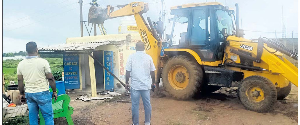
ଜବରଦଖଲ ହୋଇଥିବା ଘରକୁ କେସିବି ମେଶିନରେ ଭଙ୍ଗାଯାଉଛି।

ପାଣିକୋଇଲି, ୨୪୧୭(ବିକାଶ ମଲ୍ଲିକ): ଏକ ଘର ନିର୍ମାଣ କରିଥିଲେ। ଫଳରେ ରାସ୍ତା ପାର୍ଶ୍ୱ ଜମି ଥିବା ଅନିଚ୍ଛୁକ୍ତ ଦାମ୍ ତାଙ୍କ ଜାଗାକୁ ରାସ୍ତା ନ ପାଇବାରୁ ରାଜପଥ ଅଧିକାରୀ ନିକଟରେ ଅଭିଯୋଗ କରିଥିଲେ।