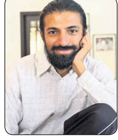
ବର୍ତ୍ତମାନ ହିନ୍ଦୀସାଧୁ ହୋଇଥିବା 'କଲକି ୨୮୯୮ ଏଡି'ର ନିର୍ଦ୍ଦେଶକ ନାଦ୍ ଅଶ୍ୱିନ ନିଜ ସମ୍ପର୍କରେ ଯାହା କହିଛନ୍ତି....

ବର୍ତ୍ତମାନ ବକ୍ସ ଅଫିସରେ ପ୍ରବେଶ କରିଥିବା ହିନ୍ଦୀ ସିନେମା 'କଲକି ୨୮୯୮ ଏଡି'ର ନିର୍ଦ୍ଦେଶନା ଦେଇଛନ୍ତି ଆଗଧାଡିର ଅନ୍ୟତମ ନିର୍ଦ୍ଦେଶକ ନାଦ୍ ଅଶ୍ୱିନ । ୧୯୮୬ ଏପ୍ରିଲ ୨୩ରେ ସେ ତେଲଙ୍ଗାନାରେ ଜନ୍ମ ଗ୍ରହଣ କରିଥିଲେ । ୨୦୧୫ରେ ସେ ଚଳଚ୍ଚିତ୍ର ଭୁମିଆରେ ପ୍ରବେଶ କରିଥିଲେ । ଜଣେ ସହନିର୍ଦ୍ଦେଶକ ଭାବରେ ତାଙ୍କୁ ପ୍ରଥମେ ସୁଯୋଗ ମିଳିଥିଲା । ତାଙ୍କ ନିର୍ଦ୍ଦେଶନାରେ ନିର୍ମିତ ପ୍ରଥମ ଚଳଚ୍ଚିତ୍ର ଫିଲ୍ମ ଥିଲା 'ଭାଗତେ ସୁବ୍ରମଣ୍ୟମ' । ଏହି ଫିଲ୍ମ ପାଇଁ ତାଙ୍କୁ ଶ୍ରେଷ୍ଠ ନିର୍ଦ୍ଦେଶକ ଭାବରେ ସମ୍ମାନଜନକ ନୟା ପୁରସ୍କାର ମିଳିଥିଲା । ନାଗରକର ନୂଆ ନୂଆ କଥା ଶିଖିବାକୁ ଚେଷ୍ଟା କରିଥାଏ ।