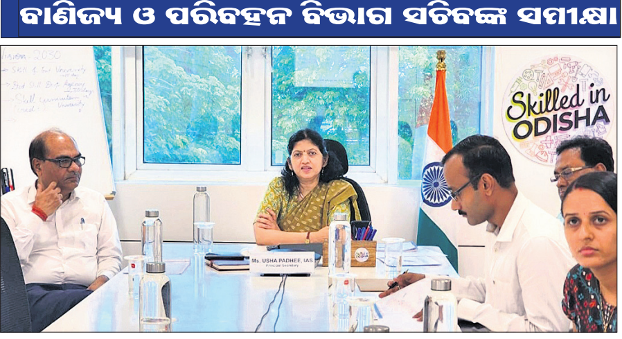
ବାଣିଜ୍ୟ ଓ ପରିବହନ ବିଭାଗ ସଚିବଙ୍କ ସମୀକ୍ଷା

ଭୁବନେଶ୍ୱର, ୨୪ତା (ବାବୁଲ୍ୟା ପ୍ରଧାନ): କେନ୍ଦ୍ର ସରକାରଙ୍କ ଚଳିତ ସମ୍ମିଳନୀରେ ବ୍ରହ୍ମପୁର-ରେଡ଼ାଖୋଲ ରେଳ ଲାଇନ ପାଇଁ କିଛି ଅନୁଦାନ ମିଳିବ ବୋଲି ଆଶା କରାଯାଇଥିଲା।