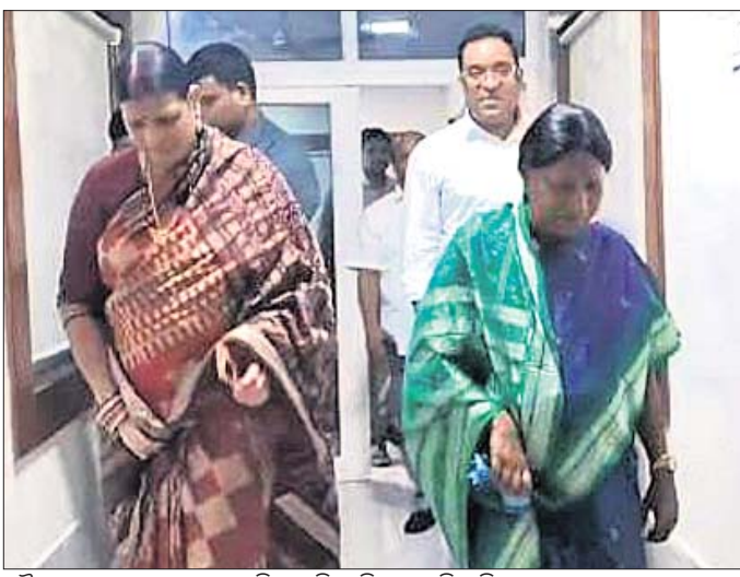
ବୈଠକରେ ଯୋଗଦେବାକୁ ଆସିଥିବା ବିଜେଡିର ଦଳ ବିଧାୟକ।

ଯାଜପୁର ସରକାରୀ ପାଠାଗାର ପୂର୍ବ ପ୍ରକଳିତ ସମୟରେ ଖୋଲିବା ପାଇଁ ଦାବି ହୋଇଛି। ଏନେଇ ରୁଧିରା କେତେକ ଶ୍ରମିକ ଯୁକ୍ତ ଗୋଷ୍ଠି ଗଠନ କରିଛନ୍ତି। ପୂର୍ବରୁ ସରକାରୀ ପାଠାଗାର ପୂର୍ବ ପ୍ରକଳିତ ସମୟରେ ଖୋଲିବା ପାଇଁ ଦାବି ହୋଇଛି। ଏନେଇ ରୁଧିରା କେତେକ ଶ୍ରମିକ ଯୁକ୍ତ ଗୋଷ୍ଠି ଗଠନ କରିଛନ୍ତି।