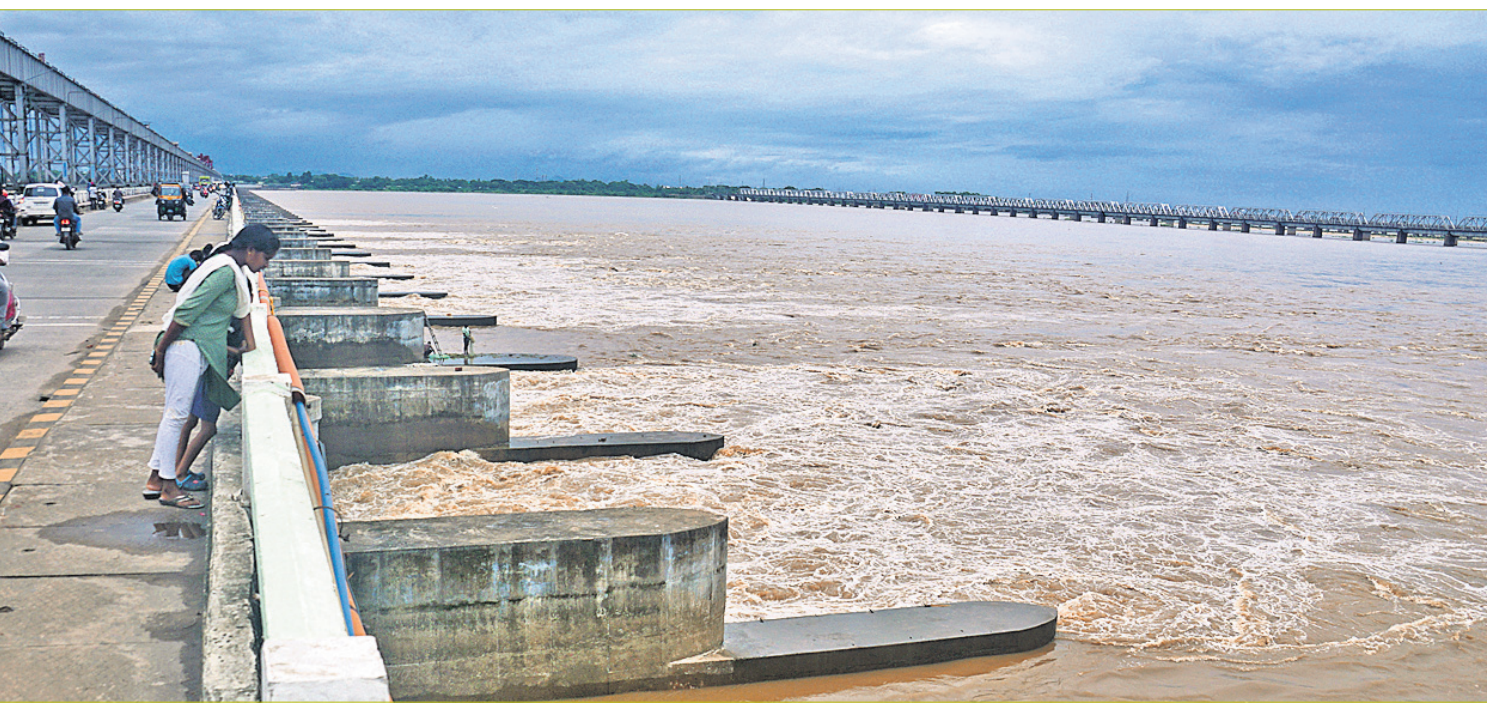
କଟକ କୋଗ୍ରା ଆଦିକଟ ଦେଇ ମହାନଦୀରେ ବୁଧବାର ପ୍ରବାହିତ ଚଳିତବର୍ଷର ପ୍ରଥମ ବନ୍ୟାଜଳ।

ସ୍କୁଲ ଡ୍ରପ୍‌ଆଉଟ୍: ଶୀର୍ଷରେ ଓଡ଼ିଶା ଭୁବନେଶ୍ୱର, ୨୪ତା (ଅସମାପିତା ସାହୁ) ଦେଶରେ ପ୍ରଥମ ବୋଲି ଅର୍ଥନୈତିକ ସର୍ଭେ ରିପୋର୍ଟ ୨୦୨୩-୨୪ରୁ ଜଣାପଡ଼ିଛି। ରିପୋର୍ଟ ଅନୁସାରେ, ଶିକ୍ଷାବର୍ଷ ୨୦୧୪-୧୫ରୁ ୨୦୨୧-୨୨ ମଧ୍ୟରେ ମାଧ୍ୟମିକ ସ୍ତରରେ ପାଠ ଛାଡ଼ିବା ହାରରେ ୨୨.୨ ପ୍ରତିଶତ ହ୍ରାସ ପାଇଥିଲେ ମଧ୍ୟ ଓଡ଼ିଶା ଏସଆର୍ଏସ-୪