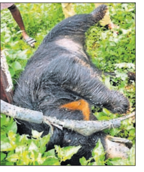
ମାଲକାନଗିରି, ୨୪।୭ (ବୃହସ୍ପତି ଉପରାଜ୍ୟ)

ବିଦ୍ୟୁତ୍ ଗ୍ରାହ୍ୟତାରେ ସଂକଳ୍ପରେ ଆସି ଗୋଟିଏ ମାଲକାନଗିରି ମନ୍ତ୍ର ହୋଇଛି। ମାଲକାନଗିରି ଜିଲ୍ଲା ସରକାରଙ୍କ ଅନୁମତି ଓ ଶିକ୍ଷାପାଇଁ ପଞ୍ଚାୟତ ଧରଣରେ ୧୭ ନମ୍ବର ଗାଁ ଆକାଶପାଟ୍ରି କେନ୍ଦ୍ର ନିକଟରେ ଥିବା ଏକ ହାଲ-ଭୋଲ୍ଟେଜ୍ ଗ୍ରାହ୍ୟତା ସଂକଳ୍ପରେ ଆସି ମୁଖ୍ୟ ଘରିଥିବା ଜଣାପଡ଼ିଛି। ବିଦ୍ୟୁତ୍ ବିଭାଗ ଏହି ଗ୍ରାହ୍ୟତା କଡ଼ରେ ସୁରକ୍ଷା ପାଇଁ ଗାର ଲାଗି ଦେଇଥିବା ବେଳେ ଭଲ୍ଟେଜ୍ ଖାଦ୍ୟ ଅବଶେଷରେ ବାଡ଼ ତେଲ ଗ୍ରାହ୍ୟତା ପାଖକୁ ଆସି ମୁଖ୍ୟ ଘରିଥିବା ଅନୁମତି କରାଯାଇଛି। ଖବର ପାଇ ବନ ବିଭାଗର କର୍ମଚାରୀମାନେ ଭଲ୍ଟେଜ୍ ମୁଦ୍ର ଦେଇ ବ୍ୟବହାର ପାଇଁ ପଠାଇଥିବା ବେଳେ ବ୍ୟବହାର ପରେ ମୁଖ୍ୟ ପ୍ରକୃତ କାରଣ ଜଣା ପଡ଼ିବ ବୋଲି ବନ କର୍ମଚାରୀ କହିଛନ୍ତି।