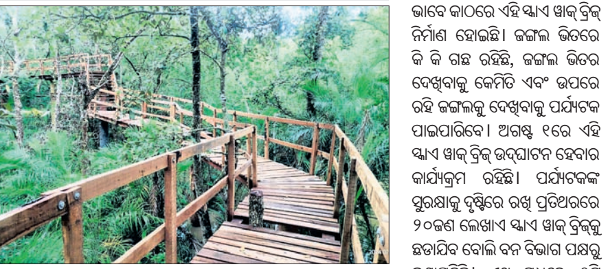
ଭିତରକନିକା ଜାତୀୟ ଉଦ୍ୟାନ ମଧ୍ୟରେ ନିର୍ମାଣ ହୋଇଥିବା ଝାଏ ଝାଏ ଡ୍ରିଜ୍।

ଏହାର ପ୍ରାକୃତିକ ବିଭବ ମଧ୍ୟରେ ହରିଶ ଭିତ ଜମାଉଥିବା ପତ୍ତୀ ଯାଏ ଲାଗିଛି। ଜଙ୍ଗଲ ଭିତରେ ବୁଲୁଥିବା ଗରୁଡ଼ ଥିବାବେଳେ ୬୦୦ ମିଟର ଲମ୍ବ ଯାଏ ନିର୍ମାଣ ହୋଇଛି ଏହି ଡ୍ରିଜ୍। ଝାଏ ଝାଏ ଡ୍ରିଜ୍ ମଝିରେ ମଝିରେ ଉଠାଣି ଗତାଣି ଭଳି ନିର୍ମାଣ ହୋଇଛି। କେଉଁଠି ଝାଏ ଝାଏ ଡ୍ରିଜ୍ ନିର୍ମାଣ କରାଯାଇଛି। ମ୍ୟାନଗ୍ରୋଭ ମେଟା ନର୍ସରୀ ନିକଟରୁ ଆରମ୍ଭ ହୋଇଥିବା ଏହି ଝାଏ ଝାଏ ଡ୍ରିଜ୍ ଅଧିକ ସଂଖ୍ୟାରେ ହରିଶ ଭିତ ଜମାଉଥିବା ପତ୍ତୀ ଯାଏ ଲାଗିଛି। ଜଙ୍ଗଲ ଭିତରେ ବୁଲୁଥିବା ଗରୁଡ଼ ଥିବାବେଳେ ୬୦୦ ମିଟର ଲମ୍ବ ଯାଏ ନିର୍ମାଣ ହୋଇଛି ଏହି ଡ୍ରିଜ୍। ଝାଏ ଝାଏ ଡ୍ରିଜ୍ ମଝିରେ ମଝିରେ ଉଠାଣି ଗତାଣି ଭଳି ନିର୍ମାଣ ହୋଇଛି। କେଉଁଠି ଝାଏ ଝାଏ ଡ୍ରିଜ୍ ନିର୍ମାଣ କରାଯାଇଛି। ମ୍ୟାନଗ୍ରୋଭ ମେଟା ନର୍ସରୀ ନିକଟରୁ ଆରମ୍ଭ ହୋଇଥିବା ଏହି ଝାଏ ଝାଏ ଡ୍ରିଜ୍ ଅଧିକ ସଂଖ୍ୟାରେ