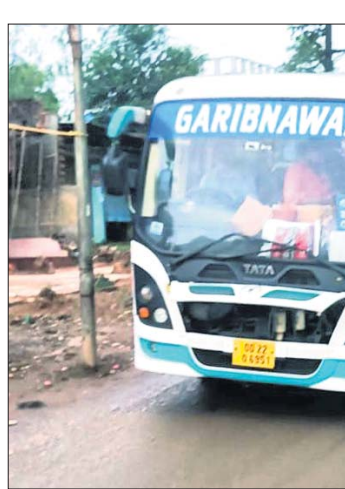
ଯାଜପୁର ଗଞ୍ଜନ, ୨୪।୭ (ପ୍ରସନ୍ନା ପ୍ରିୟଦର୍ଶିନୀ ମହାନ୍ତି):

ଯାଜପୁର ଗଞ୍ଜନ, ୨୪।୭ (ପ୍ରସନ୍ନା ପ୍ରିୟଦର୍ଶିନୀ ମହାନ୍ତି): ଯାଜପୁର ଗଞ୍ଜନ, ୨୪।୭ (ପ୍ରସନ୍ନା ପ୍ରିୟଦର୍ଶିନୀ ମହାନ୍ତି):