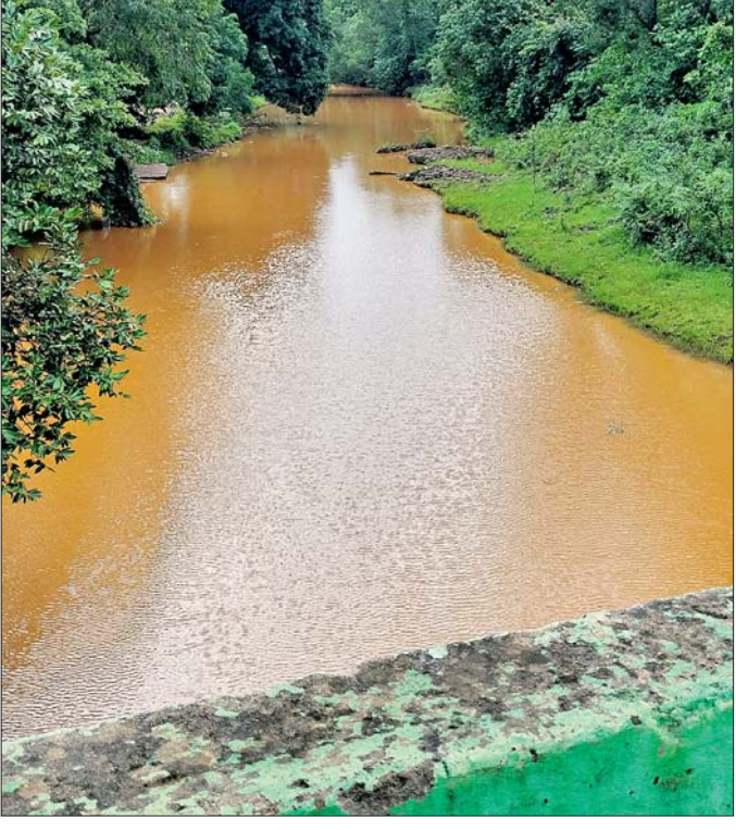
ଡମଶାଳା ନାଳରେ ପ୍ରବାହିତ ହେଉଥିବା ପ୍ରଦୂଷିତ ଜଳ।

ଗତ ସପ୍ତାହେ ହେବ ଲାଗି ରହିଥିବା ଜ୍ରାମାଗତ ବର୍ଷା ଯୋଗୁ ଖଣି ଅଞ୍ଚଳ ନିକେଲ ମିଶ୍ରିତ ବିଷାକ୍ତ ପାଣିରେ କବଳିତ ହୋଇଛି। ଏଥିଯୋଗୁ ଡମଶାଳା ନାଳ ପୋତି ହୋଇ ପାଣି ପ୍ରଦୂଷିତ ହେବା ସହ ଭୂତଳ ଜଳ ମଧ୍ୟ ବହୁମାତ୍ରାରେ ପ୍ରଭାବିତ ହେବାର ଆଶଙ୍କା ସୃଷ୍ଟି କରିଛି।