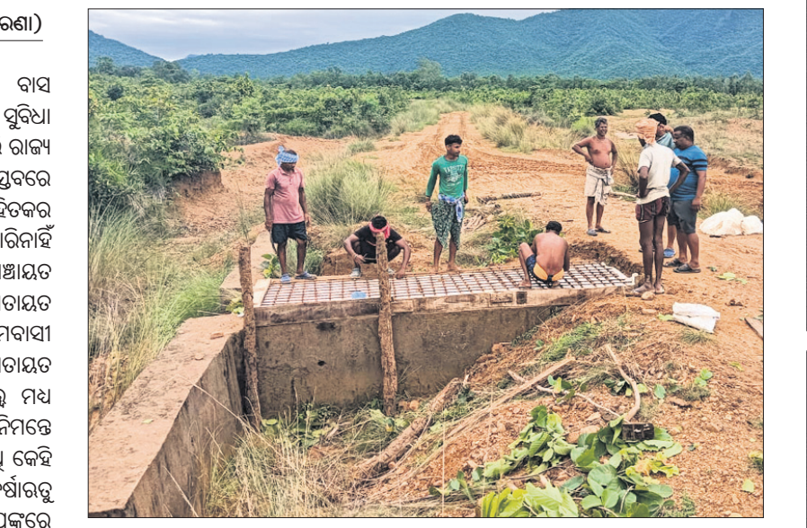
ଗ୍ରାମବାସୀଙ୍କ ଦ୍ୱାରା ନିର୍ମାଣ ହୋଇଥିବା ରାସ୍ତା।

ଆଦିବାସୀ ଅଧିକାର ଅଞ୍ଚଳରେ ବାସ କରୁଥିବା ଲୋକମାନଙ୍କୁ ସମସ୍ତ ସୁବିଧା ସୁଯୋଗ ଯୋଗାଇ ଦିଆଯାଇଛି ବୋଲି ରାଜ୍ୟ ସରକାର