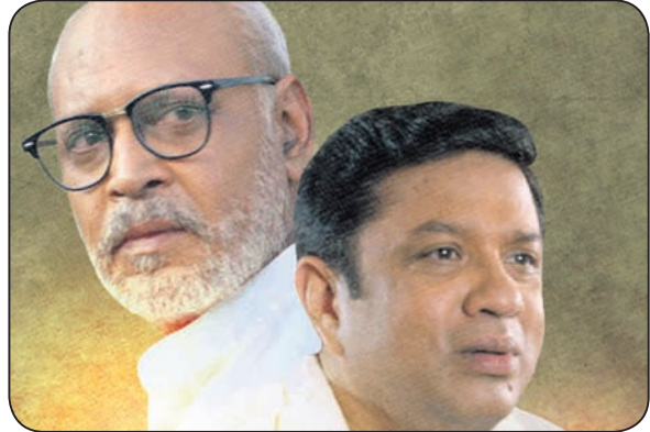
ଓଡ଼ିଆ ଫିଲ୍ମ 'ସମୀକ୍ଷା'ର ଏକ ଦୃଶ୍ୟ