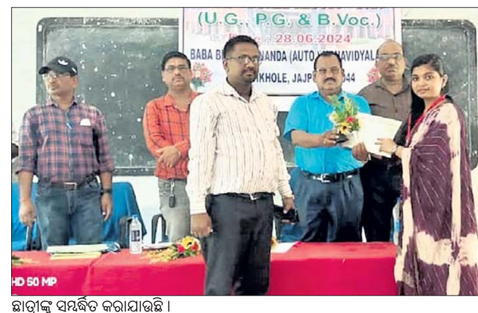
ଛାତ୍ରୀଙ୍କୁ ସମ୍ବର୍ଦ୍ଧିତ କରାଯାଇଛି।