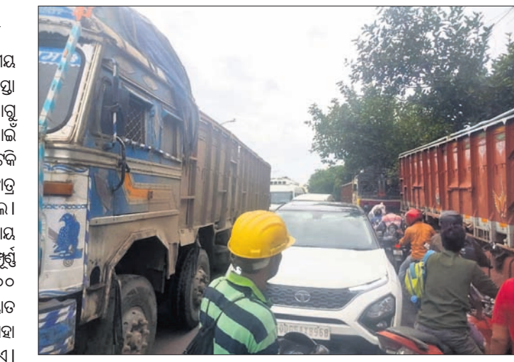
କୂଳସି ସମ୍ଭବ ପିଲାଙ୍କ ପାଇଁ ଚିନ୍ତନ ରହିଛି। ଟେକ୍ନିକାଲ୍ ଅଫିସର, ପିପିଏଲ୍, ଉପକୂଳ, ଏଏଏଏଏଏ, ପାଠାପାଠ ପୌର୍ବ

ବର୍ଷିତ କୋର୍ସ୍—ପାଠାପାଠ ୫୩ ନଂ. ଜାତୀୟ ରାଜପଥରେ ବୋଲି ଅଠରବାଙ୍କି ରାସ୍ତା ରୁଧିବାର ସମ୍ଭାବନା ଭାବି ଯୋଗୁଁ କାର୍ଯ୍ୟ ହୋଇନାହିଁ। ଯେଉଁଥିପାଇଁ ସ୍କୁଲ ପିଲାଙ୍କ ଗାଡ଼ି ପ୍ରାୟ ୨ ଘଣ୍ଟା ଅଟକି ରହିଥିଲା। ଏପରିକି କେତେକ ଛାତ୍ରାଛାତ୍ରୀ ଗାଡ଼ିକୁ ଚାଲିଚାଲି ସ୍କୁଲ ଯାଇଥିଲେ।