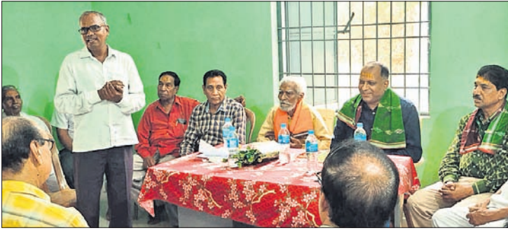
ପ୍ରଥମ ଥର ପାଇଁ ରାଜ୍ୟସ୍ତରୀୟ ସମ୍ମାନନିତ୍ତ ଉତ୍ତମ ତୈଳିକ ବୈଶ୍ୟ ମହାସଭା ଆୟୋଜନରେ ପ୍ରୟାସ ଆରମ୍ଭ କରାଯାଇଛି।