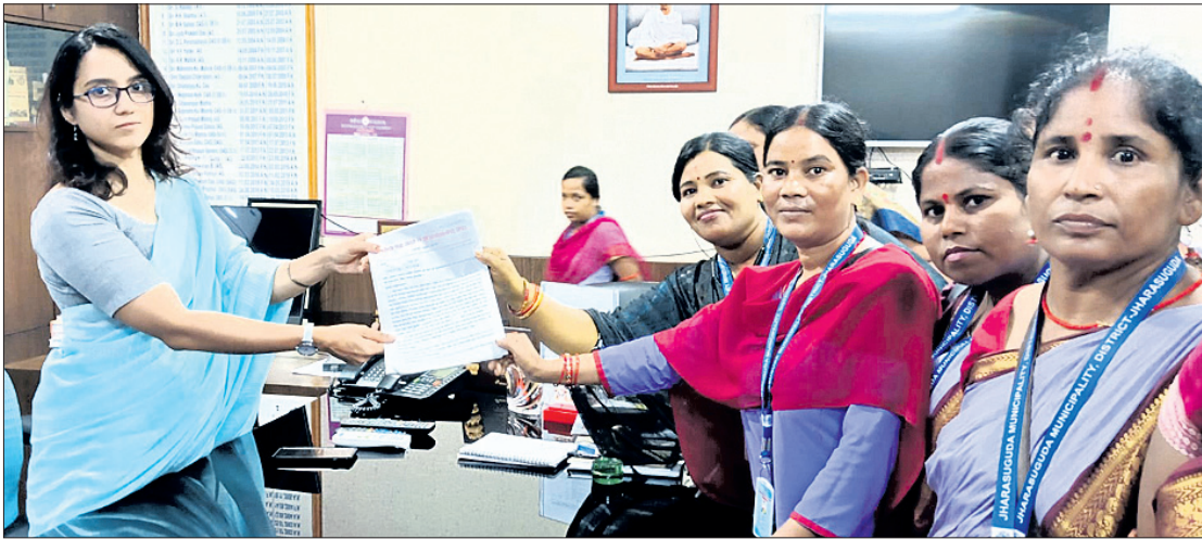
ସ୍ପଷ୍ଟ ସାଥୀ ଓ ସୁପରଭାଇଜର ସଂଘ ଜିଲ୍ଲାପାଳଙ୍କୁ ଦାରିଦ୍ର୍ୟ ପ୍ରଦାନ କରୁଛନ୍ତି। ସହିତ କାମ କରିବା ପରେ ବି ସରକାରୀ ଅବହେଳା ଶିକାର ହୋଇ ଆସୁଛନ୍ତି।