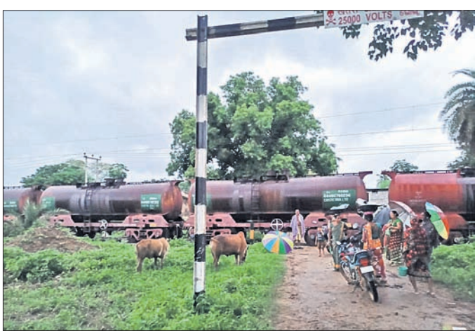
ଏକ କ୍ରମିରେ ଟ୍ରେନ୍ ଛିଡ଼ାହୋଇଥିବାରୁ ଲୋକେ ଅଟକି ରହିଛନ୍ତି।

କଳାହାଣ୍ଡି ଜିଲ୍ଲା ଲାଞ୍ଜିଗଡ଼ ବ୍ଲକ୍ ୧୦ ଗୋଟି ଗ୍ରାମର ଲୋକଙ୍କ ଯିବାଆସିବା ରାସ୍ତାରେ ଅସୁବିଧା ସୃଷ୍ଟି କରିବାକୁ ଲାଞ୍ଜିଗଡ଼ ବେଦାନ୍ତ କାରଖାନାକୁ ସଂଯୋଗ କରୁଥିବା ରେଳଲାଭନରେ ମାଲବାହୀ ଟ୍ରେନ୍ ଘଣ୍ଟା ଘଣ୍ଟା ଅଟକି ରହିଥିବାରୁ ଗ୍ରାମବାସୀ, ଯୁକ୍ତ ଛାତ୍ରଛାତ୍ରୀ ଓ ପଥରୀ ଅସୁବିଧାର ସମ୍ମୁଖୀନ ହେଉଛନ୍ତି।