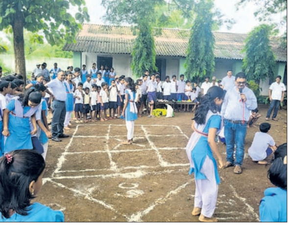
ଦିନ କ୍ରମେ ହୋଇଯାଉଥିବା ବିଭିନ୍ନ ପ୍ରକାର ଖେଳଗୁଡ଼ିକୁ ଉପକ୍ରମିତ କରିବା ଉଦ୍ଦେଶ୍ୟରେ ଛାତ୍ରଛାତ୍ରୀମାନଙ୍କୁ ପ୍ରୋତ୍ସାହିତ କରିବା ଉଦ୍ଦେଶ୍ୟରେ ଛାତ୍ରଛାତ୍ରୀମାନଙ୍କୁ ନେଇ ବିଭିନ୍ନ କ୍ରୀଡାସମ୍ପର୍କୀୟ ପ୍ରତିଯୋଗିତା ଆୟୋଜିତ ହୋଇଥିଲା।