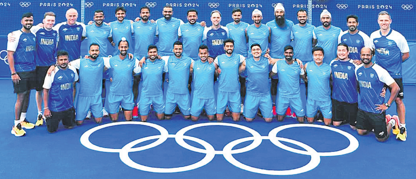
ଅଲିମ୍ପିକ୍ ଗେମ୍ସ ଭିଲେଜ୍‌ରେ ପହଞ୍ଚିବା ପରେ ଭାରତୀୟ ହକି ଦଳର ଖେଳାଳି ଓ କର୍ମଚାରୀ।