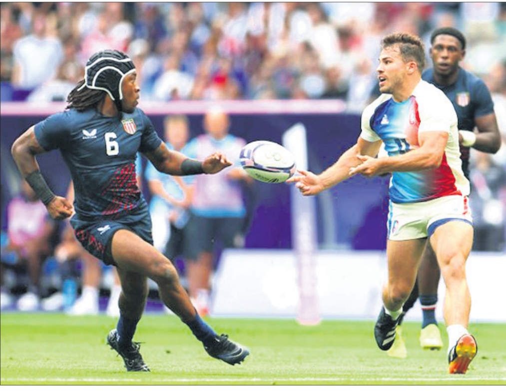
ଫ୍ରାନ୍ସ ଓ ଆମେରିକା ମଧ୍ୟରେ ଅନୁଷ୍ଠିତ ରଗ୍‌ବୀ ସେଲେନ୍ ଏ ସାଇଡ୍ ମ୍ୟାଚ୍ ଏକ ଉତ୍ତମପୂର୍ଣ୍ଣ ମୁହୂର୍ତ୍ତ।