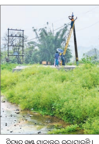
ବିଦ୍ୟୁତ୍ ଖୁଣ୍ଟ ସ୍ଥାନାନ୍ତର କରାଯାଉଛି।

କଳାହାଣ୍ଡି ଜିଲ୍ଲା ଥୁଆମୁଳ ରାମପୁର ବ୍ଲକ୍ ସରକାର ୨୯୯ ଖର୍ଚ୍ଚ ତାଲାବନ୍ଧ ପଡ଼ାକୁ ବିଦ୍ୟୁତ୍ ସଂଯୋଗ କରୁଥିବା ଗ୍ରାହକମାନଙ୍କ ପାଇଁ ଖୁଣ୍ଟ ବିପଦସଙ୍କୁଳ ଅବସ୍ଥାରେ ପୋଖରୀ ସ୍ଥଳରେ ରହିଥିଲା। ଏନେଇ ପଡ଼ାବାସୀ ବିଭାଗୀୟ ଅଧିକାରୀଙ୍କୁ ଅଭିଯୋଗ କରିଥିଲେ।