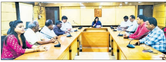
ବୈଠକରେ ବିଭିନ୍ନ ବିଭାଗୀୟ ଅଧିକାରୀ ଓ ଅନୁଷ୍ଠାନର କର୍ମକର୍ମୀ

କଳାହାଣ୍ଡି ଜିଲ୍ଲା ସରକାର ମହକୁମା ଭବାନୀପାଟଣାରେ ୭୮ତମ ସ୍ୱାଧୀନତା ଦିବସ ପାଳନ ପାଇଁ ବୃତ୍ତାନ୍ତ ଗ୍ରହଣ କରିଛନ୍ତି। ଏହି କେନ୍ଦ୍ରୀୟ ବିପର୍ଯ୍ୟୟ ଅବସ୍ଥାରେ ପଡ଼ିଥିବାରୁ ସମସ୍ତ କାର୍ଯ୍ୟ ପୂରାତନ କେନ୍ଦ୍ରରେ ପରିଚାଳିତ ହେଉଥିଲା।