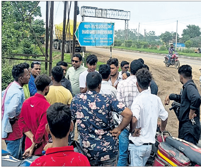
ରାସ୍ତା ରୋକିବା କରି ପ୍ରତିବାଦ କରୁଥିବା ସିଂହାବୋଗା ଗ୍ରାମବାସୀ ।

ଝାରସୁଗୁଡ଼ା ସହରରୁ ବେହେରାପାଲିକୁ ସିଂହାବୋଗା ଗ୍ରାମକୁ ସଂଯୋଗ କରୁଥିବା ରାସ୍ତା ଶୋଚନୀୟ ଅବସ୍ଥାରେ ପଡ଼ି ରହିଛି।