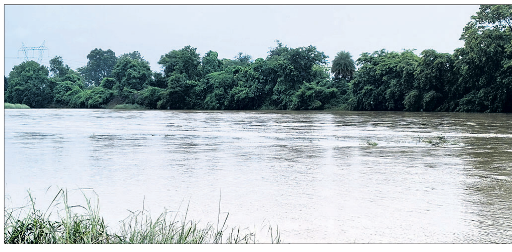
ବର୍ଷା ଯୋଗୁ ହାତୀ ନଦୀ ଫୁଲୁଥିବା ଦୃଶ୍ୟ।

ଲାଞ୍ଜିଗଡ଼ ବ୍ଲକ୍ ଖମନଖୁଣ୍ଟି, ଚନ୍ଦନପୁର, ଗୋପାଳପୁର, ଯୁଡ଼ାବନ୍ଧ, ବିଲାଟିପଦର, ପତ୍ରାପଡ଼ା, କଙ୍ଗାଳଦେବୀ, ପ୍ରାୟ ୨୦ କି.ମି. ଦୂର ରେଳ ଲାଇନ ସଂଯୋଗ ହୋଇଛି। ଏହି ଲାଇନ ଦେଇ ବେଦାନ୍ତ କାରଖାନାକୁ ଦୈନିକ ମାଲ ପରିବହନ ପାଇଁ ମାଲବାହୀ ରେଳ ଗ୍ରାମବାସୀ ବିଶେଷ ଅସୁବିଧାର ସମ୍ମୁଖୀନ ହେଉଛନ୍ତି।