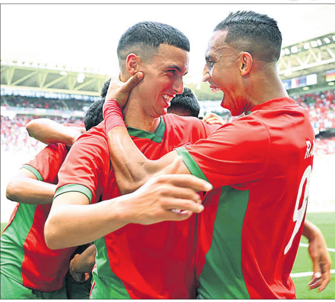
ଗୋଲ୍ ଖୋର କରିବା ପରେ ଉଇଟେକିୟାନ ଖେଳାଳି।

ପ୍ୟାରିସ୍ ଅଲିମ୍ପିକ୍ସର ଜାତୀୟ ମହାକୁମ୍ଭର ଉଦ୍‌ଘାଟନୀ ସମାରୋହକୁ ଆଉ ଦିନେ ବାଜି ରହିଥିବା ବେଳେ ରୁଧିର ଠାକୁ ଆରମ୍ଭ ହୋଇଛି ପୁରୁବଲ ଓ ରଗ୍‌ବୀ ଚୁନାମେଣ୍ଟ। ପୁରୁବଲରେ ପ୍ରଥମ ଦିନ ଶକ୍ତିଶାଳୀ ଆର୍ଜେଣ୍ଟିନା ଓ ସ୍ପେନ୍ ନିଜର ଅଭିଯାନ ଆରମ୍ଭ କରିଥିଲେ। ଆର୍ଜେଣ୍ଟିନା ଏହାର ମ୍ୟାଚ୍ ମରାଚୋ ବିପକ୍ଷରେ ଖେଳିଥିବା ବେଳେ ସ୍ପେନ୍ ଏହାର ମ୍ୟାଚ୍ ଉଇଟେକିୟାନ ବିପକ୍ଷରେ ଖେଳିଥିଲା। ଗୁରୁ ଦିନେ ଗ୍ଲାନ ପାଇଥିବା ସ୍ପେନ୍ ପ୍ରଥମ ମ୍ୟାଚ୍‌ରେ ଉଇଟେକିୟାନକୁ ୨-୧ ଗୋଲରେ ପରାସ୍ତ କରିଛି। ଅନ୍ୟ ପକ୍ଷରେ ଅଲିମ୍ପିକ୍ସର ପ୍ରଥମ ବିପର୍ଯ୍ୟୟ ଘଟାଇଛି ମରାଚୋ। ବିଶ୍ୱ ଚାମ୍ପିୟନ ତଥା କୋପା ଆମେରିକା ଚାମ୍ପିୟନ ଆର୍ଜେଣ୍ଟିନା ସହ ମ୍ୟାଚ୍ ୨-୨ରେ ଡ୍ର ରଖି ପଏଣ୍ଟ ବାଣ୍ଟିଛି ମରାଚୋ।