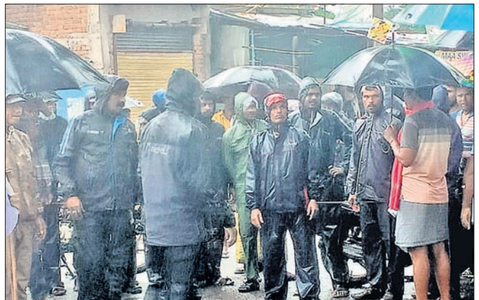
ଗ୍ରାମବାସୀ ଓ ପରିବାର ଲୋକେ ରାସ୍ତା ଅବରୋଧ କରିଛନ୍ତି।

ଜିଲ୍ଲା ମୁଖ୍ୟ ଚିକିତ୍ସାଳୟରୁ ଗାଁକୁ ବାଲକେର ଯାଉଥିବା ସମୟରେ କୁରୁମପୁରି ଗାଁ ଛକ ନିକଟରେ ଏକ ଗ୍ରନ୍ଥ ଧକ୍କା ହୋଇଥିଲା।