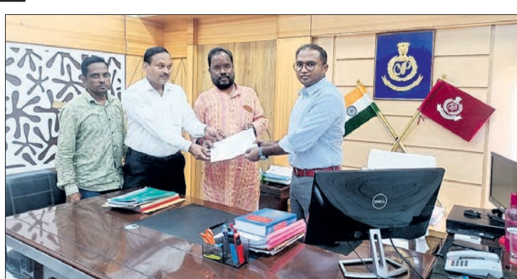
ଭାଜପା ପ୍ରତିନିଧି ମଣ୍ଡଳ ଏସ୍ପିଙ୍କୁ ଦାବିପତ୍ର ଦେଉଛନ୍ତି।