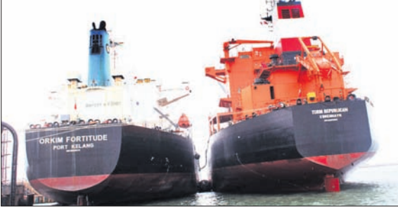
ଜାହାଜ ଏମ୍ବି ଓରକିମକୁ ଏମ୍ବି ଚରମକୁ ଡିଜେଲ୍ ସ୍ଥାନାନ୍ତର କରାଯାଇଛି।

ପାରାଦୀପ ବନ୍ଦର ପୋଡ଼ାଶୁଣ୍ଠ ମଧ୍ୟରେ ରୁଧିରା ପ୍ରଥମ କରି ଜାହାଜରୁ ଜାହାଜ ଡିଜେଲ୍ ସ୍ଥାନାନ୍ତର କରାଯାଇଛି। ଏପରି ବୈଷୟିକ ବିପଦପୂର୍ଣ୍ଣ ଓ ଦାୟିତ୍ୱ ସମ୍ପନ୍ନ କାମକୁ ସଫଳତାର ସହ କରାଯାଇଥିବାରୁ ବନ୍ଦର ପ୍ରଶାସନ ପକ୍ଷରୁ ସ୍ୱତନ୍ତ୍ର ଉତ୍ସବ ପାଳନ କରାଯାଇଛି। ବନ୍ଦରର ଉତ୍ତର-ପୂର୍ବ ପର୍ଯ୍ୟାୟରେ ଥିବା ଡିଜେଲ୍ ବର୍ଷରେ ଏପରି ଉଚ୍ଚ ସମତା ସମ୍ପନ୍ନ ଡିଜେଲ୍ ତେଲ ଅପସାରଣ କରାଯାଇଥିଲା। ଡିଜେଲ୍ ବୋଡ଼େଇ ଜାହାଜ ଏମ୍ବି ଓରକିମକୁ ଖାଲି ଜାହାଜ ଏମ୍ବି ଚରମକୁ