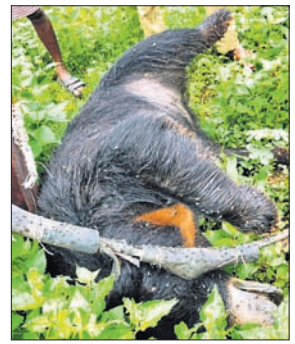
ମାଲକାନଗିରି, ୨୪୧୭ (ବୃହସ୍ପତି ଯାତ୍ରା)

ବିଦ୍ୟୁତ୍ ଗ୍ରାହକମାନଙ୍କ ସଂଖ୍ୟାରେ ଆସି ଗୋଟିଏ ମାଲକାନଗିରି ମଧ୍ୟ ହୋଇଛି। ମାଲକାନଗିରି ଜିଲ୍ଲା ସରକାରଙ୍କୁ ଅନୁମତି କିଛି ଶିଖାପାଇଁ ପଞ୍ଚାୟତ ଧର୍ମର ୧୭ ନମ୍ବର ଗାଁ ଅଧିକାରୀଙ୍କୁ କେନ୍ଦ୍ର ନିକଟରେ ଥିବା ଏକ ହାଲ-ଭୋଲଟେଜ୍ ଗ୍ରାହକମାନଙ୍କ ସଂଖ୍ୟାରେ ଆସି ମଧ୍ୟ ଘଟିଥିବା ଜଣାପଡିଛି। ବିଦ୍ୟୁତ୍ ବିଭାଗ ଏହି ଗ୍ରାହକମାନଙ୍କ କତର ସୁରକ୍ଷା ପାଇଁ ଗାଁ ଲାଲି ଦେଇଥିବା ବେଳେ ଭଲ୍ଲୁଟି ଖାଦ୍ୟ ଅନୁଷ୍ଠାନରେ ବାଡ଼ ତେଲ ଗ୍ରାହକମାନଙ୍କ ପାଇଁ ମଧ୍ୟ ଘଟିଥିବା ଅନୁମାନ କରାଯାଉଛି। ଖବର ପାଇ ବନ ବିଭାଗର କର୍ମଚାରୀମାନେ ଭଲ୍ଲୁଟି ମୃତଦେହ ବ୍ୟବଚ୍ଛେଦ ପାଇଁ ପଠାଇଥିବା ବେଳେ ବ୍ୟବଚ୍ଛେଦ ପରେ ମୃତ୍ୟୁର ପ୍ରକୃତ କାରଣ ଜଣା ପଡିବ ବୋଲି ବନ କର୍ମଚାରୀ କହିଛନ୍ତି।