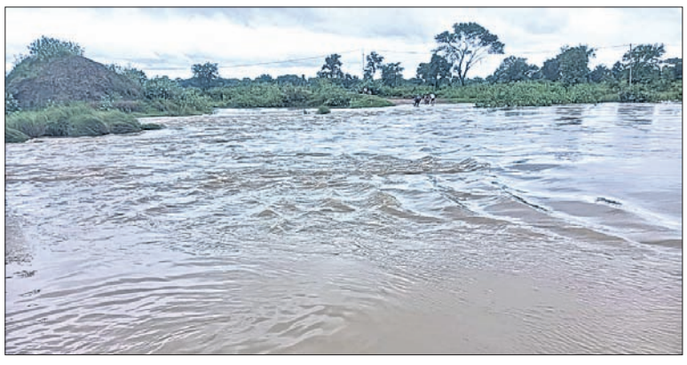
ଗୁଜିଯୋର ପୋଲ ଉପରେ ବନପାଳୀ ପ୍ରବାହିତ ହେଉଛି।

ଅମରପାଳି, ୨୫ତା(ପାଗାୟନ ସାହୁ) ସୁବର୍ଣ୍ଣପୁର ଜିଲ୍ଲା ବାରମହାରାଜପୁର ବ୍ଲକରେ ଲାଗି ରହିଛି ଲଗାଶ ବର୍ଷା... ଗୁଜିଯୋର ପୋଲ ଉପରେ ୫ଟି ବନପାଳୀ ଉପରେ ପ୍ରତିଦିନ ସନ୍ତାନ ପ୍ରାପ୍ତି ହୋଇଥିଲା।