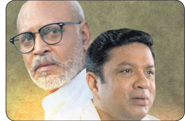
ଓଡ଼ିଆ ଫିଲ୍ମ 'ସମୀକ୍ଷା'ର ଏକ ଦୃଶ୍ୟ