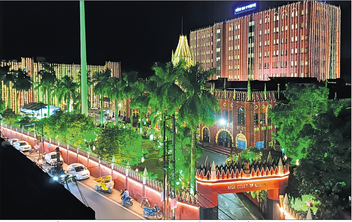
ଶୁକ୍ରବାର ଓଡ଼ିଶା ହାଇକୋର୍ଟର ୨୬ତମ ପ୍ରତିଷ୍ଠା ଦିବସ ପାଳନ କରାଯିବ । ଏହାର ଅବ୍ୟବହୃତ ପୂର୍ବରୁ ଗୁରୁବାର ହାଇକୋର୍ଟ ବିଲ୍ଡିଂକୁ ଆଲୋକମାଳାରେ ସଜିତ କରାଯାଇଛି ।