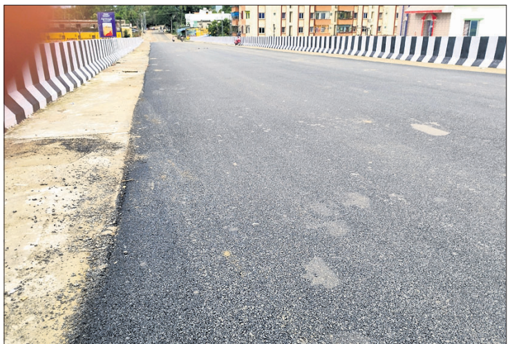
ଝୋର୍ଲା ୫୭ନଂ.କାରୀୟ ରାଜପଥ ଅତିକ୍ରମ କରିଥିବା ନୟାଗଡ଼ ଖଣ୍ଡପଡ଼ା ରାସ୍ତାର ଓଭର ବ୍ରିଜ୍ ନିର୍ମାଣ କରାଯାଇଥିଲା। ତେବେ