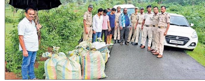
ମୋହନା, ୨୫୬ (ମନୁ ମିଶ୍ର):

ଗଜପତି ଜିଲ୍ଲା ମୋହନା ଥାନା ଅନ୍ତର୍ଗତ ବାଘପାଟଣା ପଞ୍ଚାୟତର ଶିଳ୍ପିପଦର ଗାଁ ନିକଟରୁ ୪ କ୍ୱିଣ୍ଟାଲ ଗଞ୍ଜେଇ ସହ ଏକ କାର ଓ ବାଇକ ଜବତ କରିଥିବା ବେଳେ ୪ଜଣକୁ ଗିରଫ କରିଛି ମୋହନା ପୋଲିସ।