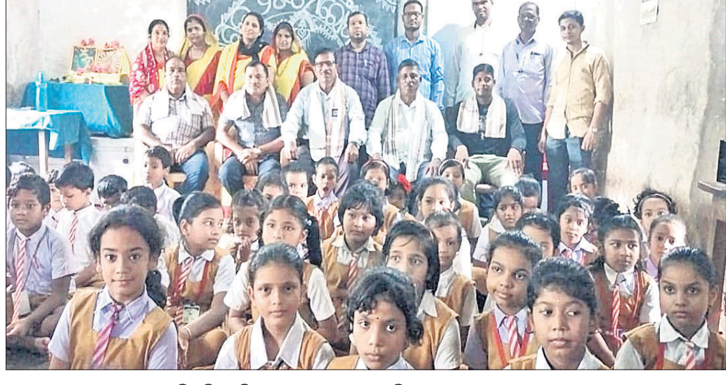
କାର୍ତ୍ତିକ ବିଜୟ ଦିବସ ପାଳନ ଅବସରରେ ଅତିଥିଙ୍କ ଗହଣରେ ଛାତ୍ରାଛାତ୍ରୀମାନେ।