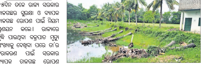
ପୋଖରୀ ହୁଡ଼ାକୁ କଟାଯାଇଥିବା ତାଳ ଗଛ।

୧୫ଟି ଡାକଗଛକୁ ମୂଳକୁ କାଟି ଦିଆଯାଇଛି। ତାଳ ସହ ଗଛଗୁଡ଼ିକ ପୋଖରୀ ମଧ୍ୟରେ ପଡ଼ିଛି। ମାତ୍ର ୧୦୦ ଫୁଟ ମଧ୍ୟରେ ପୋଖରୀ ହୁଡ଼ାରେ ଥିବା ବହୁଦିନର ପୁରୁଣା ଡାକଗଛ ଏକା ସାଙ୍ଗରେ କାଟି ଦିଆଯିବା ଘଟଣା ଉଦ୍‌ବେଗ ସୃଷ୍ଟି କରିଛି। ସେହି ସ୍ଥାନରେ ରହୁଥିବା ତାଳ ବନ୍ଧ କଟାଯାଇପାରିବ ନାହିଁ। ଗଛ ନଡିଆ ଗଛରେ ନଡିଆ ଫଳୁ ନ ଥିଲା। ନଡିଆ ଗଛ ପାଖରେ ଏହି ଡାକଗଛ ଥିଲା। ନଡିଆ ଗଛ ପାଇଁ ଡାକଗଛକୁ କଟି ଦିଆଯାଇଛି। ରାଜ୍ୟରେ ବକ୍ରପାତ ମୃତ୍ୟୁ ସଂଖ୍ୟା ବଢ଼ିବା ପରେ ଏହାକୁ ରୋକିବାକୁ ଡାକଗଛ କାଟିବା ଉପରେ ସରକାର କଟକଣା କରି କରୁଥିଲେ। ନିଜ ଜାଗାରେ ଥିବା ଡାକ ଗଛ କାଟିଲେ ମଧ୍ୟ ବନ