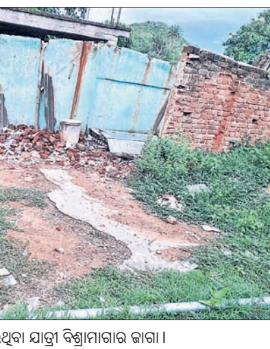
ଭାଙ୍ଗି ଦିଆଯାଇଥିବା ଯାତ୍ରୀ ବିଶ୍ୱାମୀନାର କାଗା।

ବିଭିନ୍ନ ଯାନବାହାନରେ ଯାତ୍ରା କରିବାକୁ ଅପେକ୍ଷା କରୁଥିବା ଯାତ୍ରୀ ଅଥବା ପଥଚାରୀଙ୍କ ଆଶ୍ରୟ ପାଇଁ କ୍ଷଣିକୋ-ଗଣିଆ ୪୮ ନଂ. ରାଜ୍ୟ ରାଜପଥ କନାସି(ରାଜକିଆରୀ) ଛକରେ ଏକ ଆଶ୍ରୟଖଣ୍ଡ(ରେଷ୍ଟସେଡ) ଦୀର୍ଘବର୍ଷରୁ ନିର୍ମାଣ ହୋଇଥିଲା। ଏହାକୁ ଭାଙ୍ଗି ଦିଆଯାଇଥିବା ବେଳେ ନୂଆ କରି ନିର୍ମାଣ କରାଯାଇ ନ ଥିବାରୁ ବର୍ଷ ଦିନେ ଯାତ୍ରୀ ହତସତ ହେଉଛନ୍ତି। ସୂଚନାଯୋଗ୍ୟ, ଏହି ରାଜପଥ ଦେଇ ବିଭିନ୍ନ ଅଞ୍ଚଳକୁ ଆସୁଥିବା ବସ ଯାତ୍ରୀମାନେ ରାଜକିଆରୀ ଛକରେ ଓହ୍ଲାଇ ଉକ୍ତ ଯାତ୍ରୀ ବିଶ୍ୱାମୀନାରକୁ ନେଉଥିଲେ। ପରବର୍ତ୍ତୀ ସମୟରେ ଅନ୍ୟ ଯାତ୍ରୀବାହୀ ଯାନବାହନରେ ସିଧାମୂଳା ସେତୁ ଦେଇ କଟକ ଜିଲ୍ଲାର ବିଭିନ୍ନ ଅଞ୍ଚଳକୁ ଯାତ୍ରା କରିଥାନ୍ତି। ବିଶେଷ କରି ବର୍ଷାଦିନେ ଅବା ଗ୍ରୀଷ୍ମ ପ୍ରବାହ ସମୟରେ ବିଭିନ୍ନ ଯାତ୍ରୀବାହୀ ବସକୁ ଅପେକ୍ଷା କରୁଥିବା ଯାତ୍ରୀମାନେ