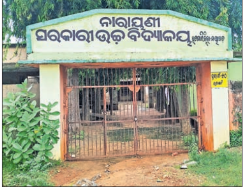
ନାରାୟଣା ସରକାରୀ ଉଚ୍ଚ ବିଦ୍ୟାଳୟର ଶ୍ରେଣୀଗୃହ ବିପଦସଙ୍କୁଳ ଥିବାରୁ ଛାତ୍ରାଛାତ୍ରୀମାନେ ଲାଇଟ୍‌ହେଭିରେ ବସି ପଢୁଛନ୍ତି।