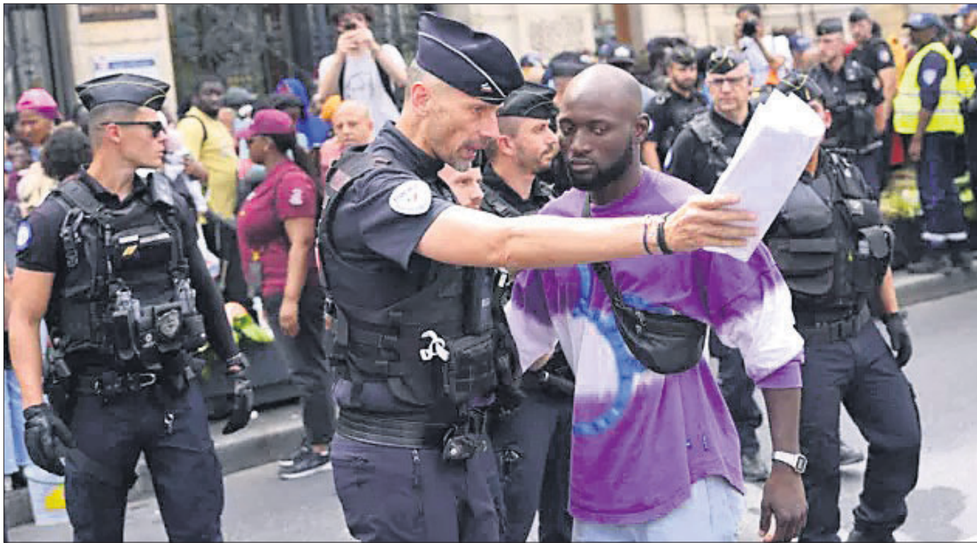
ଅଲିକ୍ସିନ୍ଦ୍ର ଭେନ୍ସୁରୁ ଆପ୍ରିକାୟ ଶରଣାର୍ଥୀମାନଙ୍କୁ ପ୍ରାନ୍ତ ପୋଲିସ୍ ଗଢ଼ତାଉଛି।

ଦିଲ୍ଲୀର ଦ୍ୱାରକା ଅଞ୍ଚଳରେ ଜଣେ ୧୪ ବର୍ଷୀୟା ବାଳିକାଙ୍କୁ ଯୋଗଦାନ ବଳାକ୍ରୀର ପରେ ୫ ମହଲା ବିଲ୍ଡିଂ ଛାଡ଼ି ତଳକୁ ପଠାଇ ଦିଆଯାଇଥିବା ଅଭିଯୋଗ ହୋଇଛି। ତାଙ୍କ ଗୋଡ଼ରେ ଗୁରୁତର ଆଘାତ ଲାଗିଥିବାବେଳେ ତାଙ୍କୁ ହସ୍ପିଟାଲରେ ଭର୍ତ୍ତି କରାଯାଇଛି। ନାବାଳିକାଙ୍କ ବୟାନ ଆଧାରରେ ପୋଲିସ୍ ମାମଲା ରୁଜୁକରି ଘଟଣାର ତଦନ୍ତ ଚଳାଇଛି। ବଳାକ୍ରୀରା ଜଣକ ନାବାଳିକାଙ୍କ ଜଣାଶୁଣା। ଗତ ଜାଣିଥିବାବେଳେ ମଧ୍ୟ ଉକ୍ତ ନାବାଳିକାଙ୍କୁ କେତେକ ପିଲା ତାଙ୍କ ସ୍କୁଲ ନିକଟରୁ ଅପହରଣ କରିନେଇ ଯୌନ ନିର୍ଯାତନା ଦେବା ପରେ ରାସ୍ତାରେ ଛାଡ଼ିଦେଇ ପଳାଇଥିଲେ। ଫଳରେ ନାବାଳିକା ଦାୟିତ୍ୱ ହେଲା ସ୍କୁଲ ଯାଉ ନ ଥିଲେ ବୋଲି ତାଙ୍କ ବାପା କହିଛନ୍ତି। ୨୦ ଦିନ ପୂର୍ବରୁ ସେ ସାମାନ୍ୟ ପୁସ୍ତକ ପଢ଼ିବା ପରେ ଏକ ମୂର୍ଚ୍ଛା ବିଷୟରେ ନାମ ଲେଖାଇଥିଲେ।