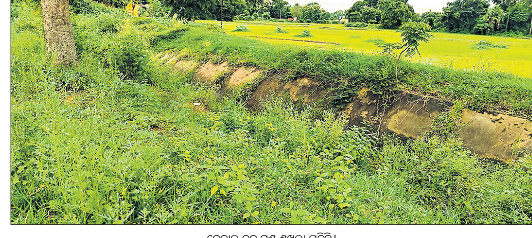
କେନାଲ ତଳ ପୁଷ୍ଟ ଶୁଖିଲା ପଡ଼ିଛି।

ଧର୍ମଶାଳା କୁଳ ଅନ୍ତର୍ଗତ ମଲିଆ ବଳଭଦ୍ରପୁର ରାସ୍ତା ଉନ୍ନତକରଣ କାର୍ଯ୍ୟ ନିମ୍ନମାନର ହୋଇଥିବା ଅଭିଯୋଗ ହୋଇଛି। ଫଳରେ ଏହାକୁ ନେଇ ସାଧାରଣରେ ଅସନ୍ତୋଷ ପ୍ରକାଶ ପାଉଛି। ଠିକା ସଂସ୍ଥା ନିମ୍ନମାନର ଗୋଡ଼ି,