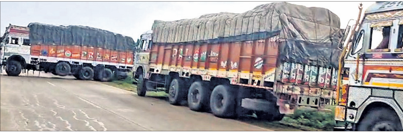
ଓଡ଼ିଶା ସାମାନ୍ତରେ ଅଟକି ରହିଥିବା ଆଳୁ ବୋହେଇ ଟ୍ରକ୍ ପଶ୍ଚିମବଙ୍ଗ ପ୍ରଶାସନ ଫେରାଇ ନେଇଛି।

ଭୁବନେଶ୍ୱର, ୨୬୭(ସୁନିର୍ଦ୍ଧ ମିଶ୍ର) ସମ୍ପ୍ରାନ୍ତ ମଧ୍ୟରେ ଆଳୁ ଦର ୧୫ ଟଙ୍କାରୁ ଅଧିକ ବୃଦ୍ଧି ପାଇଯାଇଛି। ଆଳୁ ଏବେ କେଉଁଠି ୪୫ ଟଙ୍କା ତ ଆଉ କେଉଁଠାରେ ୫୦ ଟଙ୍କାରେ ଲୋକମାନଙ୍କୁ କିଣିବାକୁ ପଡ଼ୁଛି। କିଛି ସ୍ଥାନରେ ଖୁରୁରାରେ ୫୫ ଟଙ୍କାରେ ମଧ୍ୟ ବିକ୍ରି ହେଉଥିବା ଖବର ମିଳୁଛି। ଏସବୁ ସ୍ଥିତି ଦେଖି ଗ୍ରାହକମାନଙ୍କ ମଧ୍ୟରେ ଛନ୍ଦକା ସୃଷ୍ଟି ହେଲାଣି। ଖୋଲା ବଜାରରେ ଆଳୁ