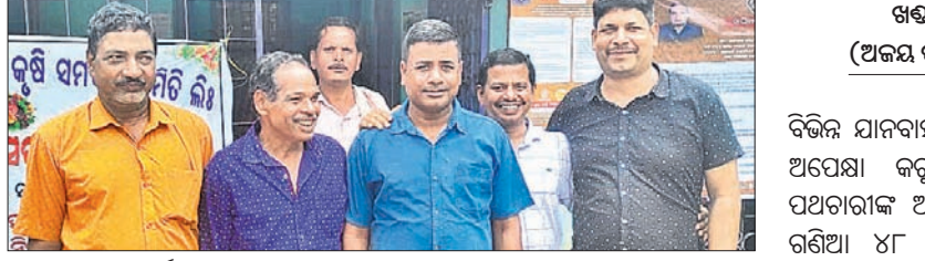
ସମିତିର ନିର୍ଦ୍ଦେଶକମାନଙ୍କୁ ବୈଠକକୁ ଡାକି ଯାଇ ନ ଥିବାରୁ ଅଭିଯୋଗ କରୁଛନ୍ତି।

ନୂଆଗାଁ, ୨୬୭୭ (ଧନେଶ୍ୱର ସାହୁ) ନୂଆଗାଁ ରୁକ୍ମ ବାହାଡ଼ାଖୋଲା ସେବା ସମାପ୍ତ ସମିତିର ସାଧାରଣ ବୈଠକ ଶୁକ୍ରବାର ଅନୁଷ୍ଠିତ ହୋଇଯାଇଛି। ସମିତିରେ ପୂର୍ବରୁ ସଭାପତି ଓ କେତେଜଣ ନିର୍ଦ୍ଦେଶକଙ୍କ ମଧ୍ୟରେ ତାଳମେଳ ରହୁ ନ ଥିଲା। ଉକ୍ତ ବୈଠକକୁ ଅନେକ ନିର୍ଦ୍ଦେଶକଙ୍କୁ ଡାକି ଯାଇ ନ ଥିବା ଅଭିଯୋଗ ହୋଇଛି। ଗଣାମାନଙ୍କ ଉକ୍ତି ପାଇଁ ସମିତି ଗଠନ କରାଯିବା ସହ ଠିକ୍ ଭାବେ ଚଳାଇବା ପାଇଁ ନିର୍ଦ୍ଦେଶକ ଓ ସଭାପତି ଚନ୍ଦନ କରାଯାଇଥାଏ। କିନ୍ତୁ ବାହାଡ଼ାଖୋଲା ସେବା ସମାପ୍ତ ସମିତିରେ ଗଣାମାନଙ୍କ ସ୍ୱାର୍ଥ ଅପେକ୍ଷା ନିଜସ୍ୱାର୍ଥ ପାଇଁ ବାବ ବିବାଦ ଲାଗି ରହିଛି। ବିଭିନ୍ନ ସମୟରେ ସଭାପତି ନିଜର ମନମାନି କରି ସୋସାଇଟିର ନିର୍ଦ୍ଦେଶକମାନଙ୍କୁ ଅଣଦେଖା କରୁଥିବା ଅଭିଯୋଗ ହେଉଛି। ଏ ନେଇ ନିର୍ଦ୍ଦେଶକମାନେ ବିଭାଗୀୟ ଅଧିକାରୀଙ୍କୁ ଲିଖିତ ଅଭିଯୋଗ କରିବା ସହ ଧାରଣା ମଧ୍ୟ ଦେଇଥିଲେ। ସମିତିର ନିୟମାବଳୀରେ ପ୍ରତିବର୍ଷ ସମସ୍ତ ସଭ୍ୟ, ନିର୍ଦ୍ଦେଶକ ଓ ବିଭାଗୀୟ ଅଧିକାରୀମାନଙ୍କ ଉପସ୍ଥିତିରେ