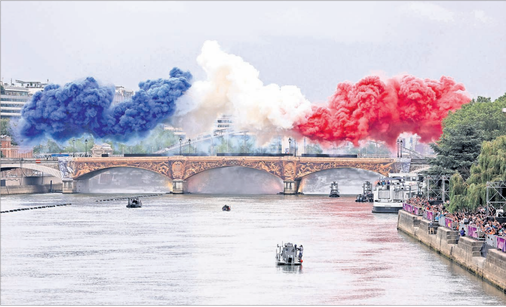
ପ୍ୟାରିସ୍ ସମୟ ଅଲମ୍ପିକ୍ ଉଦ୍‌ଘାଟନା ଉତ୍ସବରେ ଶୁକ୍ରବାର ପ୍ରାନ୍ତ ଜାତୀୟ ପତାକାର ରଙ୍ଗକୁ ଧୂଆଁ ମାଧ୍ୟମରେ ଚରଣାୟିତ କରାଯାଇଛି।

୨୦୨୪ ଅଲମ୍ପିକ୍ ଗେମ୍ସ ପାଇଁ ପ୍ୟାରିସ୍ ପ୍ରସ୍ତୁତ ହେଉଥିବାବେଳେ ରାଜଧାନୀରେ ଅଭୂତପୂର୍ବ ସୁରକ୍ଷା ବନ୍ଦୋବସ୍ତ କରାଯାଇଛି। ଏହାସତ୍ତ୍ୱେ ସୁରକ୍ଷାରେ ବଡ଼ ଧରଣର ତୁଟି ଦେଖିବାକୁ ମିଳିଛି। ତୁଟିରମାନେ ଗତି ଟ୍ରେନ୍ରେ ନିଆଁ ଲଗାଇଦେବା ସହ ରେଳ ନେଟୱାର୍କ ଡା'ର କାଟିଦେଇଛନ୍ତି। ଏଥିଯୋଗୁଁ ଟ୍ରେନ୍ ଚଳାଚଳ ବାଧାପ୍ରାପ୍ତ ହେବାରୁ ପ୍ରାୟ ୮ ଲକ୍ଷ ଯାତ୍ରୀ ପ୍ରଭାବିତ ହୋଇଥିବା କୁହାଯାଇଛି।