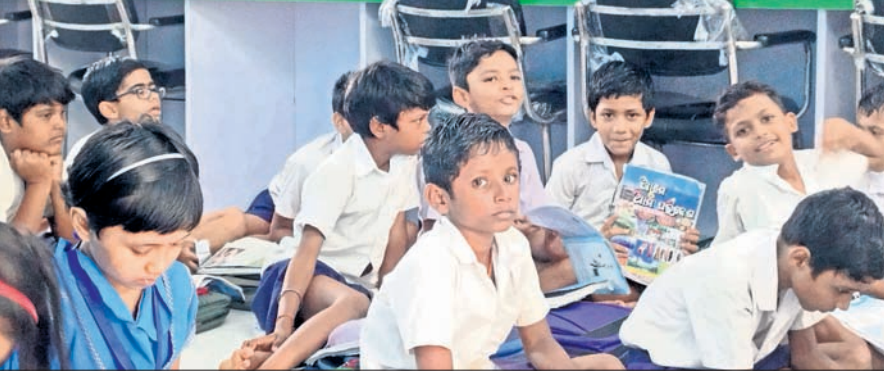
ନୟାଗଡ଼ ଲୁକ୍‌ଲୁକ୍ ନାରାୟଣା ସରକାରୀ ଉଚ୍ଚ ବିଦ୍ୟାଳୟର ଶ୍ରେଣୀଗୃହ ବିପଦସଙ୍କୁଳ ଥିବାରୁ ଛାତ୍ରାଛାତ୍ରୀମାନେ ଲାଇଟ୍‌ହେଭିରେ ବସି ପଢୁଛନ୍ତି।

ନୟାଗଡ଼ ଲୁକ୍‌ଲୁକ୍ ନାରାୟଣା ସରକାରୀ ଉଚ୍ଚ ବିଦ୍ୟାଳୟ ନାନା ସମସ୍ୟାରେ ଛନ୍ଦି ହୋଇପଡ଼ିଛି। ଏଠାରେ ପ୍ରଥମଠାରୁ ଦଶମ ଶ୍ରେଣୀ ପର୍ଯ୍ୟନ୍ତ ୧୦ଟି କ୍ଲାସ୍ ରହିଥିବାବେଳେ ପ୍ରଥମଠାରୁ ପାଠପଢ଼ାରେ ଅବସରପ୍ତା ଦେଖା ଦେଇଛି। ପ୍ରଥମରୁ ୫ମ ଶ୍ରେଣୀ ପର୍ଯ୍ୟନ୍ତ ୫ଟି ଶ୍ରେଣୀ କକ୍ଷ ବିପଦସଙ୍କୁଳ ହୋଇପଡ଼ିଛି। ସ୍କୁଲ ପଛ ପାଖରେ ଥିବା ଘରର ଲାଟିନ ପାଣି ଆସି ବିପଦସଙ୍କୁଳ ଘରେ ଜମା ହେଉଛି। ଜଗମାଟି ପଞ୍ଚାୟତ ପଡିଆ ପାଣି ସ୍କୁଲ ଭିତରେ ବର୍ଷା ହେଲେ ଜମି ରହି ଅପରିଷ୍କାର ପରିବେଶ ସୃଷ୍ଟି ହୋଇଛି। ବିପଦସଙ୍କୁଳ ଶ୍ରେଣୀ କକ୍ଷରୁ ଛାତ୍ରାଛାତ୍ରୀଙ୍କୁ