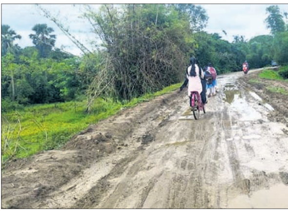
ବର୍ଷାରେ ଲୁଣା ନଦୀ ବନ୍ଧ ରାସ୍ତା କାନ୍ଥୁଆ ହୋଇଛି।

କେନ୍ଦ୍ରାପଡ଼ା ଜିଲ୍ଲାରେ ଗତ ଶୁକ୍ରବାର ରାତିରୁ ମୁଖ୍ୟ ମହାନଦୀର ଜଳସ୍ତର ବର୍ଷା ହେଉଛି। ଉପରପୁଞ୍ଜରେ ଅଧିକ ବର୍ଷା ହେଲେ ହାରାହାରି ଗେଟ ଖୋଲା ହେବ। ଜିଲ୍ଲାର ଲୁଣା ଓ କରାଣ୍ଡିଆ ଦ୍ୱୀପାଞ୍ଚଳରେ ଥିବା ୧୩ ରାଜସ୍ୱ ଗ୍ରାମବାସୀଙ୍କ ସ୍ୱାଭାବିକ ଜୀବନଯାତ୍ରାରେ ବ୍ୟାଧିତ ଆଣିବ ବୋଲି ସ୍ଥାନୀୟ ଲୋକ ଏପରି ଆଶଙ୍କା ପ୍ରକାଶ କରିଛନ୍ତି। ବର୍ଷାବର୍ଷ ଧରି ମୌଳିକ ସମସ୍ୟାର ସମାଧାନ ପାଇଁ ଗ୍ରାମବାସୀ ଲଢୁଥିବା ବେଳେ ଲୁଣାଦୀର ଦକ୍ଷିଣ ବନ୍ଧ ବହୁସ୍ଥାନରେ ବୁଲି ଥିବା ବ୍ୟତୀତ ସମସ୍ୟା ଥିବା ପ୍ରକାଶ କରିଛନ୍ତି। ସେହିପରି କରାଣ୍ଡିଆ ଆଡିବନ୍ଧର ମରାମତି ଆଧାର ରହିଥିବାରୁ ଯାତାୟାତରେ ବାଧା ସୃଷ୍ଟି ହେବ ବୋଲି ସ୍ଥାନୀୟ ଅଞ୍ଚଳବାସୀ ମତ ଦେଇଛନ୍ତି।