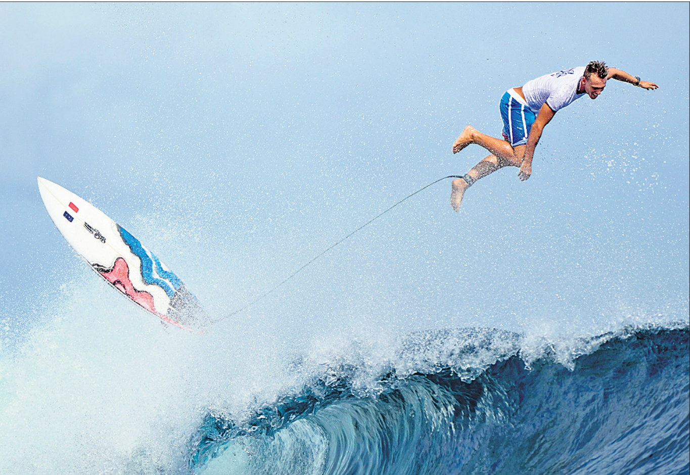
ପ୍ୟାରିସ୍ ଅଲିମ୍ପିକ୍ସର ସର୍ବୋଚ୍ଚ ପ୍ରତିଯୋଗିତା ପୂର୍ବରୁ ଚାହିଁତର ଚିତ୍ରପାଠାରେ ଶୁକ୍ରବାର ଅଭ୍ୟାସରତ ପ୍ରାନ୍ତର କାଉଲି ଭାସ୍କା।