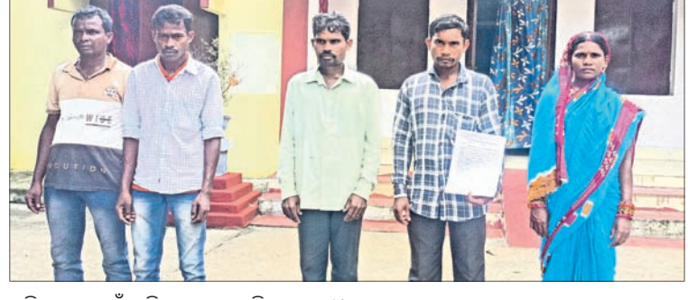
ଅଭିଯୋଗ ପାଇଁ ଆସିଥିବା ଆବାସ ହିତାଧିକାରୀ ।

ନୟାଗଡ଼ ଜିଲ୍ଲା ନୂଆଗାଁ ବ୍ଲକ୍ ବେରୁହାଁବାରୀ ପଞ୍ଚାୟତରେ ଆବାସ ଗୃହ ନିର୍ମାଣ କରି ଦେବେ କହି ହିତାଧିକାରୀଙ୍କ ଅନୁଦାନ ହତପ ହୋଇଥିବା ଅଭିଯୋଗ ହୋଇଛି । ଏ ନେଇ ବେରୁହାଁବାରୀ ପଞ୍ଚାୟତର ବିଭିନ୍ନ ଗ୍ରାମର ଆବାସ ହିତାଧିକାରୀମାନେ ଶୁକ୍ରବାର ବାହାଡ଼ାଖୋଲା ଫାଉଣ୍ଡେସନ ପହଞ୍ଚି ଅଭିଯୋଗ କରିଛନ୍ତି ।