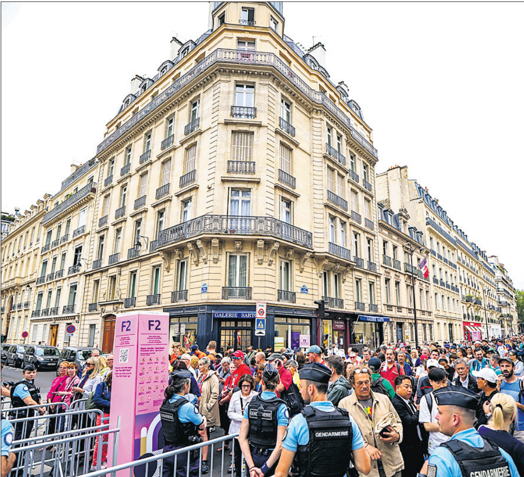
ଉଦ୍‌ଘାଟନା ସମାରୋହ ପାଇଁ ଦର୍ଶକଙ୍କ ଉତ୍ସାହ।