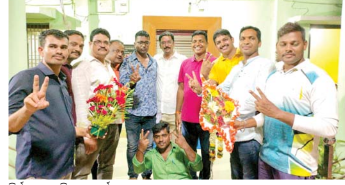
ନିର୍ବାଚନରେ ବିଜୟୀ ପ୍ରାର୍ଥୀ।

ବ୍ରହ୍ମପୁର, ୨୭/୭ (ସୁବାସ ଚନ୍ଦ୍ର ପାଢ଼ୀ) ବ୍ରହ୍ମପୁର ହାବିଲଦାର ଓ କନଷ୍ଟେବଲ ସଂଘର ବିଭିନ୍ନ ପଦ ପାଇଁ ଚଳିତବର୍ଷ ନିର୍ବାଚନ ହୋଇଛି। ବ୍ରହ୍ମପୁର ପୋଲିସ ଜିଲ୍ଲାରେ ୮୨୨ ଭୋଟରେ ରହିଥିବା ବେଳେ ଏଥିରୁ ୭୯୮ ଜଣ ଭୋଟ ଦେଇଛନ୍ତି। ଜିଲ୍ଲାର ସମସ୍ତ ଥାନା ଭିତରୁ ଅଧିକାଂଶ ଏହି ନିର୍ବାଚନ ଅନୁଷ୍ଠିତ ହୋଇଥିଲା। ସମସ୍ତ ଥାନାଧିକାରୀ ପ୍ରକାଳିତ ଅଧିକାର ଦାୟିତ୍ୱରେ ଥିଲେ ବୋଲି ନିର୍ବାଚନ ଅଧିକାରୀ ତଥା ଡିଏସପି ବିଶ୍ୱଜିତ ରାଉତରାୟ କହିଛନ୍ତି। ଶୁକ୍ରବାର ଗଣତି ପରେ ବିଜୟୀ ପ୍ରାର୍ଥୀଙ୍କ ତାଲିକା ପ୍ରକାଶ ପାଇଛି। ସଭାପତି