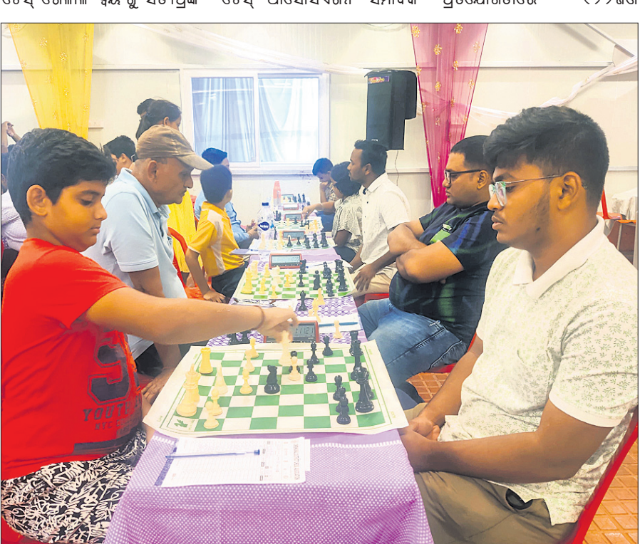
ପ୍ରଥମ ଦିବସରେ ପ୍ରତିଯୋଗୀମାନେ ଖେଳରେ ମଗ୍ନ।