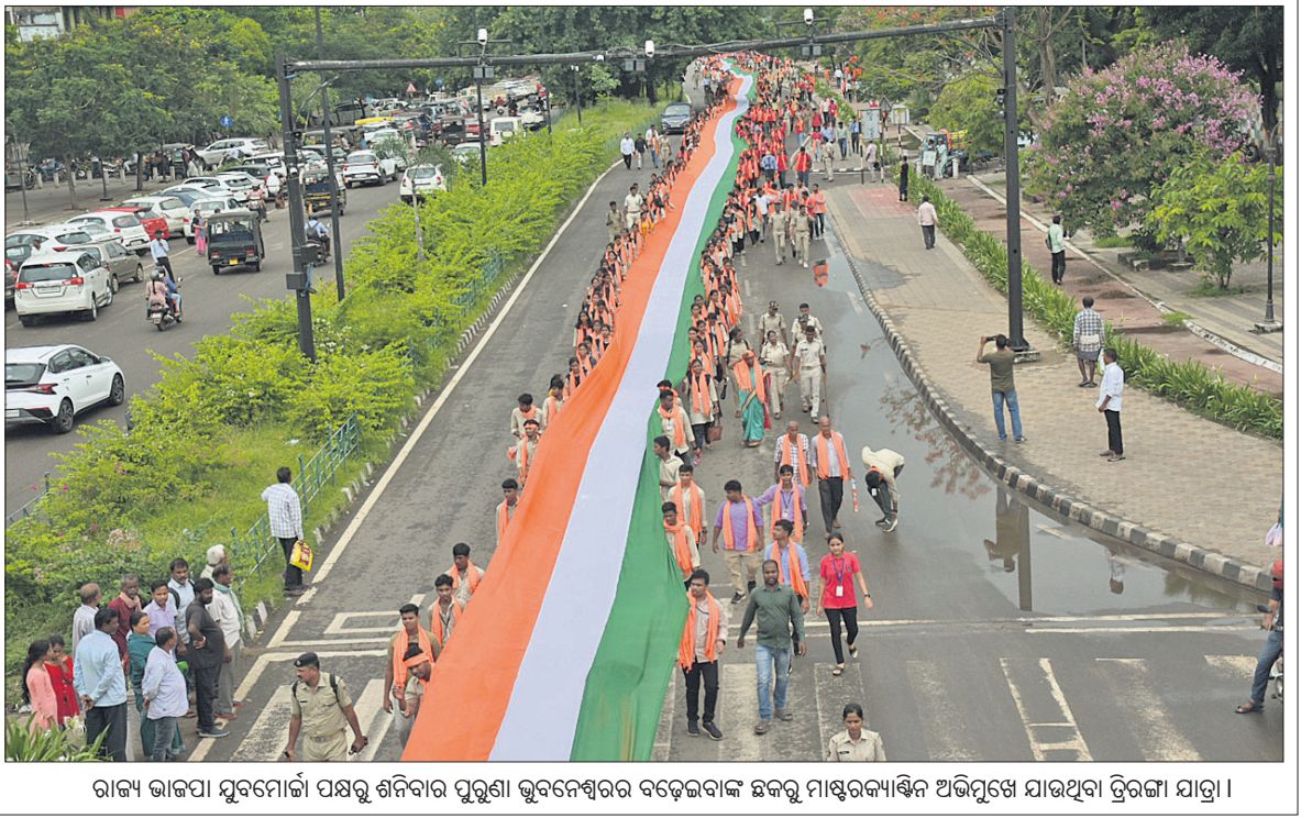
ରାଜ୍ୟ ଭାଙ୍ଗିବା ସୁବେଳା ପକ୍ଷରୁ ଶନିବାର ପୁରୁଣା ଭୁବନେଶ୍ଵରର ବଡ଼େଇବାକ ଛକକୁ ମାଷ୍ଟରକର୍ମୀଙ୍କ ଅଭିଯୁକ୍ତେ ଯାଉଥିବା ଦ୍ଵିତୀୟା ଯାତ୍ରା ।