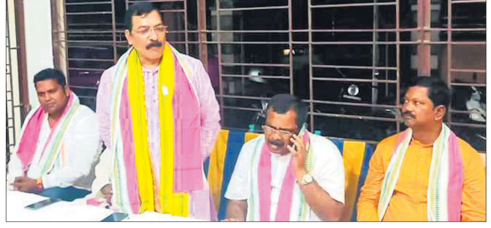
ସମାକ୍ଷା ବୈଠକରେ ଉପସ୍ଥିତ ଭାଙ୍ଗିବା ନେତୃବୃନ୍ଦ ।