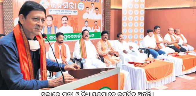
ସଭାରେ ମନ୍ତ୍ରୀ ଓ ବିଧାୟକମାନେ ଉପସ୍ଥିତ ଅଛନ୍ତି।