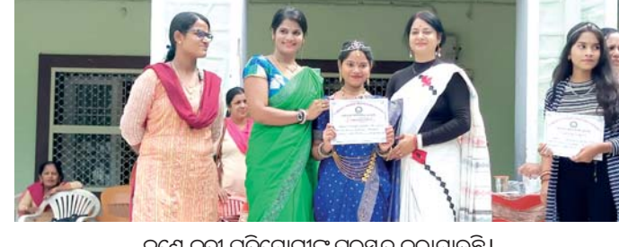
ଜଣେ କୃତୀ ପ୍ରତିଯୋଗୀଙ୍କୁ ପୁରସ୍କୃତ କରାଯାଇଛି। ବ୍ରହ୍ମପୁର, ୨୭/୭