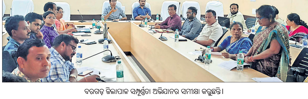
ବରଗଡ଼ ଜିଲ୍ଲାପାଳ ସମ୍ପୂର୍ଣ୍ଣତା ଅଭିଯାନର ସମୀକ୍ଷା କରୁଛନ୍ତି।