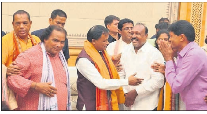
ମୁଖ୍ୟମନ୍ତ୍ରୀଙ୍କୁ ଫେରାଦ ହୋଇଥିବା ପଶ୍ଚିମ ଓଡ଼ିଶା କଳାକାର ମହାସଂଘର ପ୍ରତିନିଧିଦଳ।

ପଶ୍ଚିମ ଓଡ଼ିଶା କଳାକାର ମହାସଂଘର ଏକ ପ୍ରତିନିଧି ଦଳ ଶୁକ୍ରବାର ମୋହନ ଚରଣ ମାଝିଙ୍କୁ ଫେରାଦ ହୋଇ ସେମାନଙ୍କ ସମସ୍ୟା ଅବଗତ କରିଥିଲେ। ଏ ନେଇ ମୁଖ୍ୟମନ୍ତ୍ରୀଙ୍କୁ ଉକ୍ତ ପ୍ରତିନିଧି ଦଳ ଏକ ସ୍ମାରକପତ୍ର ପ୍ରଦାନ କରିଥିଲେ। ରାଜ୍ୟର ଆହୁରି ୧୯୯୯ କଳାକାରଙ୍କୁ ମୁଖ୍ୟମନ୍ତ୍ରୀ କଳାକାର ଭଣ୍ଡା ଯୋଜନାରେ ସାମିଲ କରିବା, ପ୍ରତି ଜିଲ୍ଲାରେ ଲୋକକଳା ଭବନ ନିର୍ମାଣ ପାଇଁ ଜମି, ଅନୁଦାନ ଯୋଗାଇବା, ମୁଖ୍ୟମନ୍ତ୍ରୀ କଳାକାର ସ୍ୱାସ୍ଥ୍ୟକାର୍ଯ୍ୟ ପ୍ରଚଳନ, ଲୋକକଳାର ବିକାଶ ପାଇଁ ପଦକ୍ଷେପ ନିଆଯିବାକୁ ସ୍ମାରକପତ୍ରରେ ଦାବି କରାଯାଇଛି। ଏହା ସହିତ ବରଗଡ଼ରେ ପଶ୍ଚିମ ଓଡ଼ିଶା କଳାକାର ମହାସଂଘ ପକ୍ଷରୁ ଆୟୋଜିତ