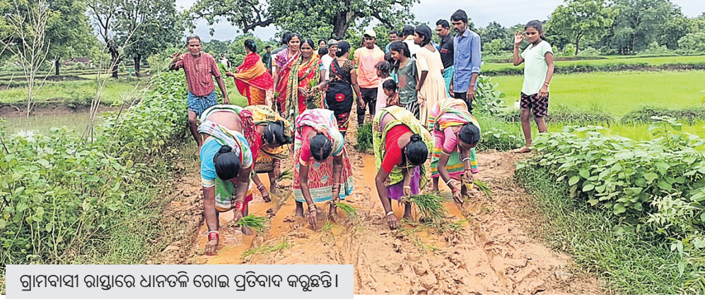
ଗ୍ରାମବାସୀ ରାସ୍ତାରେ ଧାନତଳି ରୋଇ ପ୍ରତିବାଦ କରୁଛନ୍ତି।

କୋକସରା, ୨୭୭ (ବୁଦ୍ଧ କୁମାର ପାଟଣୋଣୀ) ଉପାଡ଼ ଅଞ୍ଚଳରେ ଏମିତି ଅନେକ ଗ୍ରାମ ରହିଛି ଯେଉଁଠିକୁ ଭଲ ରାସ୍ତା ନାହିଁ। ଏଭଳି ଏକ ଚିତ୍ର ଦେଖିବାକୁ ମିଳିଛି କଳାହାଣ୍ଡି ଜିଲ୍ଲା କୋକସରା ବ୍ଲକ୍ ସାନ ପୋଡ଼ାଗୁଡ଼ା ପଞ୍ଚାୟତର ମଙ୍ଗଳପୁର ଗାଁରେ। ଗାଁକୁ ପଞ୍ଚା ରାସ୍ତା ନ ଥିବାରୁ ବର୍ଷର ବାରମାସ