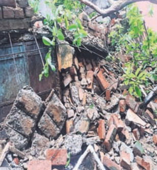
କାନ୍ଥ ଭୁଗୁଡ଼ି ପଡ଼ିଛି।

ବରଗଡ଼ ଜିଲ୍ଲା ପାଇକମାଳ ବ୍ଲକ ଅନ୍ତର୍ଗତ ପଲସଦା ଗ୍ରାମ ପଞ୍ଚାୟତ ଉପ୍ରା ବିଦ୍ୟାଳୟରେ ଗୋଟିଏ କୋଠାର କାନ୍ଥ ଶୁକ୍ରବାର ରାତିରେ ଭୁଗୁଡ଼ି ପଡ଼ିଥିଲା। ସୌଭାଗ୍ୟବଶତଃ ତାହା ରାତ୍ରିରେ ରହିଛି। ନ ହେଲେ ବଡ଼ ଧରଣର ଅଘଟଣ ଘଟିଥାନ୍ତା। ଘର କାନ୍ଥରେ ପଲସଦା ପାଣି ଚେପ, ହାତ ଫୁଁସ ଧୋଇବା ପାଣି ଚେପ ଲଗାଯାଇଥିଲା। ଏହା ଅତି ନିର୍ମମାନ ନିର୍ମାଣ ହୋଇଛି ବୋଲି ଗ୍ରାମବାସୀ କହିଛନ୍ତି। ଏଥିପ୍ରତି ବିଭାଗୀୟ ଉଚ୍ଚ କର୍ତ୍ତୃପକ୍ଷ ଦୃଷ୍ଟି ଦେବା ପାଇଁ ଦାବି ହେଉଛି।