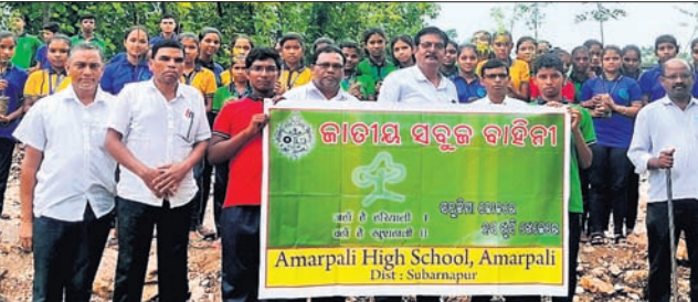
ଶିକ୍ଷା ସପ୍ଲାଇ ପାଳନ ଅବସରରେ ଅନୁଷ୍ଠିତ ଚାରା ରୋପଣ କାର୍ଯ୍ୟକ୍ରମରେ ଛାତ୍ରାଛାତ୍ରୀ ଓ ଶିକ୍ଷକ।