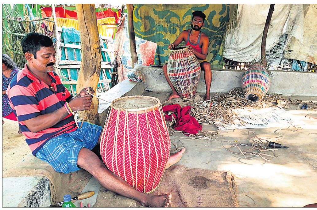
ଖଲିଆପାଲିର କାରିଗରମାନେ ମୁଦଙ୍ଗ ଓ ଭୋଲ ତିଆରି କରୁଛନ୍ତି।

ପଶ୍ଚିମ ଓଡ଼ିଶାର ଲୋକନୃତ୍ୟ, ଲୋକଗୀତ ଓ ଲୋକବାଦ୍ୟର ସବୁଠି ଆଦର ରହିଛି। ଏହି ମହାନ କଳା ଓ ସଂସ୍କୃତିକୁ ବଞ୍ଚାଇ ରଖିବାରେ କଳାକାରଙ୍କ ସହିତ ଲୋକବାଦ୍ୟ ତିଆରି କରୁଥିବା କାରିଗରଙ୍କ ବଡ଼ ଭୂମିକା ରହିଛି। କିନ୍ତୁ ମଞ୍ଚ ଉପରେ ନିଜର କଳା ପରିବେଷଣ କରୁଥିବା କଳାକାରଙ୍କୁ ଯେତିକି ସମ୍ମାନ ମିଳେ ପାରମ୍ପରିକ ଲୋକବାଦ୍ୟ ତିଆରି କରୁଥିବା କାରିଗରଙ୍କୁ ତାହା ମିଳେନା। ପାରମ୍ପରିକ ଲୋକବାଦ୍ୟର ଖୁବ୍ ଚାହିଦା ଥିବା ବେଳେ ସେମାନଙ୍କୁ ସରକାରୀ ପ୍ରୋତ୍ସାହନ ମିଳିପାରେନା। କୌଳିକ ବୃତ୍ତିକୁ ଆପଣେଇ ମୁଦଙ୍ଗ, ଭୋଲ, ମାଦଳ, ଚାପା, ନାଲ ଓ ନିସାନ ଆଦି ବାଦ୍ୟ ତିଆରି କରୁଥିବା ଶିଳ୍ପୀଙ୍କ ଜୀବନ ଜୀବିକା ଏବେ ସଙ୍କଟରେ। ଲୋକକଳାକୁ ବଞ୍ଚାଇ ରଖିବାରେ ଗୁରୁତ୍ୱପୂର୍ଣ୍ଣ ଭୂମିକା ନିର୍ବାହ କରୁଥିବା ହାତଗଣତି ବାଦ୍ୟ କାରିଗରଙ୍କୁ ସରକାର ପ୍ରଧାନମନ୍ତ୍ରୀ ବିଶ୍ୱକର୍ମା ଯୋଜନା ଓ ମୁଖ୍ୟମନ୍ତ୍ରୀ କାରିଗର ସହାୟକ ଯୋଜନାରେ ସାମିଲ କରିବା ପାଇଁ କଳା ଓ ସଂସ୍କୃତି ପ୍ରମୋଦନ ଆନୁରୋଧ କରିଛନ୍ତି। ନାମ ସଂକୀର୍ତ୍ତନ, ଦାସ କାଠିଆ, ଦଣ୍ଡନୃତ୍ୟ ଓ ପାଲା ଭଳି ବିଭିନ୍ନ କାର୍ଯ୍ୟକ୍ରମରେ ମୁଦଙ୍ଗ ହେଉଛି ପ୍ରମୁଖ ବାଦ୍ୟ। ବେକରେ ମୁଦଙ୍ଗ ଟିଏ ଧରି ବାଦ୍ୟକାର ବିଭିନ୍ନ ଶୈଳୀରେ ବଜାଇ ଥିବା ବେଳେ ଦର୍ଶକମାନେ ଖୁବ୍ ମଜା ନେଇଥାନ୍ତି। ସେହିପରି କରମସାମୀ ନୃତ୍ୟରେ ମାଦଳ ହେଉଛି ପ୍ରମୁଖ ବାଦ୍ୟ। ସମ୍ବଲପୁରୀ ନୃତ୍ୟରେ ଭୋଲ, ଚାପା