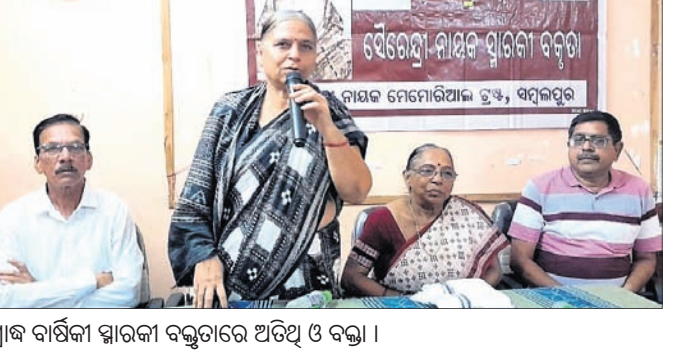
ଶ୍ରୀକାର୍ଯ୍ୟକ୍ରମ ସ୍ମାରକୀ ବକ୍ତୃତାରେ ଅତିଥି ଓ ବକ୍ତା।

ଅଗ୍ନିଶମ ବିଭାଗ କର୍ମଚାରୀ ଗଛ କାଟି ବାହାର କରୁଛନ୍ତି। ଯିତି ହୋଇ ନ ଥିଲା। ଗ୍ରାମବାସୀଙ୍କଠାରୁ ଖବର ପାଇ କୋମନା ଅଗ୍ନିଶମ ବିଭାଗ କର୍ମଚାରୀ ଘଟଣାସ୍ଥଳରେ ପହଞ୍ଚିଲେ। ହେଲେ ଅତ୍ୟଧିକ ବର୍ଷା ଓ ଅଧାର ରାତି ଯୋଗୁ ଗଛ କାଟିବା କାମ ମନ୍ଦର ଗତିରେ ଚାଲିଥିଲା। ଶନିବାର ସକାଳେ ବର୍ଷା ଖବର ପାଇ କୋମନା ଅଗ୍ନିଶମ ବିଭାଗ କର୍ମଚାରୀ ଘଟଣାସ୍ଥଳରେ ପହଞ୍ଚିଲେ। ହେଲେ ଅତ୍ୟଧିକ ବର୍ଷା ଓ ଅଧାର ରାତି ଯୋଗୁ ଗଛ କାଟିବା କାମ ମନ୍ଦର ଗତିରେ ଚାଲିଥିଲା। ଶନିବାର ସକାଳେ ବର୍ଷା ଖବର ପାଇ କୋମନା ଅଗ୍ନିଶମ ବିଭାଗ କର୍ମଚାରୀ ଘଟଣାସ୍ଥଳରେ ପହଞ୍ଚିଲେ। ହେଲେ ଅତ୍ୟଧିକ ବର୍ଷା ଓ ଅଧାର ରାତି ଯୋଗୁ ଗଛ କାଟିବା କାମ ମନ୍ଦର ଗତିରେ ଚାଲିଥିଲା। ଶନିବାର ସକାଳେ ବର୍ଷା ଖବର ପାଇ କୋମନା ଅଗ୍ନିଶମ ବିଭାଗ କର୍ମଚାରୀ ଘଟଣାସ୍ଥଳରେ ପହଞ୍ଚିଲେ। ହେଲେ ଅତ୍ୟଧିକ ବର୍ଷା ଓ ଅଧାର ରାତି ଯୋଗୁ ଗଛ କାଟିବା କାମ ମନ୍ଦର ଗତିରେ ଚାଲିଥିଲା।