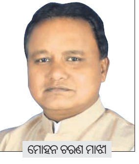
ମୋହନ ଚରଣ ମାଝା