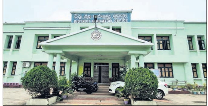
ବରଗଡ଼ ଜିଲ୍ଲା ଶିକ୍ଷା କାର୍ଯ୍ୟାଳୟ।