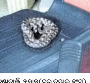
କଣ୍ଟାବାଞ୍ଚି, ୨୭୭୭(ଗୁରୁ ଦୟାଳ ହଂସ)

କଲମ୍ବାର ଜିଲା ଉପାଡ଼ ଚୁରୁକେଳା ବ୍ଲକ୍ ବଡ଼ତକଳା ପଞ୍ଚାୟତର ଅଧୀନ ନାଗଫୋନା ପ୍ରାଥମିକ ବିଦ୍ୟାଳୟର ଏକ ଶ୍ରେଣୀ ଗୃହରେ ଶନିବାର ଶିକ୍ଷକଙ୍କ ଚୌକିରେ ଏକ ବିଷାକ୍ତ ସାପ ଦେଖିବାକୁ ମିଳିଥିଲା। ସକାଳେ ବିଦ୍ୟାଳୟ ଖୋଲିବା ପରେ ଶ୍ରେଣୀ ଗୃହକୁ ଯିବା ବେଳେ ଜଣେ ଶିକ୍ଷକ ଏହା ଦେଖିଥିଲେ। ପରେ ସାପକୁ କୌଶଳ କ୍ରମେ ଧରାଯାଇ ନିକଟସ୍ଥ ଜଙ୍ଗଲରେ ଛାଡ଼ି ଦିଆଯାଇଥିଲା। ଫଳରେ ଶିକ୍ଷୟିତ୍ରୀ ଶିକ୍ଷକ ଏବଂ ଛାତ୍ରାଛାତ୍ର ଅଳ୍ପକେ ବର୍ତ୍ତି ଯାଇଛନ୍ତି।