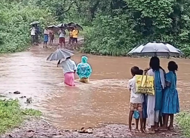
ବାଉଁଶିଆ, ୨୭୭୭(ଦେବାଶିଷ ନେପାଳ)