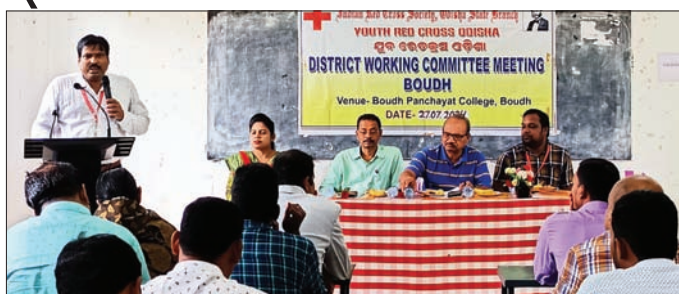
କାର୍ଯ୍ୟକ୍ରମରେ ଯୋଗ ଦେଇଥିବା ଅତିଥି।