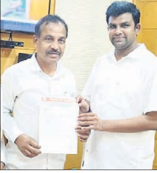
ପରିବହନ ବିଭାଗ ମନ୍ତ୍ରୀଙ୍କୁ ଦାବିପତ୍ର ଦେଖାଇ ପ୍ରତିଶ୍ରୁତି ଦେବା।

ଉଠିବାବେଳେ ଗୋଟିଏ ପଟେ ଜିଲ୍ଲା ଶିକ୍ଷା ବିଭାଗ ଏହାକୁ ଗୁରୁତ୍ୱ ଦେଇ ନେଇ ଯାଅ ପ୍ରକ୍ରିୟା ଆରମ୍ଭ କରିଥିବାବେଳେ ଅନ୍ୟପଟେ ଧମକ ଦେଇ ବିଦ୍ୟାଳୟ ଅଧିକାରୀଙ୍କୁ ହାତଗୁଞ୍ଜା ମଧ୍ୟ ଠାବ କରିବା ଏବଂ ସେମାନଙ୍କ ବିରୋଧରେ କାର୍ଯ୍ୟାନୁଷ୍ଠାନ ନିଆଯିବାର ଆବଶ୍ୟକତା ରହିଛି ବୋଲି ସାଧାରଣରେ ମତପ୍ରକାଶ ପାଇଛି। ଜିଲ୍ଲାରେ ନକଲି ଶିକ୍ଷକ ନିଯୁକ୍ତି ପ୍ରସଙ୍ଗ ବାରମ୍ବାର ଉଠୁଛି। ତିରାଚିତ ଢଙ୍ଗରେ ଯାଅ ପ୍ରକ୍ରିୟା ମଧ୍ୟ ଚାଲୁଛି। ତଥାପି ନକଲି ଶିକ୍ଷକଙ୍କ ପୁଣି ଶୋଲୁ ନ ଥିବା ଯୋଗୁଁ ପୁଣି ଏହି ପ୍ରସଙ୍ଗ ଉଠି ହଇଚଇ ସୃଷ୍ଟି ହେଉଛି। ଏଭଳି ସ୍ଥିତିରେ ନକଲି ଶିକ୍ଷକଙ୍କୁ ଠାବ କରିବା ସହିତ ଏହି ପ୍ରସଙ୍ଗରେ ହାତଗୁଞ୍ଜା ପାଇଁ ଧମକ ଦେଇଥିବା ତଥ୍ୟାଧିକାରୀ ଗଣମାଧ୍ୟମ ପ୍ରତିନିଧିମାନଙ୍କୁ ମଧ୍ୟ ଚିହ୍ନଟ କରି ସେମାନଙ୍କ ବିରୋଧରେ କାର୍ଯ୍ୟାନୁଷ୍ଠାନ ନେବାକୁ ଦାବି ହେଉଛି।