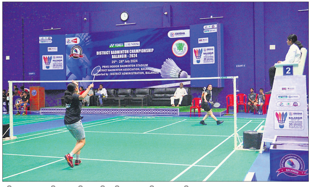
ଶନିବାର କଲମ୍ବାର ଜିଲା ବ୍ୟାଡମିଣ୍ଟନ ଚାମ୍ପିୟନଶିପର ତୃତୀୟ ଦିବସରେ ଅନୁଷ୍ଠିତ ଏକ ମ୍ୟାଚ୍।