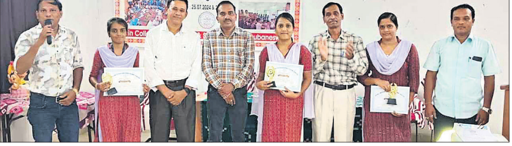
ଅଧ୍ୟକ୍ଷ, ପ୍ରତିଷ୍ଠକ ଗହଣରେ କୃତୀ ଛାତ୍ରୀମାନେ।