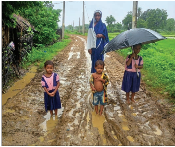
କାଦୁଅ ରାସ୍ତାରେ ଅଜ୍ଞାନତାକୁ ଯାଉଛନ୍ତି ଛାତ୍ରାଛାତ୍ରୀ

କାଦୁଅ ପଥର ରାସ୍ତାରେ ଯାଉଛନ୍ତି ଅଜ୍ଞାନତାକୁ ଛାତ୍ରାଛାତ୍ରୀ ଏଭଳି ଦୁଃଖ ଦେଖିବାକୁ ମିଳିଛି ସୁବର୍ଣ୍ଣପୁର ଜିଲ୍ଲା ବାରମହାରାଜପୁର ବ୍ଲକ୍ ବହଳପଦର ପଞ୍ଚାୟତରେ ଚିକିତ୍ସାଗାରୀ ଗ୍ରାମରେ। ଏହି ଗ୍ରାମରୁ ବିଶାଳପାଲି- ପାଟଣାପାଲିକୁ ଯାଇଥିବା ରାସ୍ତାରେ ଅଜ୍ଞାନତାକୁ ଛାତ୍ରାଛାତ୍ରୀ ଯାଉଛନ୍ତି କେନ୍ଦ୍ରୀୟ ମାତ୍ର ଏହି ରାସ୍ତା ପକ୍ଷୀ ରାସ୍ତାହୋଇ ନାହିଁ। ଏବେ ଲଗାଣ ଖର୍ଚ୍ଚା ହେଉଥିବାବେଳେ ଏକକାରାସ୍ତା ଏବେକାଦୁଅ ପଥର ହୋଇ ପଡ଼ିଛି। ଏହି ଗ୍ରାମକୁ ଭାଲୁଗୁଡ଼ିଆରୁ ଚିକିତ୍ସାଗାରୀ ପର୍ଯ୍ୟନ୍ତ ଦୀର୍ଘଦିନ ହେଲା ପ୍ରଧାନମନ୍ତ୍ରୀ ଗ୍ରାମ୍ୟ ସଡ଼କ ଯୋଜନାରେ ରାସ୍ତା ରହିଛି। ମାତ୍ର ଚିକିତ୍ସାଗାରୀ ଗ୍ରାମକୁ ପାଟଣାପାଲି ପର୍ଯ୍ୟନ୍ତ ରାସ୍ତା କାମ ହୋଇନାହିଁ। ପ୍ରାୟ ଦେଢ଼ କିଲୋମିଟରର ରାସ୍ତାକୁ ପକ୍ଷୀ ରାସ୍ତା ପିନ୍ଧି ରାସ୍ତାରେ ଯାମାନି କରାଯାଇନାହିଁ। ଏହି ରାସ୍ତା ଦେଇ ଚିକିତ୍ସାଗାରୀ ଗ୍ରାମବାସୀ