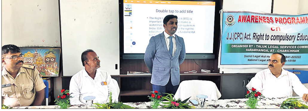
ଆଇନ ସଚେତନତା ଶିବିରରେ ବିଚାରପତି ଓ ଅନ୍ୟମାନେ।