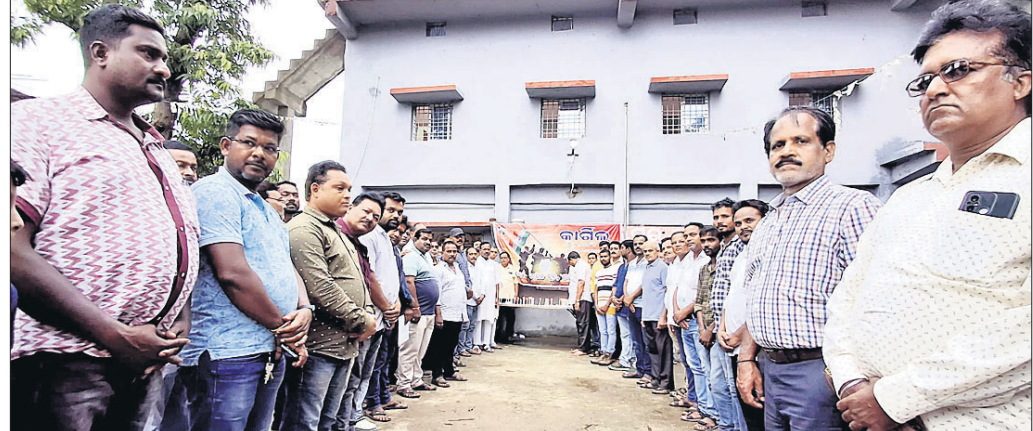
ଟାଉନ କ୍ଲବରେ କାରଗିଲ ଦିବସ ପାଳନ ପୂର୍ବରୁ।