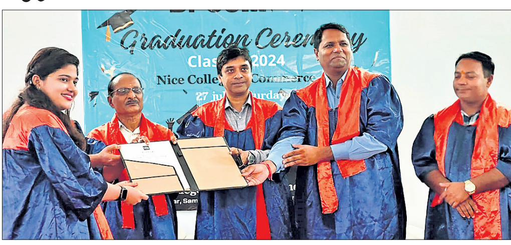
କଲମ୍ବାର ସିଏନ୍‌ସି କଲେଜର ଗ୍ରାଜୁଏଟ୍ ସେରିମନିରେ ଛାତ୍ରାଛାତ୍ରୀଙ୍କୁ ବି. କମ୍ ଡିଗ୍ରୀ ପ୍ରଦାନ କରୁଛନ୍ତି।