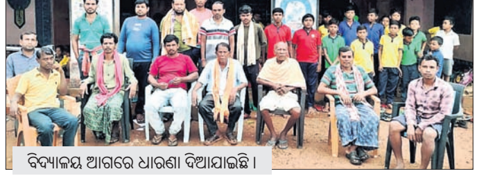
ବିଦ୍ୟାଳୟ ଆଗରେ ଧାରଣା ଦିଆଯାଇଛି।