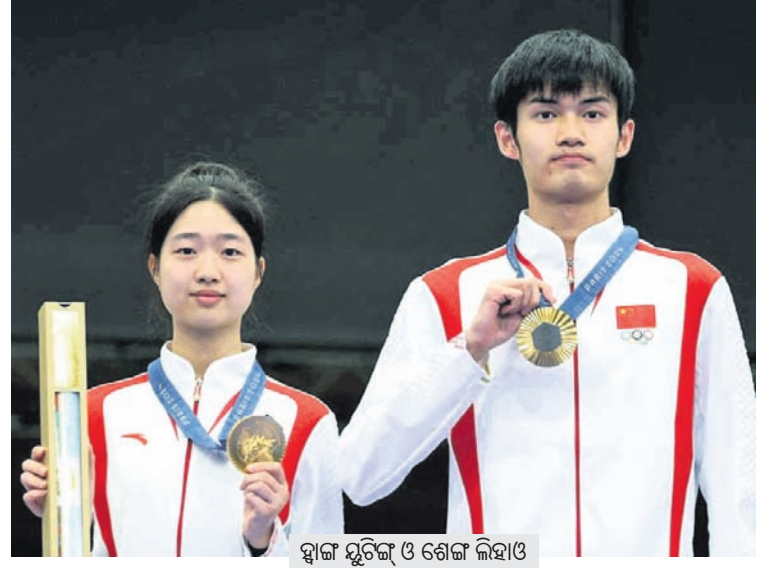
ସ୍ନାକ୍ ଶୁଟିଂ ଓ ଶେଙ୍ଗ ଲିହାଓ