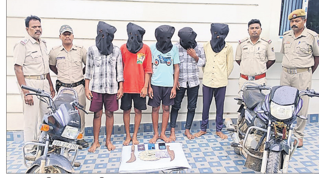
ଲୁଟ୍ ଘଟଣାରେ ଗିରଫ ହୋଇଥିବା ଅଭିଯୁକ୍ତ।