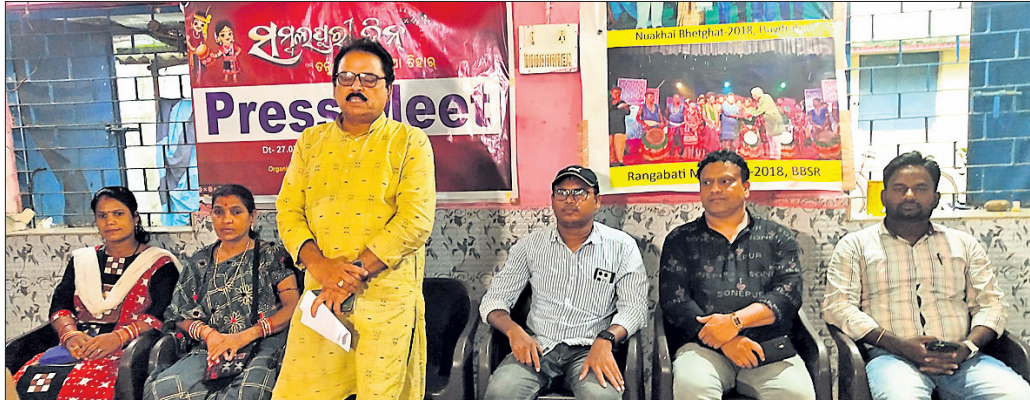
କର୍ମକର୍ମୀମାନେ ଖବରଦାତା ସମ୍ମିଳନୀରେ ସୂଚନା ଦେଉଛନ୍ତି।