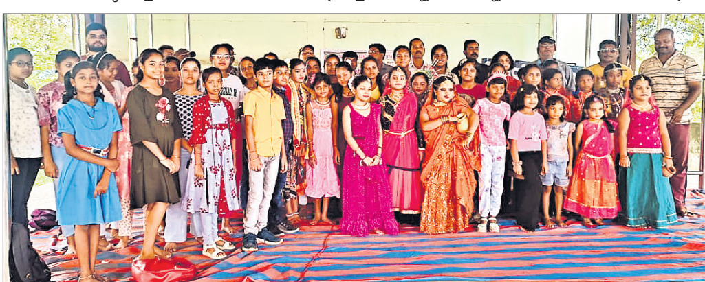
ଭବସ୍ ଜିନିଷ-ସିଜନ-୧୧ ପାଇଁ ଅତିଶନରେ ସାମିଲ ଥିବା ପ୍ରତିଯୋଗୀ।

ବେବରୁଡ଼ାରେ ଅପ୍ରାଣୀ ସଂସ୍କୃତିକ ଅନୁଷ୍ଠାନ ସଙ୍ଗେ ଏକ ସଙ୍ଗୀତ ପକ୍ଷରୁ ଆସନ୍ତା ଅଗଷ୍ଟ ୧୫ରେ ସ୍ୱାଧୀନତା ଦିବସ ଉପଲକ୍ଷେ ହେବାକୁ ଥିବା ବିଦ୍ୟାଳୟସ୍ତରୀୟ ଭବସ୍ ଜିନିଷ-ସିଜନ-୧୧ ପାଇଁ ସ୍ଥାନୀୟ ସଂସ୍କୃତି ଭବନରେ ରବିବାର ବିତୀୟ ପର୍ଯ୍ୟାୟ, ଅତିଶନ ପ୍ରତିଯୋଗୀ ଚୟନ କାର୍ଯ୍ୟକ୍ରମ ଅନୁଷ୍ଠିତ ହୋଇଯାଇଛି। ଅତିଶନ କାର୍ଯ୍ୟକ୍ରମରେ ଯୋଗ୍ୟ ଶିଳ୍ପୀମାନଙ୍କୁ ପ୍ରଥମ ପର୍ଯ୍ୟାୟରେ ବିଭିନ୍ନ ସ୍ଥଳରୁ ପ୍ରଥମ ପର୍ଯ୍ୟାୟରେ ଆସିଥିବା ୪୦ରୁ ଊର୍ଦ୍ଧ୍ୱ ଛାତ୍ରାଛାତ୍ରୀଙ୍କ ମଧ୍ୟରେ ଗୀତ ଓ ନୃତ୍ୟ ପ୍ରତିଯୋଗିତା