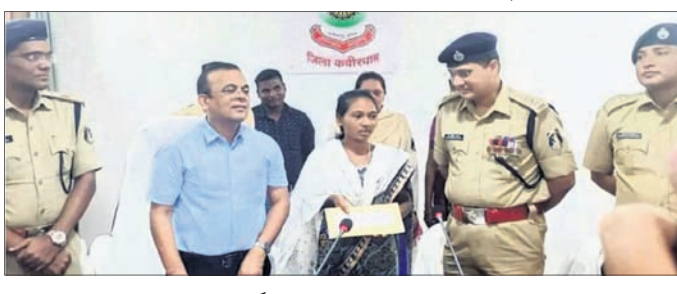
ଆତ୍ମସମର୍ପଣ କରିଥିବା ମହିଳା ମାଓବାଦୀ

ତୋମଲାଲ ଗ୍ରାମର ସୁଲ ଓ ଅନ୍ୟ ଅଞ୍ଚଳରେ ବିପୁଳ ସଂଖ୍ୟାରେ ପୋଷ୍ଟର ଲଗାଇଥିଲେ । ସ୍ଥାନୀୟ ଭାଷାରେ ଏହି ପୋଷ୍ଟରଗୁଡ଼ିକ ଲେଖାଯାଇଥିଲା । ମାଓବାଦୀଙ୍କ ଛାପାମାରି ମୁଦ୍ଦର ନିୟମାବଳୀ, ଚେରିଲା ମୁଦ୍ଦର ଅନୁପାତ ବୃଦ୍ଧି ସମ୍ପର୍କରେ ଏଥିରେ ଲେଖାଯାଇଛି । ଏହି ପୋଷ୍ଟରଗୁଡ଼ିକ ଦେଖିବା ପରେ ସ୍ଥାନୀୟ ପୋଲିସ ଓ ସୁରକ୍ଷାବଳଙ୍କ ପକ୍ଷରୁ ସର୍ତ୍ତ ଅପେକ୍ଷା ବୃଦ୍ଧି କରାଯାଇଛି । ଓଡ଼ିଶା- ଝାଡ଼ଖଣ୍ଡ ସୀମାବର୍ତ୍ତୀ ଗ୍ରାମଗୁଡ଼ିକରେ ପୋଲିସ ପକ୍ଷରୁ ପାଟ୍ରୋଲିଂ ଓ ଜନସଚେତନା କାର୍ଯ୍ୟକ୍ରମ କରାଯାଇଛି । ସୀମାନ୍ତ ଅତିକ୍ରମ କରି ଆତ୍ମସମର୍ପଣ ଗ୍ରହଣ କରୁଥିବା ବ୍ୟକ୍ତିଙ୍କୁ ଚିହ୍ନଟ କରି ଆତ୍ମସମର୍ପଣ ଗ୍ରହଣ କରିବାକୁ ପ୍ରୋତ୍ସାହିତ କରାଯାଇଛି । ରେକର୍ଡାଲ ସୁରକ୍ଷା ବଳ ପକ୍ଷରୁ ଚେନ ପାଟ୍ରୋଲିଂ ଉପରେ ଗୁରୁତ୍ୱ ଦିଆଯାଇଛି । ଏଥିରେ ଚେନ ଟ୍ରାକ୍ ଯାଞ୍ଚ ଓ ଅନ୍ୟ ସୁରକ୍ଷାକୁ ପ୍ରାଥମିକତା ଦିଆଯାଉଛି ବୋଲି ଆରପିଏଫ୍ ଚକ୍ରଧରପୁର ପକ୍ଷରୁ କୁହାଯାଇଛି । ଅପରପକ୍ଷରେ ଓଡ଼ିଶା ପୋଲିସ ଅଞ୍ଚଳର ସୁରକ୍ଷା ପାଇଁ ଆଲର୍ଟ ରହିଛି ।