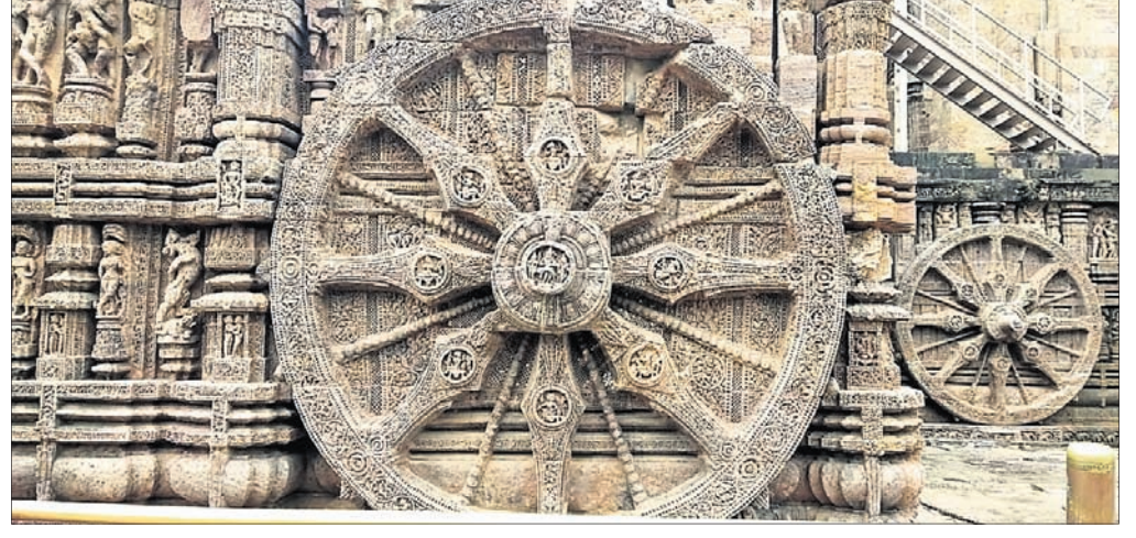
କୋଣାର୍କ ଚକର କେନ୍ଦ୍ରରେ ଶ୍ରୀନୃସିଂହଙ୍କର ଅର୍ପୂର ତଥା ବିରଳ କଳାକୃତି ।

ଓଡ଼ିଶାର ସାମରିକ ବାହିନୀ ପୁରୀରୁ ବାହାରିଲେ, ପୁରୀରୁ ବାହାରିବାର ପରମ୍ପରା ଥିଲା । ଏହା ଏକ ସାହସିକ ଯାତ୍ରାର ଉଦ୍ଧାପନା ଦୃଷ୍ଟିକୋଣରୁ ବାଦ୍ୟ । ଠିକ୍ ସେହିପରି ମନ୍ଦିର ନିର୍ମାଣ ସମୟରେ ଅତ୍ୟନ୍ତ କଠିନ କାର୍ଯ୍ୟ କଲାବେଳେ ଉଚ୍ଚ ଶବ୍ଦରେ ବାଦ୍ୟ ବଜାଯାଉଥିଲା । ଏହା ଆମକୁ କୋଣାର୍କଠାରେ ମନ୍ଦିର ନିର୍ମାଣ ସମୟରେ ଲେଖାଯାଇଥିବା 'ପୋଥି'ରୁ ମିଳେ । ମନ୍ଦିର ଉପରକୁ ବଡ଼ ବଡ଼ ପଥର ଉଠାଇବା କଷ୍ଟକାର୍ଯ୍ୟ ଥିଲା, ଅତ୍ୟନ୍ତ ସାହସିକ ପଦକ୍ଷେପ ବି ଥିଲା । ସେପରି କାର୍ଯ୍ୟ ଆରମ୍ଭ ସମୟରେ ଶିଳ୍ପୀ, ପଥୁରିଆ, ସୁଆଁସିଆ ଓ ଭେଞ୍ଜିଆ ଶ୍ରମିକମାନଙ୍କୁ ଉତ୍ସାହିତ କରିବା ପାଇଁ ବାଦ୍ୟ ବଜାଯାଉଥିଲା । ବାଜାବାଲା ପାଉଣା ନେଇ ପ୍ରସ୍ତୁତ ରହୁଥିଲେ । ସେହିପରି କଷ୍ଟକର କାମଟିଏ ଭଲରେ କିପରି ନିର୍ବାହ ହେବ, ବାଧାବିଘ୍ନ ରହିବନି, ସେଥିପାଇଁ ସମସ୍ତଙ୍କର ଆତ୍ମା ଓ ବିଶ୍ୱାସ ପ୍ରତି ନଜର ଦିଆଯାଉଥିଲା । ଶ୍ରୀନୃସିଂହ ଦେବତାଙ୍କୁ ଶିଳ୍ପୀମାନେ ଇଷ୍ଟ ରୂପେ ଗ୍ରହଣ କରିଥିଲେ । ତେଣୁ ତାଙ୍କ ପାଖରେ ମାନସିକ କରାଯାଉଥିଲା- ଭଲରେ ଭଲରେ... ବିନା ବାଧାରେ ନିର୍ମାଣ ବେଳେ କଠିନ କାମଟି ହୋଇଯାଉ । କାମଟି ସମ୍ପୂର୍ଣ୍ଣ ହୋଇଯିବା ପରେ ଭୋଗରାଗ ବି କରୁଥିଲେ । ଏହି ବୁଦ୍ଧିଯାକ ଘଟଣା ଘଟିଥିଲା । ଶ୍ରୀପଦ୍ମବେଦନ ମନ୍ଦିରର ଶୀର୍ଷକୁ ଯେତେବେଳେ ବିରାଟ ପଥର ସିଂହପୂର୍ଣ୍ଣ