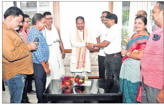
ଜିଲା ଓକିଲ ସଂଘ ପକ୍ଷରୁ ଉପବାଚସ୍ପତିଙ୍କୁ ସମ୍ବର୍ଦ୍ଧନା କରାଯାଇଛି ।

ସୁନ୍ଦରଗଡ଼ ଜିଲା କୁନ୍ତା ବ୍ଲକ କଟକ ପଞ୍ଚାୟତ ଛାତ୍ରୀପଞ୍ଚାୟତର ପ୍ରାଥମିକ ବିଦ୍ୟାଳୟର ଅବସ୍ଥା ଅତ୍ୟନ୍ତ ଶୋଚନୀୟ ହୋଇପଡ଼ିଛି । ଶ୍ରେଣୀ ଗୁହ ଛାତ୍ରୀଙ୍କୁ ଖୁସିପୁସ୍ତକ ଏବଂ ବିଦ୍ୟାଳୟର ଛାତ୍ରୀଛାତ୍ରୀଙ୍କୁ ସେଠାରୁ ୨ କିଲୋମିଟର ଦୂରରେ ଥିବା ଶାନ୍ତା ଦେବୀ ଉଚ୍ଚ ବିଦ୍ୟାଳୟକୁ ସ୍ଥାନାନ୍ତରଣ କରାଯାଇ ପାଠ ପଢ଼ାଯାଇଛି । ଏହି ପୁରାତନ ବିଦ୍ୟାଳୟ ବିଭିନ୍ନ ସମସ୍ୟା ମଧ୍ୟରେ ଗତି କରୁଥିବା ବେଳେ ପ୍ରଥମ ଶ୍ରେଣୀରୁ ପଞ୍ଚମ ପର୍ଯ୍ୟନ୍ତ ୨୭ ଜଣ ଛାତ୍ରୀଛାତ୍ରୀ ପାଠ ପଢୁଛନ୍ତି । ୨ ଜଣ ଶିକ୍ଷୟିତ୍ରୀ ପାଠ ପଢ଼ାଇବା ପାଇଁ ନିଯୁକ୍ତ ଅଛନ୍ତି । ବିଦ୍ୟାଳୟରେ ୨ଟିଶ୍ରେଣୀ ଗୁହ ସହ ଗୋଟିଏ ଅଫିସ୍ ଓ ରୋଷେଇ ଗୁହ ରହିଛି । ହେଲେ ଶ୍ରେଣୀ ଗୁହ ସମେତ