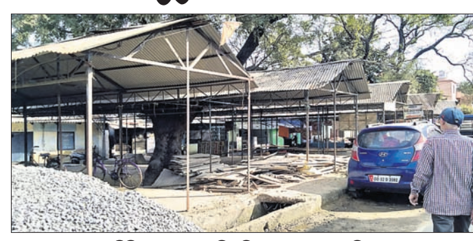
ପିଣ୍ଡି ଉପରେ ଗୋଡ଼ି, ସିମେଣ୍ଟ ଗଦା ହୋଇଛି।

ରାଉରକେଲାରେ ରାସ୍ତାକଡ଼ ବ୍ୟବସାୟୀଙ୍କୁ ଅଧିକାଂଶ ସମୟ ପାଇଁ ଆରବ୍ ମୁଦି ପକ୍ଷରୁ ଭେକ୍ଟିଂଜୋନ ମାର୍କେଟ ଓ ପିଣ୍ଡି ନିର୍ମାଣ କରାଯାଇଛି। ହେଲେ ପିଣ୍ଡିରୁଟିକ ବାଲି, ସିମେଣ୍ଟ, ଗୋଡ଼ି ବ୍ୟବସାୟୀଙ୍କ କର୍ତ୍ତାବେ ଥିବା ଦେଖିବାକୁ ମିଳିଛି। ଏଭଳି ଦୁର୍ଘାତ ପାନପୋଷର ଶୁକ୍ରବାର ହାଟରେ ଦେଖିବାକୁ ମିଳିଛି। ୨୦୧୮ରେ ଆରବ୍ ମୁଦି ପକ୍ଷରୁ ଭେକ୍ଟିଂଜୋନ ନିର୍ମାଣ ହେଲା। ୫୫ ପିଣ୍ଡି ସହିତ ପାଣିଆପୁ ଓ ଶୋଚାଳୟ ବ୍ୟବସ୍ଥା କରାଗଲା। ଘ୍ନାନୀୟ ବସୁ ବ୍ୟବସାୟୀ ଏଠାରେ ପନିପରିବା ବ୍ୟବସାୟ କରିବା ସହ ଶୁକ୍ରବାର ହାଟ ପିଣ୍ଡି ଉପରେ ଘରୋଇ ସାମଗ୍ରୀ ଭଳି ବିଭିନ୍ନ ଅଞ୍ଚଳର ଲୋକେ ନିର୍ଭର କରିବାକୁ ଲାଗିଲେ। ଏଠାରେ ବେଶ୍ ଭଲ ବ୍ୟବସାୟ ହେବାକୁ ଏଠାକୁ ରାଉରକେଲା