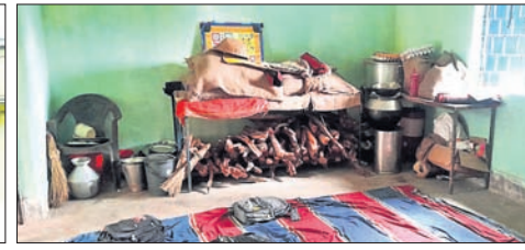
ଶ୍ରେଣୀଗୁହରେ ଜାଲେଟିକାଠି ଓ ଅନ୍ୟାନ୍ୟ ସାମଗ୍ରୀ ରହିଛି ।