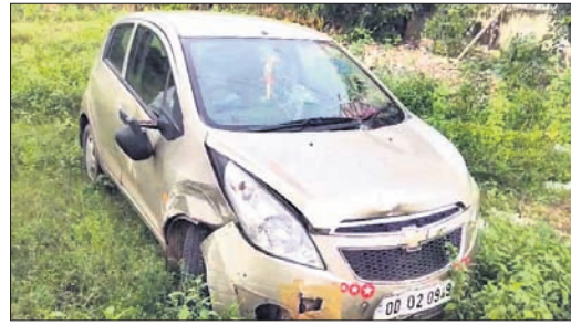
କବଚ କାର୍, ଗିରଫ ଅଭିଯୁକ୍ତ ଶୋଭନ ମହାପାତ୍ର।