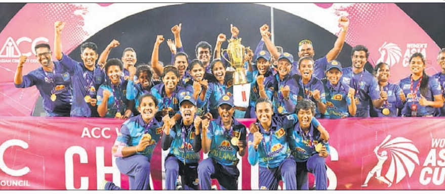
ଏସିଆ କପ୍ ଚାଲଚଳ ଶ୍ରୀଲଙ୍କା ମହିଳା ଦଳ।

କାମୁଲା, ୨୮୭ (ପି.ଟି.) ଏଠାରେ ରବିବାର ଚଳିଥିବା ଆଧିପାୟ (୨୧) ଓ ହରିଆ ସମରବିଜୁମା (୨୯)ଙ୍କ ଆକର୍ଷଣୀୟ ଅର୍ଦ୍ଧଶତକ ସହାୟତାରେ ଭାରତକୁ ଫାଇନାଲରେ ହରାଇ ଶ୍ରୀଲଙ୍କା ପ୍ରଥମ ଥର ମହିଳା ଚିତ୍ର ଏସିଆ କପ୍ ଚାଲଚଳ ହାସଲ କରିଛି। ଭାରତ ଦ୍ୱିତୀୟ ଥର ପାଇଁ ଏସିଆ କପ୍‌ରେ ଯୋଗ୍ୟ ହେବା ପରେ ଶ୍ରୀଲଙ୍କା ପ୍ରଥମ ଥର ମହିଳା ଚିତ୍ର ଏସିଆ କପ୍ ଚାଲଚଳ ହାସଲ କରିଛି।