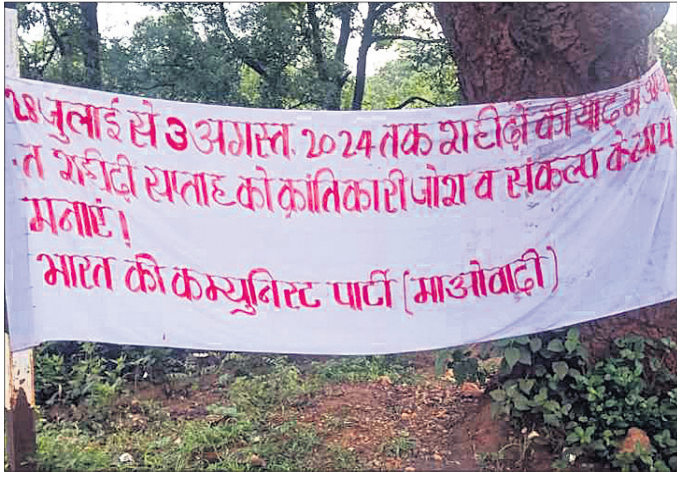
ମନୋହରପୁରର ଜରାଇକେଲା ଅଞ୍ଚଳରେ ଏକ ସ୍ଥଳରେ ମାଓବାଦୀ ପୋଷ୍ଟର ଲାଗିଛି ।

ଓଡ଼ିଶା-ଝାଡ଼ଖଣ୍ଡ ସୀମାନ୍ତରେ ମାଓବାଦୀ ଉପଦ୍ରବ ବୃଦ୍ଧି ପାଇବାରେ ଲାଗିଛି । ଜୁଲାଇ ୨୮ରୁ ଅଗଷ୍ଟ ୩ ପର୍ଯ୍ୟନ୍ତ ଶହାଦ ଦିବସ ପାଳନ ପାଇଁ ତାଙ୍କରା ଦିଆଯାଇଛି । ଏହି କ୍ରମରେ