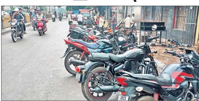
ମନ୍ଦିର ପାଖ ରୋଡ଼ ଉପରେ ବାଇକ୍ ପାର୍କିଂ ଯୋଗୁ ଗ୍ରାମିକ ସମସ୍ୟା।

ଝାରସୁଗୁଡ଼ା ସହରର ଅନେକ ସ୍ଥାନରେ ଦୀର୍ଘ ବର୍ଷରୁ ଗ୍ରାମିକ ସମସ୍ୟା ବିପର୍ଯ୍ୟୟ ହୋଇପଡ଼ିଛି। ସହରର ବୁଲ ପାର୍ଶ୍ୱରେ ଥିବା ଦୋକାନୀ ବେଆଇନ ଭାବେ ରୋଡ଼ ଉପରକୁ ମାଡ଼ି ବସିଛନ୍ତି। ଦୋକାନୀଗୁଡ଼ିକ ସମ୍ପୂର୍ଣ୍ଣରେ ସାଧାରଣତଃ ଫୁଟପାଥ ଭାବେ ବ୍ୟବହାର କରାଯାଇଥାଏ। ଏହା ଉପରେ ମୋଟରଯାନକଲ ମଧ୍ୟ ପାର୍କିଂ ହୋଇଥାଏ। ମାତ୍ର କେତେକ ଦୋକାନୀ ଏହାକୁ ଅବରୋଧ କରିବା ଯୋଗୁ ଗ୍ରାମିକ ସମସ୍ୟା ବୃଦ୍ଧି ହେଉଛି। ଫଳରେ ଶନିବାର ଧର୍ମଶାଳା ଛକରେ ଥିବା ଶନି ମନ୍ଦିର ଓ ମଙ୍ଗଳବାର ଧର୍ମଶାଳା ଛକ ଏଥିରୁ ବାଦ ପଡ଼ିନାହିଁ। ପ୍ରତି ରେଳ ଷ୍ଟେଶନ ଛକରେ ଥିବା କନକ