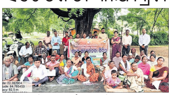
କୃଷି ସଚେତନତା କାର୍ଯ୍ୟକ୍ରମରେ ଉପସ୍ଥିତ ଗ୍ରାମବାସୀ । କୁଆଁରପୁଣ୍ଡା, ୨୮/୭ (ମହେନ୍ଦ୍ର କୁମାର ସାହୁ) କୃଷକମାନଙ୍କର ଆର୍ଥିକ ମେରୁଦଣ୍ଡ ସୁଦୃଢ଼ ନିମନ୍ତେ ପ୍ରାଧିକାରୀଙ୍କ ପକ୍ଷରୁ ବାମୀ, ଉଠା ଜଳସେଚନ, ଫସଲ ବିଭିନ୍ନକରଣ ଉପରେ ଆଲୋଚନା କରିଥିଲେ । ଏଥିରେ ଉପସ୍ଥିତ ଥିବା ଅନ୍ୟମାନେ ଉପସ୍ଥିତ ରହି ସମସ୍ତ କାର୍ଯ୍ୟ ସୁଚାରୁରୂପେ ସଞ୍ଚାଳନ କରିଥିଲେ । ସ୍ଥାନୀୟ ଅଞ୍ଚଳର ବହୁ କୃଷକ ଏଥିରେ ଅଂଶ ଗ୍ରହଣ କରି କୃଷି ଯୋଜନା ପ୍ରଦେଶୀ ନାଏକ ଯୋଗଦେଇ କୃଷି ଓ