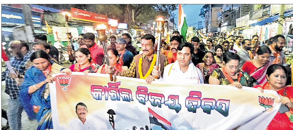
ମଶାଳ ଶୋଭାଯାତ୍ରାରେ ଝାରସୁଗୁଡ଼ା ବିଧାୟକ ଓ ବରଗଡ଼ ଏମ୍ପିଏ ସହ ଭାଙ୍ଗପାଟ ଅଧ୍ୟକ୍ଷ କର୍ମୀମାନେ ଉପସ୍ଥିତ ଅଛନ୍ତି।