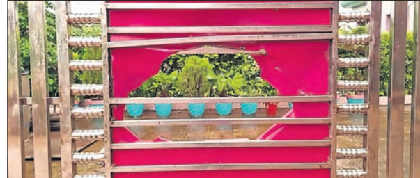
ବୋମା ମାଡ଼ରେ କ୍ଷତିଗ୍ରସ୍ତ ହୋଇଥିବା ଘରର ମୁଖ୍ୟ ପାଟକ।