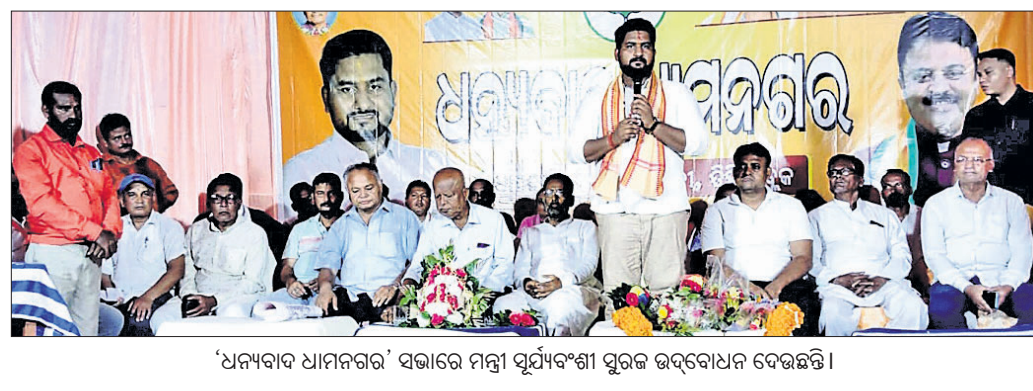
'ଧନ୍ୟବାଦ ଧାମନଗର' ସଭାରେ ମନ୍ତ୍ରୀ ସୂର୍ଯ୍ୟବଂଶୀ ସ୍ୱରୂପ ଉଦ୍‌ଘୋଷଣା କରୁଛନ୍ତି ।