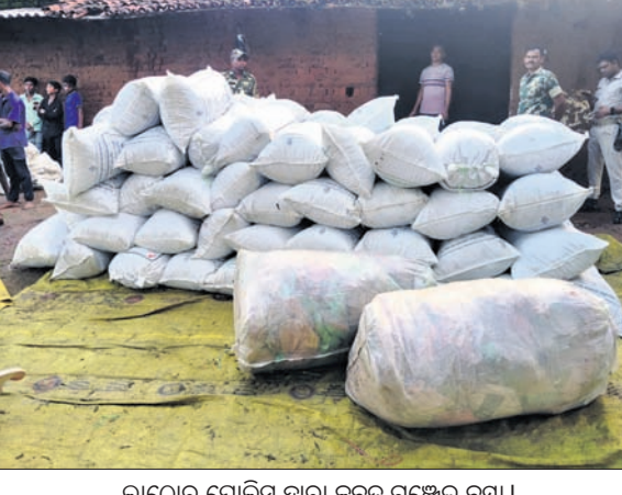
ଲାଠୋର ପୋଲିସ୍ ଦ୍ୱାରା ଜବତ ଗଞ୍ଜେଇ ବସ୍ତା।

ରିଭିଭର ସକାଳେ ବଲାଙ୍ଗୀର ଜିଲ୍ଲା ଲାଠୋର ପୋଲିସ୍ ସମ୍ପର୍କ ସ୍ଥାନୀୟ ଝଲିଆଳି ଗ୍ରାମର ପତ୍ରପତ୍ର ନିକଟରେ ଚଢ଼ାଇ କରାଯାଇ ୧୩ କୁଇଣ୍ଟାଲ ୧୦ କେଜି ଗଞ୍ଜେଇ ଜବତ ହୋଇଛି। ଏହି ଘଟଣାରେ ୩ ଜଣ ଅଭିଯୁକ୍ତ ଗିରଫ କରାଯାଇଛି। ଏହାଛଡ଼ା ଗଞ୍ଜେଇ ଚାଲାଣରେ ବ୍ୟବହୃତ ପିକ୍‌ଅପ ଭ୍ୟାନ୍ ଓ ଦୁଇଟି ବାଇକ୍ ଜବତ ହୋଇଛି। ପ୍ରକାଶ ଦେ, କନ୍ଧମାଳ ଅଞ୍ଚଳରୁ ଏକ ଧନା ରଙ୍ଗର ପିକ୍‌ଅପ ଭ୍ୟାନ୍ (ନଂ. ଓଡ଼ି-୦୩-ଏସ-୪୮୯୨) ଯୋଗେ ୮୦ ବସ୍ତା ଗଞ୍ଜେଇ ବଲାଙ୍ଗୀରର ଲାଠୋର ବେଳ ନୂଆପଡ଼ା ଜିଲ୍ଲା ଅଭିଯୁକ୍ତ ଗୋରା ଚାଲାଣ ହେଉଥିଲା। ଏ ସମ୍ପର୍କରେ କୌଣସି ବିଶ୍ୱାସ ପୁସ୍ତକ ଖବର ପାଇ ଲାଠୋର ପୋଲିସ୍ ଜରି ରହି ଉକ୍ତ ଭ୍ୟାନ୍‌କୁ ଝଲିଆଳି ପତ୍ରପତ୍ର ଠାରେ ଧରିଥିଲା। ଭ୍ୟାନ୍ ଡ୍ରାଇଭର ଫେରାର ହୋଇ ଯାଇଥିବା ବେଳେ ଏହି ଗାଡ଼ିକୁ