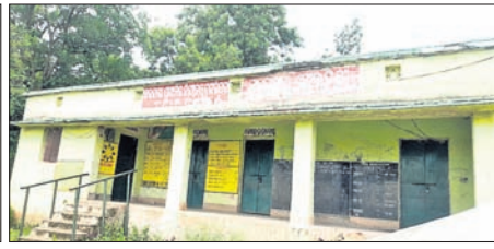
ଛାତ୍ରୀ ପଢୁଛନ୍ତି ପ୍ରାଥମିକ ବିଦ୍ୟାଳୟରେ ତାଲା ପଢୁଛନ୍ତି ।