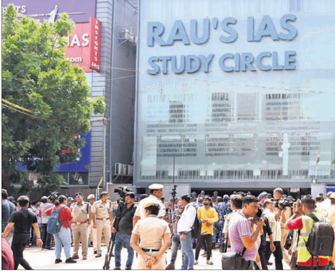
ନୂଆଦିଲ୍ଲୀର ଓଲ୍ଲ ରାଜ୍ୟେ ନଗରସ୍ଥିତ ରାଓଏ ଆଇଏଏସ୍ ସ୍ମୃତି ସର୍କଲ୍ ବାହାରେ ପୋଲିସ୍ କର୍ମଚାରୀମାନେ ଛିଡ଼ା ହୋଇଛନ୍ତି