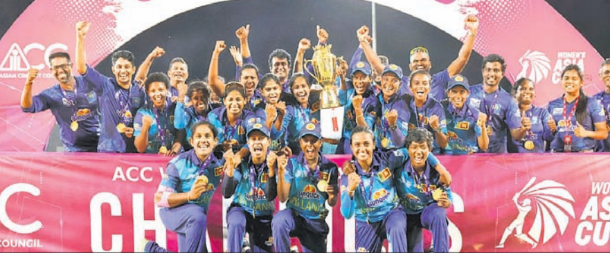
ଏସିଆ କପ୍ ଚାଲଚଳ ଶ୍ରୀଲଙ୍କା ମହିଳା ଦଳ।

ବାୟୁକା, ୨୮୭ (ପି.ଟି.) ଏଠାରେ ରବିବାର ଚାଲିଥିବା ଆଧିପାୟ (୨୧) ଓ ହରିଆ ସମରବିଜୁମା (୨୯) କ'ଣ ଆକର୍ଷଣୀୟ ଅର୍ଦ୍ଧଶତକ ସହାୟତାରେ ଭାରତକୁ ୮ ରଜକେଟରେ ହରାଇ ଶ୍ରୀଲଙ୍କା ପ୍ରଥମ ଥର ମହିଳା ଚିତ୍ର ୧୦ ଏସିଆ କପ୍ ଚାଲଚଳ ହାସଲ କରିଛି। ଭାରତ ବିତାୟ ଥର ପାଇଁ ଏସିଆ କପ୍ ୯ଟି ସଂସ୍କରଣ (ମହିଳା ଅନ୍ତର୍ଜାତୀୟ ଦିନିକିଆ ଓ ମହିଳା ଚିତ୍ର) ମଧ୍ୟରୁ ବିତାୟ ଥର ପାଇଁ ଚାଲଚଳ ପରାଜିତ ହୋଇଛି। ପୂର୍ବରୁ ୧୦୧୮ରେ କୁଆଲାଲମ୍ପୁରଠାରେ ବାଲ୍ୟଦେଶ ବିପକ୍ଷ ପାଇଁ ଚାଲଚଳ ମ୍ୟାଚରେ ପରାଜିତ ହୋଇଥିଲା।