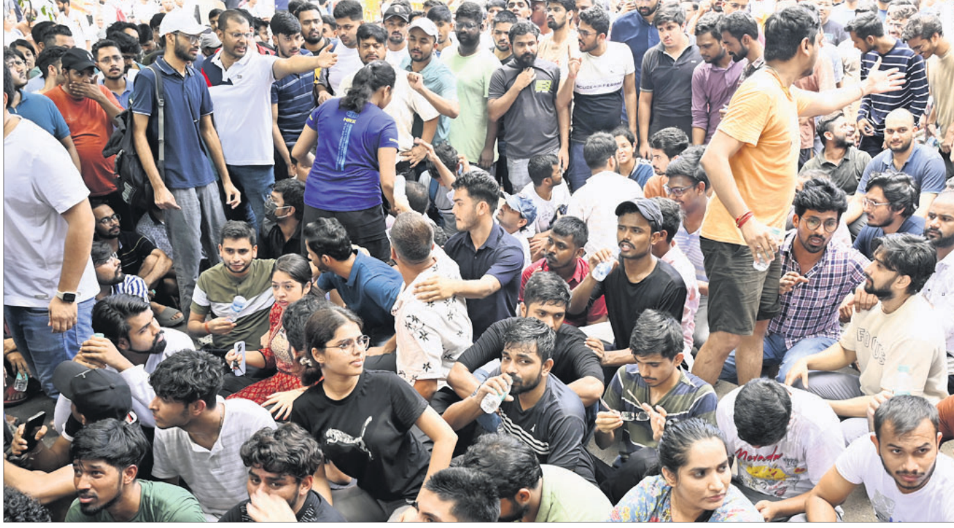
କୋଟି ସେଝର ସମ୍ମୁଖରେ ରବିବାର ସିଉଲ୍ ସଭିସ ଆଶାୟୀମାନେ ବିକ୍ଷୋଭ ପ୍ରଦର୍ଶନ କରୁଛନ୍ତି।

ବିହାର, ଉତ୍ତର ପ୍ରଦେଶ, ମଧ୍ୟପ୍ରଦେଶ ଓ ଦକ୍ଷିଣ ଭାରତରୁ ପ୍ରତିବର୍ଷ ଅନେକ ଲକ୍ଷ ପିଲା ଦିଲ୍ଲୀର ରାଜ୍ୟେ ନଗର ଓ ପୁଣ୍ୟାଳୀ ନଗରରେ ଥିବା କୋଟି ସେଝରଗୁଡ଼ିକରେ ପଢ଼ିବା ପାଇଁ ଆସିଥାନ୍ତି।