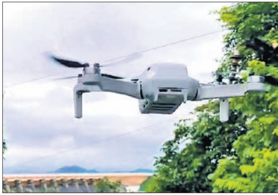
ହୀରାକୁଦ ଜଳଭଣ୍ଡାର ଉପରେ ଉଡ଼ିଲା ଡ୍ରୋନ୍ କ୍ୟାମେରା।

ହୀରାକୁଦ ଜଳଭଣ୍ଡାରର ସୁରକ୍ଷା ବ୍ୟବସ୍ଥା ନେଇ ଉଡ଼ିଲା ଡ୍ରୋନ୍। ହୀରାକୁଦ ଜଳଭଣ୍ଡାର ନିଷିଦ୍ଧାଞ୍ଚଳରେ ଉଡ଼ିଲା ଡ୍ରୋନ୍ କ୍ୟାମେରା। ସମ୍ପୂର୍ଣ୍ଣ ଜଳଭଣ୍ଡାର, ଲିଫ୍ଟ୍ ଅପରେଟର ଗ୍ୟାଲେରି ଆଦିର ଭିତର ଫଟୋ ଓ ଭିଡିଓ ଭାଇରାଲ ହୋଇଛି।