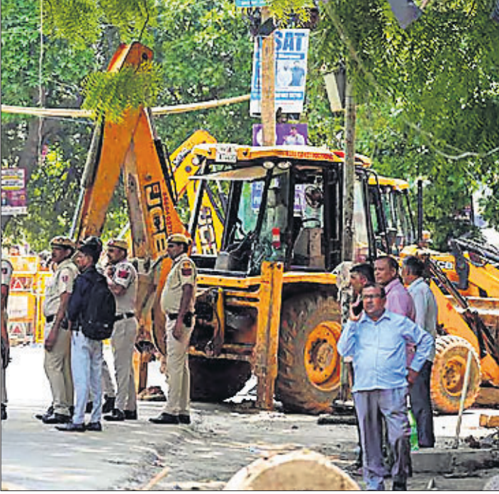
ନୂଆଦିଲ୍ଲୀର ଓଲ୍ଲ ରାଜକେନ୍ଦ୍ର ନଗର ଅଞ୍ଚଳରେ ସୋମବାର ଭଗବତ୍ ସହ ଜଡ଼ିତ ଦୁର୍ନୀତି ମାମଲାରେ ଦିଲ୍ଲୀ ମୁଖ୍ୟମନ୍ତ୍ରୀ ଅରବିନ୍ଦ କେନ୍ଦ୍ରିୟାଳୟ ଜାମିନ ଆବେଦନ ଉପରେ ଦିଲ୍ଲୀ ହାଇକୋର୍ଟ ସଂରକ୍ଷିତ ରଖିଛନ୍ତି।