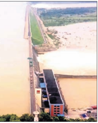
ହୀରାକୁଦ ଜଳଭଣ୍ଡାରର ଦୃଶ୍ୟ।

ହୀରାକୁଦ ଜଳଭଣ୍ଡାର ଉପରେ ଉଡ଼ିଲା ଡ୍ରୋନ୍ କ୍ୟାମେରା। ଏବଂ ଡ୍ରୋନ୍ କ୍ୟାମେରାକୁ ଉଡ଼ାଇବା ନିଷିଦ୍ଧାଞ୍ଚଳରେ ତିପ୍ପୁ ଆଇଜିକ୍ସଠାରୁ ଆରମ୍ଭ କରି ଜିଲ୍ଲାପାଳ, ଆରକ୍ଷା ଅଧିକାରୀ ଓ ଅନ୍ୟାନ୍ୟ ପ୍ରଶାସନିକ ଅଧିକାରୀଙ୍କ ଉପସ୍ଥିତିରେ ସୁରକ୍ଷା ଗୋଲାମାଲିଆକୁ ହୀରାକୁଦ ଜଳଭଣ୍ଡାର କର୍ତ୍ତୃପକ୍ଷଙ୍କ ସମ୍ମୁଖରେ ଡ୍ରୋନ୍ ମାଧ୍ୟମରେ ଜଳଭଣ୍ଡାରର ସମ୍ପୂର୍ଣ୍ଣ ନିଷିଦ୍ଧାଞ୍ଚଳ ଅଞ୍ଚଳ ଫଟୋ ବା ଭିଡିଓ ଭାଇରାଲରେ ସାମିତ ନ ଥିଲା।