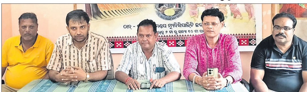
ଆୟୋଜିତ ଖବରଦାତା ସମ୍ମିଳନୀରେ ସମ୍ବଲପୁରୀ ଏକତା ମଞ୍ଚ କର୍ମଚାରୀ।