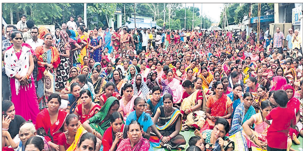
ଜିଲାପାଳଙ୍କ ଅଧିକ ଆଗରେ ବିଶାଳ ଜନ ସମାବେଶ।

ସରକାରଙ୍କ ଜବରଦଖଲ ଭଣ୍ଡେଇ ବିଜ୍ଞପ୍ତିକୁ ପ୍ରତ୍ୟାହାର ଓ ସ୍ଥାୟୀ ପଟା ପ୍ରଦାନ ଦାବିରେ ମଙ୍ଗଳବାର ଜନମ ମାଟି ପ୍ରଦେଶ ସଂଗ୍ରାମ ସମିତି ପକ୍ଷରୁ ଭବାନୀପାଟଣାରେ ବିଶାଳ ଜନ ସମାବେଶ ଅନୁଷ୍ଠିତ ହୋଇଥିଲା।