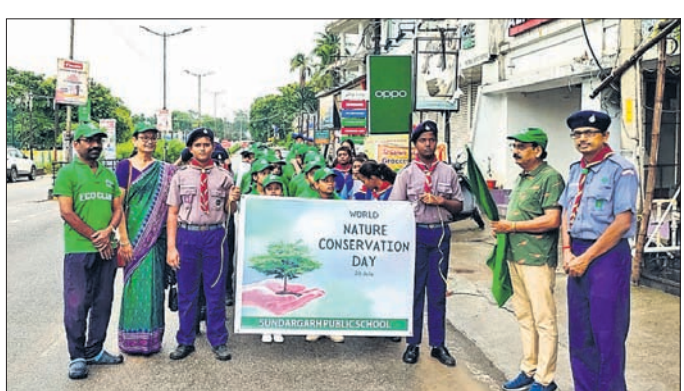
ବିଶ୍ୱ ପ୍ରକୃତି ସଂରକ୍ଷଣ ଦିବସରେ ଛାତ୍ରଛାତ୍ରୀ ସାମିଲ ହୋଇଥିଲେ।

ସୁନ୍ଦରଗଡ଼ ପବ୍ଲିକ ସ୍କୁଲରେ ବିଶ୍ୱ ପ୍ରକୃତି ସଂରକ୍ଷଣ ଦିବସ ପାଳିତ ହୋଇଥିଲା। ସୁନ୍ଦରଗଡ଼ ପବ୍ଲିକ ସ୍କୁଲରେ ବିଶ୍ୱ ପ୍ରକୃତି ସଂରକ୍ଷଣ ଦିବସ ପାଳିତ ହୋଇଥିଲା।