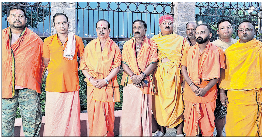
ସମଲେଶ୍ୱରୀ ମନ୍ଦିର ସମ୍ମୁଖରେ ଅଧ୍ୟକ୍ଷ ପୂଜକମାନେ।

ସମ୍ବଲପୁର ଜିଲ୍ଲା ରେଜିଷ୍ଟ୍ରାର କର୍ମଚାରୀମାନେ ପିକଅପ୍ ଜବଟ କରିବା ପାଇଁ ଯୋଜନା କରୁଥିଲେ। କର୍ମଚାରୀମାନେ ପିକଅପ୍ ଜବଟ କରିବା ପାଇଁ ଯୋଜନା କରୁଥିଲେ। କର୍ମଚାରୀମାନେ ପିକଅପ୍ ଜବଟ କରିବା ପାଇଁ ଯୋଜନା କରୁଥିଲେ।