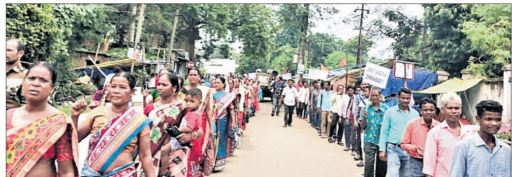
ବାମରା ତହସିଲ ଅଧିକାରୀଙ୍କୁ ସମ୍ମୁଖରେ ଶୋଭାଯାତ୍ରାରେ ସାମିଲ ମହିଳା ସମୂହ।