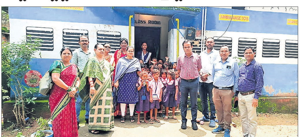
ଉତ୍ସାହୀନ ଉତ୍ସାହି କେନ୍ଦ୍ରରେ ଜିଲାପାଳ ଓ ଅନ୍ୟ ପଦାଧିକାରୀ।

କଲମପୁର, ୩୦୭(ଗଣେଶଚରଣ ଦାଶ): କଳାହାଣ୍ଡି ଜିଲା କଲମପୁର ବ୍ଲକ ଅନ୍ତର୍ଗତ ବାବୁ କେନ୍ଦ୍ରରୁ ଉତ୍ସାହୀନ ଉତ୍ସାହି କେନ୍ଦ୍ରକୁ ଉଦ୍ଘାଟନା କରିବା ପାଇଁ ଜିଲାପାଳ ଓ ଅନ୍ୟ ଅଧିକାରୀଗଣ ସମ୍ମାନୀୟତା ସହିତ ଉପସ୍ଥିତ ହୋଇଥିଲେ।