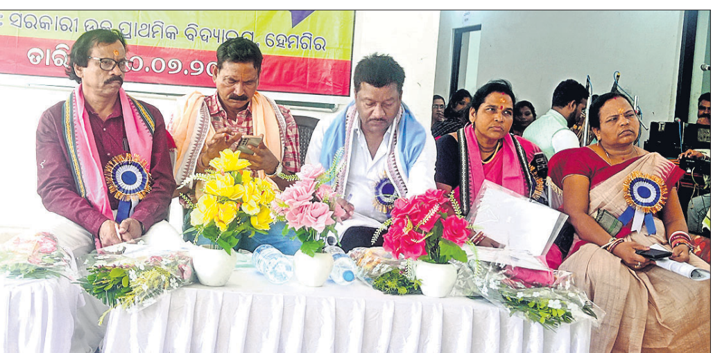
ପ୍ରଧାନ ଶିକ୍ଷକ ସମ୍ମିଳନୀ କାର୍ଯ୍ୟକ୍ରମରେ ଉପସ୍ଥିତ ଅତିଥି।

ସୁନ୍ଦରଗଡ଼ ଜିଲା ହେମବିରସ୍ଥିତ ସରକାରୀ ଉଚ୍ଚ ମାଧ୍ୟମିକ ବିଦ୍ୟାଳୟରେ ଉଦ୍ଘାଟନା କରାଯାଇଥିଲା।