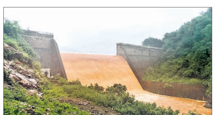
ବେହେରା ଡାମରୁ ପ୍ରଥମ ବନ୍ୟା ଜଳ ନିଷ୍କାସନ ହେଉଛି।

ବେହେରା ଡାମରୁ ପ୍ରଥମ ବନ୍ୟା ଜଳ ନିଷ୍କାସନ ହେଉଛି। କୋକସରା, ୩୦୭ (ଦୁର୍ଗା କାନ୍ତି)