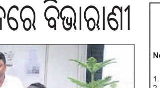
ବିଭାଗୀ ଯାତ୍ରା ଏଲ୍‌ବୁସ୍ ଆରୋହଣ ଅଭିଯାନର ଶୁଭାରମ୍ଭ କରୁଛନ୍ତି।

ଡେକାନାଲ ଜିଲାର ପର୍ବତାରୋହଣୀ ବିଭାଗୀ ଯାତ୍ରା ଯୁବରାପ ମହାଦେଶର ରଥାସାହିତ ସର୍ବୋଚ୍ଚ ଚିରିଶୁଙ୍ଗ ମାଉଣ୍ଡ ଏଲ୍‌ବୁସ୍ ଆରୋହଣ ଅଭିଯାନର ମଙ୍ଗଳକାରୀ ଶୁଭାରମ୍ଭ କରିଛନ୍ତି।