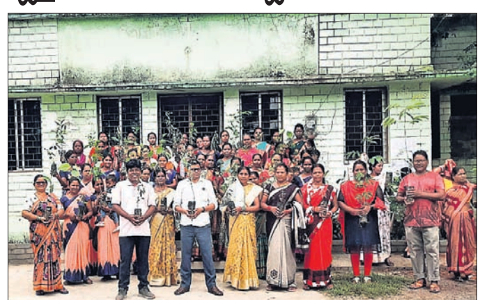
ଚାରା ରୋପଣ କାର୍ଯ୍ୟକ୍ରମରେ ସାମିଲ ଲୋକେ।

କୁତ୍ରା ପଞ୍ଚାୟତ ପକ୍ଷରୁ ବନ ମହୋତ୍ସବ ପାଳିତ ହୋଇଥିଲା। କୁତ୍ରା ପଞ୍ଚାୟତ ପକ୍ଷରୁ ବନ ମହୋତ୍ସବ ପାଳିତ ହୋଇଥିଲା। କୁତ୍ରା ପଞ୍ଚାୟତ ପକ୍ଷରୁ ବନ ମହୋତ୍ସବ ପାଳିତ ହୋଇଥିଲା।