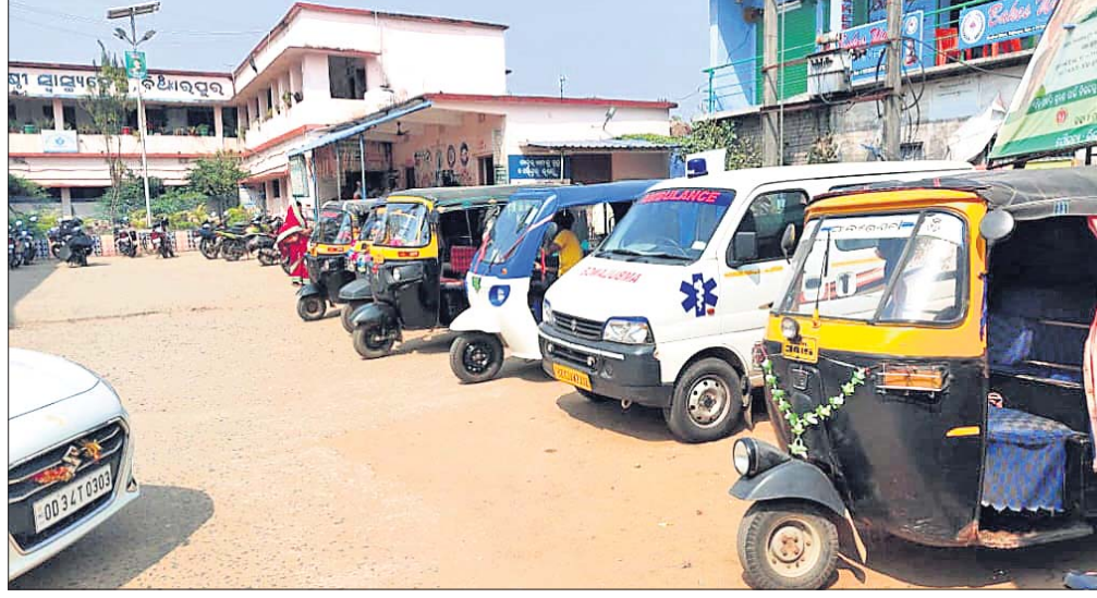
ବିଜ୍ଞାନପୁର ଗୋଷ୍ଠୀ ସ୍ୱାସ୍ଥ୍ୟକେନ୍ଦ୍ର ପରିସରରେ ପାର୍କିଂ ହୋଇଥିବା ଗାଡ଼ି ।

ବିଜ୍ଞାନପୁର ଗୋଷ୍ଠୀ ସ୍ୱାସ୍ଥ୍ୟକେନ୍ଦ୍ର (ସିଏଚ୍‌ସି) ବିଜ୍ଞାନପୁର ବଜାର ନିକଟରେ ରହିଛି। ଏହି ସ୍ୱାସ୍ଥ୍ୟକେନ୍ଦ୍ର ଉପରେ ବିଜ୍ଞାନପୁର ବ୍ଲକ୍ ଅଧୀନ ୨୯ ପଞ୍ଚାୟତ ସହ ବରା ଏବଂ ଆଳି ବ୍ଲକ୍ ଲୋକେ ନିର୍ଭର କରନ୍ତି। କିନ୍ତୁ ଦୁଃଖର ବିଷୟ ଏହି ସ୍ୱାସ୍ଥ୍ୟକେନ୍ଦ୍ର ରୋଗୀ ନେଇ ଆସୁଥିବା ଆଲୁମିନିୟମ ଡାକ୍ତରଖାନା ପରିସରକୁ ପ୍ରବେଶ କରିବାରେ ବିଳମ୍ବ ହେଉଛି। ଏହାର ମୁଖ୍ୟ କାରଣ ପାଇଚିଫି ବେଆଇନ ଗାଡ଼ି ପାର୍କିଂ। ଡାକ୍ତରଖାନାକୁ ଆସୁଥିବା ରୋଗୀଙ୍କ ସମ୍ପର୍କରେ ମନଇଚ୍ଛା ଡାକ୍ତରଖାନା ପରିସରରେ ଗାଡ଼ି ରଖିଛନ୍ତି। ସେହିପରି ଭଡ଼ା ଗାଡ଼ିଚାଳକ ସ୍ୱାସ୍ଥ୍ୟକେନ୍ଦ୍ର ପରିସରରେ