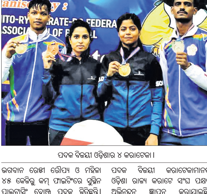
ପଦକ ବିଜୟୀ ଓଡ଼ିଶାର ୪ କରାଟେକା।

ଭୁବନେଶ୍ୱର, ୩୦୭ (ତପନ ସ୍ୱାଇଁ) କୋଲକାତାର ନେତାଜୀ ଇନ୍ଦ୍ରଜିତ ସ୍ମୃତିସମ୍ମାନ ଅନୁଷ୍ଠିତ ୮ମ ଇଣ୍ଡିଆନ୍ ବ୍ୟାଲେଜର୍ସ କପ୍ ଅନ୍ତର୍ଜାତୀୟ କରାଟେ ପ୍ରତିଯୋଗିତାରେ ଓଡ଼ିଶା କରାଟେକାମାନେ ମୋଟ ୪ଟି ପଦକ ହାସଲ କରିଛନ୍ତି। ଏହା ମଧ୍ୟରେ ୨ ସ୍ୱର୍ଣ୍ଣ