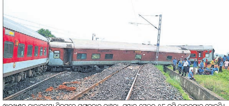
ଝାଝନାଡ଼ର ବାରାବାସ୍ୟା ନିକଟରେ ମଙ୍ଗଳବାର ହାଓଡ଼ା-ମୁୟାଲ ମେଲ୍ ୧୮ ବର୍ଷ ଲାଲନଗୁଡ଼ ହୋଇଛି।

ବର୍ଷକ ତଳେ ବାଲେଶ୍ୱର ଜିଲ୍ଲା ବାହାନଗା ଷ୍ଟେଶନ ନିକଟରେ ଟ୍ରେନ୍ ଦୁର୍ଘଟଣାରେ ୨୯୦ରୁ ଊର୍ଦ୍ଧ୍ୱ ଯାତ୍ରୀଙ୍କ ମୃତ୍ୟୁ ଘଟିଥିଲା। ଗତ ୬ ସପ୍ତାହ ମଧ୍ୟରେ ଦେଶର ବିଭିନ୍ନ ଭାଗରେ ଘଟିଥିବା ଅନେକ ଟ୍ରେନ୍ ଦୁର୍ଘଟଣାରେ ୧୭ ଜଣଙ୍କ ଜୀବନ ଯାଇଥିବାବେଳେ ଶତାଧିକ ଆହତ ହୋଇଛନ୍ତି। ମଙ୍ଗଳବାର ଝାଝନାଡ଼ର ବାରାବାସ୍ୟା ନିକଟରେ ହାଓଡ଼ା-ମୁୟାଲ ମେଲ୍ ୧୮ ବର୍ଷ ଲାଲନଗୁଡ଼ ହେବାରୁ ୨ ଜଣଙ୍କ ପ୍ରାଣହାନି ହୋଇଥିବାବେଳେ ୨୦ରୁ ଊର୍ଦ୍ଧ୍ୱ ଆହତ ହୋଇଛନ୍ତି। ବାରାବାସ୍ୟା ଟ୍ରେନ୍ ଦୁର୍ଘଟଣା ଘଟି ଚାଲିଥିବା ପାଇଁ ମେଲ୍ରେ ବରୋଧା ଦଳଗୁଡ଼ିକ ରେଳମନ୍ତ୍ରୀ ଅଶ୍ୱିନୀ ବୈଷ୍ଣବ ଓ କେନ୍ଦ୍ର ସରକାରଙ୍କୁ ସମାଲୋଚନା କରିଛନ୍ତି। ଝାଝନାଡ଼ର ଝାଝନାଡ଼-ଖରପୁଆ