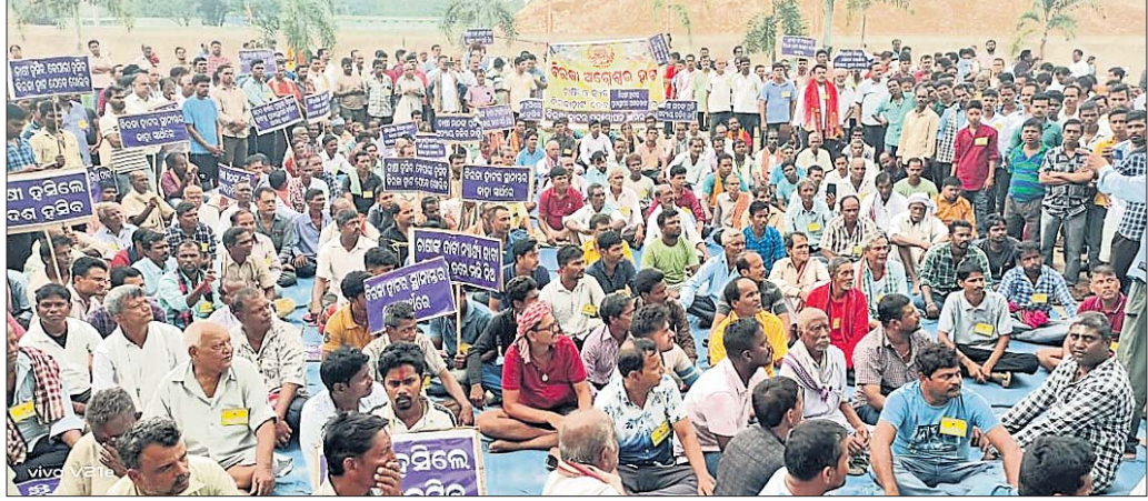
ଧାରଣାରେ ସାମିଲ ହୋଇଥିବା ବିରଜା-ଅଗ୍ନେଶ୍ୱର ହାଟ ବ୍ୟବସାୟୀ ସଂଘ କର୍ମକର୍ତ୍ତା ଓ ଅନ୍ୟମାନେ ।