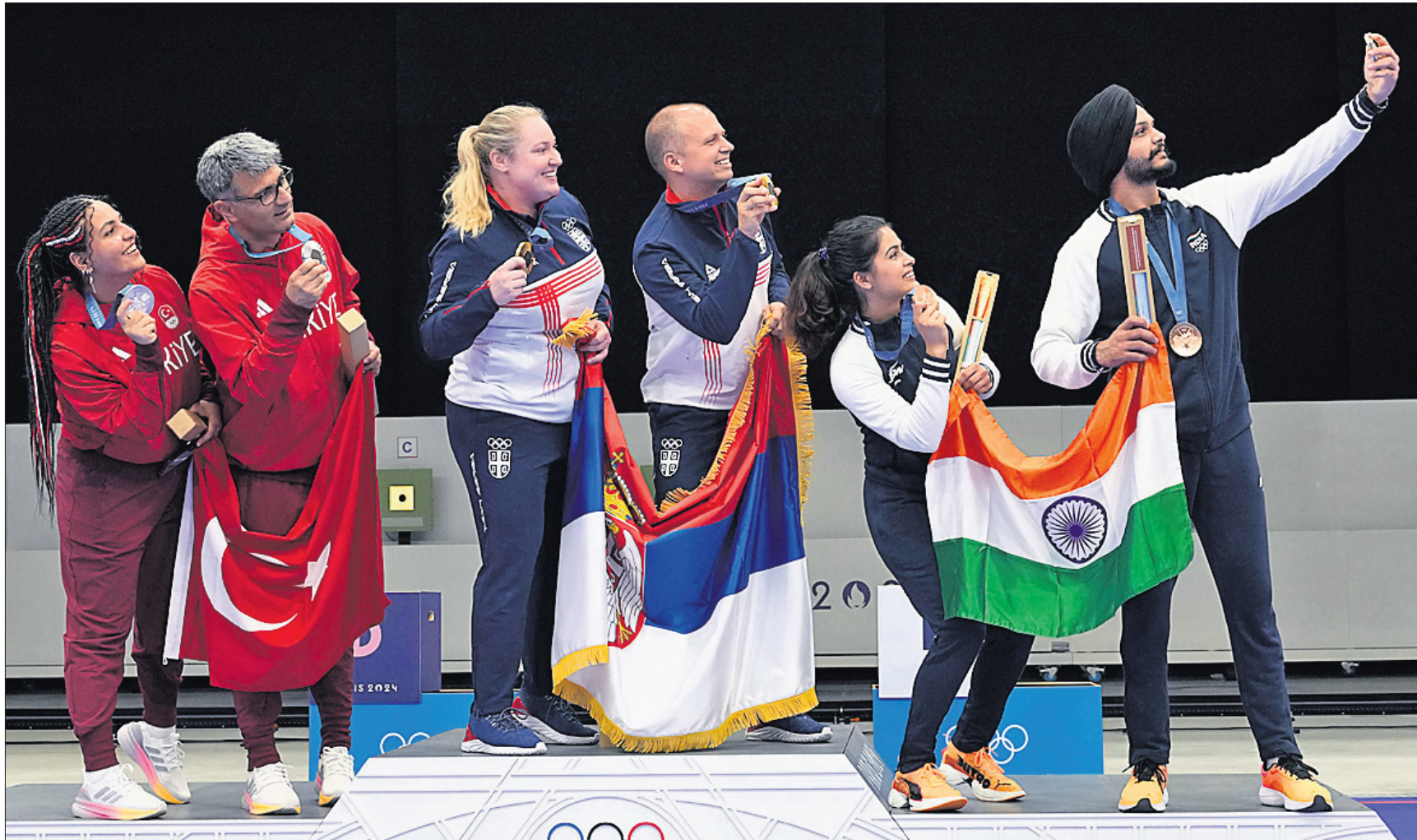
ପ୍ୟାରିସ୍ ଅଲିମ୍ପିକ୍ସରେ ୧୦ ନିର୍ଦ୍ଦେଶ ଦେଇ ପ୍ରତିନିଧିତା କରିବା ପାଇଁ ଫେନ୍ସିଂରେ ପ୍ରତିନିଧିତା କରିବା ପାଇଁ...