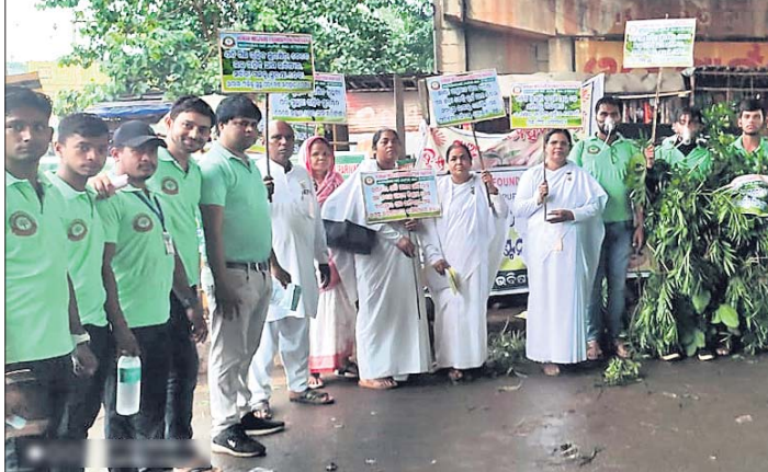
ଚାରାବଣ୍ଟନରେ ସାମିଲ ହୋଇଥିବା ହୁଏମାନ ଖେଲଫେୟାର ପାଠଶାଳା କର୍ମଚାରୀ ଓ ଅନ୍ୟମାନେ ।

କରିଛନ୍ତି । ବର୍ଷା ଆବାସରୁ ଅନେକ ସମୟରେ ଏଠାରେ ମରୁଡ଼ି ପଡ଼ିଥିବା ଦେଖାଦେଇଥାଏ । ତଳେ ବର୍ଷା ସମୟରେ ବୃଷ୍ଟିପାତ ହେତୁ କେନାଲରେ ଶୀଘ୍ର ପାଣି ଛାଡ଼ିବାକୁ ଚାଷୀମାନେ ଦାବି କରିଥିଲେ । ଗତ ୧୫ ତାରିଖରେ ହାଇଲେଭଲ ଓ ଏହାର ଶାଖା ୧୪ନମ୍ବର କେନାଲରେ ପାଣି ଛାଡ଼ିବାକୁ ଦାବି କରିଥିଲେ । କେନାଲରେ ପାଣି ଛାଡ଼ିବାକୁ ଚାଷୀମାନେ ଦାବି କରିଛନ୍ତି ।