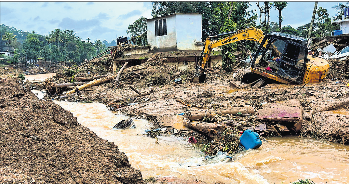
କେରଳର ଝାଝନାଡ଼ରେ ମଙ୍ଗଳବାର ଭୂସଙ୍କଳନ ଯୋଗୁ ଘରବାର ଭାସିଯାଇଛି।

କେରଳର ଝାଝନାଡ଼ ଜିଲ୍ଲାରେ ଭୟାବହ ଭୂସଙ୍କଳନରେ ଅନୁମତ ୧୨୩ ଜଣଙ୍କ ମୃତ୍ୟୁ ଘଟିଥିବାବେଳେ ୧୨୮ରୁ ଊର୍ଦ୍ଧ୍ୱ ଆହତ ହୋଇଛନ୍ତି। ସୋମବାର ରାତି ୨ଟା ଏବଂ ଭୋର ୪ଟା ୩୦ ମିନିଟ୍ ସମୟରେ ଭୂସଙ୍କଳନ ହେବାରୁ ବହୁ ଘର ଓ ଶତାଧିକ ପରିବାର ଭାସିଯିବା ସହ ବ୍ୟାପକ କ୍ଷୟକ୍ଷତି ହୋଇଛି। ମାଟି ଅତଡ଼ା ତଳେ ବହୁ ଲୋକ ପୋତିହୋଇ ରହିଥିବାରୁ ମୃତ୍ୟୁସଂଖ୍ୟା ବଢ଼ିବା ଆଶଙ୍କା କରାଯାଇଛି। ନବୀକୃତିକରେ ବନ୍ୟା ଆସିବା ସହ ଗଛ ଉପୁଡ଼ିପଡ଼ିଥିବାରୁ ଉଦ୍ଧାର କାର୍ଯ୍ୟରେ ପ୍ରତିବନ୍ଧକ ସୃଷ୍ଟି ହୋଇଛି। ଉଦ୍ଧାର କାର୍ଯ୍ୟରେ ପୋଲିସ, ଅଗ୍ନିଶମ କର୍ମଚାରୀ, ଏନଡିଆର୍ଏସ୍ ଟିମ୍ ସମେତ ୨୨୫ ଜଣ ସେନା ଯବାନ ମୃତ୍ୟୁ ହୋଇଥିବାବେଳେ ସହାୟତା ପାଇଁ ବାୟୁସେନାର ୨ଟି ହେଲିକପ୍ଟର ନିୟୋଜିତ ହୋଇଛି। ରିଲିଫ୍ କାର୍ଯ୍ୟ ପରିଚାଳନା ପାଇଁ କାଳିକଟ୍ରେ ଏକ କଣ୍ଟ୍ରୋଲ ରୁମ୍ ଖୋଲାଯାଇଛି। ଉଦ୍ଧାର କାର୍ଯ୍ୟରେ ନୌସେନାର ଏକ ଟିମ୍ ମଧ୍ୟ ସହାୟତା କରୁଥିବା କେରଳ ମନ୍ତ୍ରୀ ବାଣୀ କର୍ତ୍ତୃକ ହେଇଛନ୍ତି। ଭୂସଙ୍କଳନ ଯୋଗୁ ମୁଣ୍ଡାକାଳ, ବୁରାଲମାଳା, ଆରାମାଳା ଏବଂ ବୁଲପୁଣ୍ଡା ଗ୍ରାମ ସର୍ବାଧିକ କ୍ଷତିଗ୍ରସ୍ତ ହେବା ସହ ବାହ୍ୟଜଗତରୁ ବିଚ୍ଛିନ୍ନ ହୋଇଯାଇଥିବା ପ୍ରଶାସନ ପକ୍ଷରୁ କୁହାଯାଇଛି। ରିପୋର୍ଟ ଅନୁଯାୟୀ, ମାଟି ଅତଡ଼ା ଖସିବା ପରେ କାହୁଆ ପାଣି ମାଡ଼ିଆସିବାରୁ ମୁଣ୍ଡାକାଳ ସହର ସମ୍ପୂର୍ଣ୍ଣ ଭାସିଯାଇଛି। ଭୂସଙ୍କଳନ ଯୋଗୁ କେତେକ ଜନସମୂହର ଗତିପଥ ପରିବର୍ତ୍ତନ ହୋଇ ଜନବସତିକୁ ମାଡ଼ିଆସିବାରୁ ବ୍ୟାପକ କ୍ଷୟକ୍ଷତି ହୋଇଛି। ପାହାଡ଼ରୁ ବଡ଼ ବଡ଼ ପଥର ଖସି ରାସ୍ତା ବନ୍ଦ ହୋଇଯାଇଥିବାରୁ ଉଦ୍ଧାରକାରୀ ଟିମ୍