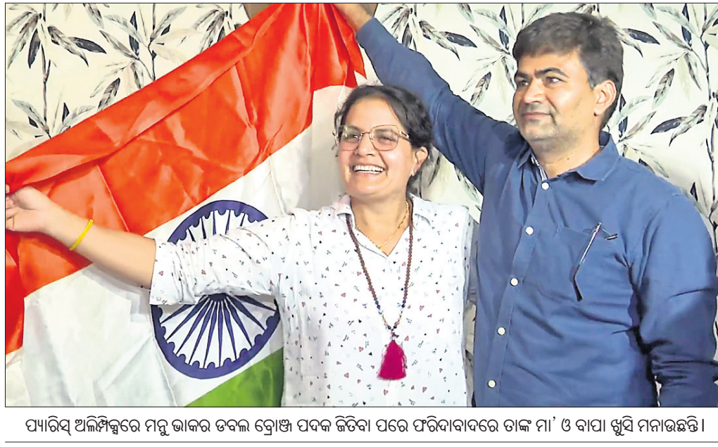
ପ୍ୟାରିସ୍ ଅଲିମ୍ପିକ୍ସରେ ମନୁ ଭାକର ତରଳ ଗୋପ୍ୟ ପଦକ ଜିତିବା ପରେ ଫରିଦାବାଦରେ ତାଙ୍କ ମା' ଓ ବାପା ଖୁସି ମନାଉଛନ୍ତି।

ସଂକ୍ଷେପରେ କ୍ୟାରିୟର ଅଲିମ୍ପିକ୍ସ-୧ ଗୋପ୍ୟ ଏସିଆନ୍ ଗେମ୍ସ-୧ ସ୍ୱର୍ଣ୍ଣ, ୧ ଗୋପ୍ୟ ବିଶ୍ୱକପ-୨ ସ୍ୱର୍ଣ୍ଣ ଏସିଆନ୍ ଚାମ୍ପିୟନଶିପ୍-୧ ସ୍ୱର୍ଣ୍ଣ, ୨ ଗୋପ୍ୟ ବିଶ୍ୱ ଚାମ୍ପିୟନଶିପ୍-୧ ସ୍ୱର୍ଣ୍ଣ, ୨ ଗୋପ୍ୟ ଜୁନିୟର ବିଶ୍ୱକପ-୧ ସ୍ୱର୍ଣ୍ଣ, ୨ ଗୋପ୍ୟ।