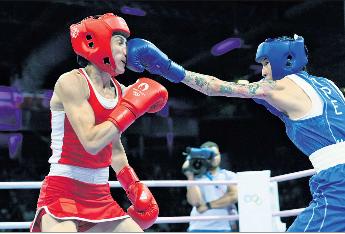
ପ୍ୟାରିସ୍ ଅଲିମ୍ପିକ୍ସର ମହିଳା ୫୪ କେଜି ପ୍ରତିଯୋଗିତାରେ ସାରାବଜୋତ୍ ସିଂହ ଓ ମନୁ ଭକରଙ୍କ ମଧ୍ୟରେ ଘଟଣାଚକ୍ର ଚାଲିଥିବା ସମୟରେ ଫଟୋ ଗ୍ରହଣ କରାଯାଇଛି।