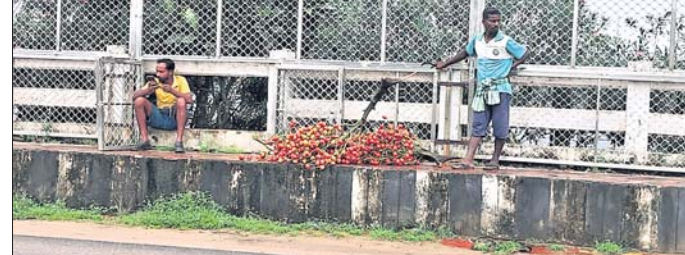
ଚୁର୍ଚ୍ଚିତମାନେ କୁସୁମାରୁ ପାମ୍ ମଞ୍ଜି ଚୋରିକରି ଫୋପାଡ଼ି ପଳାଇଛନ୍ତି ।

ସୂଚନା ଅନୁସାରେ, କୁସୁମାର ସୌନ୍ଦର୍ଯ୍ୟକରଣ ପାଇଁ ଯାଜପୁର ପୌରପାଳିକା ପକ୍ଷରୁ ରାଜ୍ୟ ବାହାରରୁ ବହୁ ମୂଲ୍ୟବାନ ଗଞ୍ଜର ଚାରା ଆଣି ରୋପଣ କରାଯାଇଥିଲା । ଆକ୍ରମଣକାରୀ ପାମ୍ ଗଞ୍ଜ ଆଣି ଲଗାଯାଇଥିବାବେଳେ ଏହି ଚାରାର ମୂଲ୍ୟ ୬୫୫ ଟଙ୍କା ଉର୍ଦ୍ଧ୍ୱ ରହିଛି । ଏହାର ସୁଯୋଗ ନେଇ ପାମ୍ ଗଞ୍ଜର ଫଳ ଓ ମଞ୍ଜିକୁ ଚାରା ଯାଜପୁର ପଶସ୍ତ୍ର ଅଞ୍ଚଳରେ ଥିବା ଏକ ନିର୍ଦ୍ଦିଷ୍ଟ ଫାର୍ମକୁ ଚୋରୀରେ ନିଆଯାଇଥିଲା । ଗଣମାଧ୍ୟମ ପ୍ରତିନିଧି ଏହା ବେଶ୍ ପ୍ରଶ୍ନ କରିବାରୁ ଏକ ଅଞ୍ଚଳରେ ଭିତ୍ତି ହୋଇଥିବା ମଞ୍ଜିକୁ କିଛି ଲୋକ ଧରି ଅଞ୍ଚଳ ଫେରାର ହୋଇ ଯାଇଛନ୍ତି ।