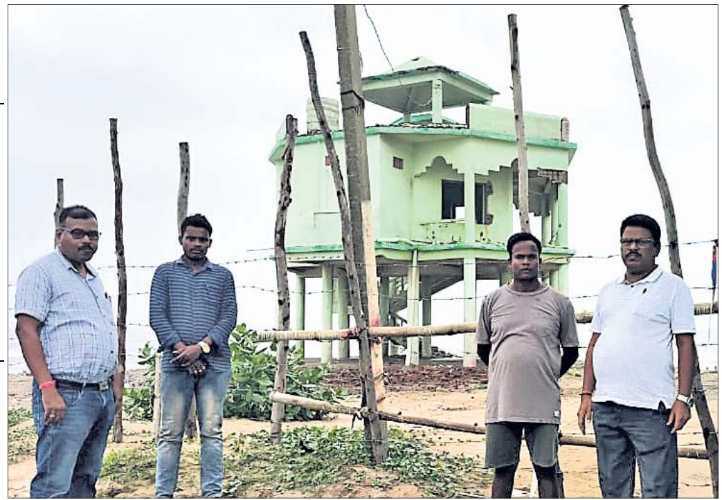
ପ୍ରଶାସନ ପକ୍ଷରୁ ବାଡ଼ ବୁଜାଯାଇ ଶିଆଳିରେ ଥିବା ଅସୁରକ୍ଷିତ ଭୂମି ଗାଝାର ଭଙ୍ଗାଯାଇଛି।

ଏରସମା, ୧୮ (ବାପୁ ଖଣ୍ଡୁଆଳ) ଏରସମା ବ୍ଲକ୍ ଅନ୍ତର୍ଗତ ପଦ୍ମପୁର ପଞ୍ଚାୟତରେ ପର୍ଯ୍ୟଟନ କ୍ଷେତ୍ର ଶିଆଳିଠାରେ ସପ୍ତମ ଜଳପତନ ଆଶାତୀତ ବୁଦ୍ଧି ପାଇଛି। ଗୁରୁବାର ଏରସମା ବ୍ଲକ୍ ପ୍ରଶାସନ ଓ ଆର ଆଇ ବି ପକ୍ଷରୁ କଡ଼ା ସୁରକ୍ଷା ମଧ୍ୟରେ ଭୁଣ୍ଡିଲା ଭୂମି ଗାଝାର ଭଙ୍ଗାଯାଇଛି। ପ୍ରଥମଦିନରେ ଭୁଣ୍ଡିଥିବା ଭୂମି ଗାଝାରକୁ ଭାଙ୍ଗିବା କାର୍ଯ୍ୟ ଆରମ୍ଭ ହୋଇଛି।