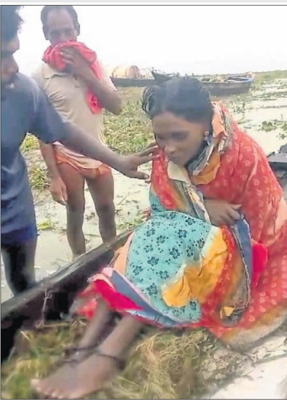
ମହାନଦୀରୁ ମହାକାବୀଙ୍କ ଦ୍ୱାରା ଉଦ୍ଧାର ହୋଇଥିବା ଛତିଶଗଡ଼ର ମହିଳା ।

ଦେଖିବାକୁ ପାଇଥିଲେ । ମହିଳା ଜଣକ ମହାକାବୀମାନଙ୍କୁ କିଛି ଖାଇବାକୁ ମାଗିଥିଲେ । ମହାକାବୀମାନେ ମହିଳାଙ୍କୁ ଦେଇ ଖାଇବାକୁ ସହାୟତାରେ ପୋଲିସକୁ ଖବର ଦେଇଥିଲେ । ପୋଲିସ ଘଟଣାସ୍ଥଳରେ ପହଞ୍ଚି