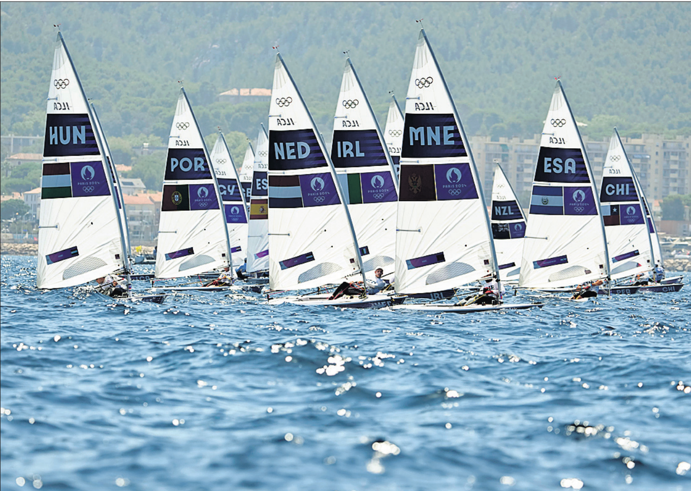
ପ୍ୟାରିସ ଅଲିମ୍ପିକ୍ସ ମାର୍ସେଲିଠାରେ ଆରମ୍ଭ ହୋଇଥିବା ପୁରୁଷ ସେଲିଙ୍ଗି ଚିତ୍ରି ରେସ୍।

ଚାଲିଯିବା ପୂର୍ବରୁ ଖେଲିଙ୍ଗି ଓ ତାଙ୍କ ମଧ୍ୟରେ ମାତ୍ର ଅଳ୍ପ କେତେଟି ପଞ୍ଚ ବର୍ଷର ଯୁବକ ଥିଲେ। କାରିନିଙ୍କ ହେତୁ ଅଧିକ ଯୁବକ ଓ ଯୁବିକା ପରେ ଖେଲିଙ୍ଗିଙ୍କ ସହ ହାତ ମିଳାଇବାକୁ କାରିନି ଚାହୁଁଥିଲେ। କିନ୍ତୁ ପରୀକ୍ଷା ପରେ କାରିନିଙ୍କ ପୂର୍ବରୁ ସେ କାରି ପକାଇଥିଲେ ମଧ୍ୟ। ଖେଲିଙ୍ଗି ହେଉଛନ୍ତି ଜଣେ ସୌଖିନ (ଆମେତର) ବକ୍ତ୍ର। ଇଣ୍ଡୋନେସିଆର ବକ୍ତ୍ର ଆସୋସିଏସନର ୨୦୨୨ ବିଶ୍ୱ ଚାମ୍ପିୟନଶିପ୍ରେ (ଆଇବିଏ)ରେ ସେ ଏକ ଚୌପଞ୍ଚ ପଦକ ଜିତିଥିଲେ। ସମାନ ପରିଚାଳନା ପରିଷଦ ଗତବର୍ଷର ଚାମ୍ପିୟନଶିପ୍ରେ ସ୍ୱର୍ଣ୍ଣ ପଦକ ମଧ୍ୟ ପୂର୍ବରୁ ତାଙ୍କୁ ଆକର୍ଷକ ଅଯୋଗ୍ୟ ଘୋଷଣା କରିଥିଲେ। ତାଙ୍କ ଶରୀରରେ ସେତେବେଳେ ପୁରୁଷ ହରମୋନ (ଟେଷ୍ଟୋଷ୍ଟେରନ୍)ର ମାତ୍ରା ଅଧିକ ରହିଥିବା ତାଙ୍କୁ ଜଣାଯାଇଥିଲା। ଏହି ୨୫ବର୍ଷୀୟା ବକ୍ତ୍ର ସେତେବେଳେ ନିର୍ଦ୍ଦିଷ୍ଟ ସୀମାରେ ରହିଲେ ପ୍ରବେଶ କରିଲେ ସେତେବେଳେ ଦର୍ଶକ ବଡ଼ ପାତ୍ରରେ ଚିତ୍କାର କରି ତାଙ୍କୁ ଉତ୍ସାହିତ କରିଥିଲେ। ମାତ୍ର ବାଉନ୍ତି ହଠାତ ଶେଷ ହୋଇଯିବା ସେମାନଙ୍କୁ ବୁଦ୍ଧିରେ ପକାଇଥିଲା। ବର୍ଷ ବର୍ଷ ଧରି ଆମେତର ପ୍ରତିଯୋଗିତାରେ ଭାଗ ନେଇ ଆସୁଥିବା ଖେଲିଙ୍ଗି ଓ ତାଙ୍କୁ ନିର୍ଦ୍ଦିଷ୍ଟ ସୀମାରେ ପହଞ୍ଚିବା ପରେ ସେମାନଙ୍କର ବ୍ୟାପକ ଯାତ୍ରା କରାଯାଇଥିଲା। ଲିଙ୍ଗ ୨୦୧୮ ଓ ୨୦୨୨ରେ ଅନୁଷ୍ଠିତ ଆଇବିଏ ବିଶ୍ୱ ଚାମ୍ପିୟନଶିପ୍ ଜିତିଥିଲେ। ମାତ୍ର ପରିଚାଳନା ପରିଷଦ ଗତବର୍ଷ ତାଙ୍କଠାରୁ ଏକ ଗ୍ରୋଉଥ ପଦକ ପ୍ରତ୍ୟାହାର କରି ନେଇଥିଲେ। ଏକ ବାଲକେମିକାଲ ଟେଷ୍ଟ ପାଇଁ ଆବଶ୍ୟକ ପଡୁଥିବା ଏକ ନିର୍ଦ୍ଦିଷ୍ଟ ଯୋଗ୍ୟତା ମାନଦଣ୍ଡ ତାଙ୍କ ନିକଟରେ ନ ଥିବା ସେତେବେଳେ ତାଙ୍କୁ ଦର୍ଶାଯାଇଥିଲା।