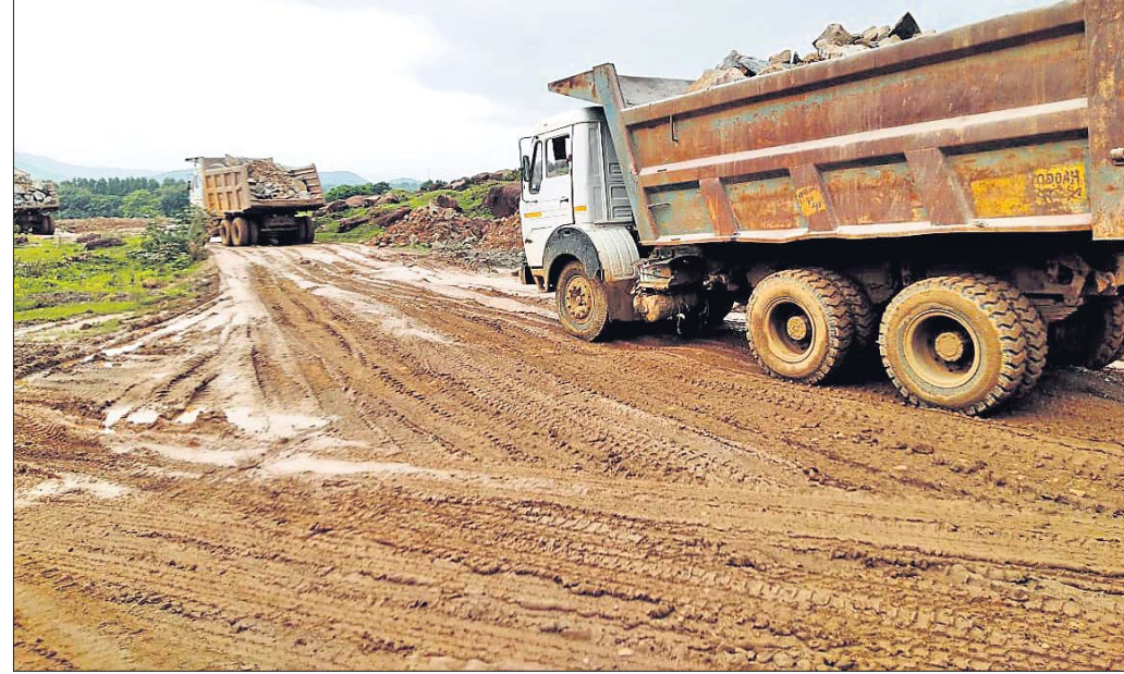
ଉଭୟଲୋଡ଼ି ଗାଡ଼ି ଚଳାଚଳ କରୁଥିବାରୁ ରାସ୍ତା ଶୋଚନୀୟ ହୋଇପଡ଼ିଛି ।

ଯାଜପୁର ଜିଲାର ଧର୍ମଶାଳା ତହସିଲ ଅଞ୍ଚଳରୁ ହାଇଡ୍ରୋ, ଟ୍ରକ, ଟ୍ରାକ୍ଟର ଓ ଉଭୟଲୋଡ଼ି ଅବସ୍ଥାରେ ଚଳାଚଳ ଚାଲିଛି । ଦିନକୁ ୨ ହଜାରରୁ ଊର୍ଦ୍ଧ୍ୱ ବୋଲତର, ଗେଟି, ଟିସୁ ଆଦି ଉଭୟଲୋଡ଼ି ଗାଡ଼ି ଚଳାଚଳ କରୁଥିବାରୁ ସେହି ଅଞ୍ଚଳର ରାସ୍ତା ଅତ୍ୟନ୍ତ ଶୋଚନୀୟ ହୋଇପଡ଼ିଛି । ହାଇଡ୍ରୋବାଦର ଏକ ଠିକାସଂସ୍ଥା ପିଏସ୍‌କେ ଜନପ୍ରାୟକର ଆଖ ପ୍ରୋଜେକ୍ଟ ପ୍ରାଜେକ୍ଟ ଲିଫ୍ଟ କାଟାୟ ରାଜପଥ କାର୍ଯ୍ୟ ପାଇଁ ଅନୁମତି ମିଳିଥିବା ଅଞ୍ଚଳର ୬ ନୟନ କଳାପଥର ଖାଦାନ ଓ ତତ୍ ସଂଲଗ୍ନ କ୍ରମରେ ଉଭୟଲୋଡ଼ି ଗାଡ଼ି ଚଳାଚଳ ସାମାନ୍ୟ ଚଳିଛି । ଗୁରୁତର ଏଠାରୁ ଉଭୟଲୋଡ଼ି ଏବଂ ଦିନା ଚିପି(ଗ୍ରାଉଣ୍ଡଟ