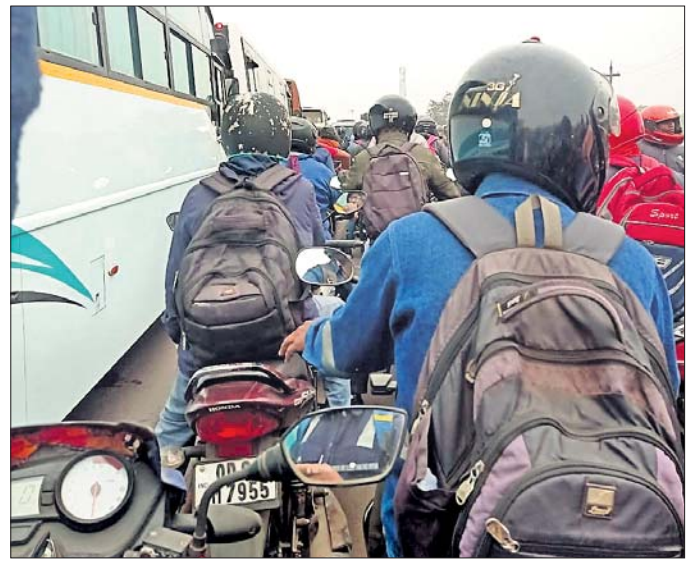
ଓଭର ବ୍ରିଜ୍‌ରେ ଗ୍ରାମିଣ କାମ୍ ।

ଯାଜପୁର ଜିଲାର କଳିଙ୍ଗନଗର ଶିଳ୍ପ ଓ ଯୁକ୍ତି ଖଣି ଅଞ୍ଚଳକୁ ଯାଇଥିବା ମୁଖ୍ୟ ରାସ୍ତାର ମାନପୁର ଓଭରବ୍ରିଜ୍ ଉପରେ ନୀତିନିଆ ଗ୍ରାମିଣ ସମସ୍ୟା ଯାତ୍ରାକ ପାଇଁ କାଳ ହେଉଛି । ଏହାବ୍ୟତୀତ ମାନପୁର ପ୍ରଥମ ଓଭରବ୍ରିଜ୍ ରାସ୍ତାରେ ଖାଲଖମାର ସୃଷ୍ଟି ହେବା ସହ ବିପଦସଙ୍କୁଳ ହୋଇ ପଡ଼ିଛି । ଏହା କେତେବେଳେ ଯେ ରାଜି ପଡ଼ିବ ବୋଲି ସେହି ରାସ୍ତାରେକ ଯାଉଥିବା ଯାତ୍ରୀମାନେ ଆଶଙ୍କା ବ୍ୟକ୍ତ କରୁଛନ୍ତି । ତେବେ ଗ୍ରାମିଣ ସମସ୍ୟାର ସମାଧାନ କରିବାର ଲକ୍ଷ୍ୟ ନେଇ ସରକାର ଦ୍ୱିତୀୟ ବ୍ରିଜ୍‌ର ପରିଚ୍ଛନା କରିଥିଲେ ହେଁ ତାହା ସମ୍ପୂର୍ଣ୍ଣ ହେବ ନ ଥିବାରୁ ନିର୍ଦ୍ଧାରିତ ସମୟରେ କର୍ମଚାରୀ ଓ ଅଧିକାରୀମାନେ ବିଭିନ୍ନ ଶିଳ୍ପ କାରଖାନାକୁ