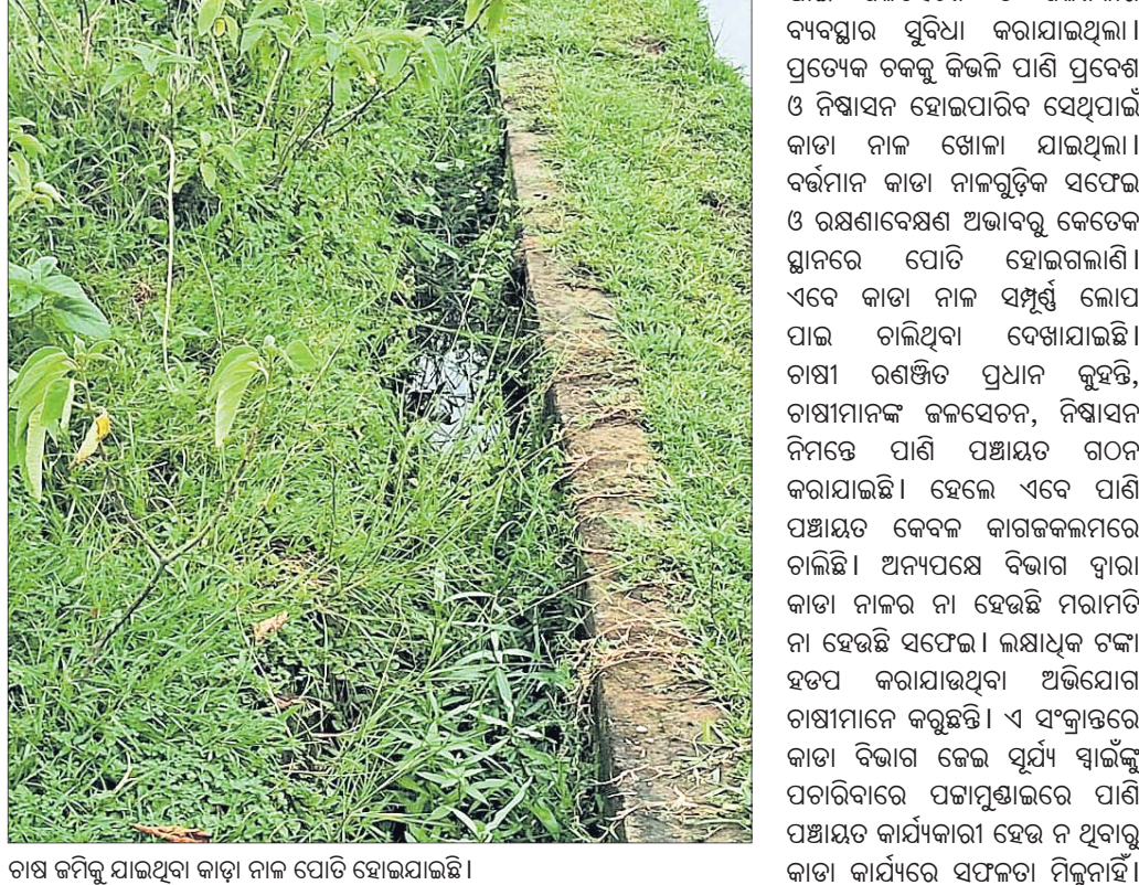
ଚାଷ କମିକୁ ଯାଇଥିବା କାଡ଼ା ନାଳ ପୋତି ହୋଇଯାଇଛି।