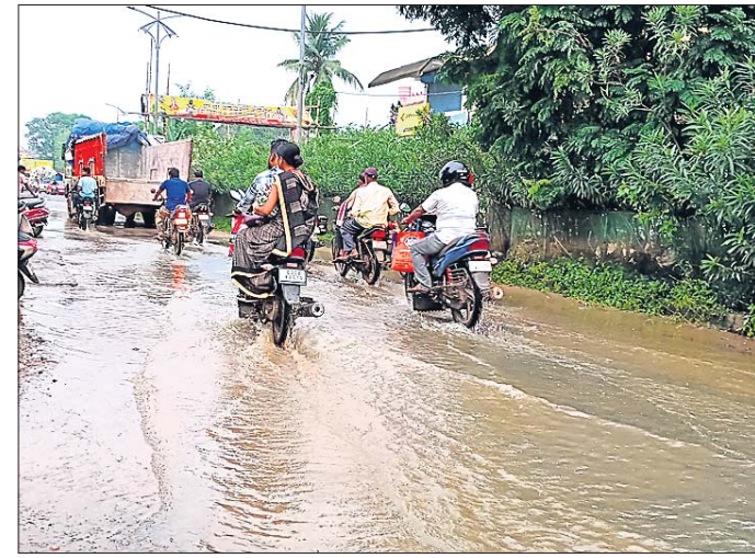
ଶାନ୍ତିବଜାରଠାରୁ କାରକା ବସ୍ ଷ୍ଟାଣ୍ଡକୁ ସଂଯୋଗ କରୁଥିବା ମୁଖ୍ୟରାସ୍ତାରେ ବର୍ଷା ପାଣି ।

ଧର୍ମଶାଳା ବୁକ୍ ଅନ୍ତର୍ଗତ ଶାନ୍ତିବଜାରଠାରୁ ମୁଖ୍ୟରାସ୍ତା ଉପରେ ବର୍ଷା ପାଣି ଜମି ରହୁଛି । ଫଳରେ ଯାତାୟାତରେ ଅନେକ ଅସୁବିଧା ହେଉଥିବା ଦେଖିବାକୁ ମିଳୁଛି । ରାସ୍ତାରେ ଜମି ରହିବା ଯୋଗୁ ଯାତ୍ରୀମାନେ ଯୋଗ୍ୟ ଶ୍ରେଣୀ ଓ ମେଡିକାଲକୁ ସଂଯୋଗ କରିବା ସହେପରି କାଏନା ପଟରୁ ଧର୍ମଶାଳା ମହାବିଦ୍ୟାଳୟ, ସ୍କୁଲ, ଧର୍ମଶାଳା ବୁକ୍, ମିନି ଷ୍ଟାଡ଼ିୟମ ସହ ଅନେକ ସରକାରୀ ଓ ବେସରକାରୀ ପ୍ରତିଷ୍ଠାନକୁ ଏ ରାସ୍ତା ସଂଯୋଗ କରୁଛି । ପ୍ରତ୍ୟେକ ଦିନ ଶହ ଶହ ଲୋକେ ଏବଂ ଛାତ୍ରଛାତ୍ରୀ ଏହି ରାସ୍ତା ଉପରେ ନିର୍ଭର କରିଥାନ୍ତି । ହେଲେ ପାଣି ଜମିବା ସମସ୍ୟା ଏବେକାର ଗୁରୁତ୍ୱ ବର୍ଷ ବର୍ଷ ଧରି