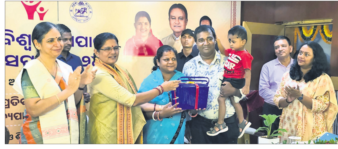
ଉପଯୁକ୍ତମାନୁା ପ୍ରଭାତୀ ପରିଡ଼ା ଜଣେ ସୁସ୍ଥ ଶିଶୁଙ୍କୁ ପୁରସ୍କୃତ କରୁଛନ୍ତି।

ଭୁବନେଶ୍ୱର, ୧୮ (ବନ୍ଦନା ସେଠୀ) ମା'ର କ୍ଷୀରରେ ଶିଶୁର ଏକତାଟିଆ ଅଧିକାର ରହିଛି। ଶିଶୁର ଏହି ଅଧିକାରକୁ ସ୍ୱାଭାବିକ ଭାବେ ପ୍ରଦାନ କରିବା ପାଇଁ ସମସ୍ତ ବ୍ୟବସ୍ଥାକୁ ସମାଜ ଅନୁକୂଳ କରିବାକୁ ପଡ଼ିବ। ଏଥିଲାଗି ସର୍ବସାଧାରଣ ସ୍ଥାନରେ ଶୈତାଳୟ ଭଳି ସୁନ୍ୟପାନ ଗୃହର ଆବଶ୍ୟକତା ରହିଛି। ସେହିପରି ସବୁ କାର୍ଯ୍ୟାଳୟରେ କର୍ମଚାରୀ ମା'ମାନଙ୍କ ପାଇଁ କ୍ଲେର, ସୁନ୍ୟପାନ ଗୃହର ସୁବିଧା ଯୋଗାଇ ଦେବାର ବ୍ୟବସ୍ଥା କରିବାକୁ ଉପଯୁକ୍ତମାନୁା ତଥା ମହିଳା ଓ ଶିଶୁ ବିକାଶ ବିଭାଗ ମନୁା ପ୍ରଭାତୀ ପରିଡ଼ା ବିଭାଗକୁ ନିର୍ଦ୍ଦେଶ ଦେଇଛନ୍ତି। ଗୁରୁତ୍ୱରାଜ୍ୟ ସମାଜକଲ୍ୟାଣ ବୋର୍ଡ଼ଠାରେ ବିଭାଗ ପକ୍ଷରୁ ବିଶ୍ୱ ସୁନ୍ୟପାନ ସମୁଦାୟ ଶୁଭାରମ୍ଭ ହୋଇଛି। ଉପଯୁକ୍ତମାନୁା ପରିଡ଼ା ମୁଖ୍ୟ ଅତିଥି ଭାବେ ଯୋଗଦେଇ ଉଭୟ ମା' ଓ ଶିଶୁ ପାଇଁ ସୁନ୍ୟପାନର ଉପଯୋଗିତା ବିଷୟରେ ଆଲୋଚନା କରିଥିଲେ। ଚଳିତ ବର୍ଷର ବିଷୟବସ୍ତୁ 'ପ୍ରତିବନ୍ଧକ ଦୂର କରିବା: ସୁନ୍ୟପାନକୁ ପ୍ରୋତ୍ସାହିତ କରିବା' ଉପରେ ଉପଯୁକ୍ତମାନୁା ଗୁରୁତ୍ୱ ଦେଇଥିଲେ। ଏଥିସହ ବିଶ୍ୱ ସୁନ୍ୟପାନ ସମୁଦାୟ ବ୍ୟାପକ ରାଜ୍ୟର ସମସ୍ତ ଅଞ୍ଚଳକୁ କେନ୍ଦ୍ରରେ ପ୍ରଦର୍ଶିତ କରି ସୁନ୍ୟପାନର ଉପକାରଣ ଏବଂ ଆବଶ୍ୟକତା ସମ୍ପର୍କରେ ବ୍ୟାପକ ଜନସଚେତନତା