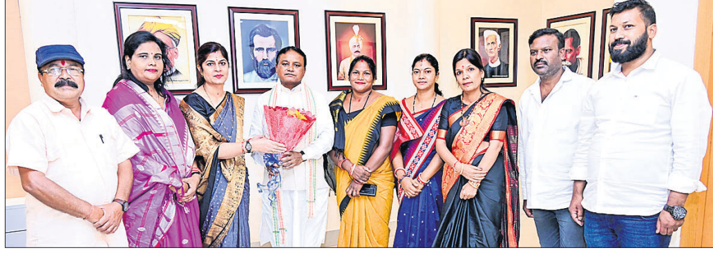
ମୁଖ୍ୟମନ୍ତ୍ରୀ ମୋହନ ଚରଣ ମାଝାଙ୍କୁ ଶୁଭବାଚନ କେନ୍ଦ୍ରର ଗୃହ ପୌରପାଳିକାର ଅଧିକାରୀ ଓ କାର୍ଯ୍ୟକାରୀମାନେ ସାକ୍ଷାତ କରୁଛନ୍ତି।