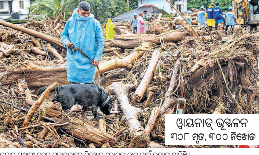
ଓୟନାଡ଼ ଭୂଖଳନ ୩୦୮ ମୁତ, ୩୦୦ ନିଖୋଜ

ସେନାର ସହାନୀ କୁକୁର ସହାୟତାରେ ନିଖୋଜ ଲୋକଙ୍କୁ ଠାବ ପାଇଁ ଉଦ୍ୟମ ଚାଲିଛି। ଓୟନାଡ଼ ଜିଲ୍ଲାରେ ହୋଇଥିବା ପ୍ରକୃତକାଳୀନ ଭୂଖଳନରେ ମୃତ୍ୟୁସଂଖ୍ୟା ଶୁକ୍ରବାର ୩୦୮ରେ ପହଞ୍ଚିଛି। ଚତୁର୍ଥ ଦିନରେ ସେନା ସହାୟତାରେ ଭୂଖଳନ ସ୍ଥଳରୁ ୪ ଜଣଙ୍କୁ ଜୀବନ୍ତ ଉଦ୍ଧାର କରିଛନ୍ତି। ପ୍ରତିରକ୍ଷା ବିଭାଗ ଜନସମ୍ପର୍କ ଅଧିକାରୀଙ୍କ ସୂଚନା ଅନୁଯାୟୀ ଭୋଲାରମାଳାର ଜନ୍ କେ.କେ. କୋମୋଲ ଜନ୍, କୁଣ୍ଡିନ ଜନ୍ ଏବଂ ଆତ୍ମହତ୍ୟା ଜନ୍ଙ୍କୁ ନିରାପଦର ସହ ଉଦ୍ଧାର କରାଯାଇ ନିକଟବର୍ତ୍ତୀ ଡିଲିଫ୍ କ୍ୟାମ୍ପକୁ ନିଆଯାଇଛି। ପ୍ରଥମେ ଏହି ପରିବାରକୁ ହେଲିକପ୍ଟର ଯୋଗେ ଅନ୍ୟତ୍ର ନେବା ପାଇଁ ଯୋଜନା ହୋଇଥିଲା। ତେବେ ନିରାପଦ ଭୂତଳରେ ସେମାନେ ଡିଲିଫ୍ କ୍ୟାମ୍ପକୁ ଯିବାକୁ ରାଜି ହୋଇଥିଲେ। ଏବେ ମଧ୍ୟ ପ୍ରାୟ ୩୦୦ ଲୋକ