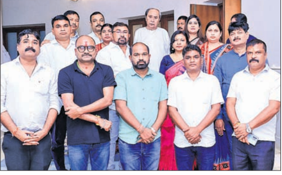
ନବୀନ ପଟ୍ଟନାୟକଙ୍କ ସହ ମୟୂରଭଞ୍ଜର ବିଜେଡି ନେତୃତ୍ୱ।