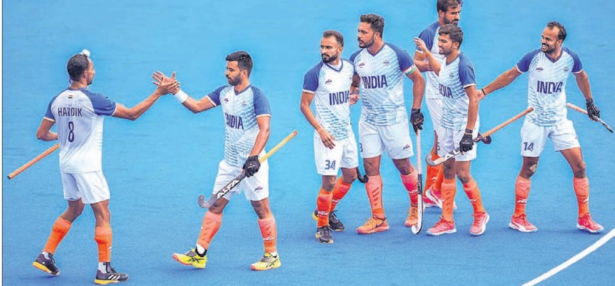
ପ୍ୟାରୀସ୍ ଅଲିମ୍ପିକ୍ସର ଶୁକ୍ରବାର ଅନୁଷ୍ଠିତ ପୁରୁଷ ହକି ମ୍ୟାଚରେ ଅଷ୍ଟ୍ରେଲିଆକୁ ହରାଇଲା ପରେ ଭାରତ ଭାରତୀୟ ଦଳ। (ରିପୋର୍ଟ: ଖେଳ ପୃଷ୍ଠା)