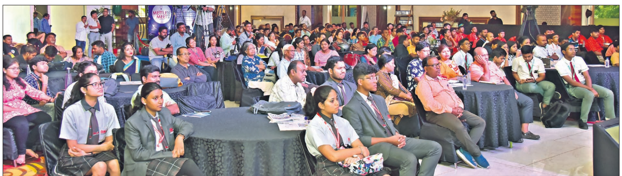
ଗ୍ରାଣ୍ଡ ଫାଇନାଲରେ ଉପସ୍ଥିତ ଛାତ୍ରଛାତ୍ରୀ, ଅଭିଭାବକ, ଅତିଥି