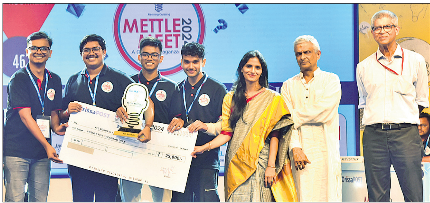
ଓଡ଼ିଶାପୋଷ୍ଟ ମେଟଲ ମିଟ୍ ୨୦୨୪ ସିନିୟର ଗୁପ୍ତ ଗ୍ରାଣ୍ଡ ଫାଇନାଲର ପ୍ରଥମ ରନରଅପ୍ କଟକ ଏସ୍‌ସି ମେଡିକାଲ କଲେଜ ଆଣ୍ଡ ହସ୍ପିଟାଲ ଏବଂ ବିତାୟ ରନରଅପ୍ ଏନଆଇଟି ରାଉରକେଲା ଚିମ୍ପୁ ପୁରସ୍କାର ବାବଦ ଚେକ୍ ପ୍ରଦାନ କରାଯାଇଛି।