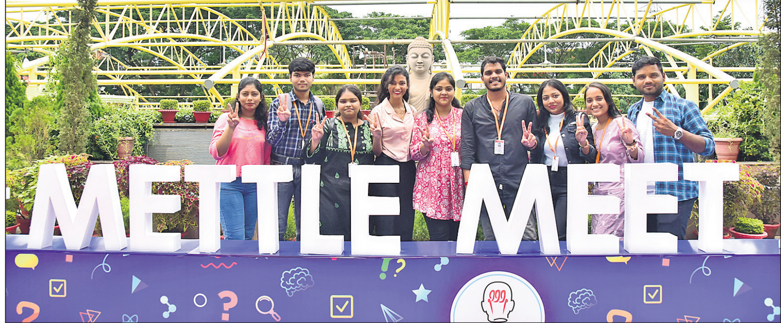
ଓଡ଼ିଶାପୋଷ୍ଟ ମେଟଲ ମିଟ୍ ୨୦୨୪ର ସେକ୍ଟି ପଏଣ୍ଟରେ ଛାତ୍ରାଛାତ୍ରମାନେ।