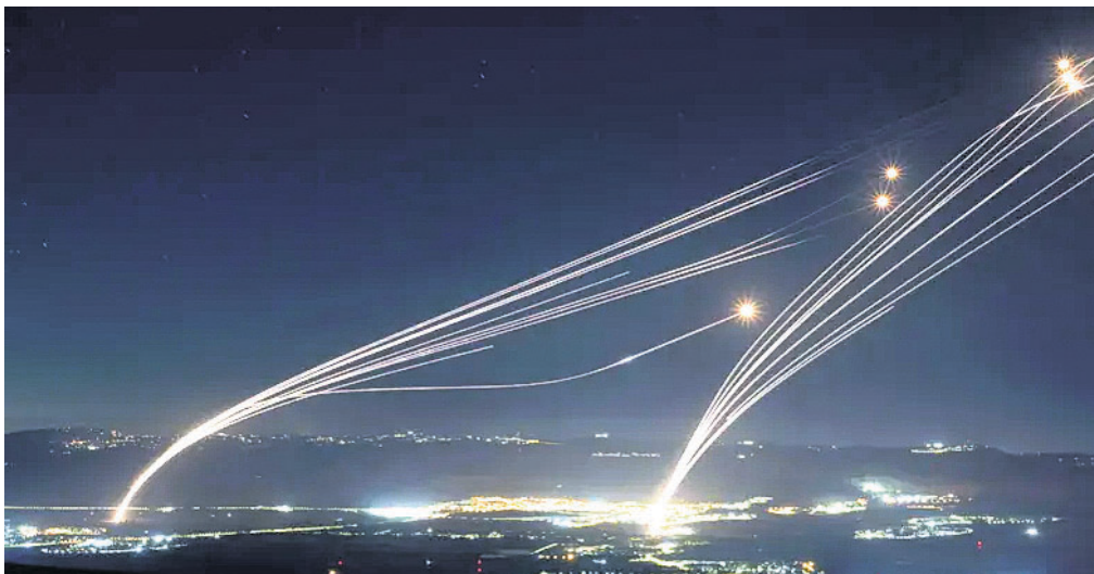
ହେଉଥିବା ପକ୍ଷରୁ ଇସ୍ରାଏଲ୍ ଉପରେ ରକେଟ ମାଡ଼ କରାଯାଉଛି।

ଇରାନ ସମର୍ଥନ ଦେଇଥିବା ସଂଗଠନ ଇସ୍ରାଏଲ୍ ଉପରେ କୋରଦ୍ୱାରା ମିଶାଇଲ ଓ ରକେଟ ମାଡ଼ କରୁଛି। ହମାସ୍ ନେତା ଏବଂ ହେଉଥିବା କମ୍ୟୁନିଟି ହଟାଏ ଘଟଣାକୁ ନେଇ ମଧ୍ୟସ୍ତରରେ ଉଡ଼ାଣର ବହୁଳତା ଦେଖି ହେଉଥିବା ରକେଟ ମାଡ଼ ପରେ ମୁକ୍ତ ଆଶଙ୍କା ବୃଦ୍ଧି ପାଇଛି। ହେଉଥିବା ପକ୍ଷରୁ ଶନିବାର ବିଳମ୍ବିତ ରାତିରେ ଇସ୍ରାଏଲ୍ ଗାରିବ୍ ଏବଂ ହେଉଥିବା ବହୁଳତାରେ କାର୍ଯ୍ୟକାଳ ରକେଟ ମାଡ଼ କରାଯାଇଛି। ଲେବାନନ୍ରୁ ଛଡ଼ାଯାଇଥିବା ଏହି ରକେଟଗୁଡ଼ିକୁ ଇସ୍ରାଏଲ୍ ଏହାର ଆଇରନ୍ ଡୋଗ୍ ଏୟାର ଡିଫେନ୍ସ ସିଷ୍ଟମ୍ ଦ୍ୱାରା ପ୍ରତିହତ କରୁଥିଲା। ଏଥିପ୍ରତି ଇସ୍ରାଏଲ୍ ସୂଚନା ଦେଇଛି ଏବଂ ହେଉଥିବା କବଚ ଦେବାକୁ ଚେତାବନା ଦେଇଥିଲେ। ଜାରି ରହିଛି। ଗତ ରୁସ୍ ଦ୍ୱାରା ତେହରାନରୁ ହମାସ୍ ରାଜନୈତିକ ମୁକ୍ତ ଇସ୍ରାଏଲ୍