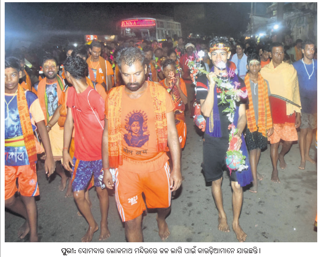
ପୁରୀ: ସୋମବାର ଲୋକନାଥ ମନ୍ଦିରରେ ଜଳ କାଗି ପାଇଁ କାଉଡ଼ିଆମାନେ ଯାଉଛନ୍ତି।

ଖୋର୍ଦ୍ଧା ଜିଲ୍ଲା ବାଲୁଗା ଥାନା ଅଧୀନ କୁମ୍ଭୀରପଡ଼ା ଗ୍ରାମ ସଂଲଗ୍ନ କଂସାରୀ ନର୍କରୁ ରବିବାର ଜଣେ ମହିଳାଙ୍କ ଗଳିତ ମୃତଦେହ ବାଲୁଗା ପୋଲିସ୍ ଜବତ କରିଛି। ମୃତକଙ୍କ ପରିଚୟ ନିମ୍ନୋକ୍ତ ନ ଥିବାରୁ ପୋଲିସ୍ ଏ ସଂସ୍ଥାରେ ୧୨/୭୪ରେ ଏକ ଅପମୃତ୍ୟୁ ମାମଲା ରୁଜୁ କରି ବ୍ୟବହୃତ ନିମନ୍ତେ ପଠାଇ ତଦନ୍ତ ପ୍ରକ୍ରିୟା ଆରମ୍ଭ କରିଛି। ସୂଚନା ଅନୁଯାୟୀ, ରବିବାର ପୂର୍ବାହ୍ନରେ କୁମ୍ଭୀରପଡ଼ାର କେତେଜଣ ବ୍ୟକ୍ତି ନିକରେ ଗାଧୋଉଥିବାବେଳେ ଏକ ବାଉଁଶ ବୁଦା ମୂଳେ ଜଣେ ମହିଳାଙ୍କ ମୃତଦେହ ଭାସୁଥିବା ଦେଖିଥିଲେ। ଖବର ପ୍ରସଙ୍ଗ ହେବାରେ କୁମ୍ଭୀରପଡ଼ା ଏବଂ ଆଖପାଖ ଗ୍ରାମ ଲୋକେ ରୁଣ୍ଡ ହୋଇଥିଲେ। କିଛି ମୃତଦେହଟି ଫୁଲି ଯାଇଥିବାରୁ କେହି ଚିହ୍ନଟ କରିପାରି ନ ଥିଲେ। ଖବରପାଇ ବାଲୁଗା ପୋଲିସ୍ ଓ ଅଗ୍ନିଶମ ବାହିନୀ ଘଟଣାସ୍ଥଳେ ପହଞ୍ଚି ମୃତଦେହ ଜବତ କରିଥିଲେ। ମହିଳାଙ୍କ ଉଚ୍ଚତା ୫ଫୁଟ ୫ଠି ବର୍ଷ ହେବ ବୋଲି ଅନୁମାନ କରାଯାଇଛି। ନିକର ଉପର ମୁଣ୍ଡରୁ ବର୍ଷାକଳରେ ମୃତଦେହଟି ଭାସି ଆସିଥିବା ପ୍ରାଥମିକ ତଦନ୍ତରୁ ପୋଲିସ୍ ଅନୁମାନ କରୁଛି। ତେବେ ମହିଳା କେଉଁ ଅଞ୍ଚଳର ଏବଂ କେଉଁ ପରିସ୍ଥିତିରେ ସେ ନିକରେ ରୁଡ଼ି ପ୍ରାଣ ହରାଇଛନ୍ତି, ଏହା ଏକ ହତ୍ୟାକାଣ୍ଡ ନା ଆତ୍ମହତ୍ୟା ସେନେଇ ତଦନ୍ତ ଚାଲିଥିବା ବାଲୁଗା ଆଇ.ଆଇ.ସି. ଉପ ପ୍ରକାଶ ପରିତା ସୂଚନା ଦେଇଛନ୍ତି।