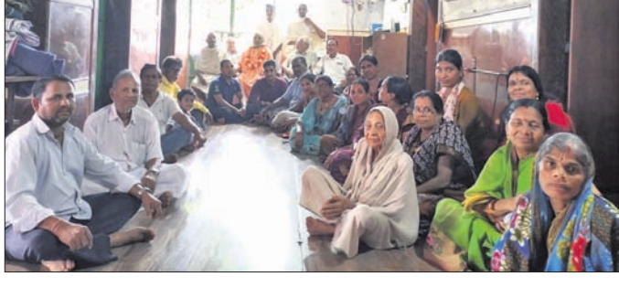
ଆଲୋଚନାଚକ୍ରରେ ଉପସ୍ଥିତ ଭକ୍ତ।