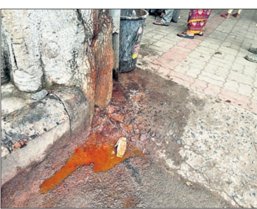
ଏସ୍‌ସିବି ମେଡିକାଲ ପରିସରରେ ପଦାଳୟର ଗୁରୁତ୍ୱା, ପାନ ଛେପ।

କଟକ, ୪।୮ (ଶିଳ୍ପା ପ୍ରିୟଦର୍ଶିନୀ) ଶ୍ରୀରାମଚନ୍ଦ୍ର ଭଞ୍ଜ ମେଡିକାଲ କଲେଜ ଆଣ୍ଡ ହସ୍ପିଟାଲ (ଏସ୍‌ସିବି) ମେଡିକାଲର ପଦାଳୟ ପାଇଁ ସ୍ୱାସ୍ଥ୍ୟ ବିଭାଗ ପକ୍ଷରୁ କୃତା ନିୟମ ଲାଗୁ କରାଯାଇଥିଲା। ଏହି ନିୟମ ନ ମାନିଲେ ଜରିମାନା ଆଦାୟ ପାଇଁ କୁହାଯାଇଥିଲା। ଏଥିପାଇଁ ସ୍ୱାସ୍ଥ୍ୟ ବିଭାଗ ପକ୍ଷରୁ ଏକ ରସିଦ୍ ବହି ମଧ୍ୟ ଏସ୍‌ସିବି କର୍ମଚାରୀଙ୍କୁ ଦିଆଯାଇଥିଲା। ଏସ୍‌ସିବି ଏହି ନିୟମକୁ ମେଡିକାଲ କର୍ମଚାରୀଙ୍କୁ ପଢ଼ାଇ ଦିଆଯାଇଥିଲା।