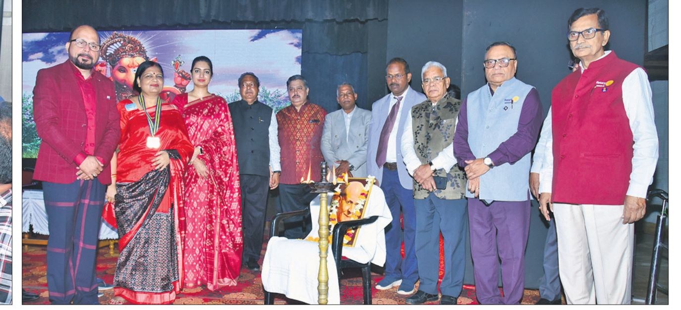
କଟକ ଶାନ୍ତ ଭବନରେ ରୋଗୀ କୁର୍ ଅଫ କଟକ ସେଣ୍ଟ୍ରାଲ ପକ୍ଷରୁ ଅନୁଷ୍ଠିତ ଆଲୋଚନା ସଭାରେ ଉପସ୍ଥିତ ଅତିଥିମାନେ।