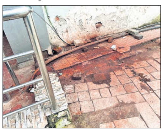
ଏସ୍‌ସିବି ମେଡିକାଲ ପରିସରରେ ପଦାଳୟର ଗୁରୁତ୍ୱା, ପାନ ଛେପ।