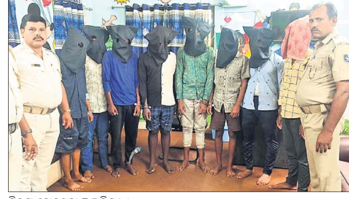
ଗିରଫ ହୋଇଥିବା ଟାକାୟତି ଅଭିଯୁକ୍ତ ।

ଶିଶୁ ଦୃଷ୍ଟିରେ ଖାଦ୍ୟ ଅଭାବ ହେତୁ ରୁଗଣ ହୋଇ ରକ୍ତହୀନତା ଭଳି ବିଭିନ୍ନ ରୋଗରେ ଆକ୍ରାନ୍ତ ହେଉଛନ୍ତି । କାହାର ଗୋଡ଼ହାତ ଯାଏ ହୋଇ ଯାଉଛି ତ କାହାର ପେଟ ଫୁଲି ଯାଉଛି । ଆଉ କାହାର ଶରୀର ଚୁଲକାରେ ମୁଣ୍ଡ ବଢ଼ି ଚାଲିଛି । ଏମାନଙ୍କୁ ସହଜରେ ସୁଖ୍ୟ ଖାଦ୍ୟ ଯୋଗାଇଦେବାକୁ ରାଜ୍ୟରେ ପ୍ରାୟ ୧୦ ବର୍ଷ ହେଲା ହାଲୁଆ ଓ ଛତୁଆ ଯୋଗାଇ ଦିଆଯାଉଛି ।