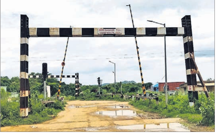
ପୁରୁଣା ଲେଭଲ କ୍ରସିଂ ରାସ୍ତା ।