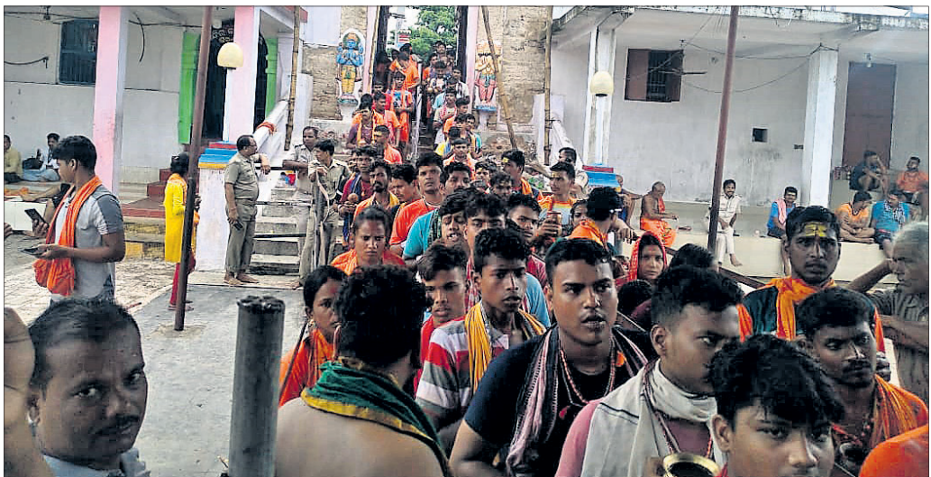
ଲଢୁବାବାଙ୍କୁ ଜଳଲୀଗି କରିବାକୁ କାଉଡ଼ିଆମାନେ ଧାଡ଼ିରେ ଠିଆ ହୋଇଛନ୍ତି ।