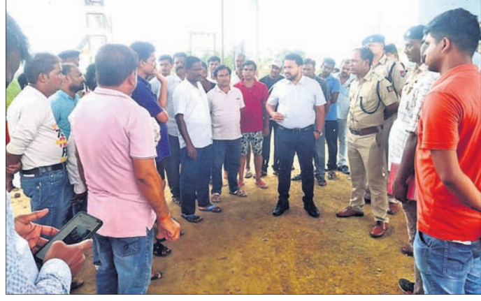
ରାସ୍ତାରୋକ୍ତ ଆନ୍ଦୋଳନ କରୁଥିବା ୩ ଗ୍ରାମବାସୀଙ୍କୁ ପ୍ରଶାସନିକ ଅଧିକାରୀ ବୁଝାଇଛନ୍ତି ।