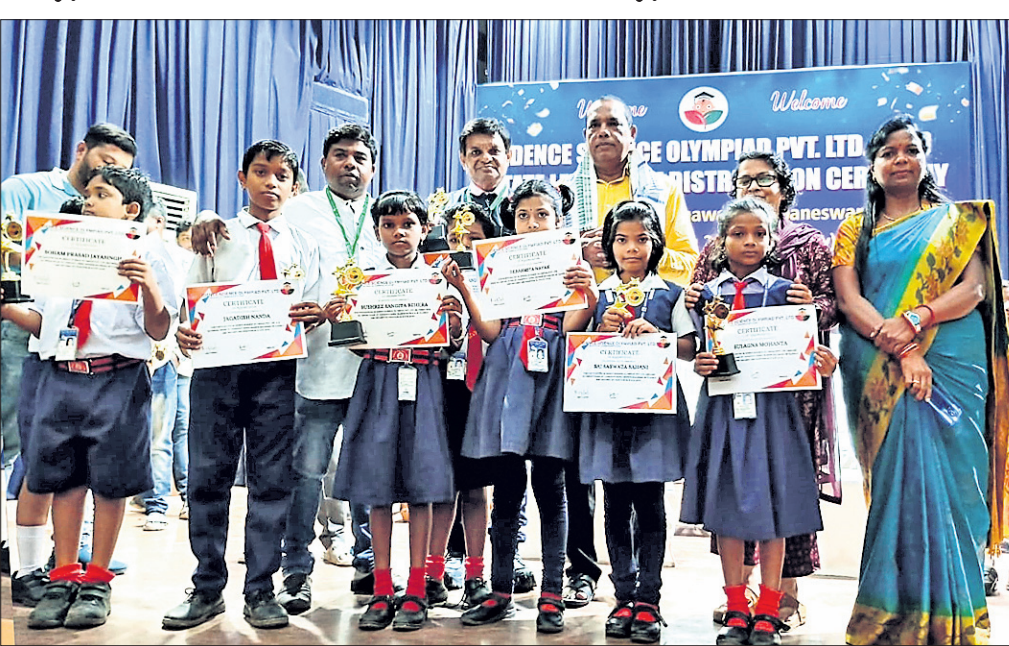
ଅତିଥିଙ୍କ ଗହଣରେ ଅଲିମ୍ପିଆଡ଼ ଭିତ୍ତିକ ଛାତ୍ରାଛାତ୍ରୀମାନେ ।