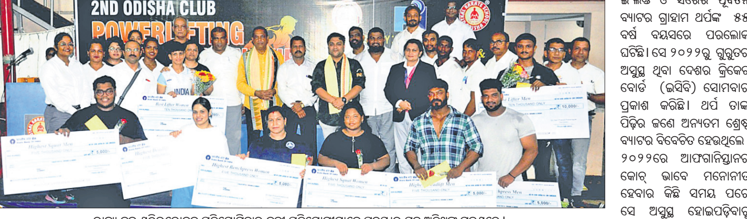
ରାଜ୍ୟ କ୍ଳବ ଶକ୍ତିଉତ୍ତୋଳନ ପ୍ରତିଯୋଗିତାର କୃତୀ ପ୍ରତିଯୋଗୀମାନେ ପୁରସ୍କାର ସହ ଅତିଥିଙ୍କ ଗହଣରେ ।

ଭୁବନେଶ୍ୱର, ୫।୮ (ବିଜୟ ରଣା) ଓଡ଼ିଶା ରାଜ୍ୟ ଦ୍ୱିତୀୟ କ୍ଳବ ଶକ୍ତି ଉତ୍ତୋଳନ ପ୍ରତିଯୋଗିତା ସୋମବାର ଶେଷ ହୋଇଛି । ଏଥିରେ ଉତ୍କଳ କରାଟେ ସ୍କୁଲ ଜିମ୍ ୨୦ଟି ସ୍ୱର୍ଣ୍ଣ ପଦକ ସହ ପ୍ରଥମ ସ୍ଥାନ ଅଧିକାର କରିଥିବା ବେଳେ ରାଉରକେଲା ଡି. ଜିମ୍ ୫ ସ୍ୱର୍ଣ୍ଣ ସହ ଦ୍ୱିତୀୟ ଏବଂ ଭୁବନେଶ୍ୱର ଲିଜେଣ୍ଡ ଜିମ୍ ୩ ସ୍ୱର୍ଣ୍ଣ ସହ ୩ୟ ସ୍ଥାନ ଅଧିକାର କରିଛନ୍ତି । ପୁରୁଷ ବିଭାଗରେ ବାଲୁଗାଁ (ଖୋର୍ଦ୍ଧା)ର କଟୋସ ଜିମ୍ ସୋମେନ ସୋନାପତି ୫୫୪ କେଜି ଉଠାଇ ଷ୍ଟାଫ୍ ମ୍ୟାନ ଏବଂ ଉତ୍କଳ କରାଟେ