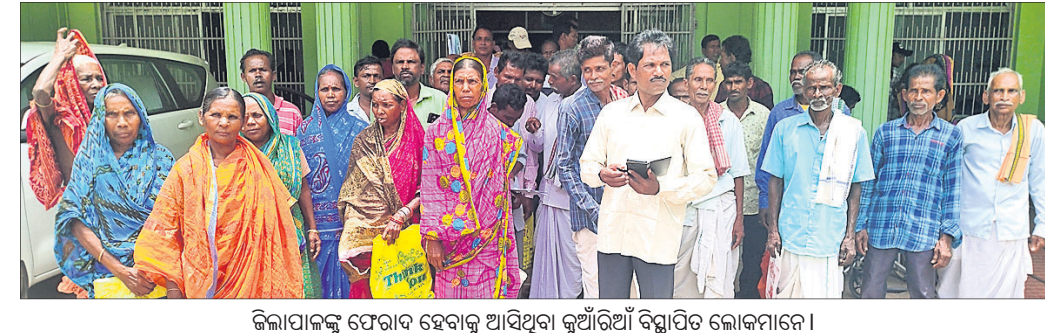
ଜିଲାପାଳଙ୍କୁ ଫେରାଦ ହେବାକୁ ଆସିଥିବା କୁଆଁରିଆ ବିସ୍ଥାପିତ ଲୋକମାନେ ।