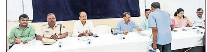
ପ୍ରଶାସନିକ ଅଧିକାରୀମାନେ ଲୋକଙ୍କ ଅଭିଯୋଗ ଶୁଣୁଛନ୍ତି ।