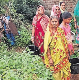
ନଳକୂପରୁ ଗାଁ ଲୋକେ ଫୋରାଇଉଠୁଛୁ ପାନୀ ସଂଗ୍ରହ କରୁଛନ୍ତି ।