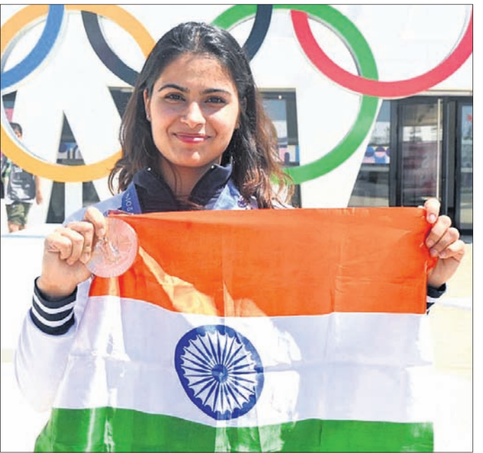
ତ୍ରିରଙ୍ଗା ଓ ପଦକ ସହ ମନୁ ଭାକର।

ପ୍ୟାରିସ୍, ୫୮ (ପି.ଟି.) ପ୍ୟାରିସ୍ ଅଲିମ୍ପିକ୍ସ ୨୦୨୪ର ଉଦ୍‌ଯାପନୀ ସମାରୋହ ପାଇଁ ଶୁଭ୍ ସେନ୍‌ସେସନ ମନୁ ଭାକର ଭାରତର ପତାକା ବାହକ ହେବାକୁ ଯାଉଛନ୍ତି। ରବିବାର ହେବାକୁ ଥିବା ଉଦ୍‌ଯାପନୀ ସମାରୋହ ପାଇଁ ମନୁ ଭାକର ଉଦ୍‌ଯାପନୀ ସମାରୋହରେ ମନୁ ପତାକା ବାହକ ହେବାକୁ ଯାଉଛନ୍ତି। ରବିବାର ହେବାକୁ ଥିବା ଉଦ୍‌ଯାପନୀ ସମାରୋହ ପାଇଁ ମନୁ ଭାକର ଉଦ୍‌ଯାପନୀ ସମାରୋହରେ ମନୁ ପତାକା ବାହକ ହେବାକୁ ଯାଉଛନ୍ତି। ରବିବାର ହେବାକୁ ଥିବା ଉଦ୍‌ଯାପନୀ ସମାରୋହ ପାଇଁ ମନୁ ଭାକର ଉଦ୍‌ଯାପନୀ ସମାରୋହରେ ମନୁ ପତାକା ବାହକ ହେବାକୁ ଯାଉଛନ୍ତି। ରବିବାର ହେବାକୁ ଥିବା ଉଦ୍‌ଯାପନୀ ସମାରୋହ ପାଇଁ