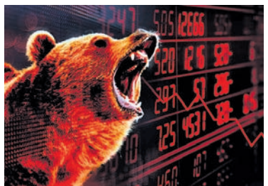
ସେନସେକ୍ସ ୨୨୨୩୩ ପଏଣ୍ଟ, ନିର୍ଦ୍ଦି ୬୬୨ ପଏଣ୍ଟ ଖାସିଲା।

ଅନ୍ଧାରାସ୍ତ୍ରୀୟ ସମସ୍ୟା ଓ ଭୁ-ରାଜନୈତିକ ଘଟଣାବଳୀ ଏବଂ ବରକୃଷି ଯୋଗୁ ଭାରତୀୟ ଷ୍ଟକ୍ ମାର୍କେଟରେ ଯୋଗଦାନ ଏକ ବଡ଼ଧରଣର ହ୍ରାସ ଘଟିଛି। ଏପରିକି ଘରୋଇ ଶେୟାର ବଜାର କାରବାରର ପ୍ରଥମ ଦିନ