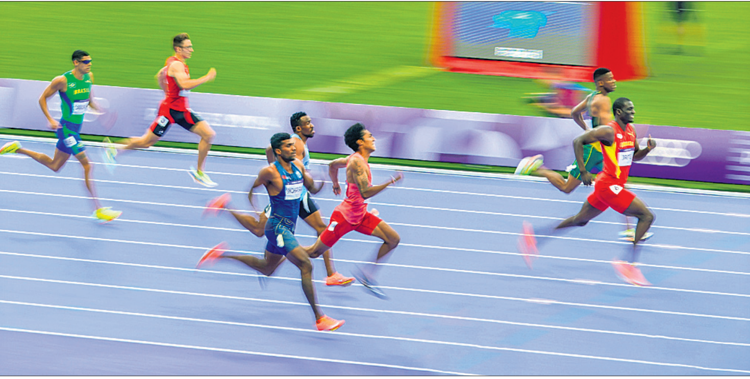
ପ୍ୟାରିସ୍ ଅଲିମ୍ପିକ୍ସର ପୁରୁଷ ୪୦୦ ମିଟର ରେସ୍ ଅବସରରେ ପ୍ରତିଯୋଗୀମାନେ ।