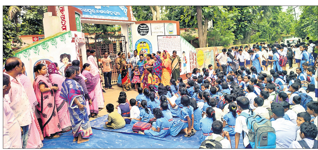
ବିଦ୍ୟାଳୟ ସମ୍ମୁଖରେ ଛାତ୍ରାଛାତ୍ରୀ ଧାରଣାରେ ବସିଛନ୍ତି ।

ପାରାଦୀପର ଅନ୍ୟତମ ଗଣପର୍ବ ବିଶ୍ୱକର୍ମା ପୂଜା ମହୋତ୍ସବ ସେପ୍ଟେମ୍ବର ୧୨ରୁ ଆରମ୍ଭ ହେବ । ଏଥିପାଇଁ ଯୋଗବାର ଏକାଧିକ ସଙ୍ଗଠନ ପୂଜା ମଞ୍ଚପ ଓ ତୋରଣ ପାଇଁ ଭୂମି ପୂଜନ କରିଛନ୍ତି । ଆଉ କେତୋଟି ସଙ୍ଗଠନ ପକ୍ଷରୁ ସେମାନଙ୍କ ତୋରଣ ଅଞ୍ଚଳକୁ ସଫା କରାଯାଇଛି । ଦେବମାସ ଆଗରୁ ଏହାର ପ୍ରସ୍ତୁତି ଆରମ୍ଭ ହୋଇଥିବାରୁ ଚଳିତ ବର୍ଷ ଆକର୍ଷଣୀୟ ମଞ୍ଚପ ହେବ ବୋଲି ଆଲୋଚନା ହେଉଛି । ସୁନାଯୋଗ୍ୟ, ୧୯୨୭ରୁ ଏହି ପୂଜା ମହୋତ୍ସବ ହେଉଥିଲା । ଏକାଧିକ ଟ୍ରକ ମାଲିକ ସଂଘ, ଡମ୍ପର ସଂଘ, ମାଛଧରା କନ୍ଦର ବୋର୍ଡ ମାଲିକ ସଂଘ, ଗ୍ୟାରେଜ ସଂଘ, ଯୁନିୟନ ଆଦି ବଡ଼ ମଞ୍ଚପ କରିଅଛନ୍ତି । ୨୦୨୦ରୁ ୨୦୨୨ ପର୍ଯ୍ୟନ୍ତ ୩ ବର୍ଷ କୋଭିଡ଼ ଯୋଗୁ ବନ୍ଦ ଥିଲା । ଗତବର୍ଷ ଯଦିଏ ଏହି ପୂଜା ହୋଇଥିଲା ବଡ଼ ଆୟୋଜକମାନେ ମଞ୍ଚପ କରି ନ ଥିଲେ । ଯେଉଁ ଆୟୋଜକମାନେ ଗତବର୍ଷ ପୂଜା ମଞ୍ଚପ କରି ନ ଥିଲେ ସେମାନେ ଆସୁଆ ମଞ୍ଚପ ନିର୍ମାଣ ଆରମ୍ଭ କଲେଣି ।