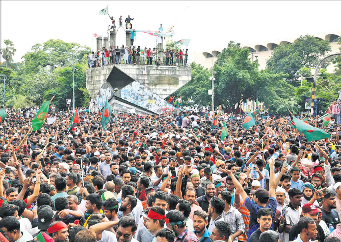
ଶେଖ୍ ହାସିନା ପ୍ରଧାନମନ୍ତ୍ରୀ ପଦରୁ ଇସ୍ତଫା ଦେଇ ପଳାଇବା କରିବା ପରେ ଭାବାରେ ଉତ୍ତର ମନାଉଛନ୍ତି ବିକ୍ଷୋଭକାରୀ।

ବାଂଲାଦେଶରେ ସଂରକ୍ଷଣ ବିରୋଧୀ ଆନ୍ଦୋଳନର ନିଆଁ ଗୁହମୁକ୍ତ ଛୁଟି ଉଠୁଛାନ୍ତେ। ଆନ୍ଦୋଳନରେ ୩୦୦ରୁ ଊର୍ଦ୍ଧ୍ୱ ଲୋକଙ୍କ ଜୀବନ ଯିବା ପରେ ସବୁଜି ଅଣାୟତ୍ତ ହୋଇଯାଇଛି। ଏକ ନାଟକୀୟ ଘଟଣାକ୍ରମରେ ପ୍ରଧାନମନ୍ତ୍ରୀ ଶେଖ୍ ହାସିନା ବିକ୍ଷୋଭକାରୀଙ୍କ ଚାପ ଆଗରେ ମୃତ୍ୟୁ ଲାଭ କରିଛନ୍ତି। ଏହାର କିଛି ସମୟ ପରେ ସେ ଦେଶ ଛାଡ଼ି ପଳାଇବା କରିଛନ୍ତି। ହାସିନା ନିଜ ଭଉଣୀ ଶେଖ୍ ରେହାନାଙ୍କ ସହ ବାଂଲାଦେଶର ସେନା ବିନା ସି-୧୩୦୯ରେ ତ୍ରିପୁରାର ଅଗରତାଲାରେ ଅବତରଣ କରିବା ପରେ ଉତ୍ତରପ୍ରଦେଶର ଗାଜିଆବାଦର ହିନ୍ଦୁ ଧର୍ମାବେଦକୁ ଆସିଥିଲେ। ହାସିନା ସେଠାରେ ସ୍ୱଳ୍ପକାଳୀନ ଅବସ୍ଥାନ ପରେ ଲକ୍ଷ୍ନୱ ଅଭିଯୁକ୍ତ ଯାତ୍ରା ପାଇଁ ପ୍ରସ୍ତୁତ ହେଉଥିବା କୃତନୈତିକ ସ୍ତୂପକୁ ପ୍ରକାଶ। ଇତିମଧ୍ୟରେ ସେନା ଦେଶର କ୍ଷମତା ହାତକୁ ନେଇ ଅନ୍ଧାରାସ୍ତ୍ରୀୟ ସମସ୍ୟା