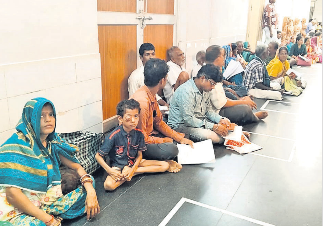
ଜିଲାପାଳଙ୍କୁ ଅଭିଯୋଗ କରିବାକୁ ଆସିଥିବା ଲୋକମାନେ ବସି ରହିଛନ୍ତି ।

ଆସିଥିବାବେଳେ ଏଥିରୁ ୧୩୯ ବ୍ୟକ୍ତିଗତ ଥିବାବେଳେ ୯ଟି ଗୋଷ୍ଠୀ ଗତ ଓ ମୁଖ୍ୟମନ୍ତ୍ରୀଙ୍କ ରିଲିଫ ଫାଣ୍ଡିରୁ ୨ଜଣଙ୍କୁ ସହାୟତା ଦେବାକୁ ରହିଥିଲା । ତେବେ ଏଥିରୁ ୧୩ଟି ସମସ୍ୟାର ସମାଧାନ ହୋଇଥିଲା । ଏଥିରେ ଜିଲାପ୍ରତ୍ୟାୟ ଅଧିକାରୀମାନେ ଉପସ୍ଥିତ ଥିଲେ ।