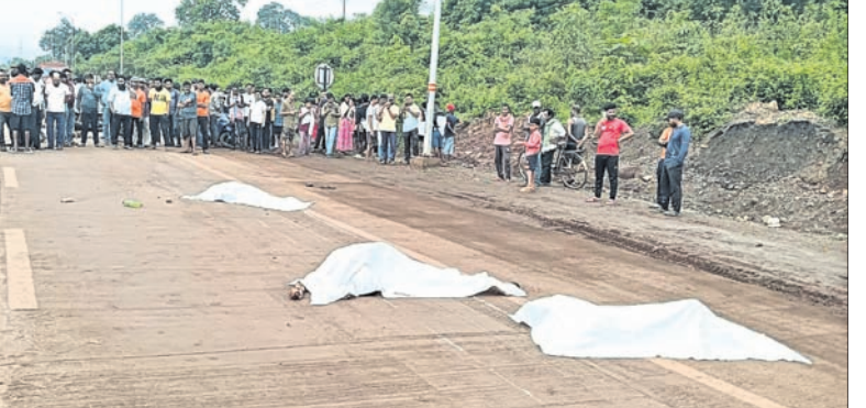
ମୃତଦେହ ରଖି ଲୋକେ ରାସ୍ତାଠାରୁ ଦୂରରେ ରହିଛନ୍ତି।