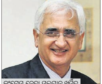
କଂଗ୍ରେସ ନେତା ସଲମାନ ଖୁସିଦ

ବରିଷ୍ଠ କଂଗ୍ରେସ ନେତା ସଲମାନ ଖୁସିଦ ବାଲାଦେଶ ସହ ଭାରତକୁ ତୁଳନା କରି ବିବାଦୀୟ ମତବ୍ୟ ଦେଇଛନ୍ତି। ପଡ଼ୋଶୀ ଦେଶରେ ଯାହା କିଛି ଘଟୁଛି ଭାରତରେ ସବୁ ସ୍ୱାଭାବିକ ମନେହେଉଥିଲେ ମଧ୍ୟ ତାହା ଘଟିପାରେ ବୋଲି ଖୁସିଦ କହିଛନ୍ତି। ଖୁସିଦଙ୍କ ମତବ୍ୟ ସହିତ ସହମତି ପ୍ରକାଶ କରି ଏମ୍ପି ପପୁ ଯାଦବ କହିଛନ୍ତି, ବର୍ତ୍ତମାନର ପ୍ରଧାନମନ୍ତ୍ରୀ