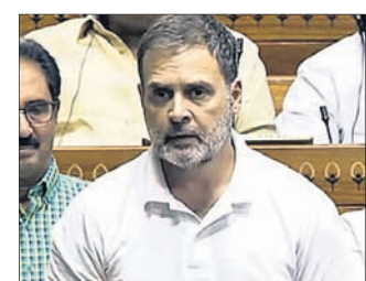
ଲୋକ ସଭାରେ ବିରୋଧୀଦଳ ନେତା ରାହୁଲ ଗାନ୍ଧୀ।

ପାଇଁ ବିସ୍ତୃତ ପୁନର୍ବିଧି ପ୍ୟାକେଜ ପ୍ରଦାନ କରିବାକୁ ସେ ଦାବି କରିଛନ୍ତି। ସେହିପରି ଏକାଧିକ ପ୍ରାକୃତିକ ଦୁର୍ଘଟଣାକୁ ବର୍ତ୍ତମାନ ପାଇଁ ଦେଶରେ ବିପର୍ଯ୍ୟୟ ପ୍ରତିରୋଧକ ଭିତ୍ତିଭୂମି ନିର୍ମାଣ କରିବାକୁ ରାହୁଲ କେନ୍ଦ୍ର ସରକାରଙ୍କୁ ପରାମର୍ଶ ଦେଇଛନ୍ତି।