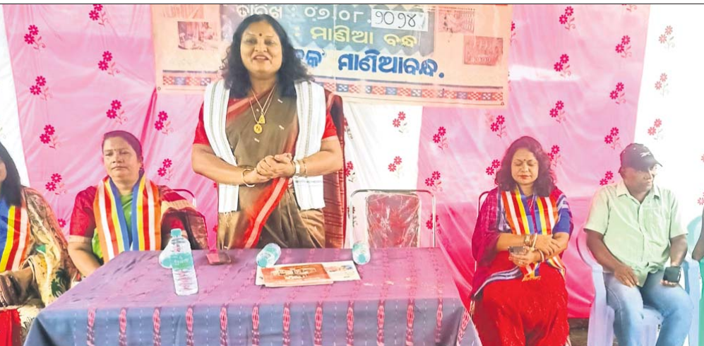
ଜାତୀୟ ହସ୍ତତନ୍ତ ଦିବସ କାର୍ଯ୍ୟକ୍ରମରେ ଯୋଗଦେଇଥିବା ଅତିଥିମାନେ।

ବାଙ୍କୀର ଚଢ଼େଇ ନଡ଼ିଆଗଛରେ ବସା ବାନ୍ଧି ରହିଛନ୍ତି। ସେଠାରେ ସେବକମାନେ ଆଣି ସେମାନଙ୍କର ସୁରକ୍ଷା ପାଇଁ ଚେଷ୍ଟା କରୁଛନ୍ତି।