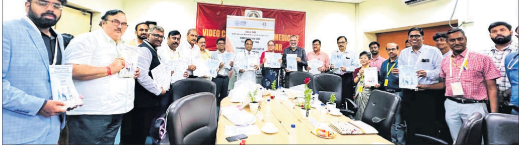
ଜାତୀୟସ୍ତରୀୟ ପରାମର୍ଶ ସମାକ୍ଷା ଚଳିଥିବାବେଳେ ପ୍ରକଳ୍ପ ଟ୍ରେନିଂ ମାଡୁଆଲ ଡିଜାଇନ କରାଯାଇଛି।