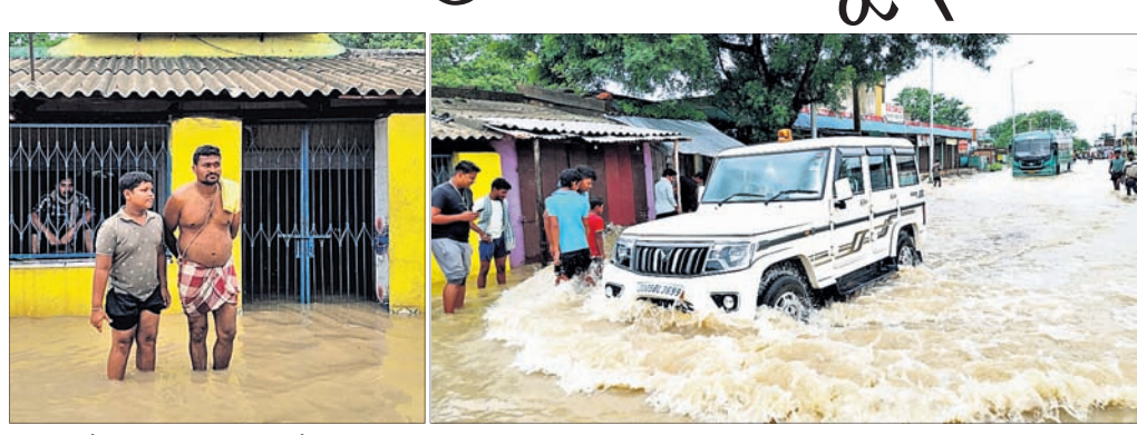
ରାସ୍ତାପାର୍ଶ୍ୱର ଏକ ଦୋକାନରେ ବର୍ଷାପାଣି ପଶିଛି । ମୁଖ୍ୟ ରାସ୍ତା ଉପରେ ପାଣି ପ୍ରବାହିତ ହେଉଛି ।