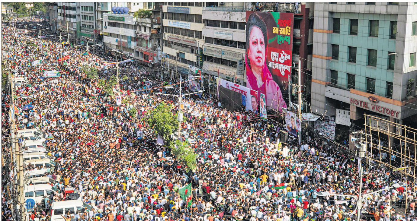
ଖାଲେଦା ଜିଆକ୍ ବାଲାଦେଶ ନ୍ୟାଶନାଲ ପାର୍ଟି (ବିଏସ୍‌ପି) ମୁଖ୍ୟାଳୟ ବାହାରେ ରୁଧିରୀ ବିଶୋଭକାରୀମାନେ ଶୋଭାଯାତ୍ରା କରୁଛନ୍ତି।