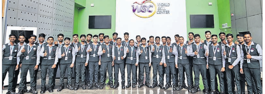
ଚାଟା ଷ୍ଟିଲ୍‌ରେ ନିୟୁକ୍ତି ପାଇଥିବା ଡବ୍ଲ୍ୟୁଏସସିର ୭୩ ଛାତ୍ରାଛାତ୍ରୀଙ୍କୁ ଚାଟା ଷ୍ଟିଲ୍‌ରେ ନିୟୁକ୍ତି ଦିଆଯାଇଛି।

ଭୁବନେଶ୍ୱର, ୭।୮ (ଅସପାପିକା ସାହୁ) ବିଶ୍ୱ ଦକ୍ଷତା କେନ୍ଦ୍ର(ଡବ୍ଲ୍ୟୁଏସସି)ରେ ବିଭିନ୍ନ ଅତ୍ୟାଧୁନିକ ବିଷୟରେ ତାଲିମ ପାଠ୍ୟକ୍ରମ ଶେଷ କରିଥିବା ଛାତ୍ରାଛାତ୍ରୀଙ୍କୁ ବ୍ୟତିକ୍ରମ ହେଲା, ସେ ନେଇ ମଧ୍ୟ ଲିଖିତ କୈଫିୟତ ଦାଖଲ କରିବାକୁ ନୋଟିସରେ ଉଲ୍ଲେଖ ରହିଛି। ନୋଟିସର ଉତ୍ତର ପାଇବା ପରେ ପରବର୍ତ୍ତୀ ପଦକ୍ଷେପ ନିଆଯିବ। ଏହି ନୋଟିସର ଖୁଲାସା କଲେ, ଖଣି ରୁକ୍ତପତ୍ର ରକ୍ତ କରାଯିବା ସହିତ ମହାପ୍ରଭୁ ଶ୍ରୀଜଗନ୍ନାଥ ବିଜେ ପୁରୀଙ୍କ ସମସ୍ତ ଭୂ-ସମ୍ପତ୍ତିର ସୁରକ୍ଷା କରାଯିବ ବୋଲି ଶ୍ରୀମନ୍ଦିର ମୁଖ୍ୟ ପ୍ରଶାସକ ତେଜାଜ ଦେଇଛନ୍ତି।