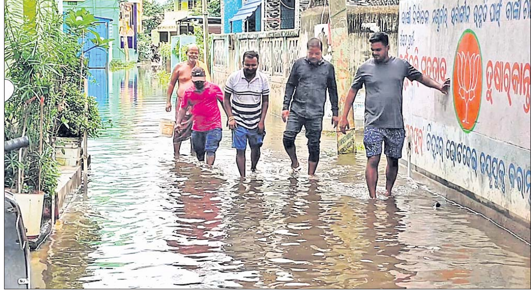
ଗାଁ ରାସ୍ତାରେ ବର୍ଷାପାଣି ଜମିରହିଛି।

ବାରଣ, ୭୮ (ଲିଙ୍ଗରାଜ ରାଉତ): ଲମ୍ବୁଚାପଜନିତ ଲଗାଣ ବର୍ଷା ସାରା ରାଜ୍ୟରେ ଲାଗି ରହିଥିବାବେଳେ ବାରଣ ଗ୍ରାମରେ ମଧ୍ୟ ଲମ୍ବୁଚାପଜନିତ ଲଗାଣ ବର୍ଷା ହୋଇଛି।