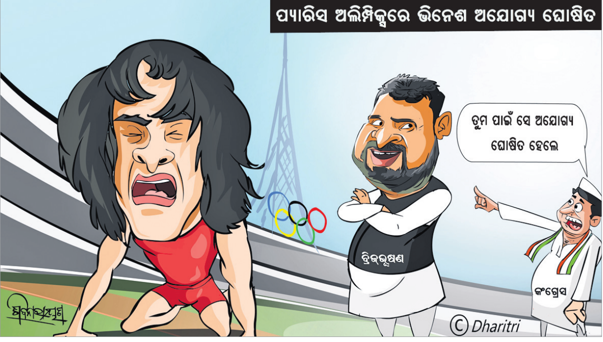
ପ୍ୟାରିସ ଅଲିମ୍ପିକ୍ସରେ ଭିନେଶ ଅଯୋଗ୍ୟ ଘୋଷିତ