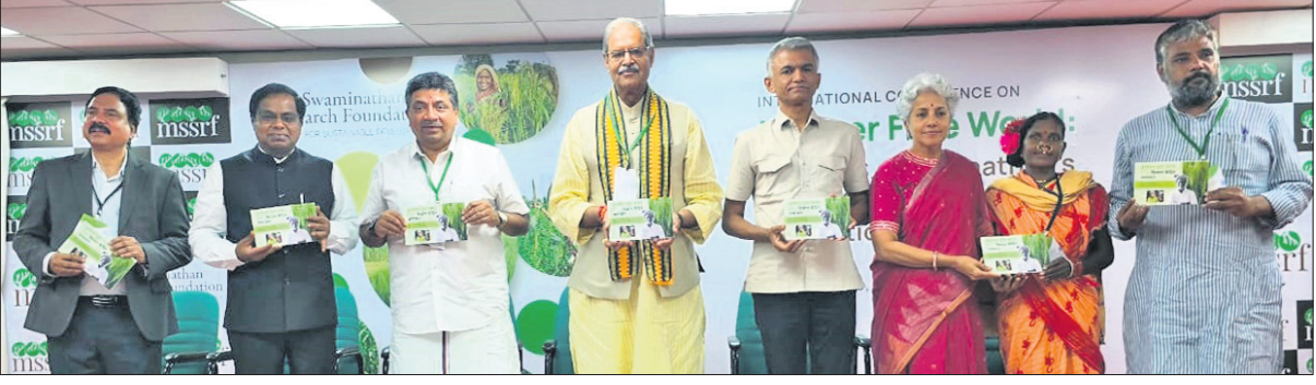
ଚେରାଇଠାରେ ଆରମ୍ଭ ହୋଇଥିବା ଅନ୍ତର୍ଜାତୀୟ ସମ୍ମିଳନୀରେ ଓଡ଼ିଶାର ଉପମୁଖ୍ୟମନ୍ତ୍ରୀ କନକବର୍ଦ୍ଧନ ସିଂହେଡ଼ି ଓ ଅନ୍ୟ ଅତିଥିମାନେ ପୁସ୍ତକ ଉନ୍ମୋଚନ କରୁଛନ୍ତି।