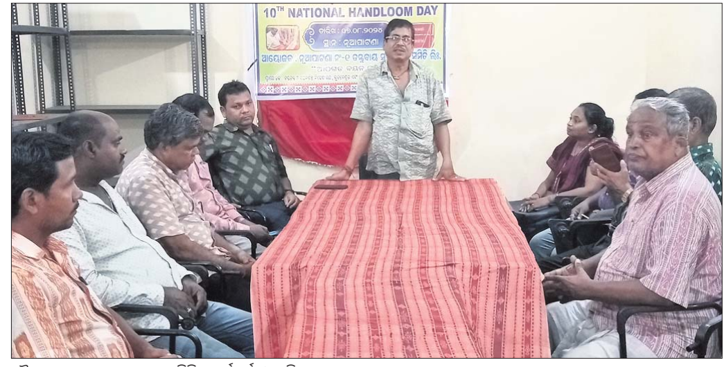
୧୦ମ ଜାତୀୟ ହସ୍ତତନ୍ତ ଦିବସ ସମିତିର କର୍ମକର୍ମୀ ଓ ଅତିଥିମାନେ।

ଚିତ୍ତିଆ ରୁକ୍ ଅନ୍ତର୍ଗତ ନୂଆପାଟଣାସ୍ଥିତ ନଂ. ୧ ଚତୁର୍ଦ୍ଦାସ ସହଯୋଗ ସମିତି ପରିସରରେ ପ୍ରଦର୍ଶନୀର ୧୦ ଜାତୀୟ ହସ୍ତତନ୍ତ ଦିବସ ପାଇଁ ଯୋଜନା କରାଯାଇଥିଲା।