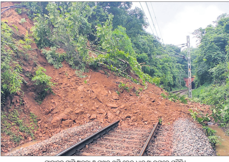
ପାହାଡ଼ରୁ ମାଟି ଅତଡ଼ା ଓ ପଥର ଖସି ରେଳ ଧାରଣା ଉପରେ ପଡ଼ିଛି।

ରାୟଗଡ଼ା, ଗାନ୍ଧୀ (ଅଶିଷ୍ଟ ରଞ୍ଜନ ପଣ୍ଡା) ରାୟଗଡ଼ା ଜିଲ୍ଲା ଶିକରପାଲ ଓ କେଉଁରଗୁଡ଼ା ରେଳ ଷ୍ଟେଶନ ମଝିରେ ଥିବା ୩୫ ନମ୍ବର ଚଳେଇ ନିକଟରେ ଗୁରୁବାର ପୂର୍ବାହ୍ନ ପ୍ରାୟ ୧୦ଟାରେ ଭୂସ୍ଥଳନ ଘଟିଛି।