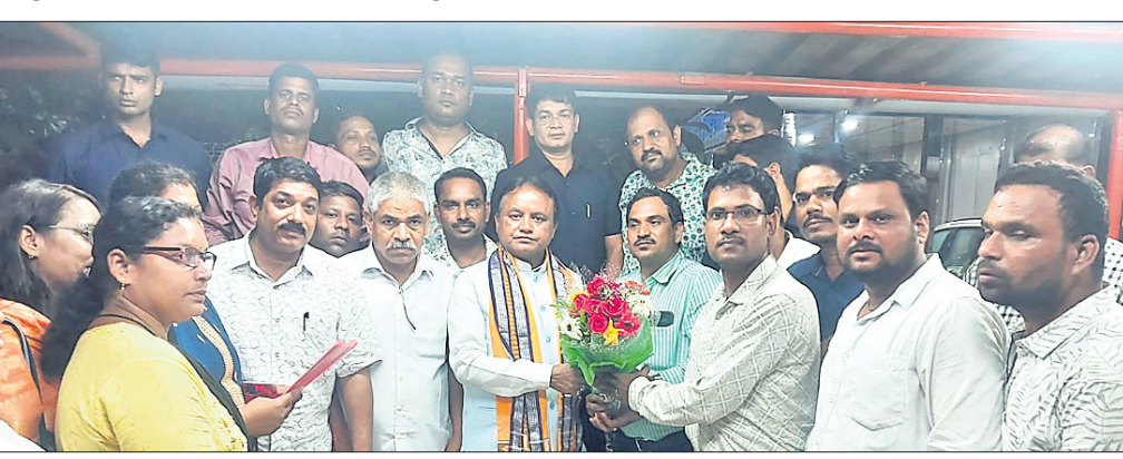
ନାଲକୋ ଏଲ୍ଏପି/ଆଇଟିଆଇ କ୍ଷତ୍ରିଗ୍ରସ୍ତ ପ୍ରଜା ସଂଘ ପକ୍ଷରୁ ପୁଝ୍ୟମନ୍ତ୍ରୀଙ୍କୁ ସାକ୍ଷାତ କରାଯାଇଛି।