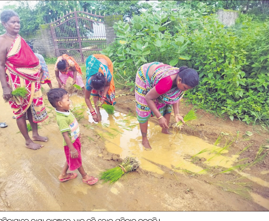
ମହିଳାମାନେ ରାସ୍ତା କାଢ଼ୁଅରେ ଧାନ ତଳି ରୋଇ ପ୍ରତିବାଦ କରୁଛନ୍ତି।