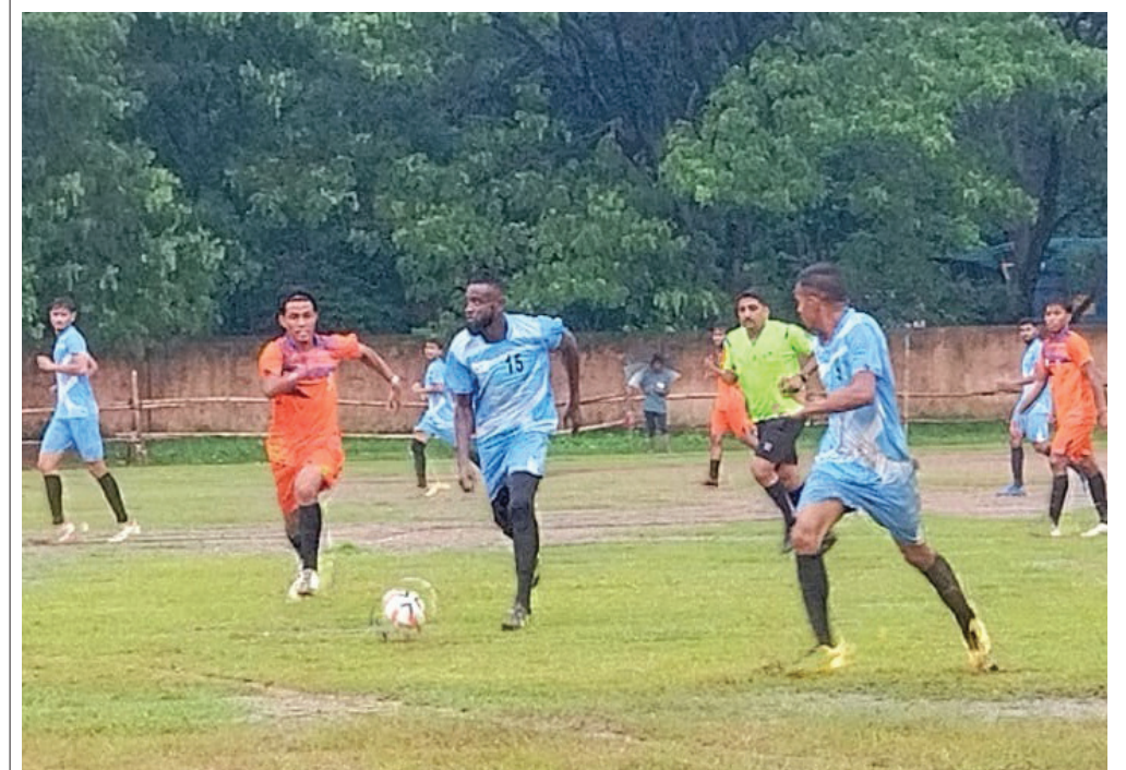
ଓ.ପି. ଜିନ୍ଦଲ ଅନୁଗୋଳ କର୍ମ ପୂର୍ବକଲର ପ୍ରଥମ କ୍ୱାର୍ଟର ଫାଇନାଲ ଗୁରୁବାର ଷୋର୍ଟ୍ ହଷ୍ଟେଲ ଓ ବରଗଡ଼ ମଧ୍ୟରେ ଖେଳାଯାଇଛି। ଏଥିରେ ବରଗଡ଼ ବିଜୟୀ ହେବା ସହ ସେମିଫାଇନାଲରେ ପ୍ରବେଶ କରିଛି।