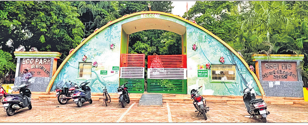
ଅନୁଗୋଳ, ୮୮ (କ୍ୟୋଡି ରଞ୍ଜନ ସାହୁ)

ଅନୁଗୋଳ ସହରବାସୀଙ୍କ ମନୋରଞ୍ଜନ ପାଇଁ ଶିକ୍ଷକପଠା ଠାରେ ପୌରପାଳିକା ପକ୍ଷରୁ ନିର୍ମାଣ କରାଯାଇଥିବା ଇକୋ ପାର୍କକୁ ନିଜ ଅଧୀନକୁ ନେଇଛି ପୌରପାଳିକା। ଏହାର ପରିଚାଳନା ଦାୟିତ୍ୱରେ ଥିବା ଠିକା ସଂସ୍ଥା ଠିକ୍ ଭାବେ ଅର୍ଥ ଦେଇ ନ ପାରିବାରୁ ଓ ବକେୟା ରଖିବାକୁ ଶେଷରେ ପୌରପାଳିକା