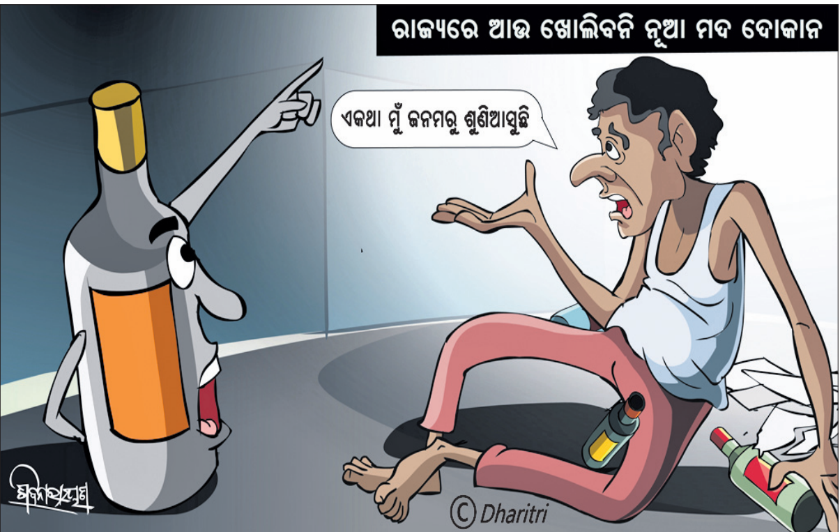
ରାଜ୍ୟରେ ଆଉ ଖୋଲିବନି ନୂଆ ମଦ ବୋକାଳ