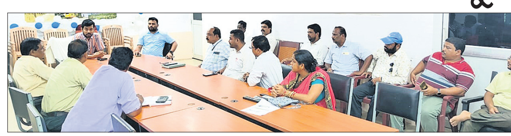
ସ୍ୱାଧୀନତା ଦିବସ ପାଳନ ଉପଲକ୍ଷେ ଅନୁଷ୍ଠିତ ପ୍ରସ୍ତୁତି ବୈଠକରେ ଉପସ୍ଥିତ ଅଧିକାରୀମାନେ।