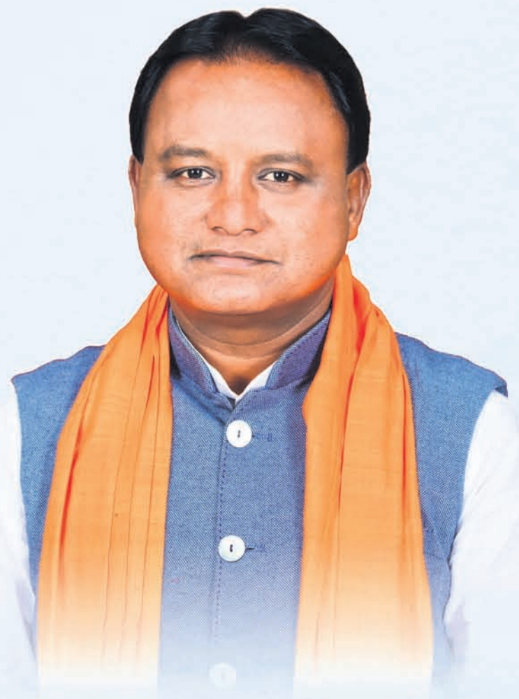
ଶ୍ରୀ ମୋହନ ଚରଣ ମାଝୀ ମାନ୍ୟବର ମୁଖ୍ୟମନ୍ତ୍ରୀ, ଓଡ଼ିଶା

ଆଜିର କାଂକ୍ଷା ପଦକ ରଚିଛି ଆସନ୍ତାକାଲି ପାଇଁ ଏକ ସ୍ୱର୍ଣ୍ଣମ ଅଧ୍ୟାୟ