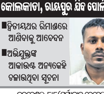
ଭୁବନେଶ୍ୱର, ୮ (ସୂଚନାକ୍ରମ ସେବା)