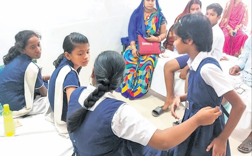
ଡାକ୍ତରଖାନାରେ ଚିକିତ୍ସିତ ହେଉଥିବା ଛାତ୍ରୀମାନେ।