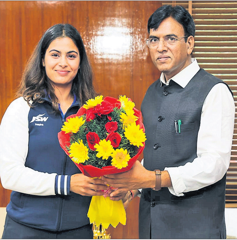
ଅଲିମ୍ପିକ୍ସରେ ତରଳ ଟ୍ରୋଫି ମେଡାଲିଷ୍ଟ ମନୁ ଭାକରଙ୍କୁ ସମର୍ଥନ କରୁଛନ୍ତି କେନ୍ଦ୍ର ଗ୍ରୀତାମନ୍ତ୍ରୀ ମନସୁଖ ମାଣିକ୍ୟ । କେନ୍ଦ୍ର ଗ୍ରୀତା ରାଷ୍ଟ୍ରମନ୍ତ୍ରୀ ରକ୍ଷା ଖତ୍ତେଙ୍କ ଦ୍ୱାରା ସମର୍ଥନ ହେବା ଅବସରରେ ଟ୍ରୋଫି ପଦକ ବିଜେତା ସ୍ୱପ୍ନା କୁସାଲ ।