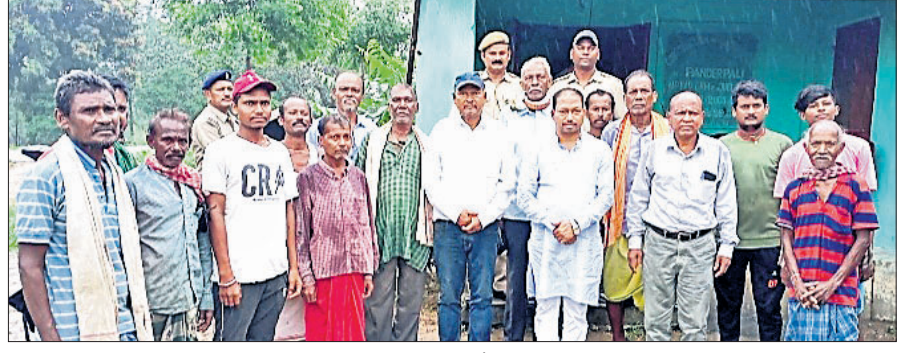
ଉପ ବାଚସ୍ପତିଙ୍କ ସହିତ ଭୂମି ସମାଜ କର୍ମକର୍ତ୍ତା।

ବଡ଼ଗାଁ, ଟାଟା (ଅଶୋକ ସହକାରୀ) ସୁନ୍ଦରଗଡ଼ ଜିଲ୍ଲା ବଡ଼ଗାଁ ବ୍ଲକ ଅନ୍ତର୍ଗତ ବିଲିପତା ପଞ୍ଚାୟତ ପାଣ୍ଡେରପାଳି ଗ୍ରାମରେ ଗୁରୁବାର ୫ ଶହ ଯର ଭୂମି ସମାଜ ପକ୍ଷରୁ ପାଠ୍ୟ ଗଛଟିଏ କାର୍ଯ୍ୟକ୍ରମ ଅନୁଷ୍ଠିତ ହୋଇଛି।