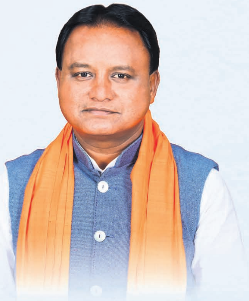
ଶ୍ରୀ ମୋହନ ଚରଣ ମାଝୀ ମାନ୍ୟବର ମୁଖ୍ୟମନ୍ତ୍ରୀ, ଓଡ଼ିଶା

ଆଜିର କାଂକ୍ଷା ପଦକ ରଚିଛି ଆସନ୍ତାକାଲି ପାଇଁ ଏକ ସ୍ୱର୍ଣ୍ଣମ ଅଧ୍ୟାୟ