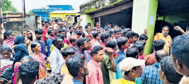
ଲ୍ୟାଣ୍ଡ୍ ସରକାରୀ ସାରରେ ଚାଷୀ ଆନ୍ଦୋଳନ କରୁଛନ୍ତି।

ଝରିଗାଁ, ୯।୮ (କିଶୋର ଚନ୍ଦ୍ର ମଣ୍ଡଳ) ନବରଙ୍ଗପୁର ଏକ କୃଷି ପ୍ରଧାନ ଜିଲ୍ଲା। ଏଠାରେ ଚାଷୀମାନେ କୃଷି କାମ ଆରମ୍ଭ କଲେଣି। ଏଥିପାଇଁ ଆବଶ୍ୟକ ସାର ଯୋଗାଇଦେବାକୁ ଝରିଗାଁ ବ୍ଲକ୍ ଚାଷୀ ଦାବି କରି ଆନ୍ଦୋଳନ କରିଛନ୍ତି। ୨ ବସ୍ତ୍ର ବଦଳରେ ୪ ବସ୍ତ୍ର ସାର ଦେବା ଦାବିରେ ଶୁକ୍ରବାର ଝରିଗାଁ ବ୍ଲକ୍ ଚାଷୀ ରାସ୍ତାରେକୋ ଓ ଲ୍ୟାଣ୍ଡ୍ ସରକାର କରୁଛନ୍ତି। ଝରିଗାଁ ବ୍ଲକ୍ରେ ମୋଟ ୪୩ଟି ଲାଲ୍ ସେକ୍ଟରସ୍ତ୍ର ସାର ବିକ୍ରୟ କେନ୍ଦ୍ର ଖୋଲାଯାଇଛି। କେବଳ ଲ୍ୟାଣ୍ଡ୍ ସରେ ହିଁ ଚାଷୀଙ୍କୁ ସରକାରୀ ସାର ବିକ୍ରୟରୁ ମୁକ୍ତ କରିବା ଦାବି କରି ଆନ୍ଦୋଳନ କରିଛନ୍ତି। ୨ ବସ୍ତ୍ର ବଦଳରେ ୪ ବସ୍ତ୍ର ସାର ଦେବା ଦାବିରେ ଶୁକ୍ରବାର ଝରିଗାଁ ବ୍ଲକ୍ ଚାଷୀ ରାସ୍ତାରେକୋ ଓ ଲ୍ୟାଣ୍ଡ୍ ସରକାର କରୁଛନ୍ତି। ଝରିଗାଁ ବ୍ଲକ୍ରେ ମୋଟ ୪୩ଟି ଲାଲ୍ ସେକ୍ଟରସ୍ତ୍ର ସାର ବିକ୍ରୟ କେନ୍ଦ୍ର ଖୋଲାଯାଇଛି। କେବଳ ଲ୍ୟାଣ୍ଡ୍ ସରେ ହିଁ ଚାଷୀଙ୍କୁ ସରକାରୀ ସାର ବିକ୍ରୟରୁ ମୁକ୍ତ କରିବା ଦାବି କରି ଆନ୍ଦୋଳନ କରିଛନ୍ତି। ୨ ବସ୍ତ୍ର ବଦଳରେ ୪ ବସ୍ତ୍ର ସାର ଦେବା ଦାବିରେ ଶୁକ୍ରବାର ଝରିଗାଁ ବ୍ଲକ୍ ଚାଷୀ ରାସ୍ତାରେକୋ ଓ ଲ୍ୟାଣ୍ଡ୍ ସରକାର କରୁଛନ୍ତି।