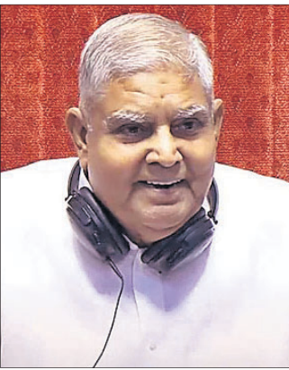
ରାଜ୍ୟ ସଭା ଅଧ୍ୟକ୍ଷ ଜଗଦୀପ୍ ଧନକର ମୁହାଁମୁହିଁ, ୯୮