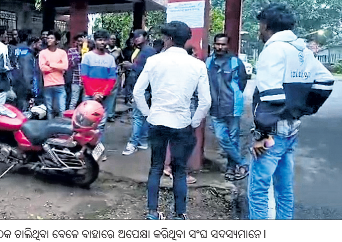
କାର୍ଯ୍ୟକ୍ରମ ଭିତରେ କର୍ମକର୍ତ୍ତାଙ୍କୁ ନେଇ ;ବୈଠକ ଚାଲିଥିବା ବେଳେ ବାହାରେ ଅପେକ୍ଷା କରିଥିବା ସଂଘ ସଦସ୍ୟମାନେ।

କାରଖାନାରେ କେଉଁ ଆଧାରରେ ୧୩୭ ବାଟ ବାହାରି ପାରି ନ ଥିଲା। ସରକାରଙ୍କ ନିୟମ ମୂତାବକ ବ୍ୟବହାର ହେଉ ନ ଥିବା କମିଟି ପ୍ରଶାସନ କମିଟିମାନଙ୍କୁ ହସ୍ତାନ୍ତର କରିବାକୁ ବିସ୍ଥାପିତ ସଂଘର ଦାବି ଥିଲା, ଏହା ହସ୍ତାନ୍ତର ନ ହେବା ପର୍ଯ୍ୟନ୍ତ ଆନ୍ଦୋଳନ ଜାରି ରହିବ। ସରକାର କିମ୍ବା ହାଲ୍ ପ୍ରଶାସନ ଜମି ଅଧିଗ୍ରହଣ ସମୟରେ ଜମି ମାଲିକଙ୍କ ମଧ୍ୟରେ ହୋଇଥିବା ରୁକ୍ମିନୀମାଳୁ ସାର୍ବଜନୀନ କରନ୍ତୁ ହାଲ୍ କରେ ସେତେବେଳେ ହୋଇଥିବା ରୁକ୍ମି ସମ୍ପର୍କରେ ପ୍ରକୃତ କଥା ଜଣାପଡ଼ିବ ବୋଲି ପୁରୁଲି ବୈଠକରେ ଦାବି କରିଥିଲେ। ଯଦି ସେତେବେଳେ ବାସ୍ତୁତତ୍ତ୍ୱ ଥିଲେ ଆନ ବଳକା ଗାଁରେ ରୁକ୍ମି ହୋଇ ନ ଥିଲା ତେବେ