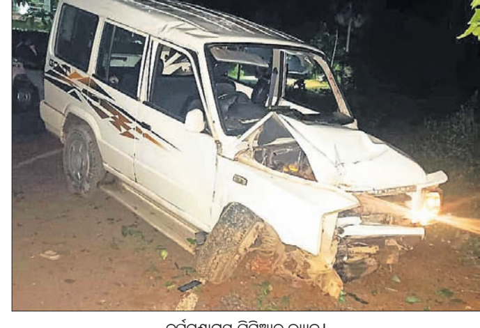
ଦୁର୍ଘଟଣାଗ୍ରସ୍ତ ପିସିଆର୍ ଭ୍ୟାନ।

ଗୋରୁ ମାଝିଆଙ୍କୁ ଗୋଡ଼ାଉଥିବାବେଳେ ପିସିଆର୍ ଭ୍ୟାନ ଦୁର୍ଘଟଣା