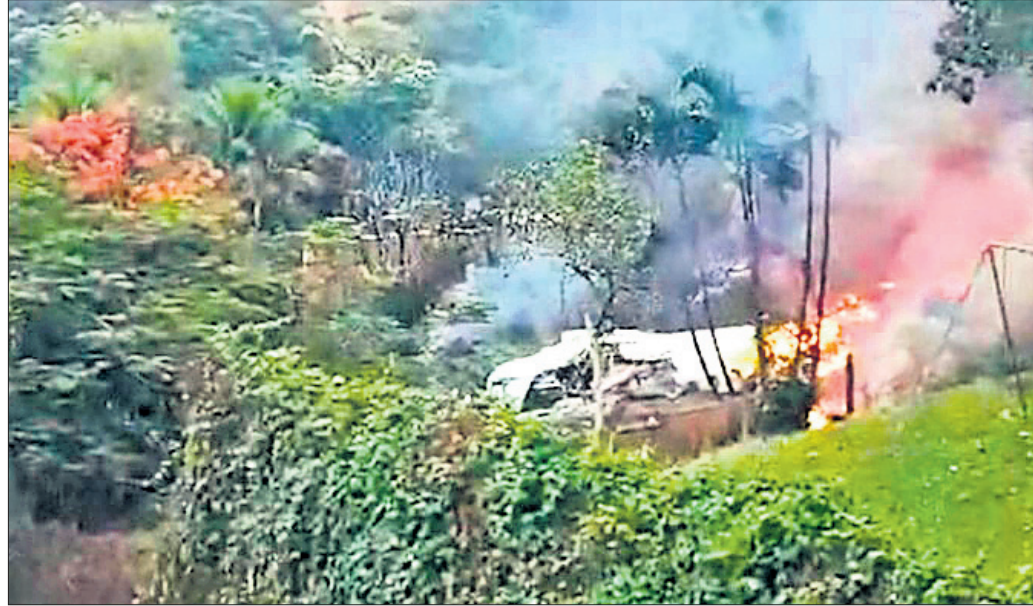
ସାଓ ପାଉଲୋ, ୯୮ ବ୍ରାଜିଲର ସାଓ ପାଉଲୋ ରାଜ୍ୟରେ ଶୁକ୍ରବାର ଏକ ବିମାନ ଦୁର୍ଘଟଣାଗ୍ରସ୍ତ ହୋଇଛି। ୫୮ ଯାତ୍ରୀ ଓ ୪ କ୍ରିଜ

ତେବେ କେହି ଗୁମାସ୍ତା ଲୋକ ମୃତାହତ ହୋଇନାହାନ୍ତି। ଅଗ୍ନିଶମ କର୍ମଚାରୀ ଉଦ୍ଧାର କାର୍ଯ୍ୟରେ ନିୟୋଜିତ ହୋଇଛନ୍ତି। ଦୁର୍ଘଟଣାସ୍ଥଳକୁ ଲାଗି ବିସ୍ତୃତ ଅଞ୍ଚଳରେ ନିଆଁ ଲାଗିବା ସହ ଧୂଆଁ ଉଠୁଥିବା ଭିତ୍ତିଓଳୁ ଦେଖିବାକୁ ମିଳିଛି। ଅନ୍ୟ ଏକ ଭିତ୍ତିଓଳୁରେ ବିମାନଟି ସିଧାସଳଖ ଡଳକୁ ଖସୁଥିବା ଦେଖାଯାଇଛି। ବିମାନଟି ପାରାମା ରାଜ୍ୟର କାସରାଭେଲକୁ ସାଓ ପାଉଲୋର ଗୁଆରୁଲୁହୋସ୍ ଅନ୍ତର୍ଜାତୀୟ ବିମାନବନ୍ଦର ଅଭିମୁଖେ ଯାଉଥିଲା। ବ୍ରାଜିଲରାଷ୍ଟ୍ରପତିଲୁଇଜ୍‌ଇନାସିଓଲୁଲାଡା ସିଲ୍ଭା ଏକ କାର୍ଯ୍ୟକ୍ରମରେ ଉଦ୍‌ବୋଧନ ଦେଉଥିବାବେଳେ ଦୁର୍ଘଟଣା ଖବର ପାଇ ଯେଠାରେ ଉପସ୍ଥିତ ଜନସାଧାରଣଙ୍କୁ ଗୋଟିଏ ମିନିଟ୍ ନୀରବତା ପାଇଁ କବିବାକୁ ନିବେଦନ କରିଥିଲେ। ଦୁର୍ଘଟଣାର କାରଣ ଜଣାପଡ଼ି ନ ଥିବା ଏୟାରଲାଇନ୍‌ର ପକ୍ଷକୁ କୁହାଯାଇଛି। ଏୟାରକର୍ମ୍ ଏବଂ ଇଟାଲିର ଏରୋସ୍ପେସ୍ ଗ୍ରୁପ୍ ଲିଓନାଡୋର ମିଳିତ ଉଦ୍ୟୋଗ ଏଟିଆର୍ ଉଚ୍ଚ ବିମାନର ନିର୍ମାତା।