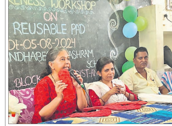
ସଚେତନତା କାର୍ଯ୍ୟକ୍ରମରେ ସୌକ୍ଷମ ମୁଖ୍ୟ ନିର୍ଦ୍ଦେଶକୀଙ୍କ ସହିତ ଅନ୍ୟମାନେ।