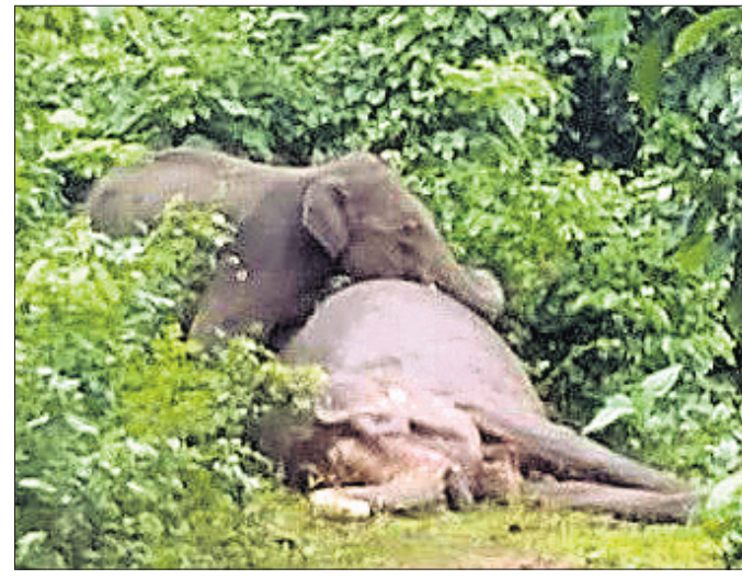
ମା' ହାତୀ ମୃତଦେହ ନିକଟରେ ଛୁଆହାତୀ।

ନେବେ କି ପ୍ରଶ୍ନରେ ମନ୍ତ୍ରୀ କହିଛନ୍ତି, ସେମିତି କିଛି ପରିସ୍ଥିତି ନ ଉଠୁଥିବା ବୋଲି ଆମେ ଚାହୁଁଛୁ। କଥାବାର୍ତ୍ତା ମାଧ୍ୟମରେ ସମସ୍ୟା ସମାଧାନ ହେବ ବୋଲି ଚାହୁଁଛୁ। କାରଣ ପଶୁମବଳ ଆମର ପଡ଼ୋଶୀ ରାଜ୍ୟ। ଆମ ସହ ଟାଙ୍କର ସମ୍ପର୍କ ଭଲ ରହିଛି। ସେମିତି ଆଳୁ ଆଣୁଥିଲେ, ସେମିତି ଆଳୁ ସେଥିପାଇଁ ଉଦ୍ୟମ ଜାରି ରହିଛି। କିନ୍ତୁ ଲୋକମାନେ ଆନ୍ତ୍ରପ୍ରଦେଶକୁ ପଶୁମବଳ ଯାଉଥିବା ମାଛ ଓ ଅଣ୍ଡା ଟ୍ରକ୍ ସବୁ ଅଟକାଇଛନ୍ତି ବୋଲି କୁଶିବାକୁ ପାଇଥିବା ମନ୍ତ୍ରୀ ପାତ୍ର କହିଛନ୍ତି।