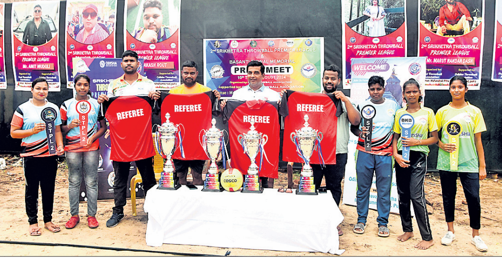
ଖବରବାତୀ ସମ୍ମିଳନୀରେ ଜର୍ଣ୍ଣି ଓ ବ୍ରୁଫି ପ୍ରଦର୍ଶନ କରାଯାଇଛି ।

ପ୍ରାଣଶ୍ରୀ ଖେଳ ପଡ଼ିଆରେ ଅନୁଷ୍ଠିତ ହେବ। ଏହି ପ୍ରିମିୟର ଲିଗ୍ ମ୍ୟାଚ୍ରେ ଓଡ଼ିଶାର କୋଣାର୍କ ଅନୁକୋଶରୁ ରାଜ୍ୟ ଓ ଜାତୀୟ ସ୍ତରରେ ଓଡ଼ିଶାକୁ ପ୍ରତିନିଧିତ୍ୱ କରିଥିବା ଖେଳାଳୀମାନେ ଅଂଶଗ୍ରହଣ କରିବେ।