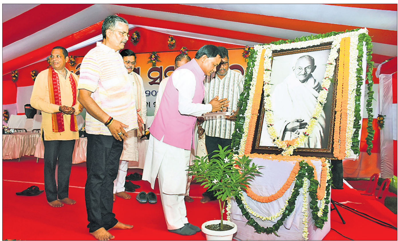
ଭୁବନେଶ୍ୱର ଶହୀଦ ସ୍ୱାଧୀନତା ସଂଗ୍ରାମୀ ଭବନଠାରେ ଶୁକ୍ରବାର ରାଜ୍ୟ ସ୍ୱାଧୀନତା ସଂଗ୍ରାମ ସମିତି ପକ୍ଷରୁ ଆୟୋଜିତ ଅଗଷ୍ଟକ୍ରାନ୍ତି ଦିବସ ଅବସରରେ ମୁଖ୍ୟମନ୍ତ୍ରୀ ମୋହନ ଚରଣ ମାଝୀ ମହାତ୍ମା ଗାନ୍ଧୀଙ୍କ ପ୍ରତି ଶ୍ରଦ୍ଧାପୂଜନ ଅର୍ପଣ କରୁଛନ୍ତି।