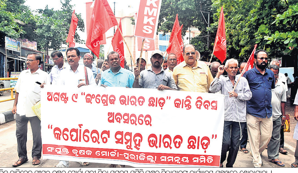
ବିଭିନ୍ନ ଦାବିନେଇ ସଂଯୁକ୍ତ କୃଷକ ମୋର୍ଚ୍ଚା ପୁରୀ ଜିଲ୍ଲା ସମସ୍ତ ସମିତି ପକ୍ଷରୁ ଜିଲ୍ଲାପାଳଙ୍କ କାର୍ଯ୍ୟାଳୟ ସମ୍ମୁଖରେ ଶୋଭାଯାତ୍ରା।

ଗୋପ, ୯୮ (ଭାରତୀ ଭୃଷଣ ଉପାଧ୍ୟାୟ) ଭାରତୀୟ ସହରୀୟ ଯୋଗରେ ପଶିଯାଇଥିବା ଏକ କାରକୁ ଗୋପ କୁହୁପୁର ଅଞ୍ଚଳର ଦମ୍ପତି ଓ ଚାଳକଙ୍କୁ ଉଦ୍ଧାର କରାଯାଇଛି।