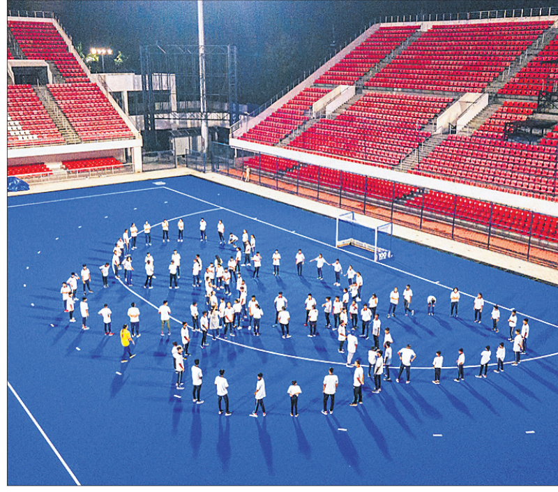
ପ୍ୟାରିସ୍ ଅଲିମ୍ପିକ୍ସରେ ଭାରତୀୟ ହକି ଦଳର ବ୍ରୋଞ୍ଜ ପଦକ ବିଜୟ ଖୁସିରେ ମୁଖ୍ୟମନ୍ତ୍ରୀ ମୋହନ ଚରଣ ନାଥ ଶୁଭ୍ରବାର କଳିଙ୍ଗ ଷ୍ଟାଡ଼ିୟମରେ କ୍ରୀଡ଼ାମନ୍ତ୍ରୀ ସୂର୍ଯ୍ୟକାନ୍ତ ପୁରକ ଓ ପ୍ରତିଭାସମ୍ପନ୍ନ କ୍ରୀଡ଼ାବିତ୍ତ୍ୱ ଗହଣରେ କେକ୍ କାଟି ଉତ୍ସବ ମନାଉଛନ୍ତି । ଅଲିମ୍ପିକ୍ସ ରିଙ୍ଗ୍ ଆକୃତିରେ ସଜ୍ଜିତ କ୍ରୀଡ଼ାବିତ୍ତ୍ୱାଳୟ ।