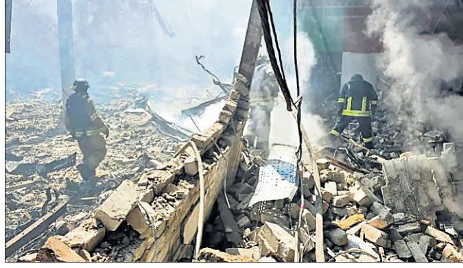
ସୁପରମାର୍କେଟ୍ ଓ ପୋଷ୍ଟ ଅଫିସକୁ ଗାଡ଼ିରେ କରିଥିବା ଲୋକେ ଆତଙ୍କିତ ଅବସ୍ଥାରେ ଥିବା ଯୁକ୍ତେନ୍ ରାଷ୍ଟ୍ରପତି ଭୋଲୋଡିମିର ଜେଲେନ୍ସ୍କି ଏକ୍ସ୍‌ରେ ଉଲ୍ଲେଖ କରିଛନ୍ତି।

ପିଶାଭଲ ପାଡ଼ରେ ୧୦ ଯୁକ୍ତେନୀୟ ମୃତ ମଧ୍ୟୋ/କିଭ୍, ୯୮ ଶତାଧିକ ଯୁକ୍ତେନୀୟ ସୈନ୍ୟ ରୁଷିଆ ଭିତରକୁ ପ୍ରବେଶ ପୂର୍ବକ ଆକ୍ରମଣ କରିବାର ୪ ଦିନ ପରେ ସୀମାରେ ମଧ୍ୟୋ ପକ୍ଷରୁ ସଂଘୀୟସୂତ୍ରରୁ ଏମର୍ଜେନ୍ସି ଜାରି କରାଯାଇଛି। ଇତିମଧ୍ୟରେ ଏକ ରୁଷିୟ ବିମାନ ଏକ ଯୁକ୍ତେନୀୟ ଶିପି ମଲ୍ ଉପରେ ମିଶାଇଲ୍ ଆକ୍ରମଣ କରିଛି। ଏଥିରେ ଅନୁମିତ ୧୦ ଜଣଙ୍କ ମୃତ୍ୟୁ ଘଟିଥିବାବେଳେ ୩୫ ଆହତ ହୋଇଛନ୍ତି। ରୁଷିଆ ଆତଙ୍କବାଦୀମାନେ ଏକ ସାଧାରଣ