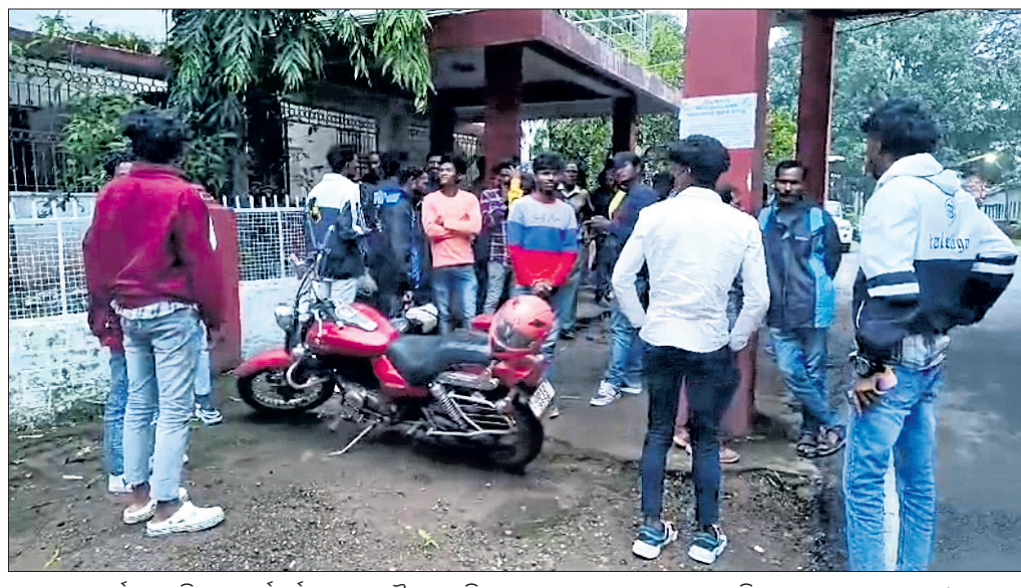
କାର୍ଯ୍ୟାଳୟ ଭିତରେ କର୍ମଚାରୀଙ୍କୁ ନେଇ ବୈଠକ ଚାଲିଥିବା ବେଳେ ବାହାରେ ଅପେକ୍ଷା କରିଥିବା ସଂଘ ସଦସ୍ୟମାନେ।