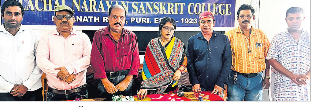
ଆଲୋଚନାରେ ଯୋଗଦେଇଥିବା ଅତିଥି ।

ପୁରୀ, ୯୮ (ଅଜିତ କୁମାର ମହାନ୍ତି) ଅଗଷ୍ଟ ୯ ତାରିଖ ଦିବସ, ନାଗାସାକି ଦିବସ ଏବଂ ବିଶ୍ୱ ଆଦିବାସୀ ଦିବସ ଅବସରରେ ଶୁକ୍ରବାର ନାଳଚକ ନାଗାୟାଣ ସଂସ୍କୃତ ମହାବିଦ୍ୟାଳୟ କାଟାସ ସେବା ଯୋଜନା ଆରମ୍ଭକାରୀଙ୍କୁ ଅନୁଷ୍ଠିତ ହୋଇଥିଲା।