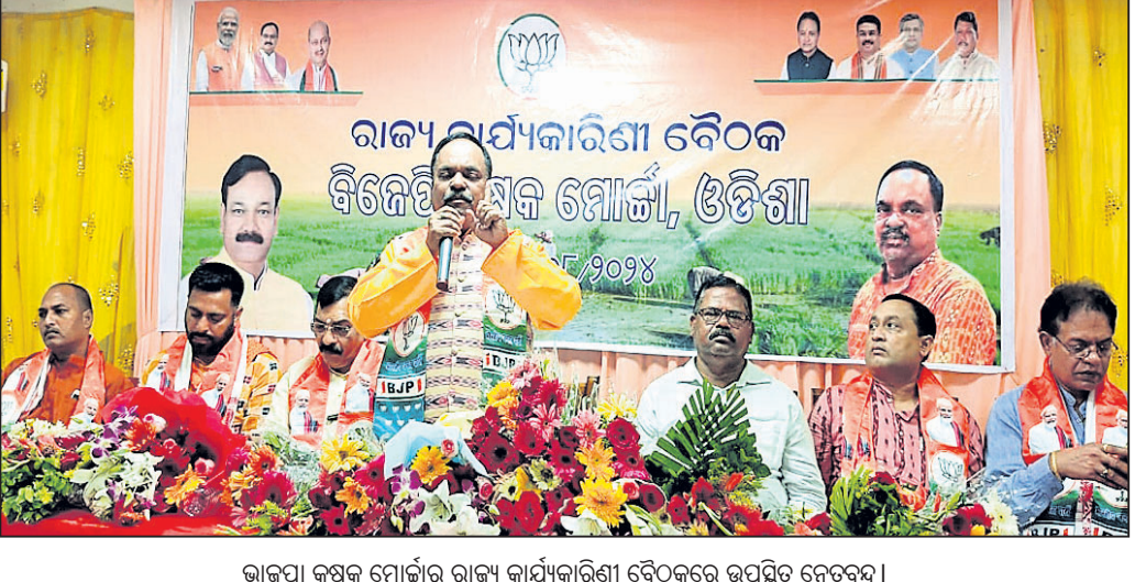
ଭାଜପା କୃଷକ ମୋର୍ଚ୍ଚାର ରାଜ୍ୟ କାର୍ଯ୍ୟକାରୀଣା ବୈଠକରେ ଉପସ୍ଥିତ ନେତୃତ୍ୱ ।