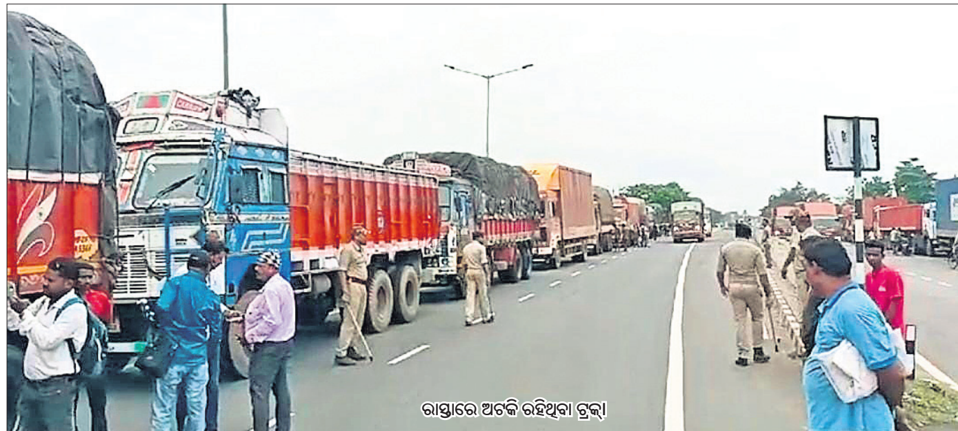
ରାସ୍ତାରେ ଅଟକି ରହିଥିବା ଟ୍ରକ୍

ଓଡ଼ିଶାକୁ ଆଳୁ ଗାଡ଼ି ନ ଛାଡ଼ିବାର ପ୍ରତିକ୍ରିୟା