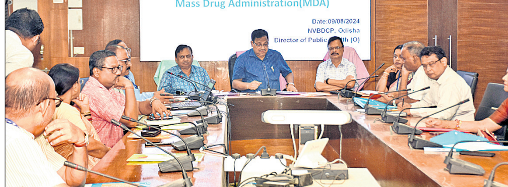
ଖବରଦାତା ସମ୍ମିଳନୀରେ ଏନଡିଏ ସମ୍ପର୍କରେ ସୂଚନା ଦିଆଯାଇଛି।

ଏବଂ ଚୁକ୍ତିରେ ଅସ୍ପଷ୍ଟ ଲୋକ ଏହି ଔଷଧ ଖାଇବେ ନାହିଁ। ଏହି କାର୍ଯ୍ୟକ୍ରମରେ ୭୭,୨୯୧ ଡ୍ରଗ୍ ଆଡ଼ମିନିଷ୍ଟ୍ରେସନ୍ ନିୟୋଜିତ ହୋଇଛି। ଏମାନଙ୍କ କାର୍ଯ୍ୟକୁ ତଦାରଖ କରିବା ପାଇଁ ୭୭୫୫୫ର ସୁପରଭାଇଜର୍ ଚିକିତ୍ସା ଖାଇବାକୁ ଦିଆଯିବ। ୨ ବର୍ଷରୁ କମ୍ ବୟସର ଶିଶୁ, ଗର୍ଭବତୀ ମହିଳା