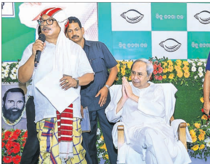
ଶଙ୍ଖ ଭବନରେ ଶୁଭକାରୀ ବିଜେଡି ପକ୍ଷରୁ ଆୟୋଜିତ ବିଶ୍ୱ ଆଦିବାସୀ ଦିବସରେ ସଭାପତି ନବୀନ ପଟ୍ଟନାୟକ ।

ବିଜେଡି ପକ୍ଷରୁ ଶଙ୍ଖ ଭବନରେ ଶୁଭକାରୀ ବିଶ୍ୱ ଆଦିବାସୀ ଦିବସ ପାଳିତ ହୋଇଯାଇଛି । ଏଥିରେ ମୁଖ୍ୟ ଅତିଥି ଭାବେ ଯୋଗଦେଇ ବିଜେଡି ସଭାପତି ତଥା ପୂର୍ବତନ ମୁଖ୍ୟମନ୍ତ୍ରୀ ନବୀନ ପଟ୍ଟନାୟକ କହିଛନ୍ତି, ଜନଜାତି ସମ୍ପ୍ରଦାୟର ବିକାଶ ବିନା ଓଡ଼ିଶାର ବିକାଶ ସମ୍ଭବ ନୁହେଁ । ରାଜ୍ୟର ସମସ୍ତାୟ ଜନସଂଖ୍ୟାର ପ୍ରାୟ ଏକ ଚତୁର୍ଥାଂଶ ଆଦିବାସୀ ସମ୍ପ୍ରଦାୟ । ସେମାନଙ୍କ କଲ୍ୟାଣ ଏବଂ ସଂସ୍କୃତିର ସୁରକ୍ଷା ପାଇଁ ବିଜେଡି ସରକାର ଅନେକ ପଦକ୍ଷେପ ନେଇଥିଲେ । କୋରାପୁଟରେ ଶହାଦ ଲକ୍ଷ୍ମଣ ନାୟକ ମେଡିକାଲ କଲେଜ, କଳାହାଣ୍ଡିରେ ଶହାଦ ରେଣ୍ଡୋ ମାଡି ମେଡିକାଲ କଲେଜ, ବାରିପଦାରେ ପଣ୍ଡିତ ରଘୁନାଥ ମୁର୍ମୁ ମେଡିକାଲ କଲେଜ ଏବଂ ରାଉରକେଲାରେ ଜଗଦୀପ୍ ବିଦ୍ୟା ମୁଖ୍ୟା ହକ୍ ସ୍ମୃତିୟମ ବିଜେଡି ସରକାର କରୁଛନ୍ତି । ସେମାନଙ୍କ ସଂସ୍କୃତିର ସୁରକ୍ଷା ପାଇଁ ବିଜେଡି ସରକାର କ୍ଷେତ୍ରୀୟ ଡେଭେଲପମେଣ୍ଟ କାଉନ୍ସିଲ ଗଠନ କରିଥିଲେ । ଏହା ଥିଲା ସାରା ଦେଶରେ ଏକ ନୂଆ ପଦକ୍ଷେପ । କଙ୍ଗାଳ ଜମି ଅଧିକାର, ଶିକ୍ଷାର ପ୍ରସାର, ଜୀବିକାର ସୁରକ୍ଷା ବା ସାହାଜି ଭାଷାକୁ ସମ୍ପାଦନ ଅଧିକାର ଅନୁରୋଧରେ ସାମିଲ କରିବା ଏସବୁ କାମ ବିଜେଡି ସରକାର ସମାପନ କରିଛନ୍ତି । ବିଜେଡି ସରକାର ୧୬୯ କମ୍ୟୁନିଟିଙ୍କୁ ଜନଜାତି ସମ୍ପ୍ରଦାୟର ମାନ୍ୟତା ପ୍ରଦାନ ପାଇଁ କେନ୍ଦ୍ର ସରକାରଙ୍କ