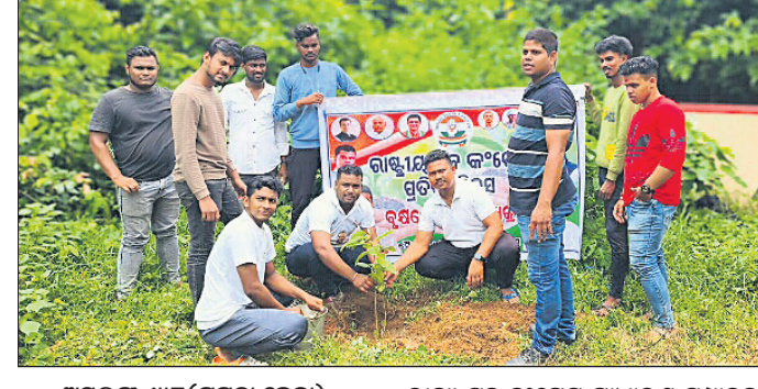
ଅସ୍ତରଙ୍ଗ, ୯୮ (ମମତା କେନା)

କାକଟପୁର ବ୍ଲକ୍ ଯୁବ କଂଗ୍ରେସ ପକ୍ଷରୁ ରାଷ୍ଟ୍ରୀୟ ଯୁବ କଂଗ୍ରେସ ପ୍ରତିଷ୍ଠା ଦିବସ ପାଳିତ ହୋଇଥିଲା।