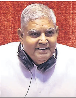
ରାଜ୍ୟ ସଭା ଅଧ୍ୟକ୍ଷ ଜଗଦୀପ୍ ଧନକର ନୂଆଦିଲ୍ଲୀ, ୯/୮

ରାଜ୍ୟ ସଭା ଅଧ୍ୟକ୍ଷ ଜଗଦୀପ୍ ଧନକର ଏବଂ ଅଭିନେତ୍ରୀ ସମାଜବାଦୀ ପାର୍ଟି ସମ୍ପର୍କିତ ହୋଇଥିବା ଜୟା ବଚନକୁ ନେଇ ଶୁଭକାରୀ ଅପରାଧରେ କୋର୍ଟଦାର କଥା କଟାକଟି ହୋଇଥିଲା । ଗୃହର ସଦସ୍ୟମାନଙ୍କ ପ୍ରତି ଧନକରଙ୍କ ଭାଷା ଗ୍ରହଣୀୟ ନୁହେଁ ବୋଲି ଜୟା ଅଭିଯୋଗ କରିଥିଲେ । ଏଥିରେ ରାଜ୍ୟ ସଭା ଧନକର ଏସ୍ପି ସଦସ୍ୟଙ୍କୁ ଆଉ କହିବା ପାଇଁ ସୁଯୋଗ ଦେଇ ନ ଥିଲେ । ଜୟା ବଚନ ସେଲିବ୍ରିଟି ହୋଇପାରିବ, କିନ୍ତୁ ତାଙ୍କୁ ଗୃହର ସମ୍ପର୍କିତ ହୋଇଥିବା କଥା କଟାକଟି ହେବ ବୋଲି ଧନକର କହିଥିଲେ । ଜୟାଙ୍କୁ ସମର୍ଥନ ଜଣାଇ କଂଗ୍ରେସ ନେତ୍ରୀ