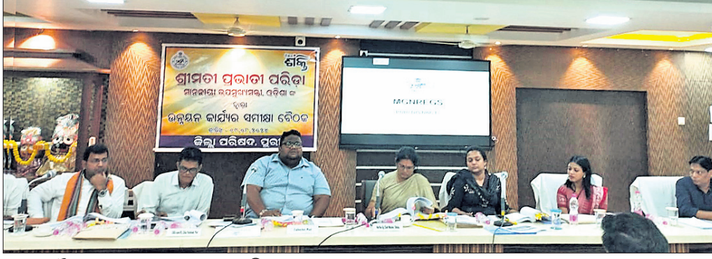
ସମାପ୍ତି ବୈଠକରେ ଉପମୁଖ୍ୟମନ୍ତ୍ରୀ ପ୍ରଭାତୀ ପରିଡ଼ା ଏବଂ ଅଧିକାରୀମାନେ।

ପୁରୀ ଜିଲ୍ଲାରେ କାର୍ଯ୍ୟକାରୀ ହେଉଥିବା ବିଭିନ୍ନ ଭବନନିର୍ମାଣ ଯୋଜନାର ସମାପ୍ତି କରିଛନ୍ତି ଉପମୁଖ୍ୟମନ୍ତ୍ରୀ ପ୍ରଭାତୀ ପରିଡ଼ା।