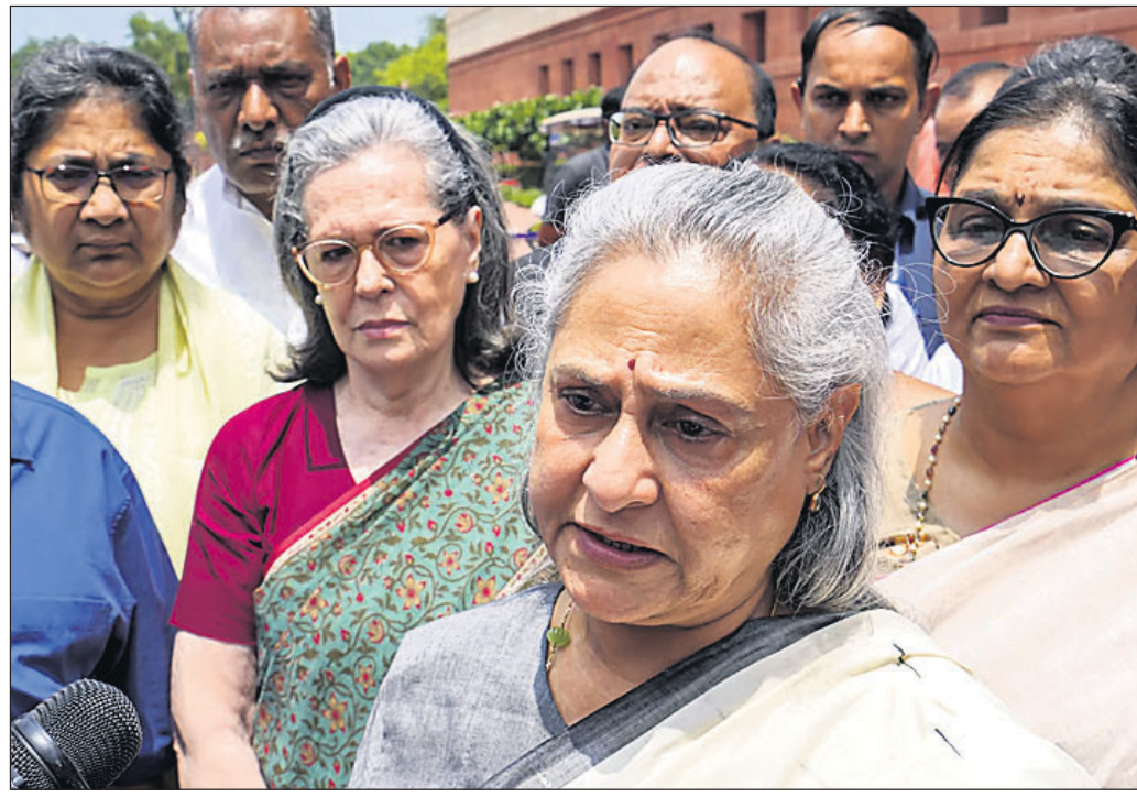
ରାଜ୍ୟ ସଭାକୁ କ୍ଷମତା ଦେବା ପରେ ଗଣମାଧ୍ୟମ ଆଗରେ ବକ୍ତବ୍ୟ ରଖୁଛନ୍ତି ସମାଜବାଦୀ ପାର୍ଟି ସଦସ୍ୟା ଜୟା ବଚନ । ନିକଟରେ ଅଛନ୍ତି କଂଗ୍ରେସ ସଂସଦୀୟ ଦଳ ନେତ୍ରୀ ସୋନିଆ ଗାନ୍ଧୀ ।

ରାଜ୍ୟ ସଭା ଅଧ୍ୟକ୍ଷ ଜଗଦୀପ୍ ଧନକର ଏବଂ ଅଭିନେତ୍ରୀ ସମାଜବାଦୀ ପାର୍ଟି ସମ୍ପର୍କିତ ହୋଇଥିବା ଜୟା ବଚନକୁ ନେଇ ଶୁଭକାରୀ ଅପରାଧରେ କୋର୍ଟଦାର କଥା କଟାକଟି ହୋଇଥିଲା । ଗୃହର ସଦସ୍ୟମାନଙ୍କ ପ୍ରତି ଧନକରଙ୍କ ଭାଷା ଗ୍ରହଣୀୟ ନୁହେଁ ବୋଲି ଜୟା ଅଭିଯୋଗ କରିଥିଲେ । ଏଥିରେ ରାଜ୍ୟ ସଭା ଧନକର ଏସ୍ପି ସଦସ୍ୟଙ୍କୁ ଆଉ କହିବା ପାଇଁ ସୁଯୋଗ ଦେଇ ନ ଥିଲେ । ଜୟା ବଚନ ସେଲିବ୍ରିଟି ହୋଇପାରିବ, କିନ୍ତୁ ତାଙ୍କୁ ଗୃହର ସମ୍ପର୍କିତ ହୋଇଥିବା କଥା କଟାକଟି ହେବ ବୋଲି ଧନକର କହିଥିଲେ । ଜୟାଙ୍କୁ ସମର୍ଥନ ଜଣାଇ କଂଗ୍ରେସ ନେତ୍ରୀ