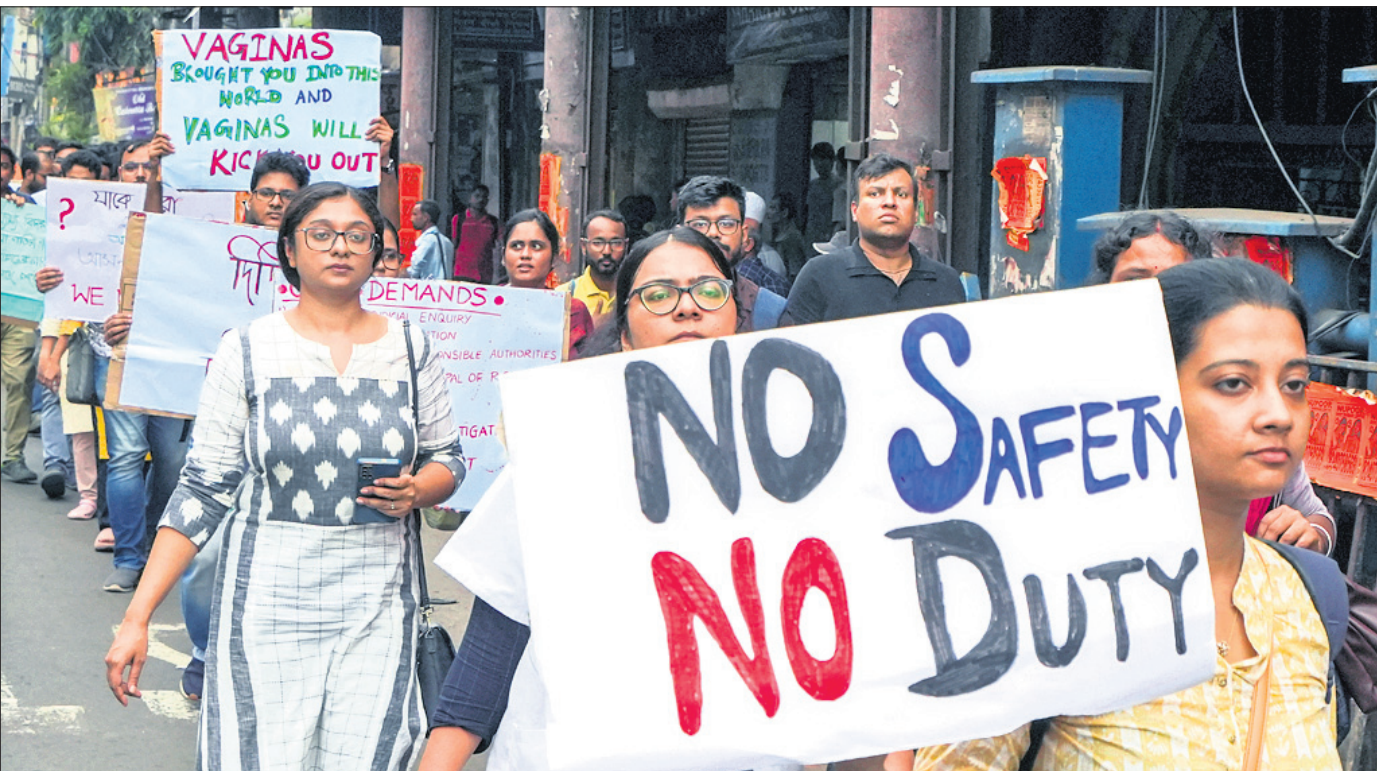
ତ୍ରେନି ମହିଳା ତାଙ୍କୁ ବଳାହାର ଓ ହତ୍ୟା ପ୍ରତିବାଦରେ କୋଲକାତାରେ ସୋମବାର କୁନିୟର ତାଙ୍କୁ, ତ୍ରେନି ତାଙ୍କୁ ଏବଂ ତାଙ୍କୁ ଶାନ୍ତାହାତୀମାନେ ବିଶୋଭ ଶୋଭାଯାତ୍ରା କରୁଛନ୍ତି।

ଅଭିନେତା ସନି ଦେଓଙ୍କ 'ଲାହୋର ୧୯୪୭' ଫିଲ୍ମର ଶୁଣି ଶେଷ ହୋଇଥିବା ନେଇ ରିପୋର୍ଟ ପ୍ରକାଶ ପାଇଛି।