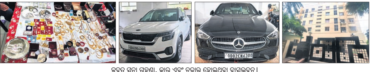
ଜବତ ସୁନା ଗହଣା, କାର ଏବଂ ଚଢ଼ାଇ ହୋଇଥିବା ବାସଭବନ।