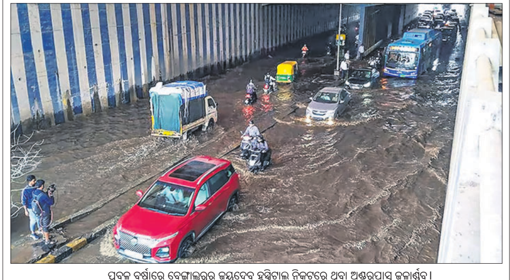
ପ୍ରବଳ ବର୍ଷାରେ ବେଙ୍ଗାଳୁରୁର ଜୟଦେବ ହସ୍ତିଶାଳ ନିକଟରେ ଥିବା ଅଣ୍ଡରପାସ୍ ଜଳାଶୟନ।

କରିବା ପରେ ଆଦାନୀ ମହାତ୍ମ୍ୟାନ୍ତର ମାମଲାରେ ତଦନ୍ତ ପରିଚାଳନାରେ ସେବି ଅଧିକାରୀ ମାଧବୀଙ୍କ ସାଧୁତାକୁ ନେଇ ପ୍ରଶ୍ନ ଉଠିଛି। ଆଦାନୀ ଗ୍ରୁପ୍ ଷ୍ଟକ୍ କାଲିଆତି ପାଇଁ ବ୍ୟବହାର କରୁଥିବା ବରପୂର୍ଣ୍ଣା ଓ ମରିସପ୍ଲିତ ଅପରାଧ କମ୍ପାନୀଗୁଡ଼ିକରେ ମାଧବୀ ଓ ତାଙ୍କ ସ୍ୱାମୀ ପୂର୍ଣ୍ଣନିବେଶ କରିଥିବା ହିନ୍ଦେନ୍ବର୍ଗ ଦ୍ୱିତୀୟ ରିପୋର୍ଟରେ ଦର୍ଶାଯାଇଛି।