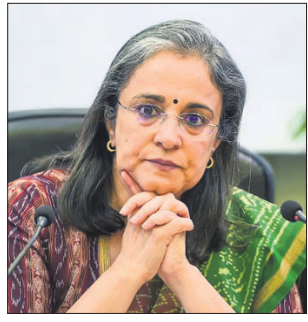
ମାଧବୀ ପୁରୀ ବୁକ୍ସ

କେତେକ ଆର୍ଥିକ କାରବାରକୁ ନେଇ ଚାଲିଥିବା ତଦନ୍ତ ଉପରେ ସେବି ନିଜ ବିବୃତି ଜରିଆରେ ଖୁବ୍ ସକ୍ରିୟ ସମ୍ପର୍କ ଭାବରେ ଦେଖାଇବାକୁ ଉଦ୍ୟମ କରୁଥିବା କଂଗ୍ରେସର ଯୋଗାଯୋଗ ଦାୟିତ୍ୱରେ ଥିବା ସାଧାରଣ ସମ୍ପର୍କ (ଏସ୍ଆଇଟି)କୁ ହସ୍ତାନ୍ତର କରନ୍ତୁ ସମନ ଜାରି କରିବା ସହ ୧,୧୦୦ ଟି ଓ ଲମ୍ବେଲ୍ ପଠାଇବା ସହ ୧୨,୦୦୦ ପୁସ୍ତକ ୩୦୦ ଡକ୍ୟୁମେଣ୍ଟ ଯାଞ୍ଚ କରିଥିବା ପ୍ରଧାନମନ୍ତ୍ରୀ ଏବଂ ଟେକ୍ସିକ ବ୍ୟବସାୟୀ ସମ୍ପୂର୍ଣ୍ଣ। ତେଣୁ ଏହାର ତଦନ୍ତ ପାଇଁ ତୁରନ୍ତ ଅଧିକାରୀଙ୍କୁ ସୃଷ୍ଟି କରିବା ସହ ଉଚ୍ଚ ମାଧବୀ ଏହା ପ୍ରସ୍ତୁତ କରିବା ସହ ଉଚ୍ଚ ଡିଭିଜନ୍ ନିଜକୁ ଦୂରରେ ରଖିଥିଲେ ବୋଲି ବକାର ନିୟାମକ କହିବାର ଦିନକ ପରେ କଂଗ୍ରେସ ଉପରୋକ୍ତ ଅଭିଯୋଗ ଆଣିଛି। ଆଦାନୀ ଗ୍ରୁପ୍