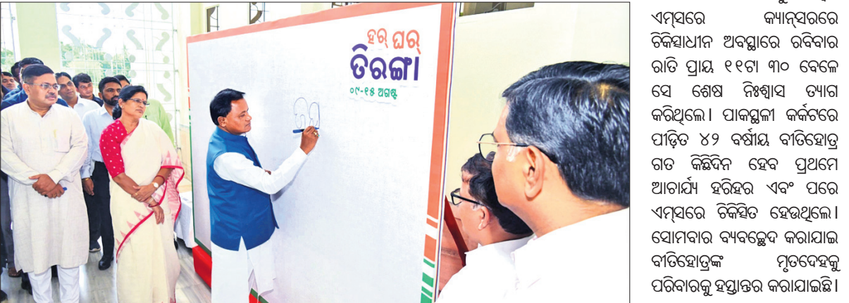
ଲୋକସେବା ଭବନରେ ମୁଖ୍ୟମନ୍ତ୍ରୀ ମୋହନ ଚରଣ ମାଝୀ ‘ହର ଘର ଡିଜିଟାଲ’ କ୍ୟାମ୍ପେନ୍ରେ ସାକ୍ଷର କରୁଛନ୍ତି।