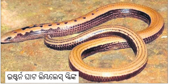
କାଷ୍ଠିୟ ଘାଟ ଲିଗ୍‌ଲେସ୍ ସିଙ୍କ

ଚକନଶାଳ ଆଖୁପତା ରହିଥାଏ। ତେବେ ଓଡ଼ିଶାରେ ଏମିତି ଦୁଇଟି ପ୍ରଜାତିର ଲିଜାର୍ଡ ଦେଖାଯାଆନ୍ତି, ଯେଉଁମାନଙ୍କର ବିଶେଷତ୍ୱ ହେଲା ସେମାନେ ଗୋଡ଼ବିହୀନ(ଲେଗ୍‌ଲେସ୍) ବା ଲିମ୍-ଲେସ୍। ଏହି ଦୁଇ ଲିଜାର୍ଡର ନାମ ହେଲା ବରକୁଦ ଲେଗ୍‌ଲେସ୍ ସିଙ୍କ ଏବଂ କାଷ୍ଠିୟ ଘାଟ ଲିମ୍-ଲେସ୍ ସିଙ୍କ। ଏଇ ଦୁଇ ଲିଜାର୍ଡ ଚମ୍ପେଇ ନେଉଳ ପରିବାର ଅନ୍ତର୍ଭୁକ୍ତ। ବରକୁଦ ଲେଗ୍‌ଲେସ୍ ସିଙ୍କ ୧୯୧୭ ମସିହାରେ ଚିଲିକା ହ୍ରଦ ଭିତରେ ଥିବା ବରକୁଦ ଝାପରେ ପ୍ରଥମ କରି ଆବିଷ୍କାର ହୋଇଥିଲା। ଏହାକୁ ଆନନ୍ଦଲେ ଆବିଷ୍କାର କରିଥିଲେ। ଆଜି ପର୍ଯ୍ୟନ୍ତ