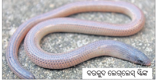
ବରକୁଦ ଲେଗ୍‌ଲେସ୍ ସିଙ୍କ