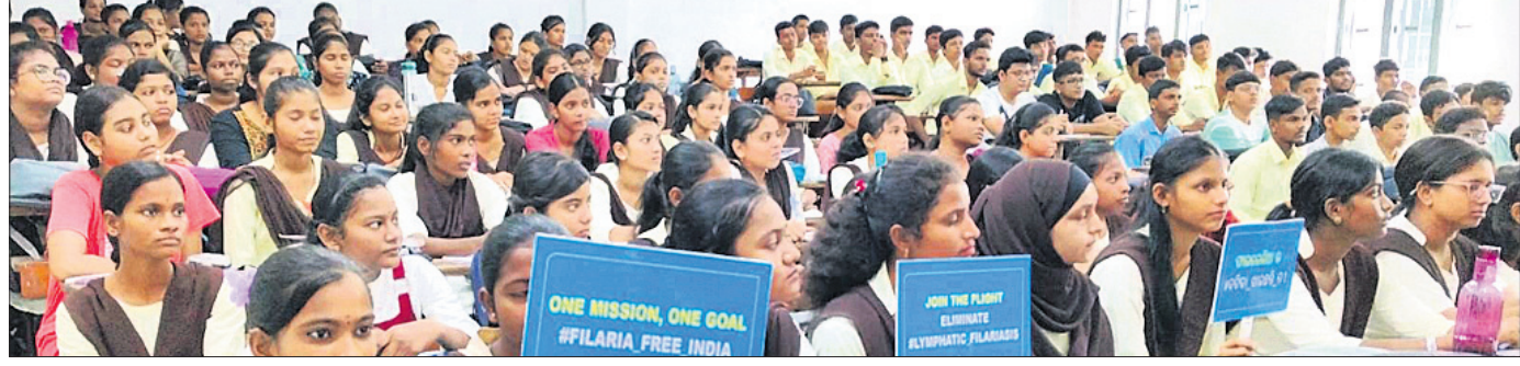
ଦେଶାନ୍ତର କଲେଜରେ ସାମୂହିକ ଔଷଧ ସେବନ କାର୍ଯ୍ୟକ୍ରମ।

ଦେଶାନ୍ତର, ୧୩୮୮ (ରତନ ନାୟର) ଦେଶାନ୍ତର ସ୍ୱୟଂଶାସିତ ମହାବିଦ୍ୟାଳୟରେ ସୋମବାର ଜାତୀୟ ସେବା ଯୋଜନା ଆନୁକୂଲ୍ୟରେ ଲିମ୍ଫାଟିକ୍ ପାଇଲେରିଆସିଦ୍ଧି ନିରାକରଣ ଅଭିଯାନ ପରିପ୍ରେକ୍ଷାରେ ସାମୂହିକ ଔଷଧ ସେବନ କାର୍ଯ୍ୟକ୍ରମ ଆରମ୍ଭ ହୋଇଥିଲା। ଜିଲ୍ଲା ସ୍ୱାସ୍ଥ୍ୟ ଅଧିକାରୀମାନଙ୍କ ଉପସ୍ଥିତିରେ ସାମୂହିକ ଔଷଧ ସେବନରେ ୧୩୦୦