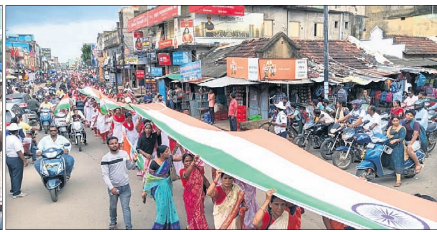
ଦେଶାନ୍ତରରେ ହର୍ ଘର୍ ତ୍ରିରଙ୍ଗା ଶୋଭାଯାତ୍ରା ଅବସରରେ ଜିଲ୍ଲାପ୍ରଧାନ ତ୍ରିରଙ୍ଗା ଶୋଭାଯାତ୍ରା ସହର ପରିକ୍ରମା କରୁଛି।