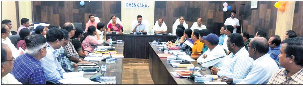
ବିଭିନ୍ନ ବିଭାଗୀୟ ଅଧିକାରୀଙ୍କ ଉପସ୍ଥିତିରେ ଉନ୍ନୟନ କାର୍ଯ୍ୟର ସମୀକ୍ଷା କରୁଛନ୍ତି ଜିଲ୍ଲାପାଳ।