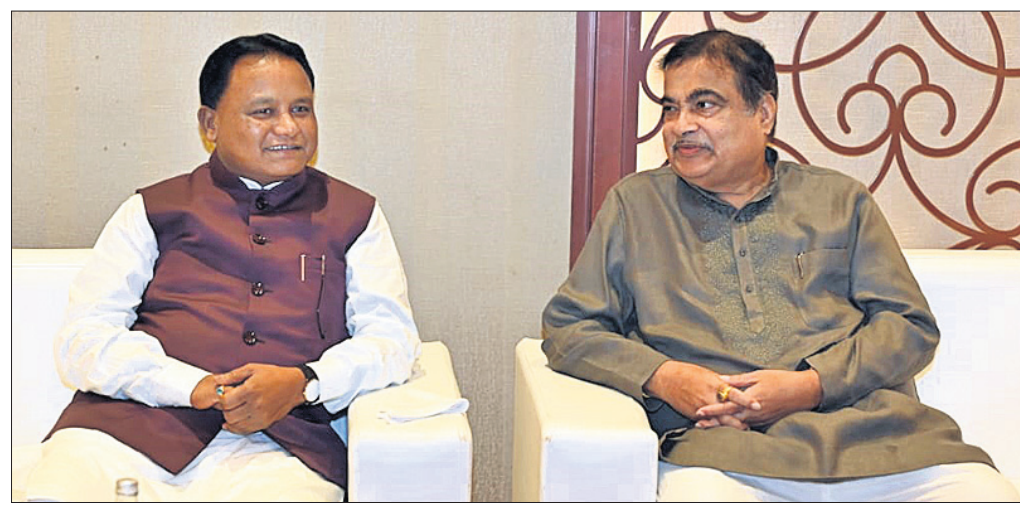
ନୂଆଦିଲ୍ଲୀରେ କେନ୍ଦ୍ର ସଡ଼କ ଓ ପରିବହନ ମନ୍ତ୍ରୀ ନୀତିନ ଗଡ଼କରାଙ୍କ ସହ ମୁଖ୍ୟମନ୍ତ୍ରୀ ମୋହନ ଚରଣ ମାଝା ।