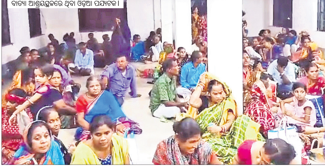
ବାତ୍ୟା ଆଶ୍ରୟସ୍ଥଳରେ ଥିବା ଓଡ଼ିଆ ପର୍ଯ୍ୟଟକ।

ବାଲେଶ୍ୱର, ୧୩।୮ (ବାସ୍ତବିନିଧି ଦେ) ସମ୍ପ୍ରତି ବାଲେଶ୍ୱରରେ ରାଜନୈତିକ ଅସ୍ଥିରତାକୁ ନେଇ ସେଠାରେ ଦଙ୍ଗା ଘଟି ରହିଛି। ଏହାର ପ୍ରଭାବ ପଶୁମତାମତରେ ଦେଖିବାକୁ ମିଳିଛି। ଏହି ପରିସ୍ଥିତିରେ ଓଡ଼ିଶାର ଗଣତନ୍ତ୍ର ଉର୍ଦ୍ଧ୍ୱ ପର୍ଯ୍ୟଟକଙ୍କୁ ମଜଲସ୍‌ରେ ପଶୁମତାମତ ସମାପନରେ ହତହତା ହେବାକୁ ପଡ଼ିଛି। ସେଠାରେ ଲୋକେ ପର୍ଯ୍ୟଟକଙ୍କ ବସ୍, ବୋଲେରୋର କାଟ ଆଦି ଭଙ୍ଗାଉଛନ୍ତି କରି ଅଟକାଇ ରଖିବା ଅଭିଯୋଗ ହୋଇଛି। ଏହାପରେ ଭିଡ଼ିଓ ମାଧ୍ୟମରେ ସେମାନଙ୍କୁ ସୂଚନା ଦିଆଯାଇ ଓଡ଼ିଶା ଫେରାଇ ଆଣିବା ପାଇଁ ନିବେଦନ କରାଯାଇଛି।