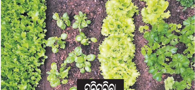
ପରିପତ୍ତିରା ତଳି ପଗାଳିରେ ସାର ପ୍ରୟୋଗ

ଏହାକୁ ଛେଳିମାନଙ୍କୁ ଖାଇବାକୁ ଦିଆଯିବ । ବାହ୍ୟ ପରଜୀବୀ ବର୍ଷାଦିନେ ପାଗ ଜାଗିଆ, ସବୁସଜିଆ ହୋଇଥାଏ । ଏଥିପାଇଁ ଛେଳିମାନଙ୍କର ଶରୀରରେ ଏବଂ ରହିବା ସ୍ଥାନରେ ଅନେକ ବାହ୍ୟ ପରଜୀବୀ ପ୍ରବେଶ କରିଥାଆନ୍ତି । ସେଗୁଡ଼ିକ ହେଲେ ମାକ୍ସି, ଟିକ୍ସ ଏବଂ ଉଚ୍ଚାନ୍ତ ଆଦି । ତେଣୁ ଏସବୁ ହେବା ଫଳରେ ସେମାନଙ୍କଠାରେ ରକ୍ତହୀନତା ସହ ବିଭିନ୍ନ ପ୍ରକାର ଚର୍ମରୋଗ ହୋଇଥାଏ । ତେଣୁ ବର୍ଷାଦିନେ ଛେଳିମାନଙ୍କର ଗୁହାଳ