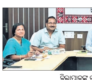
ଜିଲ୍ଲାପାଳଙ୍କ ଖବରଦାତା ସମ୍ମିଳନୀ।