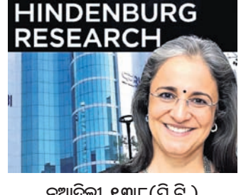
ରୁଆଦିଲା, ୧୩୮ (ପି.ଟି.)

ପଶ୍ଚିମବଙ୍ଗ ଆର.ଜି.କର ମେଡିକାଲ କଲେଜ ହସ୍ପିଟାଲରେ ଜଣେ ମହିଳା ଡାକ୍ତରଙ୍କୁ ବଳାକ୍ତାର ପରେ ହତ୍ୟା ଘଟଣାକୁ ନେଇ ଏବେ ସାରା ଦେଶରେ ତୀବ୍ର ଅସନ୍ତୋଷ ପ୍ରକାଶ ପାଇଛି। ଏଭଳି ସମୟରେ କଟକ ଏସ୍‌ସିବି ମେଡିକାଲ କାର୍ଡିଓଲୋଜି ବିଭାଗର ଜଣେ ଡାକ୍ତର ୨ଜଣ ରୋଗୀଙ୍କୁ ବଳାକ୍ତାର କରିଥିବା ଅଭିଯୋଗ ହୋଇଛି। ବଳାକ୍ତାର କରିଥିବା ଅଭିଯୋଗ ହୋଇଛି ଘଟଣା ଜଣାପଡ଼ିବାପରେ ଅଭିଯୁକ୍ତ ଡାକ୍ତରଙ୍କୁ ରୋଗୀଙ୍କ ସମ୍ପର୍କୀୟ ଏବଂ କନିଷ୍ଠ ଡାକ୍ତରମାନେ ନିଷ୍ପନ୍ନ ମାତ୍ର ମାରିଛନ୍ତି। ଅବସ୍ଥା ଗୁରୁତର ହେବାରୁ ଅଭିଯୁକ୍ତ ଡାକ୍ତରଙ୍କୁ ଆଇସିୟୁରେ ଭର୍ତ୍ତି କରାଯାଇଥିଲା। ଉଭୟ ପକ୍ଷଙ୍କ ଅଭିଯୋଗକୁ ଗ୍ରହଣ କରି ମଙ୍ଗଳାବାର ପୋଲିସ୍ ମାମଲା ରୁଜୁ କରିବା ସହ ସମ୍ପୂର୍ଣ୍ଣ ଅଭିଯୁକ୍ତ ଡାକ୍ତରଙ୍କୁ ଗିରଫ କରି କୋର୍ଟ ଚାଲାଣ କରିଛି।