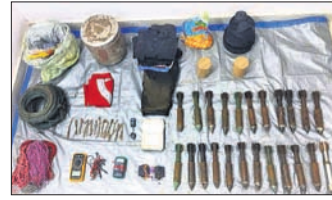
ମାଲକାନଗିରି, ୧୩୮ (ଦୁର୍ଯ୍ୟୋଧନ ପାତ୍ର)

ଛତିଶଗଡ଼ ଗରିଆବନ୍ଧ ଏବଂ ଧନତରି ପୋଲିସ ମଙ୍ଗଳବାର ବିପୁଳ ପରିମାଣର ମାଓବାଦୀ ସାମଗ୍ରୀ ଓ ବିଶେଷତା ସହ ୩୮ ଲକ୍ଷ ଟଙ୍କା ଜବତ କରିଛି।