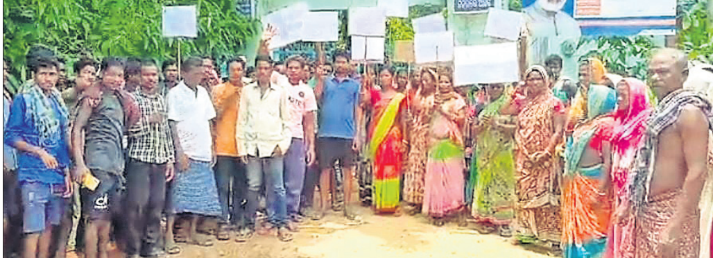
ସ୍କୁଲ ଆଗରେ ମୃତ ଛାତ୍ରୀଙ୍କ ପରିବାର ଲୋକ ଓ ଗ୍ରାମବାସୀ ହୋଇଛନ୍ତି।

ରାମଚନ୍ଦ୍ରପୁର(ଗଣେଶ୍ୱର ସା)/ ଆନନ୍ଦପୁର(ଉମେଶ ଚନ୍ଦ୍ର ପାତ୍ର), ୧୩୮ କେନ୍ଦ୍ରରେ ଜିଲ୍ଲା ଆନନ୍ଦପୁର ଉପଖଣ୍ଡ ରାମଚନ୍ଦ୍ରପୁର ଥାନା ଅଧୀନ ନୂଆମାଳିଆ ଆଶ୍ରମ ସ୍କୁଲ କର୍ତ୍ତୃପକ୍ଷଙ୍କ ଅବହେଳାକୁ ଜଣେ ଛାତ୍ରୀଙ୍କ ମୃତ୍ୟୁକୁ ନେଇ ଉଡ଼େଜନା ପ୍ରକାଶ ପାଇଛି।