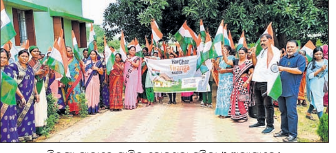
ତ୍ରିରଙ୍ଗା ଯାତ୍ରାରେ ସାମିଲ ହୋଇଥିବା ମହିଳା ଓ ଅନ୍ୟମାନେ।