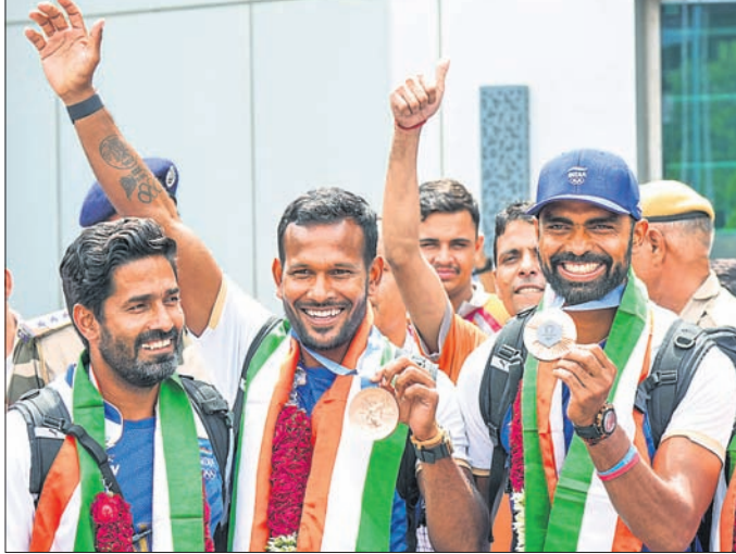
ଦିଲ୍ଲୀ ବିମାନବନ୍ଦରରେ ପହଞ୍ଚିବା ପରେ ଭାରତୀୟ ହକି ଦଳ ସଦସ୍ୟ।