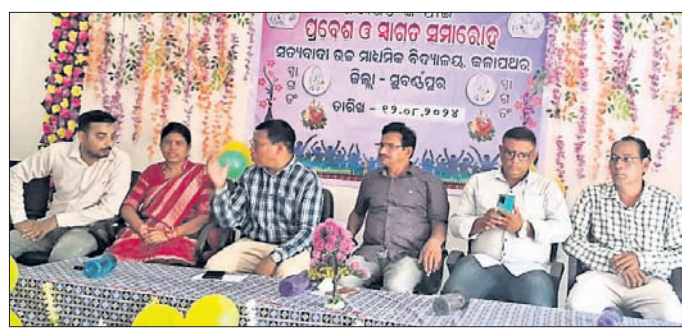
କଳାପଥର ସତ୍ୟବାଦୀ ଉଚ୍ଚ ମାଧ୍ୟମିକ ବିଦ୍ୟାଳୟରେ ସ୍ୱାଗତ ଉତ୍ସବରେ ଅତିଥିମାନେ।