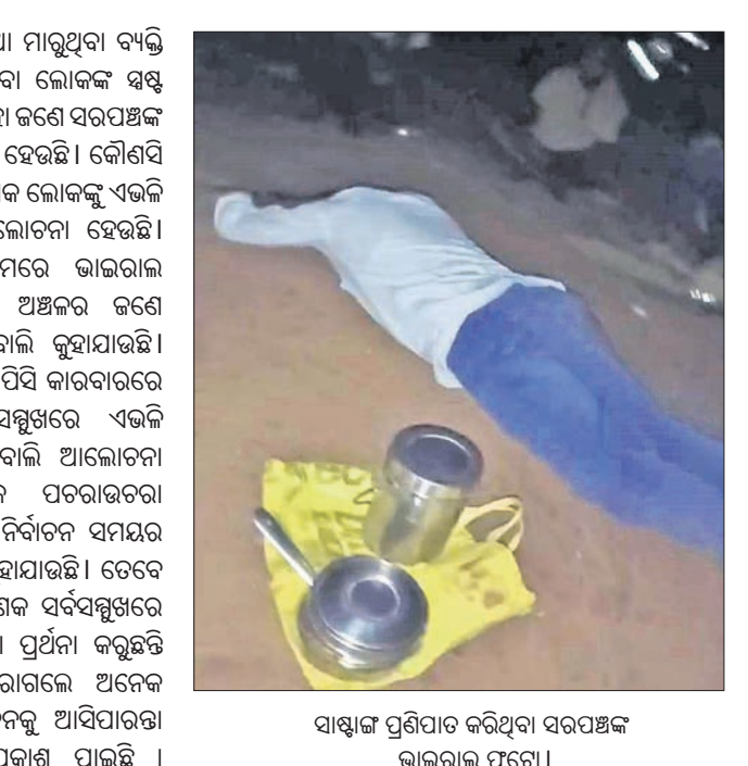
ସାଷ୍ଟାଙ୍ଗ ପ୍ରଣାମ କରିଥିବା ସରପଞ୍ଚଙ୍କ ଭାଇରାଲ ଫଟୋ।

ଜଣେ ସରପଞ୍ଚ ବିଭିନ୍ନ ଲୋକଙ୍କ ହାତ ଗୋଡ଼ ଧରି ନେହୁରା ହେବା ସହ ମୁଣ୍ଡିଆ ମାରି ଭୁଲ ମାଗୁଥିବାର ଏକ ଭିଡିଓ ସାମାଜିକ ଗଣମାଧ୍ୟମରେ ଭାଇରାଲ ହେବା ପରେ ଘଟଣା ଚର୍ଚ୍ଚାର ବିଷୟ ହୋଇଛି। ଉଚ୍ଚ ଭିଡିଓ ବଲାଙ୍ଗୀର ଜିଲ୍ଲା ଦୂରକେଲୀ ଅଞ୍ଚଳର ଜଣେ ସରପଞ୍ଚଙ୍କର ବୋଲି କୁହାଯାଇଛି। ଉଚ୍ଚ ଭିଡିଓରେ ରାତିରେ କୌଣସି ଏକ ସ୍ଥାନରେ ଭୋଜି ଚାଲିଥିବା ବେଳେ ଜଣେ ବ୍ୟକ୍ତି ସାଷ୍ଟାଙ୍ଗ ପ୍ରଣାମ ହୋଇ ପଡ଼ି ରହିଥିବା ଦେଖିବାକୁ ମିଳୁଛି। ସେଠାରେ ଥିବା କେତେକ ଜଣ ବ୍ୟକ୍ତି ସମ୍ପୂର୍ଣ୍ଣ ବ୍ୟକ୍ତିଙ୍କୁ ଉଠାଇଥିବା ଏବଂ ଉଠିବା ପରେ ସେହି ବ୍ୟକ୍ତି ଜଣଙ୍କ ସେଠାରେ ଥିବା ଲୋକଙ୍କ ଗୋଡ଼ ଧରି ମୁଣ୍ଡିଆ ମାଗୁଥିବା ନକରକୁ ଆଣୁଛି। ଅନେକ ସମୟରେ ଭୁଲ୍ ହୋଇ ଯାଇଥିବ। ତେବେ ଯେକୌଣସି ସମସ୍ୟାର ସମାଧାନ କରାଯାଇପାରିବ ବୋଲି ସେହି ବ୍ୟକ୍ତି ଜଣଙ୍କ ମୁଣ୍ଡିଆ ମାଗୁଥିବା ବେଳେ ସେଠାରେ ଉପସ୍ଥିତ ଥିବା ଲୋକଙ୍କୁ କୁହାକୁହି ହେଉଥିବା