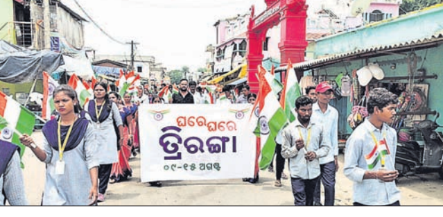
ହେମଗିରି, ୧୩୮ (ତେଜନ ପଟ୍ଟେଲ)

ଭୁବନେଶ୍ୱର ଜିଲ୍ଲା ହେମଗିରିଠାରେ ମଙ୍ଗଳବାର ତ୍ରିରଙ୍ଗା ଯାତ୍ରା ଅନୁଷ୍ଠିତ ହୋଇଯାଇଛି। ଏହି ଅବସରରେ କୁଳମଣି ରଣବିହାରୀ ନଗର ପରିକ୍ରମା କରିଥିଲେ।