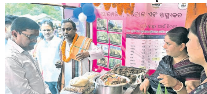
ଅତିଥି ମାଣିଆ କାଫେକୁ ଉଦ୍‌ଘାଟନ କରୁଛନ୍ତି।