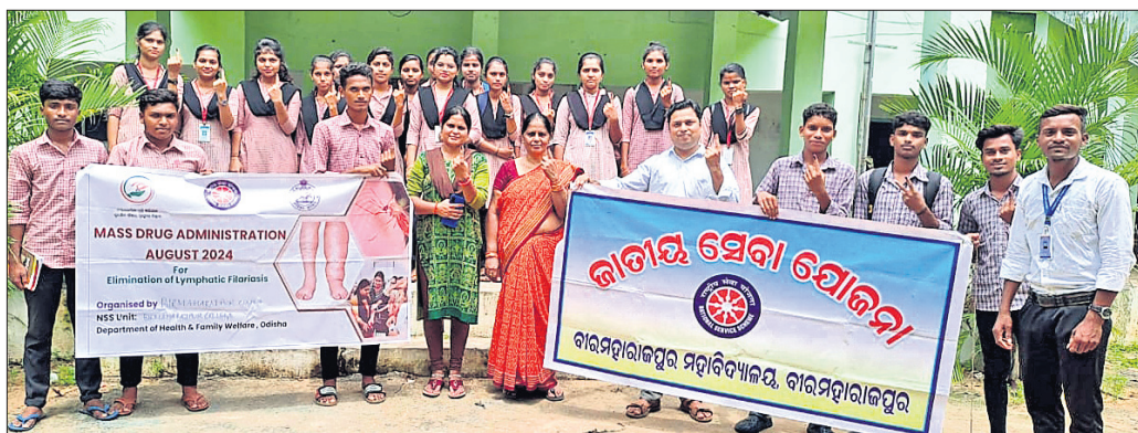
ଫାଇଲେରିଆ ଔଷଧ ସେବନ କାର୍ଯ୍ୟକ୍ରମରେ ଛାତ୍ରାଛାତ୍ର ଓ ଅନ୍ୟମାନେ।