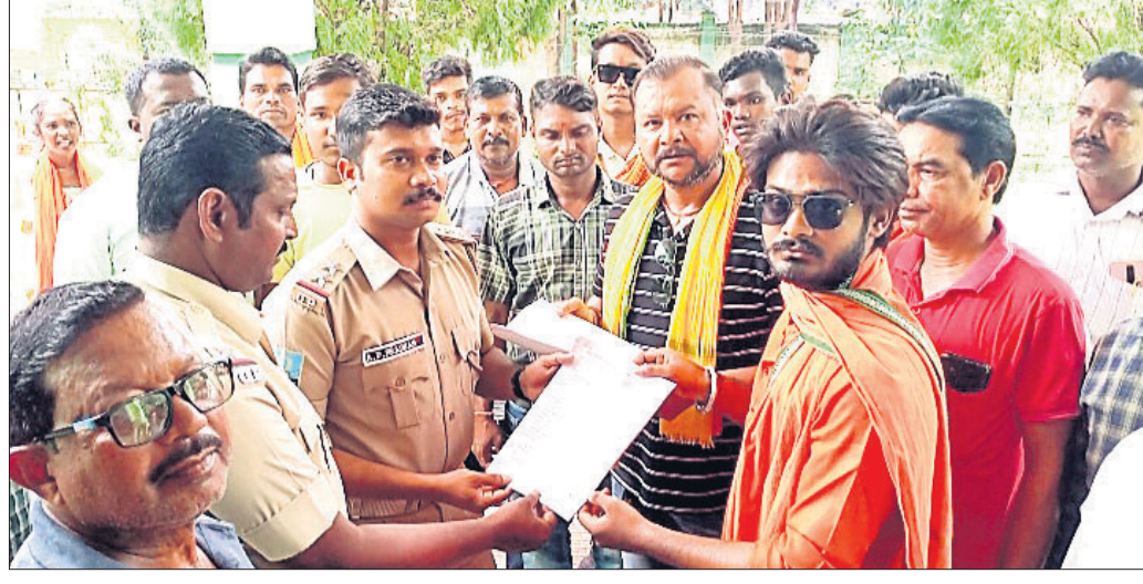
ବଡ଼ଗାଁ ଥାନା ସହ ଲଘୁପଞ୍ଜରୀ ଦାବିପତ୍ର ଦେଖାଯାଇଛି।

ଭୁବନେଶ୍ୱର ଜିଲ୍ଲା ବଡ଼ଗାଁ ବ୍ଲକ୍ ଅଞ୍ଚଳରେ ଗତ ୪ ବର୍ଷ ମଧ୍ୟରେ ଶତାଧିକ ବାଲାଦେଶୀ ଓ ରୋହିଙ୍ଗାଙ୍କୁ ଅଞ୍ଚଳରୁ ବିତାଡ଼ିତ କରାଯାଇଛି। ଏହାଛଡ଼ା ଅଞ୍ଚଳରୁ ବିତାଡ଼ିତ ହୋଇଥିବା ବାଲାଦେଶୀ ଓ ରୋହିଙ୍ଗାଙ୍କୁ ଫେରିଆଣିବା ପାଇଁ ସମସ୍ତଙ୍କୁ ଆହ୍ୱାନ କରାଯାଇଛି। ଏହାଛଡ଼ା ଅଞ୍ଚଳରୁ ବିତାଡ଼ିତ ହୋଇଥିବା ବାଲାଦେଶୀ ଓ ରୋହିଙ୍ଗାଙ୍କୁ ଫେରିଆଣିବା ପାଇଁ ସମସ୍ତଙ୍କୁ ଆହ୍ୱାନ କରାଯାଇଛି। ଏହାଛଡ଼ା ଅଞ୍ଚଳରୁ ବିତାଡ଼ିତ ହୋଇଥିବା ବାଲାଦେଶୀ ଓ ରୋହିଙ୍ଗାଙ୍କୁ ଫେରିଆଣିବା ପାଇଁ ସମସ୍ତଙ୍କୁ ଆହ୍ୱାନ କରାଯାଇଛି।