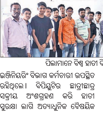
ପିଲାମାନେ ବିଶ୍ୱ ହାତୀ ଦିବସ ପାଳନ କରୁଛନ୍ତି।

ରାଉରକେଲା ସ୍ଥିତ ବିପିୟୁଟି ପଞ୍ଚାୟତର ଶିଶୁବିଦ୍ୟାଳୟ, ଓଡ଼ିଶା (ବିପିୟୁଟି) ପାଠ୍ୟ ପଢ଼ାବାର ବିଶ୍ୱ ହାତୀ ଦିବସ ପାଳିତ ହୋଇଯାଇଛି। ଏହି କାର୍ଯ୍ୟକ୍ରମ ବିପିୟୁଟି ଉପକୂଳପତିଙ୍କ ତତ୍ତ୍ୱାବଧାନରେ ଆୟୋଜିତ ହୋଇଥିଲା।