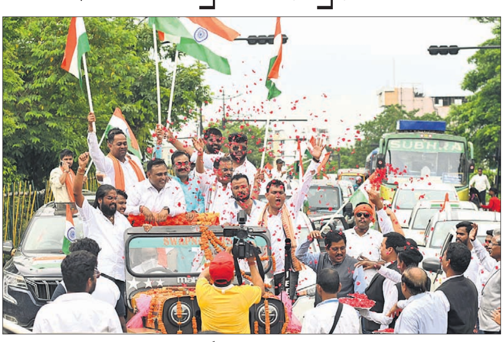
ଭାଜପା ଯୁବ ମୋର୍ଚ୍ଚା ପକ୍ଷରୁ ଭୁବନେଶ୍ୱରରେ ତ୍ରିରଙ୍ଗା ଯାତ୍ରା।