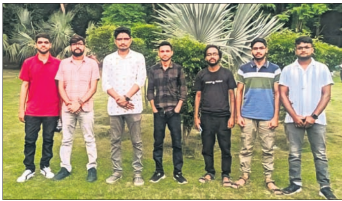
ନୂଆଦିଲ୍ଲୀରେ ମଙ୍ଗଳବାର ନବନିର୍ମୂଳ ଛାତ୍ର ସଙ୍ଗଠନ କର୍ମକର୍ମାମାନେ ।