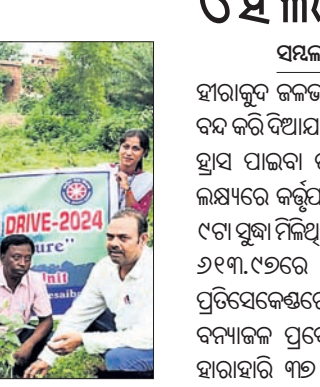
କଲେଜ ଅଧ୍ୟକ୍ଷଙ୍କ ସହ ଛାତ୍ରାଛାତ୍ରୀମାନେ ବାଗିଚାପୋଷଣ କରୁଛନ୍ତି ।