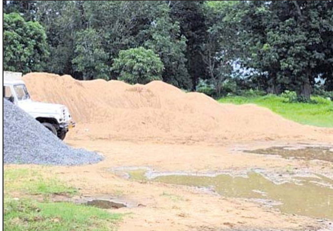
ବାଲି ଗଦା ହୋଇଛି ।

ଛତ୍ରପୁର ବୁକ ଅନ୍ତର୍ଗତ ଗୋବା ଗ୍ରାମ ନିକଟ ରଖିକୁଲ୍ୟା ନଦୀରେ ନିର୍ମାଣଧୀନ ସେତୁରେ ନିର୍ମାଣର କାମ ହେଉଥିବା ବାରମ୍ବାର ଅଭିଯୋଗ ହେଉଛି । ଏହାପରେ ରଖିକୁଲ୍ୟା ନଦୀ ତଟରୁ ବିପୁଳ ବାଲି ମହକୁମ କରି ଗଢ଼ିତ ରଖାଯାଇଛି । ତାହା ପୁଣି କେହି ସାହାଯ୍ୟରେ । ଏପଟେ ସରକାରଙ୍କ ନିୟମ ପ୍ରକାରେ ନଦୀକୁ କେବଳ ମାଟୁଆଲରେ ବାଲି ଉତ୍ତୋଳନ କରାଯିବ । ମେଣିନ ସାହାଯ୍ୟରେ ବାଲି ଉତ୍ତୋଳନ କରାଯାଇ ପାରିବନାହିଁ । ସେହିପରି ବର୍ଷା ଋତୁରେ ଜନନ ହୋଇ ପାରିବ ନାହିଁ । ସହାୟକ ଜଳଚର ପ୍ରାଣୀମାନଙ୍କ ପ୍ରତି ବିପଦ ।