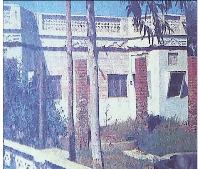
ଏହି ଫାର୍ମହାଉସ୍‌କୁ ଛାତ୍ରୀମାନଙ୍କୁ ଡାକି ବଳାକାର କରାଯାଉଥିଲା।

ଏକ ସ୍ଥାନୀୟ ଖବରକାଗଜ ଦୈନିକ ନବଜ୍ୟୋତି ଉଚ୍ଚ ଯୌନ କେଳେକାରୀ ସମ୍ପର୍କରେ ଏକ ଲେଖା ଛାପିଥିଲା। ସେଥିରେ ଅପରାଧ ସମ୍ପର୍କିତ ସବିଶେଷ ତଥ୍ୟ ଦିଆଯିବା ସହ ବଳାକାରୀମାନେ ଉଠାଇଥିବା କେତେକ ଫଟୋ ମଧ୍ୟ ପ୍ରକାଶ ପାଇଥିଲା। ପୋଲିସ୍ ଘଟଣାର ତଦନ୍ତ ଆରମ୍ଭ କରିବା ସହ ଅପରାଧୀମାନଙ୍କୁ ଧରିବା ପାଇଁ ବିଭିନ୍ନ ଅଞ୍ଚଳରେ ଚଢ଼ାଉ କରିଥିଲା। ସ୍ଥାନୀୟ କର୍ତ୍ତୃପକ୍ଷ ଏହି କେଳେକାରୀ ସମ୍ପର୍କରେ ବର୍ଷେ ପୂର୍ବରୁ ଅବଗତ ଥିଲେ ମଧ୍ୟ ଆଇନଗତ କାର୍ଯ୍ୟାଳୟର ନେତ୍ର ନ ଥିବା ଅଭିଯୋଗ ହୋଇଥିଲା। ତେବେ ଅପରାଧୀଙ୍କ ବିରୋଧରେ ମାମଲା ପ୍ରସ୍ତୁତ କରିବା କଷ୍ଟକର ଥିଲା। କାରଣ ଅଧିକାଂଶ ପାଠିତା ଆଗକୁ ଆସିବାକୁ କୁଣ୍ଠାବୋଧ କରୁଥିଲେ। ତେବେ ବ୍ଲକ୍‌ମେଲ୍ ପାଇଁ ଅପରାଧୀ ବ୍ୟବହାର କରିଥିବା ଫଟୋ ଓ ଭିଡିଓ ସେମାନଙ୍କୁ ଚିହ୍ନିତ କରାଯାଇଥିଲା ଓ ତାହାକୁ ଆଧାର କରି ମମଲା ଦାଏର ହୋଇଥିଲା। ଅପହରଣ ଓ ଗଣବଳାକାର ନେଇ ୧୮ ଜଣଙ୍କ ନାଁରେ ଆଇପିସିର ବିଭିନ୍ନ ଧାରାରେ ମାମଲା ରୁଜୁ ହୋଇଥିଲା।