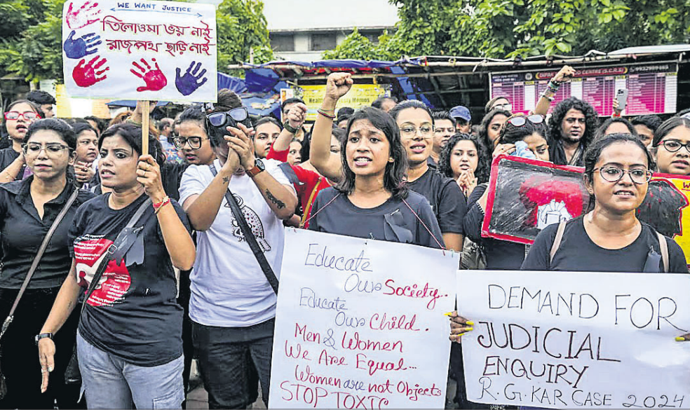
କୋଲକାତାର ଏକାଡେମୀ ଅଫ୍ ଫାଇନ ଆର୍ଟ୍‌ସ୍‌ରେ ଟ୍ରେନି ଡାକ୍ତରଙ୍କୁ ବଳାକାର ଓ ହତ୍ୟାକୁ ବିରୋଧ କରି କେତେକ ସୁବ ସଙ୍ଗଠନ ପକ୍ଷରୁ ପ୍ରତିବାଦ କରାଯାଇଛି।

ଦୁର୍ନୀତିରେ ରାଜ୍ୟ ସରକାରଙ୍କ କେତେଜଣ ବରିଷ୍ଠ ଅଧିକାରୀ ସାମିଲ ଥିବା ନେଇ ପ୍ରାଥମିକ ତଦନ୍ତରୁ ଜଣାପଡ଼ିଛି। ଦୁର୍ନୀତିରେ ସମ୍ପୃକ୍ତ ଅନ୍ୟ ଡାକ୍ତର ଏବଂ ବ୍ୟକ୍ତିଗଣଙ୍କୁ ଖୋଜିବାକୁ ସିବିଆଇ ପ୍ରୟାସ କାରି ରଖିଛି। ଲାଞ୍ଜ ନେଇ ଡାକ୍ତରଙ୍କ ବଦଳି ଦୁର୍ନୀତିରେ କେତେଜଣ ଡାକ୍ତର ଏବଂ ରାଜ୍ୟ ପ୍ରଶାସନର ଗୋଟିଏ ରାଜେର୍ କାମ କରୁଥିବା ଜଣେ ସିବିଆଇ ଅଧିକାରୀ ସୂଚନା ଦେଇଛନ୍ତି। ଯେଉଁ ଡାକ୍ତରମାନେ ନିଜ ମନପସନ୍ଦର ମେଡିକାଲ କଲେଜକୁ ବଦଳିହେବାକୁ ଚାହୁଁଛନ୍ତି, ସେମାନଙ୍କୁ ପ୍ରାୟ ୨୦ରୁ ୩୦ ଲକ୍ଷ ଟଙ୍କା ଦେବାକୁ କୁହାଯାଇଛି। ଗତ ୯ରେ ଆର୍.ଜି. କର୍ ମେଡିକାଲ କଲେଜରେ ବଳାକାର ଓ ହତ୍ୟାର ଶିକାର ହୋଇଥିବା ପାଠିତା ଏହି ବ୍ୟବସ୍ଥାକୁ ନେଇ ଅସନ୍ତୁଷ୍ଟ ରହିଥିଲେ। ସେ ବିଭିନ୍ନ ଫୋରମରେ ଏହା ବିରୋଧରେ ପ୍ରତିବାଦ କରିଥିଲେ ବୋଲି ସିବିଆଇ କହିଛି।