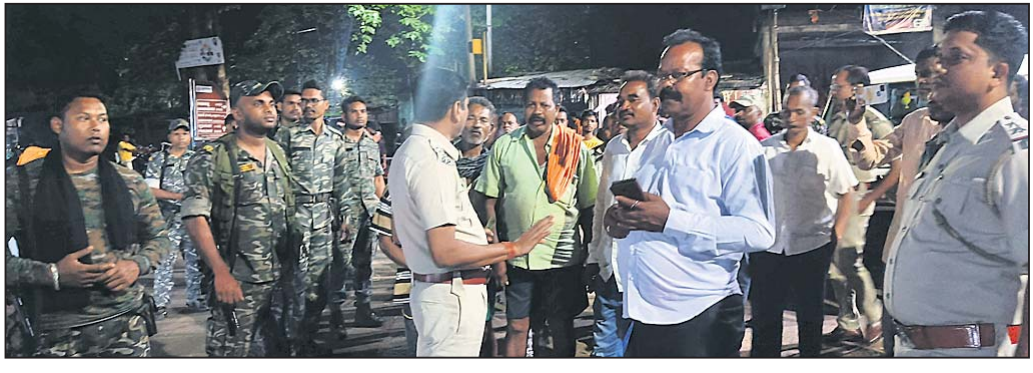
ଦାରିଙ୍ଗବାଡ଼ିରେ ପୋଲିସ ଲୋକମାନଙ୍କୁ ସଚେତନ କରୁଛି।