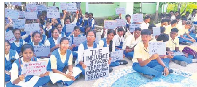
ଛାତ୍ରଛାତ୍ରୀମାନେ ଧାରଣାରେ ବସିଛନ୍ତି ।

ଋଣମୁକ୍ତି ଦିବସ ପ୍ରସ୍ତୁତି ବୈଠକ ପ୍ରସ୍ତୁତି ବୈଠକ