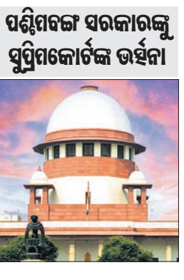
ପଶ୍ଚିମବଙ୍ଗ ସରକାରଙ୍କୁ ସୁପ୍ରିମକୋର୍ଟଙ୍କ ଭାର୍ଷନା

ପ୍ରତି ପ୍ରଶ୍ନ ଉଠାଇଥିବାବେଳେ ସର୍ବୋଚ୍ଚ ଅଦାଲତ ନିଜ ଆହ୍ୱାନାମାକୁ ବିଚାର ପାଇଁ ଗ୍ରହଣ କରିଥିଲେ। ଡାକ୍ତରମାନଙ୍କ ସୁରକ୍ଷା ଓ ସ୍ୱାସ୍ଥ୍ୟ ଏକ ଜାତୀୟ ସ୍ୱାର୍ଥ ବୋଲି ସର୍ବୋଚ୍ଚ ଅଦାଲତ ଚିହ୍ନଟା ଦେବା ସହ ଏଥିପାଇଁ ଏକ ୧୦ ଜଣିଆ ନ୍ୟାୟନାଳ ଚାଷୀଙ୍କୁ ଗଠନ କରିଛନ୍ତି। ଡାକ୍ତରଙ୍କ ସୁରକ୍ଷା ଓ ନିରାପତ୍ତା ସୁନିଶ୍ଚିତ କରିବା ପାଇଁ ଉକ୍ତ ଚାଷୀଙ୍କୁ ପ୍ରୋତ୍ସାହନ