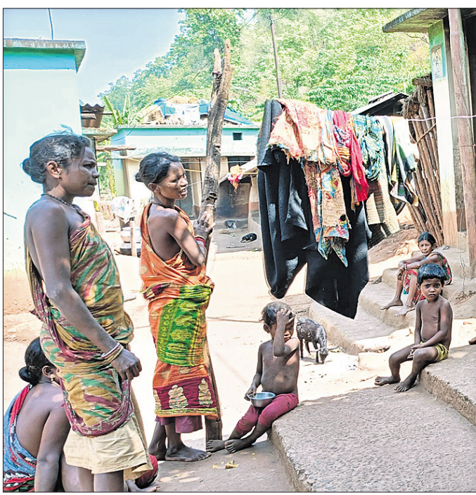
ନଗଡ଼ା ପାର୍ଶ୍ୱ ଗ୍ରାମରେ ୨ ଜଣ ଶିଶୁମାନଙ୍କ ଜୀବନ ମଧ୍ୟ ସୁରକ୍ଷିତ ହେବ ବୋଲି ମତପ୍ରକାଶ ପାଇଛି।