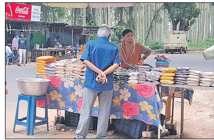
ଏବଂ କ୍ଳଙ୍କ ପ୍ରଶାସନ ବାରମ୍ବାର ଉଚ୍ଛେଦ କରିବାକୁ ଚାହୁଁଛନ୍ତି। ଏହା ଗ୍ରାମିକ ସମସ୍ୟା ବୃଦ୍ଧି ହେଉଛି

ଦାରିଙ୍ଗବାଡି, ୨୦୧୮ (ଅରୁଣ ସାହୁ) କନ୍ଧମାଳ ଜିଲ୍ଲା ଦାରିଙ୍ଗବାଡି ସହରରେ ଦିନକୁ ଦିନ ଗ୍ରାମିକ ସମସ୍ୟା ବୃଦ୍ଧି ପାଇଛି । ଦୈନିକ ଶହ ଶହ ପର୍ଯ୍ୟଟକ ଦାରିଙ୍ଗବାଡି ବୁଲିବାକୁ ଆସୁଥିବା ବେଳେ ଚାରିଚକ ଠାରୁ କ୍ଳଙ୍କ ରାସ୍ତା ଗ୍ରାମିକ ସମସ୍ୟା ଦେଖାଯାଉଥିବା ବେଳେ ଯେଉଁଠି ପର୍ଯ୍ୟଟକ ପର୍ଯ୍ୟଟକଙ୍କ ଭିଡ଼ ହେଉଛି କର୍ମୀ ବଚିତା ପୁଖ୍ୟ ପାଟକ ସମ୍ମୁଖରେ ଉଠାଦୋକାନୀ ମାନେ ଦାରିଙ୍ଗବାଡି-ବ୍ରାହ୍ମଣୀଗାଁ ରାସ୍ତା ରାଜପଥ କୁ ଲାଗି ଦୋକାନ ଖୋଲୁଥିବାକୁ ଗ୍ରାମିକ ସମସ୍ୟା ବୃଦ୍ଧି ପାଇବା ସହ ରାସ୍ତା ଉପରେ ପର୍ଯ୍ୟଟକ ମାନେ ଠିଆ ହୋଇ ସାମଗ୍ରୀ କିଣିବାକୁ ବାଧ୍ୟ ହେଉଛନ୍ତି। ଏନେଇ ଗ୍ଲାମାୟ ପୋଲିସ ସହ ତହସିଲ