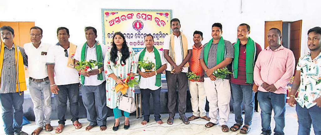
କାର୍ଯ୍ୟକ୍ରମରେ ଅତିଥି ଏବଂ ପ୍ରେସ୍ କ୍ଲବ କର୍ମକର୍ତ୍ତା।