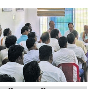
କୁହୁଡ଼ି ଗୋଷ୍ଠୀ ବିବାଦ ପ୍ରସଙ୍ଗ

ବୈଠକରେ ବିଭିନ୍ନ ସମୟରେ ସାଧାରଣ ଘଟଣାକୁ ନେଇ ପୁସ୍ତକମାନ ସମ୍ପ୍ରଦାୟର ସଂସଦଙ୍କ ଆକ୍ରମଣକୁ ରୋକିବା, ଅଞ୍ଚଳରେ ବ୍ୟୋଧନ ଗୋଟାଣା, ପ୍ରାଧିକାରୀଙ୍କୁ ବିକ୍ରି ବନ୍ଦ କରିବା, କୁଷ୍ଠରୀ ପଞ୍ଚାୟତରେ ଥିବା ଜଙ୍ଗଲ ଜମିରେ ବ୍ୟୋଧନ ଭାବେ ମୁସଲିମ ଲୋକେ ବସବାସ କରି ଅସାମାଜିକ କାର୍ଯ୍ୟକଳାପ କରୁଛନ୍ତି। ଏମାନଙ୍କୁ ଉଦ୍ଧେବ କରିବାକୁ ଦାବି ହୋଇଥିଲା।