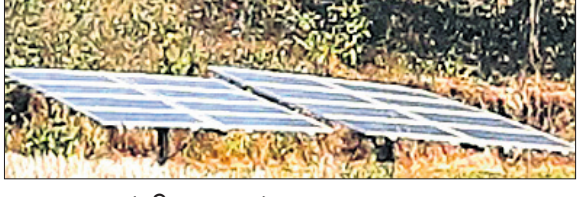
ରାୟଗଡ଼ା, ୨୧।୮ (ଆଶିଷ ରଞ୍ଜନ ପଣ୍ଡା) ରାୟଗଡ଼ା ଜିଲ୍ଲା ସାମାଜିକ କୋମ୍ୟୁନିଟି ସେଣ୍ଟର ରାୟଗଡ଼ାରେ ସୋଲାର ଆଶ୍ରୁ ପ୍ରଦାନ କରାଯାଇଛି