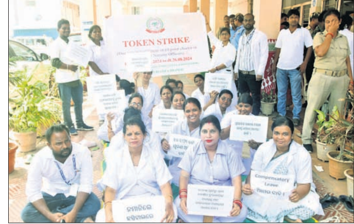
ଓଡ଼ିଶା ନର୍ସ କର୍ମଚାରୀ ସଂଘ ପକ୍ଷରୁ ୧୦ ଦିନୀ ଦାବି ନେଇ ରୁଧିରାସର ପୁରୀ ଜିଲ୍ଲା ମୁଖ୍ୟ ଚିକିତ୍ସାଳୟ ପରିସରରେ ଧାରଣା ଦିଆଯାଇଛି।

ଗାଣି ଆଣୁଛି। ସେପକ୍ଷେ ୧୮ ବର୍ଷରୁ କମ୍ ନାବାଳକ ଅପରାଧୀମାନଙ୍କୁ ଜୁରୋନାଲ୍ ଅନୁଯାୟୀ ବିଚାର କରାଯାଉଥିବାବେଳେ ଆଇନ୍ ପ୍ରାବଧାନରେ ସେମାନଙ୍କ ଦଣ୍ଡବିଧାନ ହାର କମ୍ ରହୁଛି। ତେଣୁ ସଂସଦରେ ବାଳ ଅପରାଧୀ ଆଇନରେ ସଂଶୋଧନ ସହ କଠୋର ଦଣ୍ଡବିଧାନ କରାଗଲେ ସେମାନେ ଅପରାଧ ଜଗତରେ ବିଶେଷ ସକ୍ରିୟ ରହିବେ ନାହିଁ ବୋଲି ଆଇନଜୀବୀ ଶରତ ରାୟଚୁରୁ ମତ ରଖୁଛନ୍ତି। ଅନ୍ୟପକ୍ଷରେ ଏସ୍ପି ପିନାକ ମିଶ୍ର କହିଛନ୍ତି, ପୁରୀରେ ସକ୍ରିୟ ଥିବା ନାବାଳକ ଅପରାଧୀ ଓ ସେମାନଙ୍କ ଅଭିଭାବକମାନଙ୍କୁ ଖୁବଶୀଘ୍ର କାର୍ଯ୍ୟକାରୀ କରାଯିବ। ନିଜ ନିଜ ଅଞ୍ଚଳରେ ପଡ଼ିଆରାକୁ ନେଇ ଅନେକ ଅପରାଧ ଘଟୁଛି। ଆଗକୁ ନାବାଳକ ଅପରାଧୀଙ୍କୁ ଅପରାଧରୁ ବାହାର କରିବାକୁ ବିଭିନ୍ନ କାର୍ଯ୍ୟକ୍ରମ କରାଯିବ। ସିଡ଼ିକ୍ୟୁପି ଏବଂ ଶିଶୁ ସୁରକ୍ଷା ନିରକ୍ଷରତା ଓ ନିଶା କାରବାର ପ୍ରଭୃତି ନାବାଳକମାନଙ୍କୁ ଅପରାଧ ଜଗତକୁ