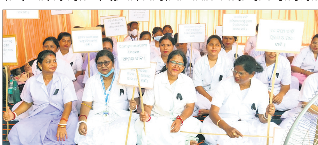
ନର୍ସି କର୍ମଚାରୀ ସଂଘ କର୍ମଚାରୀମାନେ କଳାବ୍ୟାଜ ପିନ୍ଧି ଆନ୍ଦୋଳନ କରୁଛନ୍ତି ।