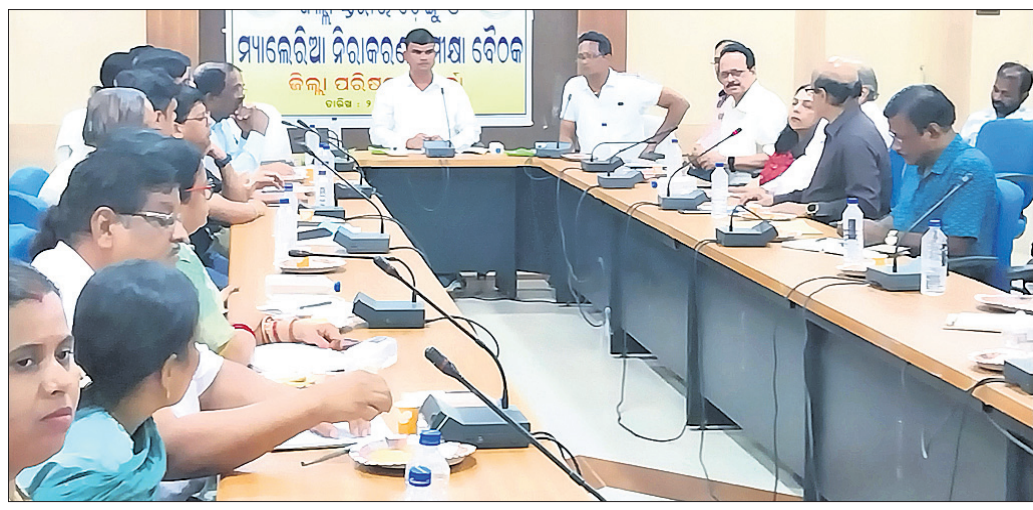
ସମୀକ୍ଷା ବୈଠକରେ ଅଧିକାରୀମାନେ ।

ଜାନୁଆରୀରୁ ଅଗଷ୍ଟ ୧୮ ସୁଦ୍ଧା ଜିଲ୍ଲାରେ ୫୫୨ ଆକ୍ରାନ୍ତ ■ ଜିଲ୍ଲାସ୍ତରୀୟ ଡେଙ୍ଗୁ ଓ ମ୍ୟାଲେରିଆ ସମୀକ୍ଷା ବୈଠକ ■ ସଚେତନତା ସୃଷ୍ଟି, ସମନ୍ୱୟ ରଖି କାମ କରିବାକୁ ଗୁରୁତ୍ୱ ଖୋର୍ଦ୍ଧା, ୨୧।୮ (ପ୍ରଭାତ ପାଣିଗ୍ରାହୀ)