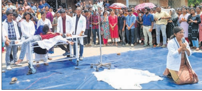
ଏସ୍‌ସି ମେଡିକାଲର ଧାରଣାସ୍ଥଳରେ ଡାକ୍ତରମାନେ ନାଟକ ପରିବେଷଣ କରୁଛନ୍ତି।