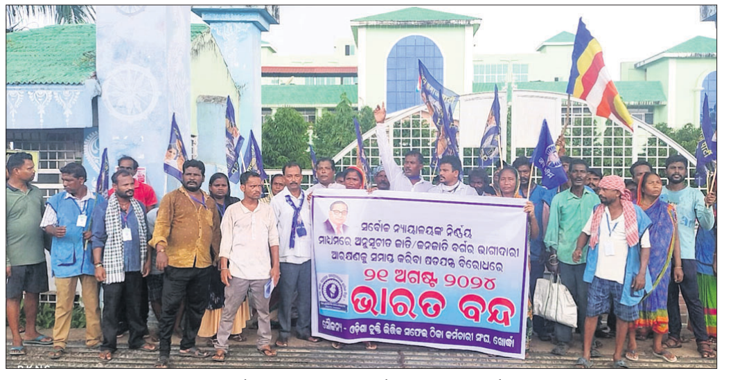
ଜିଲାପାଳଙ୍କ କାର୍ଯ୍ୟାଳୟ ସମ୍ମୁଖରେ ଠିକା କର୍ମଚାରୀ ବିକ୍ଷୋଭ ପ୍ରଦର୍ଶନ କରୁଛନ୍ତି।