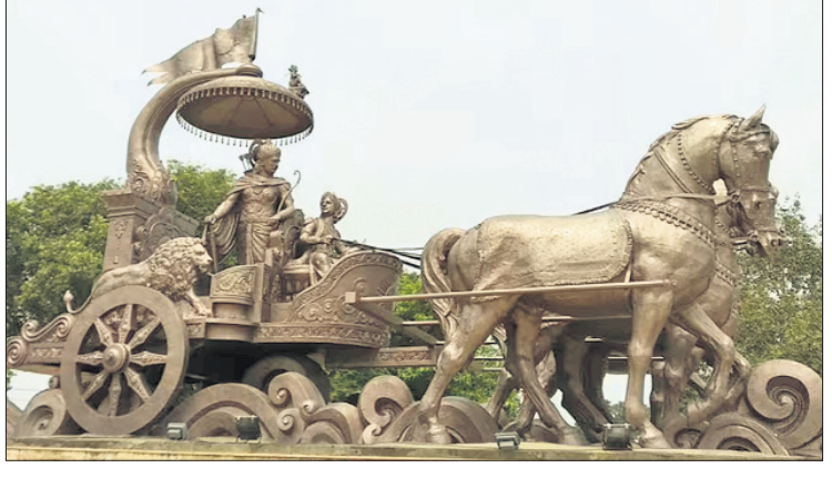
ପୁରାଣଗୁଡ଼ିକ ଜ୍ଞାନୀ ଗୃହସ୍ଥଙ୍କ ଉପରେ ବିଚାର କରନ୍ତି ।

ଧର୍ମଶାସ୍ତ୍ର ଶତାଧିକ ପର୍ଯ୍ୟନ୍ତ ବିଶ୍ୱରେ କେହି ବୁଦ୍ଧତ୍ୱ ଜଣେ ଐତିହାସିକ ବ୍ୟକ୍ତି ରୂପେ ଦେଖି ନ ଥିଲେ । ଏହି ଧାରଣା ଯୁଗୋପାୟକ ଦ୍ୱାରା ପ୍ରବର୍ତ୍ତିତ ହେଲା, ଯେଉଁମାନେ ବୈଦିକ ଆଧାରରେ ଅତୀତକୁ ଜାଣିବାକୁ ଚାହୁଁଥିଲେ । ପୁରାଣରୁ ଇତିହାସକୁ ଅଲଗା କରାଗଲା । ଇତିହାସ ଥିଲା ବାସ୍ତବ, ପୁରାଣ ଥିଲା ମିଛ ଏବଂ ଏହିପରି ଐତିହାସିକ ବୁଦ୍ଧତ୍ୱ ବିଚାର ନୂଆ କରି ଅଣାଯାଇଥିଲା । ସତ୍ୟ ଧର୍ମକୁ ଲୋକମାନଙ୍କୁ ବାସ୍ତବ ବୋଲି ଗ୍ରହଣ କରାଗଲା, ଏପରିକି ପ୍ରତିଷ୍ଠିତ ଐତିହାସିକମାନେ ମଧ୍ୟ ଏହାକୁ ଗ୍ରହଣ କଲେ । କେବଳ ଏତିକି ନୁହେଁ, ବୁଦ୍ଧତ୍ୱ ପ୍ରତ୍ୟେକ କାହାଣୀ ତାଙ୍କ ଅନୁଗାମୀମାନେ ସୃଷ୍ଟି କରିଥିଲେ । ଏସବୁର ଏପରିକି ତାଙ୍କ ଜନ୍ମସ୍ଥାନ ସମ୍ପର୍କରେ ପ୍ରମାଣ ନାହିଁ । ବାସ୍ତବରେ ଜୈନ ଗର୍ଭାବସ୍ଥା ଧର୍ମକୁ ବର୍ଣ୍ଣନା କରିବା ପାଇଁ ସମାନ ପ୍ରକାର ମଡେଲ ଆପଣାଯାଇଥିଲା । ସେମାନଙ୍କ ରାଜ ପରିବାର, ବିଚାରଧାରା, ଅଧ୍ୟାଧ୍ୟାତ୍ମିକ ଜନ୍ମ, ଆରାଧନାୟକ ଜୀବନ, ନୈରାଶ୍ୟ, ତ୍ୟାଗ, ଜ୍ଞାନ ବିକାଶ, ଆଧ୍ୟାତ୍ମିକ ଉପଦେଶ, ଲୋକପ୍ରିୟତା, ବିରୋଧ ଏବଂ ମୃତ୍ୟୁ ସମ୍ପର୍କରେ ବର୍ଣ୍ଣନା କରାଯାଇଛି ।