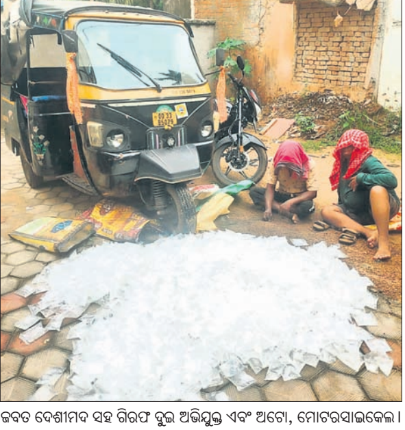
ଜବତ ଦେଶୀମଦ ସହ ଗିରଫ ବୁଲି ଅଭିଯୁକ୍ତ ଏବଂ ଅଟୋ, ମୋଟରସାଇକେଲ।

ଭୁବନେଶ୍ୱର, ୨୨।୮ (ସୂର୍ଯ୍ୟକାନ୍ତ ବେହେରା): ବ୍ରହ୍ମପୁର ଚିକିତ୍ସା ଅଞ୍ଚଳରେ ବିଷାକ୍ତ ମଦ ମୃତ୍ୟୁ ଘଟଣା ପରେ ଅବକାରୀ ବିଭାଗ ଏହାକୁ ଗୁରୁତର ସହ ନେଇଛି। ଅବକାରୀ କମିଶନର ନରସିଂହ ଭୋଳ ଏଭଳି ଏକ ସମ୍ବେଦନଶୀଳ ମାମଲାକୁ ଦୃଷ୍ଟିରେ ରଖି ସାରା ରାଜ୍ୟରେ ଚଢ଼ାଉକୁ ଜୋରଦାର କରିଛନ୍ତି। ବେଆଇନ ମଦ ଭାଟି ଓ ମଦ ମାଫିଆଙ୍କ ବିରୋଧରେ କାର୍ଯ୍ୟାନୁଷ୍ଠାନ ପାଇଁ ସମସ୍ତ ଜିଲ୍ଲା ଏସ୍‌ପିଙ୍କୁ ନିର୍ଦ୍ଦେଶ ଦେଇଛନ୍ତି। ଗତ ୨ ଦିନରେ ୩୩୩ଟି ଅବକାରୀ ମାମଲା ରୁଜୁ କରିବା ସହ ୨୬୨ଜଣଙ୍କୁ ଗିରଫ କରି କୋର୍ଟଚାଲାଣ କରାଯାଇଥିବା ଅବକାରୀ ବିଭାଗ ପକ୍ଷରୁ ସୂଚନା ଦିଆଯାଇଛି। ଏହାସହ ୨୦,୬୪୬ ଲିଟର ଦେଶୀ ରକ୍ଷା ଚୋରା ମଦ ଜବତ ହୋଇଛି। ସେହିପରି ବେଆଇନ ଭାବେ ମଦ ଚୋରା ଚାଲାଣ କରିବା ଅଭିଯୋଗରେ ୨୬ ଗାଡ଼ି ଜବତ ହୋଇଛି। ଗିରଫ ବ୍ୟକ୍ତିଙ୍କ ମଧ୍ୟରେ ମୋଟ ୨୦ ଜଣ କେବଳ ମାଲିକ ରହିଛନ୍ତି। ସେମାନେ ସରକାରୀ ଜାଗା କିମ୍ବା ଜଙ୍ଗଲ ଜମିରେ ମଦଭାଟି କରିଛନ୍ତି। ସେଗୁଡ଼ିକୁ ଚିହ୍ନିତ କରାଯାଇ ଖୁବ୍‌ଶୀଘ୍ର ଭଙ୍ଗାଯାଇ କାର୍ଯ୍ୟାନୁଷ୍ଠାନ ଗ୍ରହଣ କରାଯିବ ବୋଲି ଅବକାରୀ ପକ୍ଷରୁ ସୂଚନା ଦିଆଯାଇଛି। ଏହାସହ ବେଆଇନ ମଦରୁ ଅମାପ ସମ୍ପତ୍ତି ହାତେଇଥିବା ଅଭିଯୁକ୍ତଙ୍କ ସମ୍ପତ୍ତି ବାନ୍ଧାସ୍ତ କରାଯିବ ବୋଲି ସୂଚନା ଦିଆଯାଇଛି।