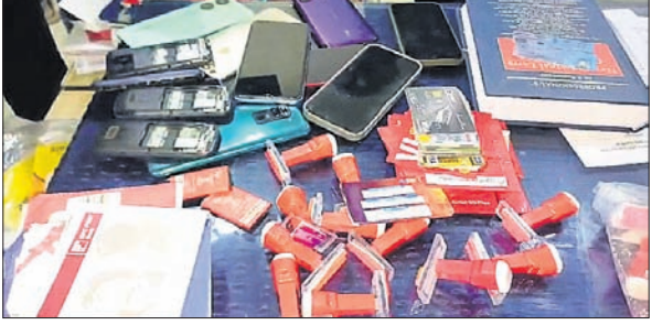
ଜବତ ସିମ୍‌କାର୍ଡ, ମୋବାଇଲ୍ ଓ ପାସ୍‌ବୁକ୍।

ସାଇବର ଅପରାଧ ସନ୍ଦେହରେ ଭଦ୍ରକ ଗାଉନ ଥାନା ପୋଲିସ୍ ଗୁରୁବାର ଅପରାଧରେ ଆଚାର୍ଯ୍ୟନଗରସ୍ଥିତ ଏକ ଭଡ଼ାଘରରେ ଚଢ଼ାଉ କରିଛି। ଉକ୍ତ ଘରୁ ବହୁ ସିମ୍‌କାର୍ଡ, ବ୍ୟାଙ୍କ ପାସ୍‌ବୁକ୍, ଟେକ୍‌ବୁକ୍, ଷ୍ଟାମ୍ପ୍, ଏଟିଏମ୍ କାର୍ଡ ସହ ବିଭିନ୍ନ ଗାଡ଼ି ନମ୍ବର ପ୍ଲେଟ୍ ଓ ମୋବାଇଲ୍ ଫୋନ୍ ପୋଲିସ୍ ଜବତ କରିଛି। ଏଥିସହ ୨ଜଣଙ୍କୁ ଥାନାରେ ଅଟକ ରଖି