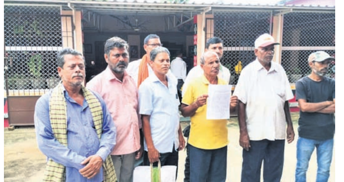
ବିଡିଓଙ୍କୁ ଅଭିଯୋଗ କରିବାକୁ ଆସିଥିବା ଚାଷୀମାନେ।