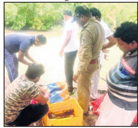
ଭିତରକନିକା ଗାଡ଼ାୟ ଉତ୍ପାଦନ ଓ ଅଭିଯୋଗୀ ଅଞ୍ଚଳକୁ ବେଧଧର୍ମ ଭାବେ କଳ୍ପା ଧରାଯାଇଛି।

ରାଜନଗର, ୨୨୮୮ (ଭାସ୍କର ରାଉତରାୟ) ଭିତରକନିକା ଗାଡ଼ାୟ ଉତ୍ପାଦନ ଓ ଅଭିଯୋଗୀ ଅଞ୍ଚଳକୁ ବେଧଧର୍ମ ଭାବେ କଳ୍ପା ଧରାଯାଇଛି।