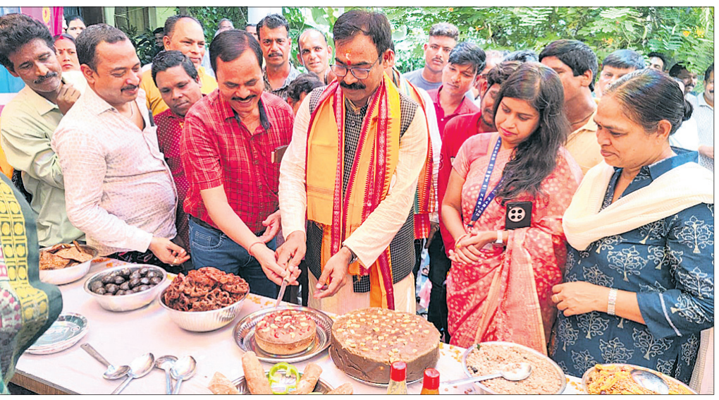
ଅତିଥି ବିଭିନ୍ନ ଖାଦ୍ୟର ସ୍ୱାଦ ପରଖୁଛନ୍ତି।

ଗଣିଆ, ୨୨।୮ (ସତ୍ୟଜିତ କୁମାର ପ୍ରଧାନ) ସ୍ଥୁଳ ଓ ନାରୋଗୀ କାନ୍ଦନ ଯାପନ ପାଇଁ ମଣିଷକୁ ଦୈନନ୍ଦିନ ସୁସ୍ଥ ଖାଦ୍ୟର ଆବଶ୍ୟକତା ପଡ଼ିଥାଏ। ହେଲେ ଆଜିକାଲି ବଜାରରେ ମିଳୁଥିବା ବିଭିନ୍ନ ଖାଦ୍ୟ ସାମଗ୍ରୀ ସାର ଓ କାର୍ବୋହାଇଡ୍ରେଟ୍ ହେତୁ ବିଭିନ୍ନ ରୋଗର ଶୀକାର ହେଉଥିବା ଦେଖିବାକୁ ମିଳୁଛି। ଏପରିକି ମାଞ୍ଜିଆ, ବାଜରା, ଜହ୍ନରା ପରି ଶସ୍ୟରେ ପ୍ରଚୁର ପରିମାଣର ପୁଷ୍ଟିକାରକ, ସ୍ୱେଦକାର, ଲୌହ, କ୍ୟାଲସିୟମ ପରି ପୋଷକତତ୍ତ୍ୱ ରହିଛି। ଏଭଳି ଲଘୁ ଶସ୍ୟ କିପରି ଭାବେ ପ୍ରଚୁର ପରିମାଣର ଉତ୍ପାଦନ ହୋଇପାରିବ ସେ ନେଇ ସରକାରଙ୍କ ମିଳେଟ ମିଶନ କରିଆରେ ପ୍ରୟାସ କାରି ରହିଛି। ଗୁରୁବାର ଗଣିଆ ବ୍ଲକର ସାମାଜିକ ଅନୁଷ୍ଠାନ ଗଣିଆ ଉନ୍ନୟନ କମିଟି (ଜିୟୁସି) ତରଫରୁ ଜିଲ୍ଲା କୃଷି ବିଭାଗ ଓ ନାବାର୍ଡ଼ ସହାୟତାରେ ବେଲପତାପାଟଣାସ୍ଥିତ ଜିୟୁସି କାର୍ଯ୍ୟାଳୟ ପରିସରରେ ଲଘୁ ଶସ୍ୟ ଖାଦ୍ୟ