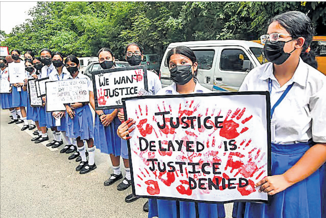
କୋଲକାତାରେ ଟ୍ରେନି ଡାକ୍ତର ବଳାହାର ଓ ହତ୍ୟା ଘଟଣା ପ୍ରତିବାଦରେ ଗୁରୁବାର ପାଟନାରେ ଛାତ୍ରୀଙ୍କ ବିକ୍ଷୋଭ।

ନୂଆଦିଲ୍ଲୀ, ୨୨।୮ (ପି.ଟି.) କୃଷକମାନଙ୍କ ସବୁ ସମସ୍ୟା ଆପଣ ଅଭିଯୋଗରୁତ୍ତର ଯୋଜନାକୁ ସମାଧାନ ପାଇଁ ପୁସ୍ତିକାରେ ଖୁବ୍ ଶୀଘ୍ର ବହୁସଦସ୍ୟ ବିଶିଷ୍ଟ ଏକ କମିଟି ଗଠନ କରିବେ ବୋଲି ଗୁରୁବାର କହିଛନ୍ତି।