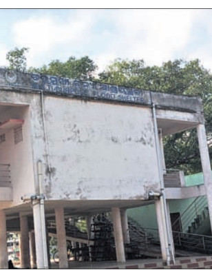
ବାଟ ପାଟିବା ସହ ବର୍ଷକ ଗ୍ୟାଲେରୀ ନଷ୍ଟ ହେଲାଣି। ପୁନଶ୍ଚ ରଙ୍ଗମଞ୍ଚର ଚତୁର୍ଦ୍ଧାପାର୍ଶ୍ୱ ଜବରଦସ୍ତକାରୀଙ୍କ କବ୍‌ଚାରେ କେଳିତ ହେବାରେ ଲାଗିଥିଲା। ଏହି ରଙ୍ଗମଞ୍ଚର ରକ୍ଷଣାବେକ୍ଷଣ କିମ୍ବା ପୁନରୁଦ୍ଧ କରିବାରେ ପଞ୍ଚାୟତ କର୍ତ୍ତୃପକ୍ଷ ଆତ୍ମନିକ୍ଷେପ ପ୍ରକାଶ କରି ନ ଥିଲେ। ଏପରି ଏକ ଅନୁଷ୍ଠାନ ତଥା କଣ୍ଠିଲୋଠା ପଞ୍ଚାୟତ କେନ୍ଦ୍ରସ୍ଥଳରେ ଥିବା ଏହି କାଗା ନଷ୍ଟ ହେଉଥିବା ବେଳେ ଉଚ୍ଚ କାଗାକୁ ଭାଙ୍ଗି ଏଠାରେ ଏକ ଗଭନ ହଲ ନିର୍ମାଣ କାର୍ଯ୍ୟକୁ ସାଧାରଣରେ ଦାଢି ହୋଇ ଆସୁଥିଲା। ତେବେ ମହାନଦୀର ପ୍ରବଳ ବନ୍ୟା ସମୟରେ ବନ୍ୟା ଦାଉରୁ ରକ୍ଷା ପାଇବା ପାଇଁ ଲୋକେ ପାହାଡ଼ ଉପରେ ଥିବା ନାଟମାଧ୍ୟମ ମନ୍ଦିର କିମ୍ବା ବିଭିନ୍ନ ଉଚ୍ଚ ସ୍ଥାନମାନଙ୍କୁ ଚାଲି ଯାଇଥିଲେ। ଏହି ରାଜ୍ୟ ପ୍ରତି ବିପୁଳ ହେବାକୁ ଲାଗିଲେ। ଫଳରେ ଏହି ଗ୍ରାମାଞ୍ଚଳ ନାଟକ ପରମ୍ପରା ଆଗ୍ରେ ବୁଡିବାକୁ ବସିଲା। ଅପରପକ୍ଷେ ଏହି ନାଟକ ଓ ଡ୍ରାମା ମଞ୍ଚରୁ ହେବାରେ ବହୁ ଅର୍ଥ ଆବଶ୍ୟକତା ପଡୁଥିବାରୁ ଆୟୋଜକମାନେ ଏହି କାର୍ଯ୍ୟକ୍ରମକୁ ଦୂରଇ ଗଲେ। ଏସବୁ ସମସ୍ୟା ଯୋଗୁ ରଙ୍ଗମଞ୍ଚ ପରିତ୍ୟକ୍ତ ଅବସ୍ଥାରେ ପଡି ଉଠିଲା। କାଳକ୍ରମେ ରଙ୍ଗମଞ୍ଚ କାଢ଼