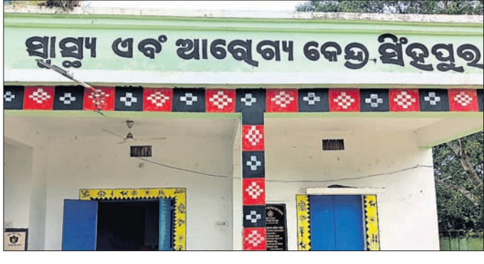
ସ୍ୱାସ୍ଥ୍ୟ ଏବଂ ଆରୋଗ୍ୟ କେନ୍ଦ୍ର ସିଂହପୁର ।

ଯାଜପୁରରୋଡ଼, ୨୩।୮ (ପବିତ୍ର ରଞ୍ଜନ ମହାନ୍ତି) ବ୍ୟାସନଗର ସ୍ୱୟଂଶାସିତ ମହାବିଦ୍ୟାଳୟ ପରିସରରେ ଥିବା ଇନ୍ଦ୍ରଧନୁ ଛାତ୍ରାବାସ ବିପଦସଂକୁଳ ଅବସ୍ଥାରେ ରହିଛି । ରକ୍ଷଣାବେକ୍ଷଣ ଅଭାବରୁ ଛାତ୍ରାବାସର କାନ୍ଥ ବହୁ ସ୍ଥାନରେ ଫାଟିବା ସହ ଛାତରୁ ସିମେଣ୍ଟ ଖଣ୍ଡ ଖସି ରହି ଦେଖାଯାଇଛି । ବର୍ଷା ସମୟରେ ପାଣି ଗରୁଛି । ଫଳରେ ଛାତ୍ରାବାସରେ ରହୁଥିବା ଅଧ୍ୟାପକମାନେ ନିଜକୁ ସୁରକ୍ଷିତ ମଣୁଛନ୍ତି । ଏ ସମ୍ପର୍କରେ ଅଧ୍ୟାପକମାନେ କର୍ତ୍ତୃପକ୍ଷକୁ ଅଭିଯୋଗ କଲେ ମଧ୍ୟ କେହି କର୍ତ୍ତୃପତ