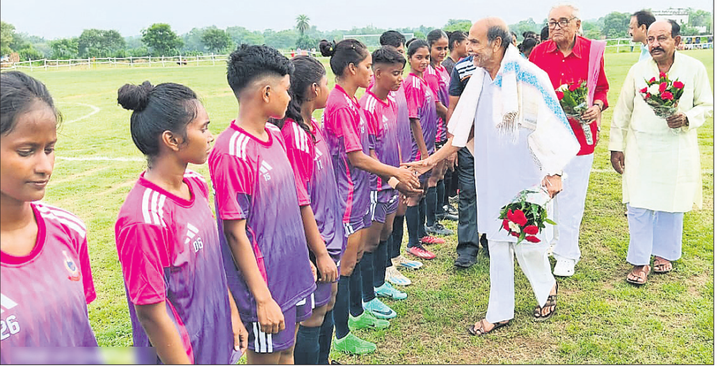
ସୋହେଲାରେ ଅତିଥିମାନେ ଖେଳାଳିଙ୍କ ସହ ପରିଚିତ ହେଉଛନ୍ତି।

ଆନ୍ଧ୍ର ଜିଲା ମହିଳା ପି.ସି. ବେହେରା ପୁରୁଷଲ ଚୁର୍ନାମେଖ ଉଦ୍‌ଘାଟନ ହେଉଛି।