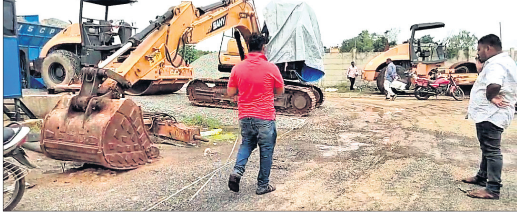
ପିରୁ ପ୍ଲାଷ୍ଟିକରେ ମାପରୁପ କରାଯାଉଛି ।