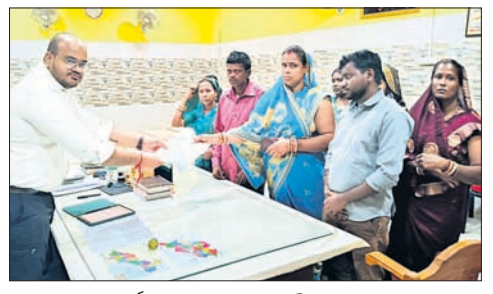
ଖୁବ୍ ସଭ୍ୟଙ୍କ ଦ୍ୱାରା ଉପଜିଲ୍ଲାପାଳଙ୍କୁ ଲିଖିତ ଅଭିଯୋଗ ପ୍ରଦାନ କରାଯାଇଛି।

ବାଲେଶ୍ୱର ଜିଲ୍ଲା ଖଇରା ବ୍ଲକ ଅଧୀନ କୁରୁକ୍ଷେତ୍ର ପଞ୍ଚାୟତରେ ଖୁବ୍ ସମୟ ଉଲ୍ଲଙ୍ଘନ କାର୍ଯ୍ୟକୁ ଦୂରରେ ରଖାଯିବା ପ୍ରତିବାଦରେ ୧୦ଜଣ ଖୁବ୍ ସଭ୍ୟ ସରପଞ୍ଚଙ୍କ ନାମରେ ଅନାସ୍ଥା ପ୍ରସ୍ତାବ ବାଲେଶ୍ୱର ଉପଜିଲ୍ଲାପାଳ ପ୍ରଥମେ ଗାଳ୍ପିକ ହିସାବରେ ପ୍ରଦାନ କରିଛନ୍ତି।