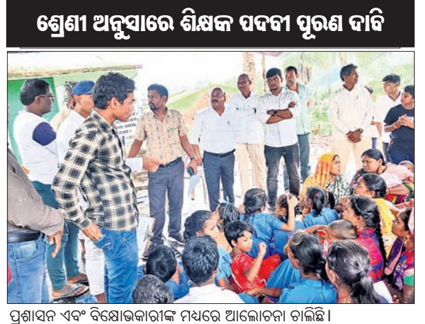
ଶ୍ରେଣୀ ଅନୁସାରେ ଶିକ୍ଷକ ପଦବୀ ପୂରଣ ଦାରି

ଦାରିଦ୍ର୍ୟବାଦି, ୨୩୩୮ (ଅଭୁକ୍ତ ପାହୁ): ଦାରିଦ୍ର୍ୟବାଦିଙ୍କୁ ରୁକ୍ତ ପର୍ତ୍ତମାତ୍ରା ସେବାଗ୍ରମକୁ ଅଭିଭାବକ ଓ ପଞ୍ଚାୟତରାଜୀ ତାଳା ପକାଇ ଦିଆଯାଇ ପ୍ରଥମ ପରାମର୍ଶ ପ୍ରଦାନ କରାଯାଇଛି।