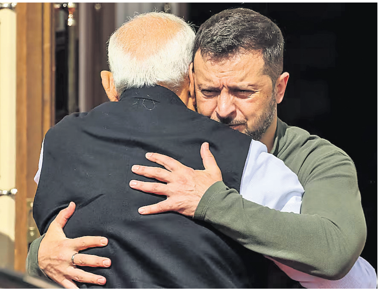
ପ୍ରଧାନମନ୍ତ୍ରୀ ନରେନ୍ଦ୍ର ମୋଦି ଶୁକ୍ରବାର କିଛି ଗସ୍ତରେ ଥିବାବେଳେ ମୁକ୍ତେନ୍ଦ୍ର ରାଷ୍ଟ୍ରପତି ଭୋଲୋଡିମିର ଜେଲେନସ୍କିଙ୍କ ସହ ଆଲିଙ୍ଗନ ବେଳର ଦୃଶ୍ୟ। (ରିପୋର୍ଟ: ପୃଷ୍ଠା-୨)