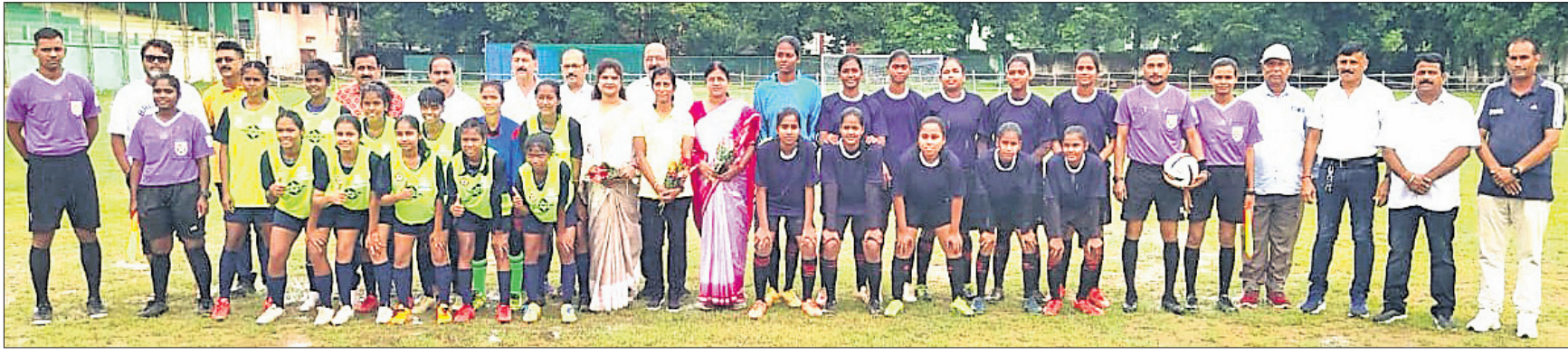
ବରଗଡ଼ଠାରେ ଶୁକ୍ରବାର ସିନିୟର ମହିଳା ଆନ୍ଧ୍ର ଜିଲା ପି.ସି. ବେହେରା ପୁରୁଷଲ ଚୁର୍ନାମେଖ ଉଦ୍‌ଘାଟନ ଅବସରରେ ଖେଳାଳିଙ୍କ ସହ ଅତିଥି ଓ କର୍ମଚାରୀ।

ପଞ୍ଜାବର ଶିକ୍ଷକ ବିରୋଧରେ ହତ୍ୟା ଅଭିଯୋଗ ହେବା ପରେ ପୁଲିସ୍ ତଦନ୍ତ ଆରମ୍ଭ କରିଛନ୍ତି।