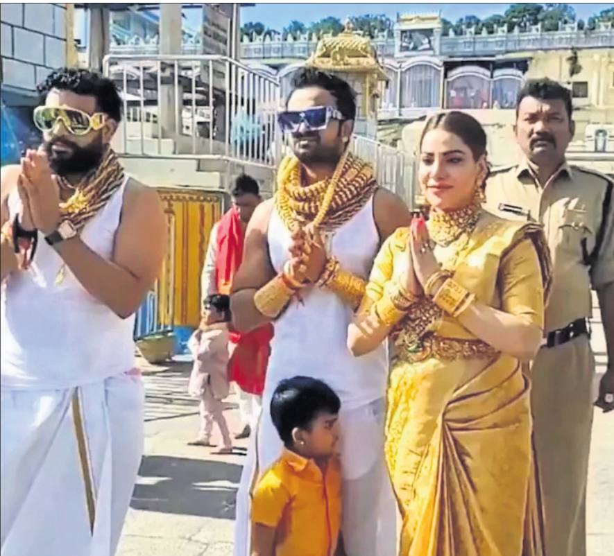
ପୁଣେରୁ ଆସିଥିବା ବୁଲ ପୁରୁଷ ଓ ଜଣେ ମହିଳା ଶ୍ରୀକାକୁ ୨୫ କେ.ଜି. ଓଜନର ସୁନା ଗହଣା ପିନ୍ଧି ଶୁକ୍ରବାର ଆନ୍ଧ୍ରପ୍ରଦେଶ ଡିଭିଜନର ଡିପୁଟି ମାଲିକ ଭେଙ୍କଟେଶ୍ୱରଙ୍କ ଦର୍ଶନ କରୁଛନ୍ତି।