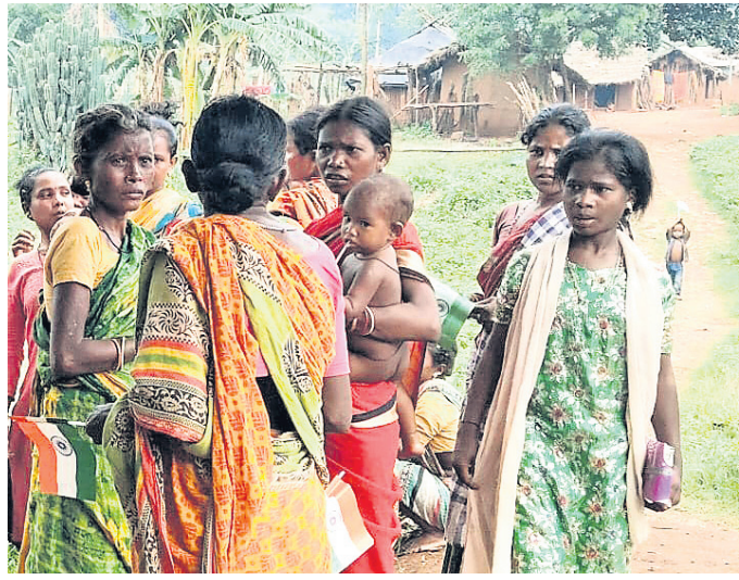
ରୁପୁଣି ଗ୍ରାମର ଅବହେଳିତ ଆଦିବାସୀ ।

ଗ୍ରାମକୁ ରାସ୍ତା ନିର୍ମାଣ ହୋଇପାରିନାହିଁ । ପ୍ରାୟ ୨୦୧୭ରେ ଖଣିକ ଫଳରେ ଏବେ ବି ସେଠାରେ ଉନ୍ନତ ସ୍ୱାସ୍ଥ୍ୟସେବା ପହଞ୍ଚି ନ ପାରି ଅପୂର୍ଣ୍ଣ ସହ ମାଟୁ ଓ ଶିଶୁ ମୃତ୍ୟୁ ହେଉଛି ।