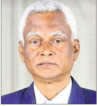
ଗଠୁନାଥପୁର, ୨୩୮୮ (ଗରତ ରାଜତ)