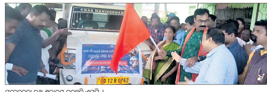
ସଚେତନତା ରଥ ଶୁଭାରମ୍ଭ କରୁଛନ୍ତି ଏମ୍ପି।

ଗଜପତି ଜିଲ୍ଲା ମୋହନା ବ୍ଲକ୍ କାର୍ଯ୍ୟାଳୟ, ସମ୍ବଲପୁର ମୋହନା ବ୍ଲକ୍ ଜନତା ଦଳ ପକ୍ଷରୁ ଶୁଭାରମ୍ଭ ବିଶୋଧ ପ୍ରଦର୍ଶନ କରାଯାଇଛି।