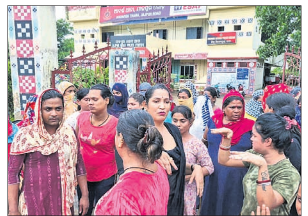
ଥାନା ସମ୍ମୁଖରେ ଏକାଠି ହୋଇଥିବା କିନ୍ଦରମାନେ।