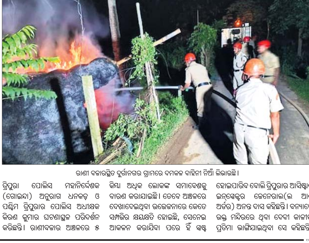
ରାଣା ବଜାରସ୍ଥିତ ଦୁର୍ଗାନଗର ଗ୍ରାମରେ ଦମକ ବାହିନୀ ନିଆଁ ଲିଭାଇଛି।

ପଶ୍ଚିମ ତ୍ରିପୁରାର ରାଣା ବଜାରସ୍ଥିତ ଦୁର୍ଗାନଗର ଗ୍ରାମରେ ଥିବା ଏକ ମନ୍ଦିରରେ ଦେବୀ କାଳୀଙ୍କ ଭଙ୍ଗା ମୂର୍ତ୍ତିକୁ ନେଇ ଉତ୍ତେଜନା ସୃଷ୍ଟି ହୋଇଛି। ରବିବାର ବିକ୍ଷିତ ରାତିରେ କେତେଜଣ ଉପଦ୍ରବୀ ଗ୍ରାମର ୧୬ ଘରେ ନିଆଁ ଲାଗାଇ ଦେଇଛନ୍ତି।