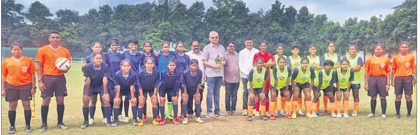
ବରଗଡ଼ ଲେଜ୍‌ ମିଶ୍ର ମିନି ଷ୍ଟାଡ଼ିୟମରେ ମ୍ୟାଟ୍‌ ପୂର୍ବରୁ ଭକ୍ତ ଦଳର ଖେଳାଳିଙ୍କୁ ସହ ଅତିଥି।