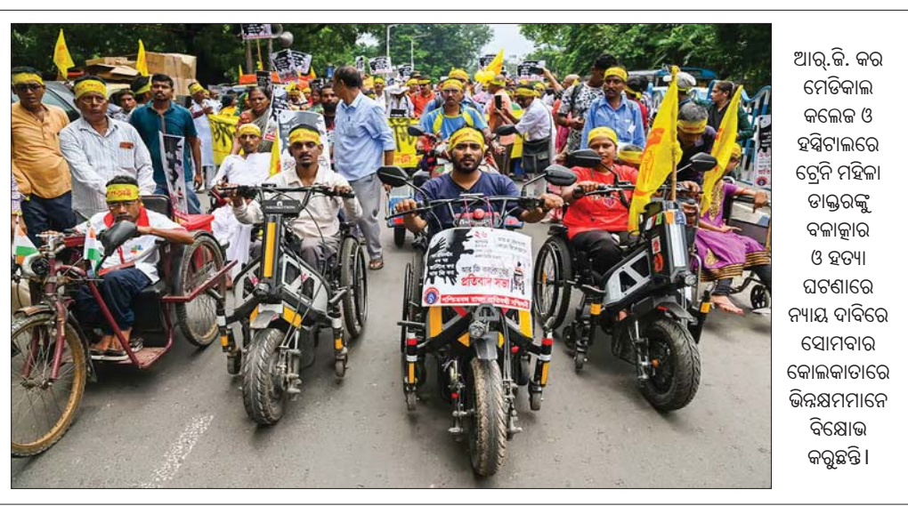
ଆର୍.ଜି. କର ମେଡିକାଲ କଲେଜ ଓ ହସିଗାଲରେ ଟ୍ରେନି ମହିଳା ଡାକ୍ତରଙ୍କୁ ବଳାହାର ଓ ହତ୍ୟା ଘଟଣାରେ ନ୍ୟାୟ ଦାବିରେ ସୋମବାର କୋଲକାତାରେ ଭିକ୍ଷାମାଗନାରେ ବିକ୍ଷୋଭ କରୁଛନ୍ତି।

ଗାଜା ଉପରେ ଇସ୍ରାଏଲର ଆକ୍ରମଣ ଜାରି ରହିଥିବାବେଳେ ଯୁଦ୍ଧବିରତି ଆଶା ମଉଲିକାରେ ଲାଗିଛି। କେନ୍ଦ୍ରୀୟ ଗାଜା ଷ୍ଟିପର ଡେଇଁ ଅଲ-ବାଲାହ ଛାଡ଼ି ପଳାଇବାକୁ ରବିବାର ବିକ୍ଷିତ ରାତିରେ ଇସ୍ରାଏଲ ନୂଆ ନିର୍ଦ୍ଦେଶନାମା କରିବା ପରେ ୨,୫୦,୦୦୦ ଲୋକ ଅନାଥ ପକାଇଲେଣି।