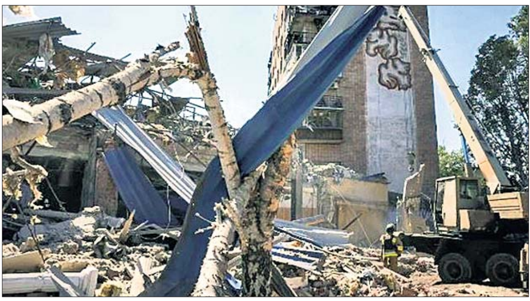
ରୁଷିଆର ମିଶାଇଲ ଆକ୍ରମଣରେ ଏକ ବହୁତଳ ବିଲ୍ଡିଂ ଧ୍ୱଂସ ହୋଇଯାଇଛି।

ୟୁକ୍ରେନ୍ର ଶୁଭି ଭିଜିଲି ପ୍ରକଳ୍ପକୁ ଚାର୍ଜେଜ୍ କରି ରୁଷିଆ ସୋମବାର ଜୋର୍ଦ୍ଦାର ଆକ୍ରମଣ କରିଛି। ରୁଷିଆ ସେନା ପକ୍ଷରୁ ୧୦୦ ମିଶାଇଲ ଏବଂ ଶତାଧିକ ଡ୍ରୋନ୍ରେ ଆକ୍ରମଣ କରାଯାଇଥିଲା।