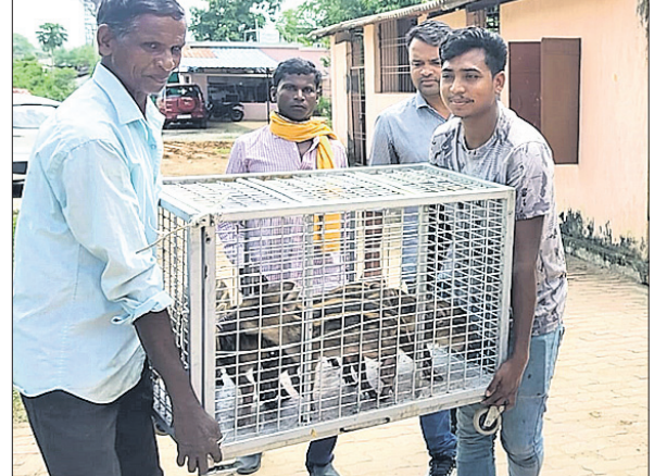
ଉଦ୍ଧାର ହୋଇଥିବା ବାରୁଆ ଛୁଆ।

ଖଡ଼ିଆଳ, ୨୬୮ (ପୁଲିସ୍ କୁମାର ପ୍ରଧାନ) ନିଧାପତ୍ନୀ ଜିଲା ଖଡ଼ିଆଳ ବ୍ଲକ୍ ଗଡ଼ାମୁଣ୍ଡା ଅଞ୍ଚଳରେ ଗତ ଦିନ ଦିନ ହେଲା ବାରୁଆ ଉପତ୍ୟକା ଲାଗିରହିଛି। ବାରୁଆ ପଲ ଲୋକଙ୍କ ବାରିରେ ପଶି ମକା ଓ ପଦିପରିବା ଗାଈ ନଷ୍ଟ କରୁଛନ୍ତି।