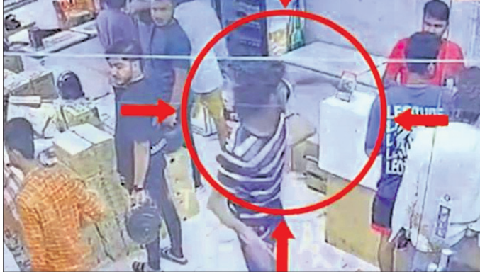
ମଦ ଦୋକାନ ଉପରକୁ ପଥର ମାଡ଼ ସମୟର ସିଦ୍ଧିଚିତ୍ର ଫୁଟେଜ।

ରାଜଧାନୀରେ ମଦ୍ୟପ ଯୁବକଙ୍କ ଉନ୍ମତ୍ତାଣ। ଡିସ୍କୋରୁ ଓ ଫ୍ରିଜ୍ରେ ମଦ ନ ଦେବାରୁ ଏକ ମଦ ଦୋକାନ ଉପରକୁ ପଥର ଓ କାଚ ବୋତଲ ଫିଙ୍ଗି ଭଙ୍ଗାରୁଜା କରିବା ସହ କର୍ମଚାରୀଙ୍କୁ ଆକ୍ରମଣ କରିଛନ୍ତି। ଲାଷ୍ଟାସାଗର ଥାନା ଅନ୍ତର୍ଗତ ଷ୍ଟେଜନବଜାର ନିକଟ ଚିନ୍ତାମଣିଶ୍ୱର ଅଞ୍ଚଳରେ ଏଭଳି ଘଟଣା ଘଟିଥିବା ବେଳେ ଘଟଣା ବେଳର ଦୃଶ୍ୟ ସିଦ୍ଧିଚିତ୍ର ଫୁଟେଜରେ କ୍ୟାପ୍ଚର କରାଯାଇଛି।