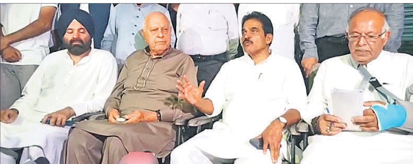
କଂଗ୍ରେସ ଏବଂ ନ୍ୟାଶନାଲ କନ୍ଫରେନ୍ସ (ଏନ୍‌ସି) ମଧ୍ୟରେ ଆସନ ବୁକ୍ସାମଣା ବୃତ୍ତାନ୍ତ ହେବା ପରେ ଶ୍ରୀମନ୍ତ୍ରୀଙ୍କ ସହ ଏକ ମିଳିତ ଖବରଦାତା ସମ୍ମିଳନୀକୁ ୨୯ତମ ନେତା ସୂଚନା ଦେଖାଯାଇଛି ।

ଶ୍ରୀମନ୍ତ୍ରୀ, ୨୬/୮ କଂଗ୍ରେସ ବିଧାନସଭା ନିର୍ବାଚନ ପାଇଁ ନ୍ୟାଶନାଲ କନ୍ଫରେନ୍ସ (ଏନ୍‌ସି) ଏବଂ କଂଗ୍ରେସ ମଧ୍ୟରେ ଆସନ ବୁକ୍ସାମଣା ସୋପାନର ବୃତ୍ତାନ୍ତ ହୋଇଛି । ୯୦ ଆସନ ବିଶିଷ୍ଟ ବିଧାନସଭା ପାଇଁ ଏନ୍‌ସି ୫୧ ଆସନରେ ଲଢ଼ିବାକୁ ଥିବାବେଳେ ସହଯୋଗୀ ଦଳ କଂଗ୍ରେସ ୩୨ ଆସନରେ ପ୍ରତିଦ୍ୱନ୍ଦ୍ୱିତା କରିବାକୁ ରାଜି ହୋଇଛି । ଏହା ବ୍ୟତୀତ ମେଣ୍ଟ ସହଯୋଗୀ ସିପିଆଇ(ଏନ) ଏବଂ କଂଗ୍ରେସ ନ୍ୟାଶନାଲ ପାଇର୍ସ ପାର୍ଟି