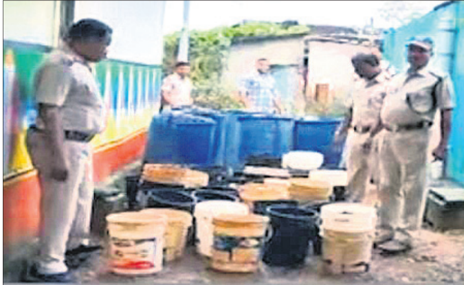
ଅବକାରୀ ଟିମ୍ ଦ୍ୱାରା ଜବତ ହୋଇଥିବା ଦେଶୀ ମଦ।

ଅବସ୍ଥାରେ ଉକ୍ତ ମଦ ଦୋକାନକୁ ଯାଇଥିଲେ। ସ୍ଥାନୀୟ ଅଞ୍ଚଳରେ ଉକ୍ତ ମଦ ଦୋକାନକୁ ଯାଇଥିଲେ। ସ୍ଥାନୀୟ ଅଞ୍ଚଳରେ ଉକ୍ତ ମଦ ଦୋକାନକୁ ଯାଇଥିଲେ।