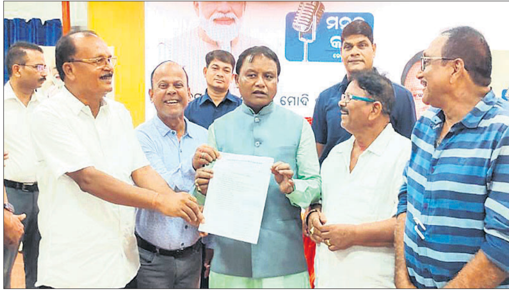
ବିକାଶ ପରିଷଦ ସଦସ୍ୟ ମୁଖ୍ୟମନ୍ତ୍ରୀଙ୍କୁ ଦାବିପତ୍ର ପ୍ରଦାନ କରୁଛନ୍ତି ।