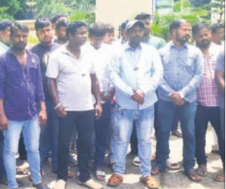
ପୋଲିସ୍ ସେବା ଭବନ ଆଗରେ ତିଜେ ମାଲିକଙ୍କ ଧାରଣା।