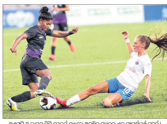
ଓଏସ୍‌ସି ଓ ଲାନ୍‌ସ୍‌ ବିଟି ସେଲର୍‌ସ୍‌ ମଧ୍ୟରେ ଅନୁଷ୍ଠିତ ମ୍ୟାଚ୍‌ରେ ଏକ ସଂଘର୍ଷପୂର୍ଣ୍ଣ ମୁହୂର୍ତ୍ତ।