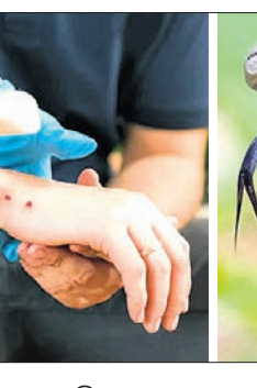
ଅଞ୍ଚଳରେ ଅଧିକାଂଶ ଲୋକ ସାପ କାମୁଡ଼ିବା ପରେ ଡାକ୍ତରୀ ଚିକିତ୍ସା ନ କରି ଗୁଣିଆ ଉପରେ ନିର୍ଭର କରିଥାନ୍ତି। ଗୁଣିଆ ଭଲ ନ କରିପାରିଲେ ମେଡିକାଲକୁ ଆଣାଯାଏ।

ଅଧିକାଂଶ ଲୋକ ସାପ କାମୁଡ଼ିବା ପରେ ଡାକ୍ତରୀ ଚିକିତ୍ସା ନ କରି ଗୁଣିଆ ଉପରେ ନିର୍ଭର କରିଥାନ୍ତି। ଗୁଣିଆ ଭଲ ନ କରିପାରିଲେ ମେଡିକାଲକୁ ଆଣାଯାଏ। ଫଳରେ ଆବଶ୍ୟକ ଚିକିତ୍ସା ଆଭାବରୁ ଲୋକଙ୍କ ମୃତ୍ୟୁ ଘଟିଥାଏ। ସଚେତନତା ଆଭାବରୁ ମୃତ୍ୟୁସଂଖ୍ୟା ବୃଦ୍ଧି ପାଇଥିବା ବେଳେ ରୋଗୀଙ୍କୁ ତତ୍କାଳ ଚିକିତ୍ସା ଯୋଗାଇଦେଲେ ଅନେକ ଜୀବନ ବଞ୍ଚାଇପାରିଥାନ୍ତା। ଜିଲ୍ଲା