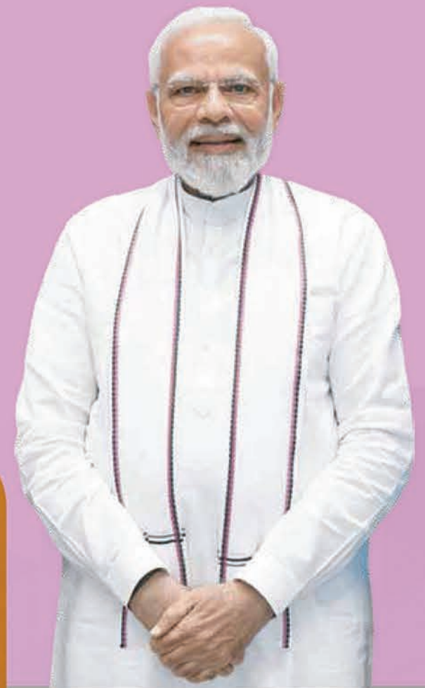
ମାନ୍ୟବର ପ୍ରଧାନମନ୍ତ୍ରୀ ଶ୍ରୀ ନରେନ୍ଦ୍ର ମୋଦୀ