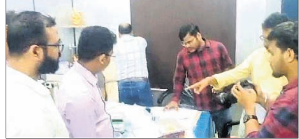
ସିଟି ଜିଏସ୍‌ଟି କାର୍ଯ୍ୟାଳୟରେ ଜବତ ସୁନା, ରୁପା ଯାଞ୍ଚ କରାଯାଉଛି।

ବିପାନବନ୍ଧନ ନିକଟରୁ ସୁନା ଓ ରୁପା ଜବତ ଘଟଣା ■ ଜିଏସ୍‌ଟି ଅଧିକାରୀଙ୍କୁ ସୁନା ଦୋକାନୀ ■ ହୀରା ଜବତ ହୋଇଥିବା ଚର୍ଚ୍ଚା