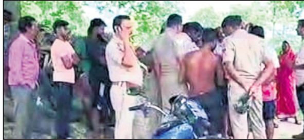
କୁଳଡିହା ରେଞ୍ଜର ପ୍ରବାର ପୂର୍ଣ୍ଣ ବୁଝାଣୁଣା କରୁଛନ୍ତି।