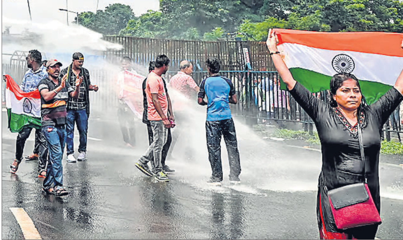
ମୃତ ମହିଳା ତାତ୍ତ୍ୱରତ୍ୱ ନ୍ୟାୟ ଦାବିରେ ଛାତ୍ରାଛାତ୍ର ପଶ୍ଚିମବଙ୍ଗ ସରକାରଙ୍କୁ ଅଭିଯାନବେଳେ ହାତୁଡ଼ାଠାରେ ପୋଲିସ ସେମାନଙ୍କୁ ଘଉଡ଼ାଇବା ପାଇଁ ପାଣିମାଡ଼ କରୁଛି।