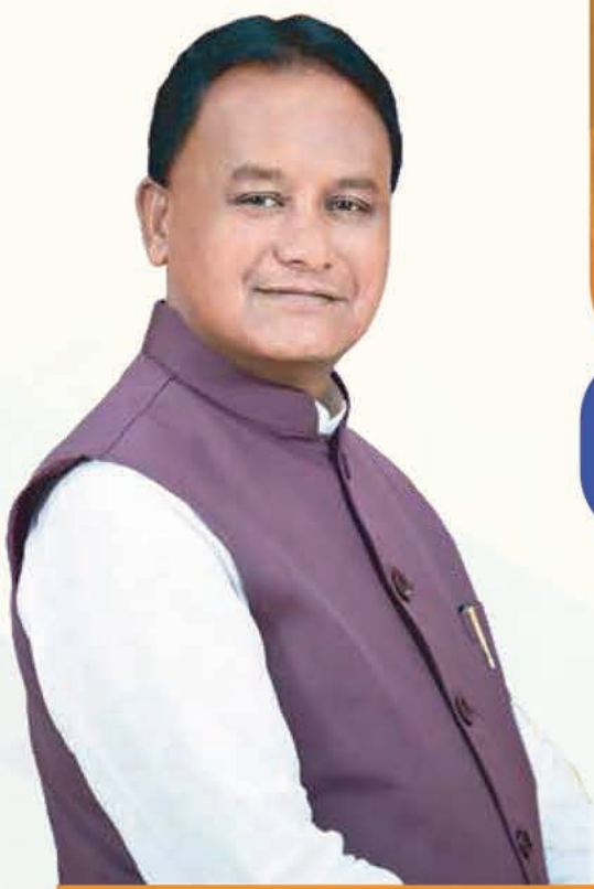
ମାନ୍ୟବର ମୁଖ୍ୟମନ୍ତ୍ରୀ ଶ୍ରୀ ମୋହନ ଚରଣ ମାଝୀ