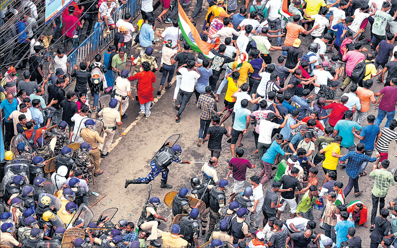
ପଶୁପତ୍ୟ ଛାତ୍ର ସମାଜର ଆନ୍ଦୋଳନର ବିଶୋଭକାରୀମାନଙ୍କୁ କୋଲକାତା ପୋଲିସର ରାପିଡ୍ ଆକ୍ସନ ଫୋର୍ସ ଗୋଡ଼ାଇ ପିଟୁଛି।