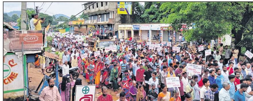
ବନ୍ଦ ପାଇଁ ଯାତ୍ରା କରୁଥିବା କର୍ମଚାରୀଙ୍କୁ ନିର୍ବାଚିତ ସଦସ୍ୟ ଓ ଜନସାଧାରଣ।

କେନ୍ଦୁଝର (ନରେଶ ଚନ୍ଦ୍ର ପଟ୍ଟନାୟକ)/ ତେଲକୋଇ (ରଞ୍ଜିତ ବିଶ୍ୱାଳ), ୨୭।୮