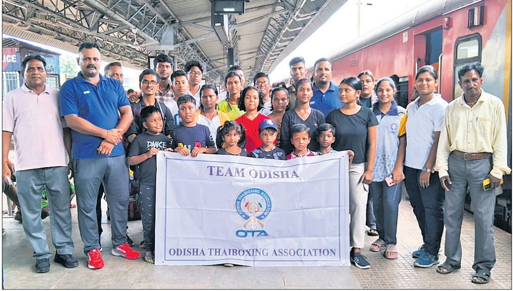
କର୍ମକର୍ତ୍ତାଙ୍କ ଗହଣରେ ଓଡିଶା ଆଇ ବକ୍ସିଂ ଦଳ।