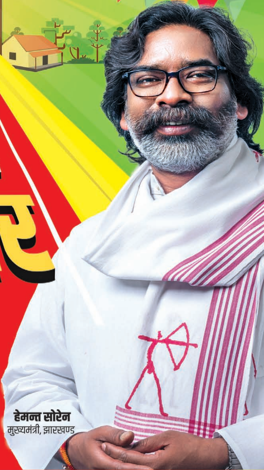
हेमन्त सोरेन मुख्यमंत्री, झारखण्ड

देने आपको अधिकार... फिर से आ रही हेमन्त सरकार आपके द्वार