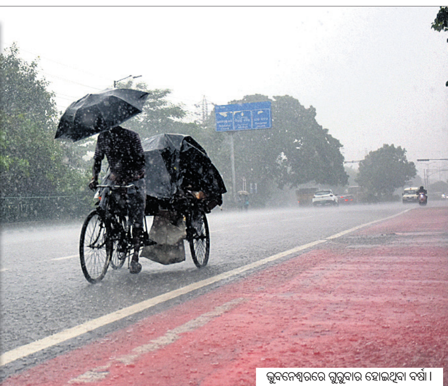
ଭୁବନେଶ୍ୱରରେ ଗୁରୁବାର ହୋଇଥିବା ବର୍ଷା।

ଭୁବନେଶ୍ୱର, ୨୯୮ (ଅନୁରାଧା ମହାରଣା) ପୂର୍ବ ମଧ୍ୟ ଏବଂ ଉତ୍ତର ବଙ୍ଗୋପସାଗର ପାର୍ଶ୍ୱବର୍ତ୍ତୀ ଅଞ୍ଚଳରେ ଦୁର୍ଭି ହୋଇଥିବା ଲଘୁତାପ ଶୁକ୍ରବାର ପଶ୍ଚିମ ଉତ୍ତର ଦିଗରେ ଦକ୍ଷିଣ ଓଡ଼ିଶା ଏବଂ ଉତ୍ତର ଆନ୍ଧ୍ରପ୍ରଦେଶ ଉପକୂଳବର୍ତ୍ତୀ ଅଞ୍ଚଳ ଦେଇ ଗତି କରିବ। ଏହା ପ୍ରଭାବରେ ଓଡ଼ିଶାରେ ବର୍ଷା ଜାରି ରହିଥିବାବେଳେ ଶୁକ୍ରବାରଠାରୁ ଏହାର ପରିମାଣ ବୃଦ୍ଧି ପାଇବ। ଆଞ୍ଚଳିକ ପାଣିପାଗ କେନ୍ଦ୍ର ପକ୍ଷରୁ ରୁକୁବାର ସଂସ୍ଥାରେ ଜାରିକୃତଲେଟିନରେ ଏ ସମ୍ପର୍କରେ ସୂଚନା ଦିଆଯିବା ସହ ବିଜିନି ଜିଲ୍ଲାକୁ ସତରୁ ସୂଚନା ଜାରି କରାଯାଇଛି। ରାୟଗଡ଼ା, ମାଲକାନଗିରି, କୋରାପୁଟ, ଗଞ୍ଜାମ ଓ ଗଜପତି ଜିଲ୍ଲାରେ ଅତି ପ୍ରବଳ ବର୍ଷା ନେଇ ଅନେକ ଖୁର୍ଦ୍ଧା ଏବଂ ଅନ୍ୟ ୨୦ ଜିଲ୍ଲାକୁ ଯେଲୋ ଖୁର୍ଦ୍ଧା ଦିଆଯାଇଛି। ୩୧ ଡାକ୍ତରୀ ବେଳକୁ ବର୍ଷାର ପ୍ରକୋପ ଅଧିକ ହୋଇପାରେ। ଏନେଇ ମାଲକାନଗିରି, କୋରାପୁଟ ଓ ଗଜପତି ଜିଲ୍ଲାକୁ ରେଡ୍ ଖୁର୍ଦ୍ଧା ଏବଂ ପୃଷ୍ଠା-୪