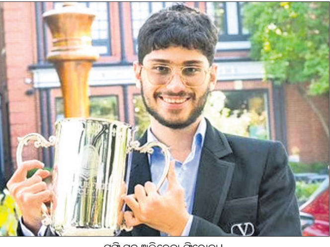
ପ୍ରେମ୍ ସହ ଅଲିରେଜା ଫିରୋଜା।

ସେଣ୍ଟ ଲୋଇସ, ୨୯।୮ (ପି.ଟି.) ଭାରତୀୟ ଚେସ୍ ପ୍ରତିଭା ଆର୍. ପ୍ରଜ୍ଞାନନ୍ଦଙ୍କ ସହ ତାଙ୍କ ଫାଇନାଲ ଗେମ୍ ଡ୍ର ରଖି ପ୍ରେମ୍ ଗ୍ରାଣ୍ଟମାଷ୍ଟର ଅଲିରେଜା ଫିରୋଜା ସିଙ୍କିଫଲ୍ କମ୍ ଚାମ୍ପିୟନ ହୋଇଛନ୍ତି। ସେ ଆହୁରି ମଧ୍ୟ ଗ୍ରାଣ୍ଟ ଚେସ୍ ଟୁର ୨୦୨୪ ଜିତିପାରିଛନ୍ତି।