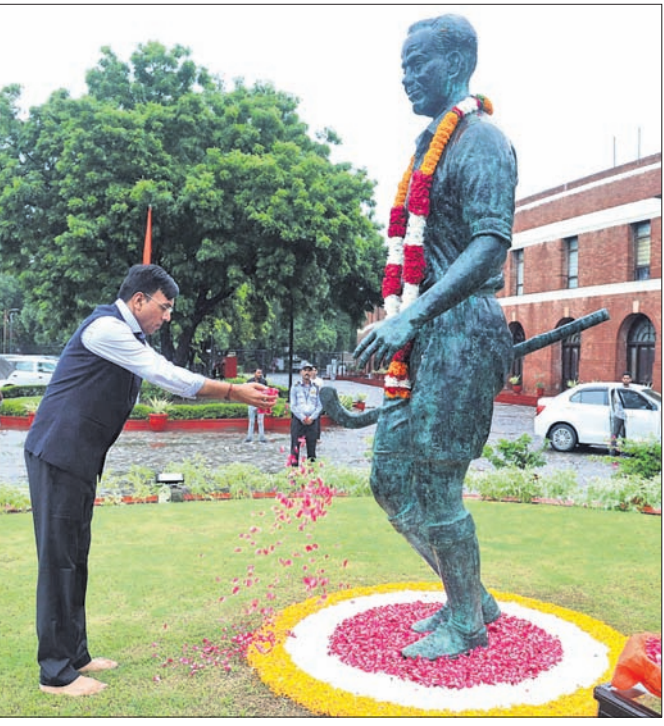
ଜାତୀୟ କ୍ରୀଡ଼ା ଦିବସ ଅବସରରେ ହଳି କିମ୍ବଦନ୍ତୀ ସାଧନାଙ୍କ ପ୍ରତିମୂର୍ତ୍ତିରେ ମାଲ୍ୟାପର୍ଣ୍ଣ କରୁଛନ୍ତି କେନ୍ଦ୍ର କ୍ରୀଡ଼ା ମନ୍ତ୍ରୀ ମନମୁଖ ମାଣ୍ଡବ୍ୟ।

ସେଣ୍ଟ ଲୋଲସ, ୨୯।୮ (ପି.ଟି.) ଭାରତୀୟ ଚେମ୍ ପ୍ରତିଭା ଆର୍. ପ୍ରଜ୍ଞାନନ୍ଦଙ୍କ ସହ ତାଙ୍କ ଫାଇନାଲ ଗେମ୍ ଡ୍ର ରଖି ପ୍ରେମ୍ ଗ୍ରାଣ୍ଟମାଣ୍ଡର ଅଲିରେଜା ଚାମ୍ପିୟନ ହେବାକୁ କମ୍ ବୟସ୍କ ଚାମ୍ପିୟନ ହୋଇଛନ୍ତି। ସେ ଆହୁରି ମଧ୍ୟ ଗ୍ରାଣ୍ଟ ଚେମ୍ ଚେମ୍ ୨୦୨୪ ଜିତିପାରିଛନ୍ତି।