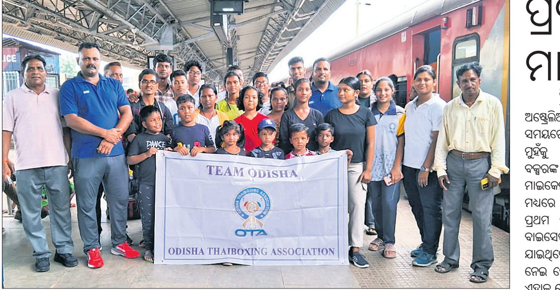
କର୍ମକର୍ତ୍ତାଙ୍କ ଗହଣରେ ଓଡ଼ିଶା ଥାଇ ବକ୍ସିଂ ଦଳ।