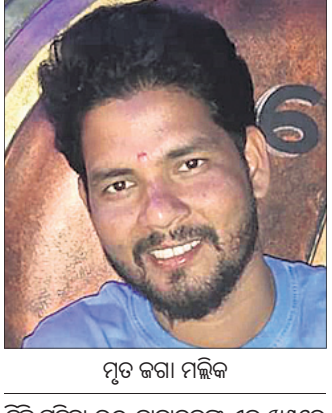
ପୃତ ଜଗା ମଲିକ

ଅନ୍ୟ ଜଣକ ନାବାଳକ କି ସାବାଳକ କି ପ୍ରମାଣ ନ ମିଳିବାରୁ ପୋଲିସ୍ ଠାକର ଓପିଡିଏକ୍ସରେ ଚେଷ୍ଟା କରିଆରେ ବୟସ ଜାଣିବାକୁ ଉଦ୍ୟମ କରି ରଖିଛି।