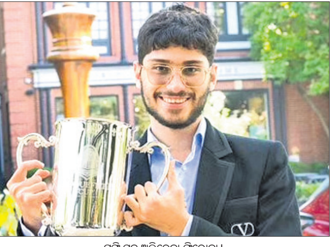
ପ୍ରେମ୍ ସହ ଅଲିରେଜା ଚାମ୍ପିୟନ।

ସେଣ୍ଟ ଲୋଲସ, ୨୯।୮ (ପି.ଟି.) ଭାରତୀୟ ଚେସ୍ ପ୍ରତିଭା ଆର୍. ପ୍ରଜ୍ଞାନନ୍ଦଙ୍କ ସହ ତାଙ୍କ ଫାଇନାଲ ଗେମ୍ ଡ୍ର ରଖି ପ୍ରେମ୍ ଗ୍ରାଣ୍ଡମାଷ୍ଟର ଅଲିରେଜା ଚାମ୍ପିୟନ ଶିଖିଥିଲେ କିମ୍ବଦନ୍ତୀ ଚାମ୍ପିୟନ ହୋଇଛନ୍ତି। ସେ ଆହୁରି ମଧ୍ୟ ଗ୍ରାଣ୍ଡ ଚେସ୍ ଚେମ୍ପିୟନ୍ ୨୦୨୪ ଭିତ୍ତିପାରିଛନ୍ତି।