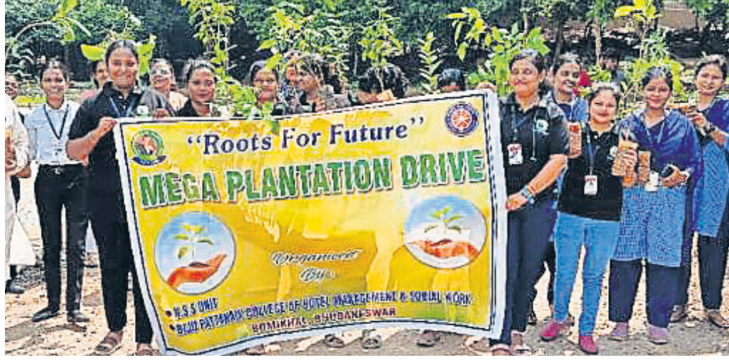
ଭୁବନେଶ୍ୱରସ୍ଥିତ ଶିଖରଚଣ୍ଡୀ ପାହାଡ଼ରେ ଚାରା ରୋପଣ ଅବସରରେ ଛାତ୍ରାଛାତ୍ରୀଙ୍କ ସହ ଅନୁମୋଦନ।