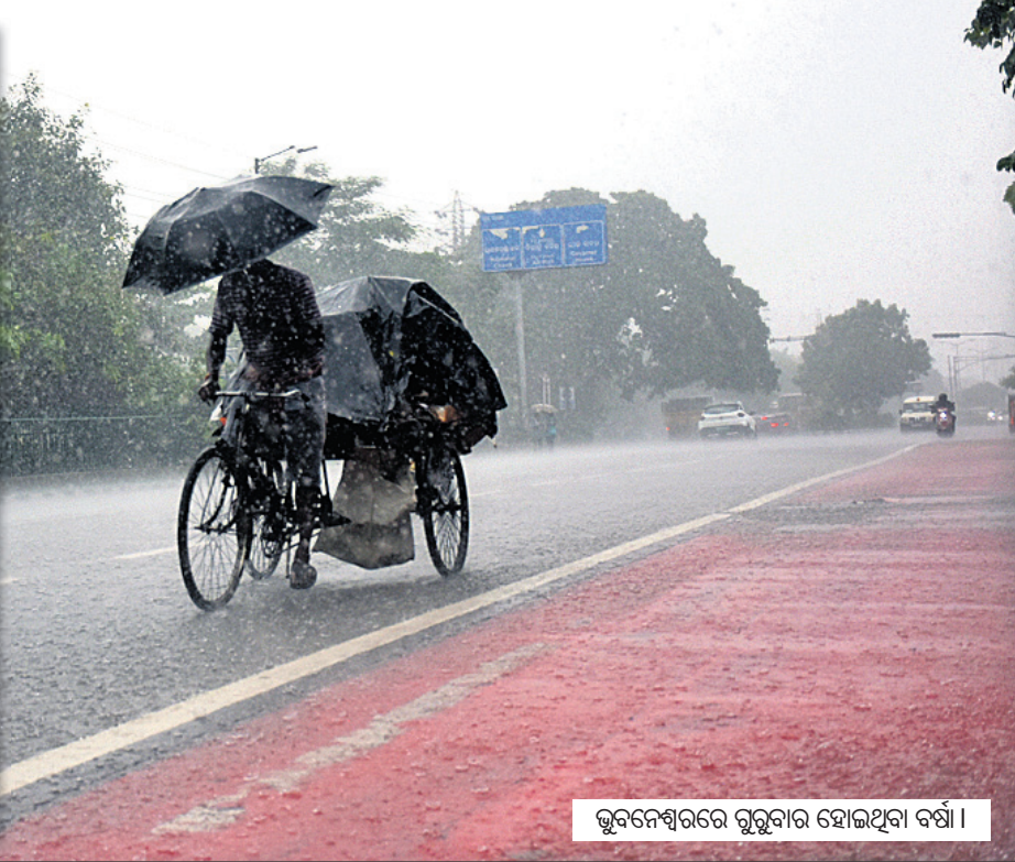
ଭୁବନେଶ୍ୱରରେ ରୁରୁବାର ହୋଇଥିବା ବର୍ଷା।

ଭୁବନେଶ୍ୱର, ୨୯୮୮ (ଅନୁରାଧା ମହାରଣା) ପୂର୍ବ ମଧ୍ୟ ଏବଂ ଉତ୍ତର ବଙ୍ଗୋପସାଗର ପାର୍ଶ୍ୱବର୍ତ୍ତୀ ଅଞ୍ଚଳରେ ଦୁର୍ଭି ହୋଇଥିବା ଲଘୁତାପ ଶୁକ୍ରବାର ପଶ୍ଚିମ ଉତ୍ତର ଦିଗରେ ଦକ୍ଷିଣ ଓଡ଼ିଶା ଏବଂ ଉତ୍ତର ଆନ୍ଧ୍ରପ୍ରଦେଶ ଉପକୂଳବର୍ତ୍ତୀ ଅଞ୍ଚଳ ଦେଇ ଗତି କରିବ।