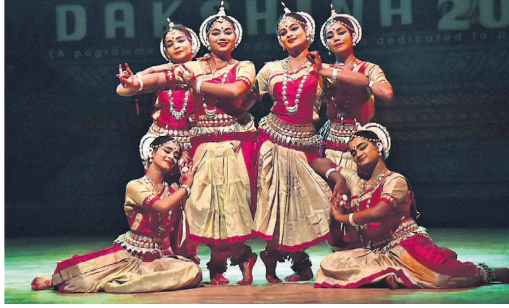
ଗୁରୁଦକ୍ଷିଣା ଉତ୍ସବର ଗୁରୁବାର ବ୍ରତୀୟ ସନ୍ଧ୍ୟାରେ ଶିଳ୍ପୀମାନେ ନୃତ୍ୟ ପରିବେଷଣ କରୁଛନ୍ତି।