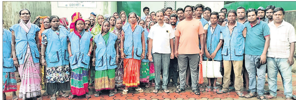
ଉପକିଳାପାଳକ କାର୍ଯ୍ୟାଳୟ ଆଗରେ ରୁକ୍ମିଣିକିକ ସଫେଇ କର୍ମଚାରୀ ସଂଘ ପକ୍ଷରୁ ବିଶେଷ ପ୍ରଦର୍ଶନ କରାଯାଇଛି।

ଠିକା ସଂସ୍ଥା ଦେଉଳି ସଫେଇ କର୍ମଚାରୀ ସଂଘ ପକ୍ଷରୁ ବିଶେଷ ପ୍ରଦର୍ଶନ କରାଯାଇଛି।