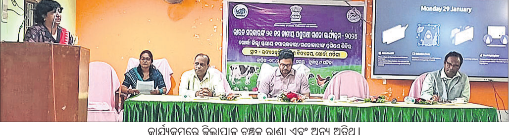
କାର୍ଯ୍ୟକ୍ରମରେ ଜିଲାପାଳ ଚଞ୍ଚଳ ରାଣା ଏବଂ ଅନ୍ୟ ଅତିଥି।

ଏକର ବେଆଇନ ପଥର ଖଣି ରହିଛି। ଏଥିସହ ଶ୍ରୀମନ୍ଦିର ପ୍ରଶାସନର ପ୍ରାୟ ୨ଶହ ଏକର ମାଳକ୍ତା ଓ କଳାପଥର ଖଣି ରହିଛି।