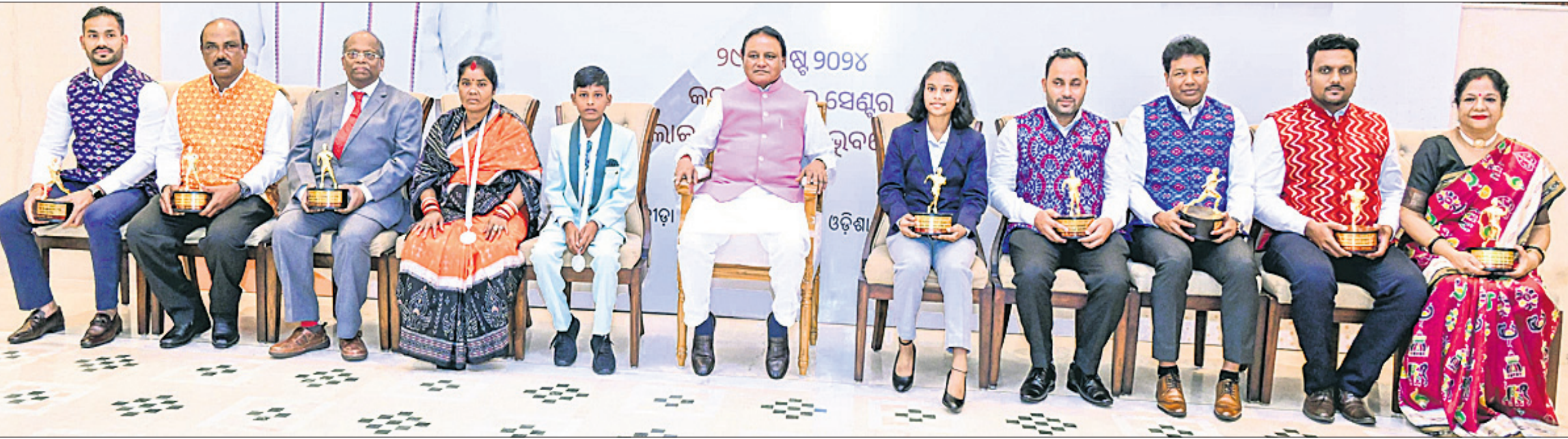
ଲୋକସେବା ଭବନର କର୍ତ୍ତବ୍ୟନିର୍ବାହୀ ସଚିବ ଶ୍ରୀମତୀ ସୁମିତ୍ରା ଦିବ୍ୟ ଅବସରରେ ବିଜୁ ପଟ୍ଟନାୟକ କ୍ରୀଡ଼ା ପୁରସ୍କାର ଓ ସାହିତ୍ୟ ପୁରସ୍କାରରେ ପୁରସ୍କୃତ ବ୍ୟକ୍ତିଙ୍କ ସହ ମୁଖ୍ୟମନ୍ତ୍ରୀ ମୋହନ ଚରଣ ମାଣି।