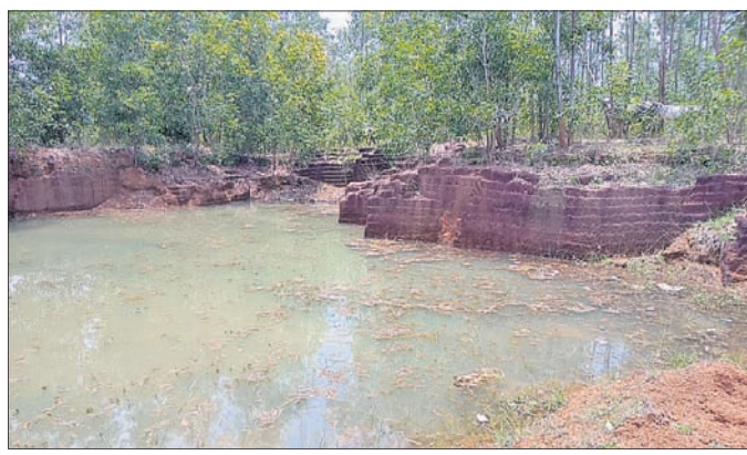
ଏକର ବେଆଇନ ପଥର ଖଣି ରହିଛି। ଏଥିସହ ଶ୍ରୀମନ୍ଦିର ପ୍ରଶାସନର ପ୍ରାୟ ୨ଶହ ଏକର ମାଳକ୍ତା ଓ କଳାପଥର ଖଣି ରହିଛି।

ବେଗୁନିଆ, ୨୯୮୮ (ହରପ୍ରସନ୍ନ ପଣ୍ଡା) ଖୋର୍ଦ୍ଧା ଜିଲା ବେଗୁନିଆ ତହସିଲ ଅଞ୍ଚଳରେ ଲଘୁ ଖଣିକ ସମ୍ପଦ ବୋରାଗୋଲାଗ ବଢ଼ିଚାଲିଛି।