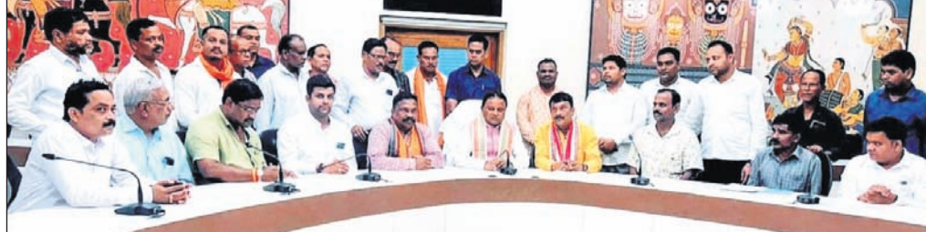
ଲୋକସେବା ଭବନରେ ମୁଖ୍ୟମନ୍ତ୍ରୀ ମୋହନ ଚରଣ ମାଝୀଙ୍କୁ ବରଗଡ଼ ଏମ୍ପି ପ୍ରଦୀପ ପୁରୋହିତ ଓ ଅନ୍ୟମାନେ ଭେଟୁଛନ୍ତି।