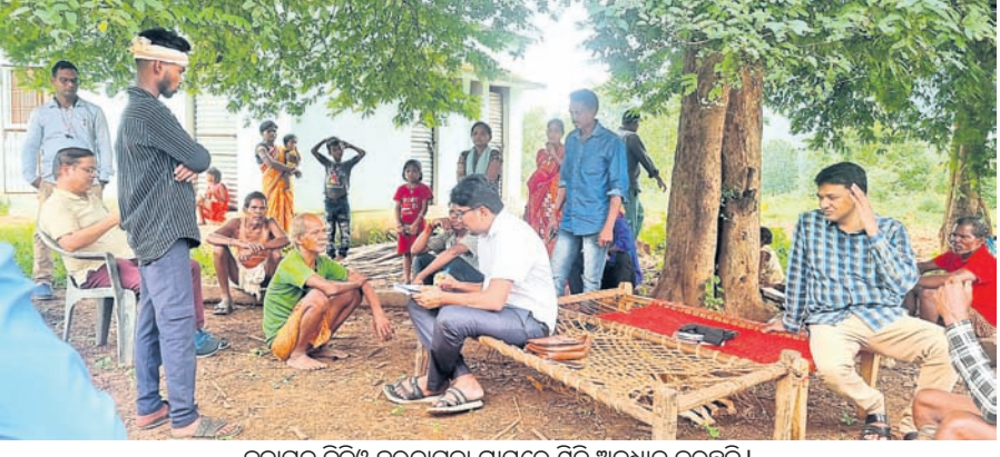
କୁମାରଗଡ଼ ବିଡିଓ ହରଡ଼ାଗୁଡ଼ା ଗ୍ରାମରେ ସ୍ଥିତି ଅନୁଧ୍ୟାନ କରୁଛନ୍ତି।

ଭବାନୀପାଟଣା, ୩୦ (ଉତ୍ତମ କୁମାର ଦାଶ) ସାଂପ୍ରତି ପାଇଁ ଜାତକକୁ ଚାଲି ଲଗାଇବା ଘଟଣା ଅନୁଧ୍ୟାନ ପାଇଁ ଗାଁରେ ପହଞ୍ଚିଲେ ବିଡିଓ ଦାଖଲ ପାଇଁ ସରକାରଙ୍କୁ ହାଇକୋର୍ଟ ନିର୍ଦ୍ଦେଶ ଦେଇଛନ୍ତି। ଜବାବ ଡଲିବ ଅନୁଯାୟୀ ଏହା ସମ୍ପର୍କରେ ଧାରା ୨୧-କରେ ପ୍ରଦାନ କରାଯାଇଥିବା ମୌଳିକ ଅଧିକାର ଉଲ୍ଲଙ୍ଘନ ବୋଲି ହାଇକୋର୍ଟ କହିଛନ୍ତି। ସେପ୍ଟେମ୍ବର ୨୬କୁ ମାମଲାର ପରବର୍ତ୍ତୀ ଶୁଣାଣି ପାଇଁ ଧାର୍ଯ୍ୟ କରାଯାଇଛି। ଏହି ମାମଲାରେ ବିଦ୍ୟାଳୟ ଓ ଗଣଶିକ୍ଷା ବିଭାଗ, ପୂର୍ବ ବିଭାଗ ସର୍ବୋଚ୍ଚ ଯନ୍ତ୍ରା(ସିଲିକ), କଳାହାଣ୍ଡିଜିଲ୍ଲାପାଳ ଓ ଅନ୍ୟମାନଙ୍କୁ ପସ୍ତକ୍ଷୁଦ୍ଧ କରାଯାଇଛି। ପ୍ରକାଶ ଯେ, ଜଜ୍ଜଳ ଭିତରେ