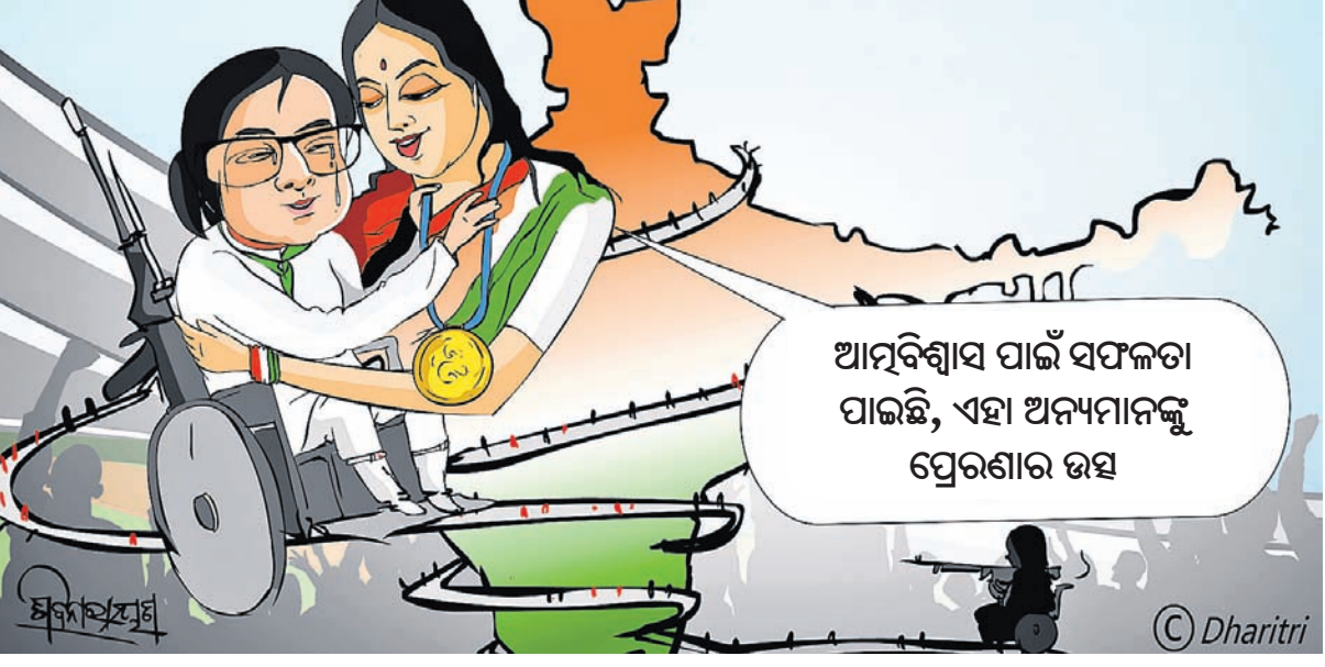
ଆତ୍ମବିଶ୍ୱାସ ପାଇଁ ସଫଳତା ପାଇଛି, ଏହା ଅନ୍ୟମାନଙ୍କୁ ପ୍ରେରଣାର ଉତ୍ସ