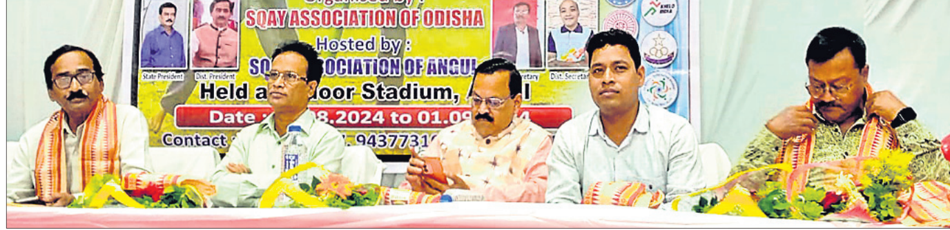
ଉଦ୍‌ଘାଟନୀ କାର୍ଯ୍ୟକ୍ରମରେ ମଞ୍ଚାସୀନ ଅତିଥିମାନେ।

ଅନୁଗୋଳ, ୩୦।୮ (ମାନସ ବିଶ୍ୱାଳ) ଅନୁଗୋଳ ଜନତୋର ଷ୍ଟିଡିମ୍‌ମଠାରେ ଶୁକ୍ରବାର ରାଜ୍ୟସ୍ତରୀୟ ସୋୟ ମାର୍ଗାଳ ଆର୍ଟ ଚୁର୍ନାମେଣ୍ଟ ଉଦ୍‌ଘାଟିତ ହୋଇଛି। ରବିବାର ପାଇନାଲ ପ୍ରତିଯୋଗିତା ଅନୁଷ୍ଠିତ ହେବ। ଏହି ପ୍ରତିଯୋଗିତାରେ ରାଜ୍ୟର ୩୦ ଜିଲାରୁ ୩୦୦ରୁ ଅଧିକ ପ୍ରତିଯୋଗୀ ଭାଗ ନେଇଛନ୍ତି।