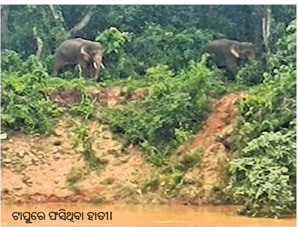
ଟାପୁରେ ଫସିଥିବା ହାତୀ।

କେନ୍ଦୁଝର ଜିଲ୍ଲା ପାଟଣା ରେଞ୍ଜ ବିଚାରଣା ନଦୀର ତୀରପଟା ଓ ତତ୍ତ୍ୱ ମଧ୍ୟରେ ଥିବା ୫ ହେକ୍ଟର ପରିମିତ ଟାପୁରେ ୧୭ ଚିଲିଆ ହାତୀପଲ ଦୀର୍ଘ ୩୬ ଘଣ୍ଟା ହେବ ଉକ୍ତ ଟାପୁରେ ରହିଥିବା ବେଳେ ଶୁକ୍ରବାର ସଞ୍ଜ ୭ଟା ପର୍ଯ୍ୟନ୍ତ ବାହାରିପାରି ନ ଥିବା ଜଣାପଡ଼ିଛି। ସାହାରପଡ଼ା ବନପାଳ ଉପରି ସେଠା କହିଛନ୍ତି, ଟାପୁରେ ଅଟକିବା ପଛରେ କାରଣ କିଛି ବି