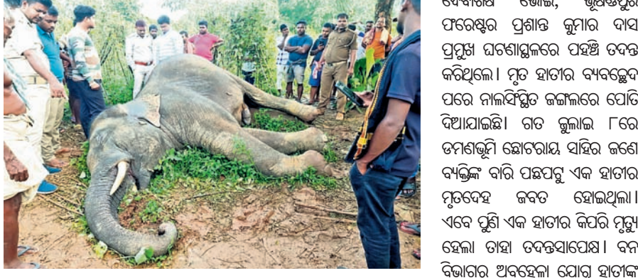
ବେଳେ ଘଟଣାସ୍ଥଳରେ ବିଭାଗୀୟ ଚିମ୍ପୁ ପହଞ୍ଚି ତଦନ୍ତ ଆରମ୍ଭ କରିଛି।

ଖୋର୍ଦ୍ଧା ଜିଲ୍ଲା ଗଞ୍ଜା ବନାଞ୍ଚଳରେ ହାତୀଙ୍କ ଉପଦ୍ରବ ବଢ଼ିଚାଲିଛି। ଖାଦ୍ୟ ଅଭାବରେ ହାତୀପଲ ଗାଁକୁ ଛାଡ଼ି ହେଉଛନ୍ତି। ଲୋକଙ୍କ ବାସରେ ପଶି ଫସି ଖାଇବା ସହ ଦଳିତକର୍ମ ନଷ୍ଟ କରୁଛନ୍ତି। ଏପରିକି ଘର ଓ ପାଟେରି ମଧ୍ୟ ଭାଙ୍ଗିଛନ୍ତି। ଅନେକ ସମୟରେ ହାତୀ-ମଣିଷ ମୁହଁମୁହଁ ହେଉଥିବା ନିଜର ରହିଛି। ଶୁକ୍ରବାର ଏହି ବନାଞ୍ଚଳ ଅନ୍ତର୍ଗତ ଓଲିଫା ପଞ୍ଚାୟତରେ ଡମ୍ପିଂଗ୍ରୁମିରୁ ଉଦ୍ଧାର ନିକଟ ଜଣେ ବ୍ୟକ୍ତିଙ୍କ ବାସ ପଛପଟୁ ଏକ ହାତୀର ମୃତଦେହ ଠାଏ ହୋଇଛି। ଏହାର ବୟସ ଆନୁମାନିକ ୨୦ବର୍ଷ ହେବ। ତେବେ ହାତୀ ମୃତ୍ୟୁର କାରଣ ଅସ୍ପଷ୍ଟ ରହିଥିବା