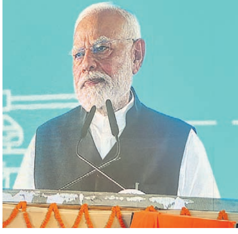
ଆଭାସୀରେ ଯୋଗଦେଲେ ପ୍ରଧାନମନ୍ତ୍ରୀ