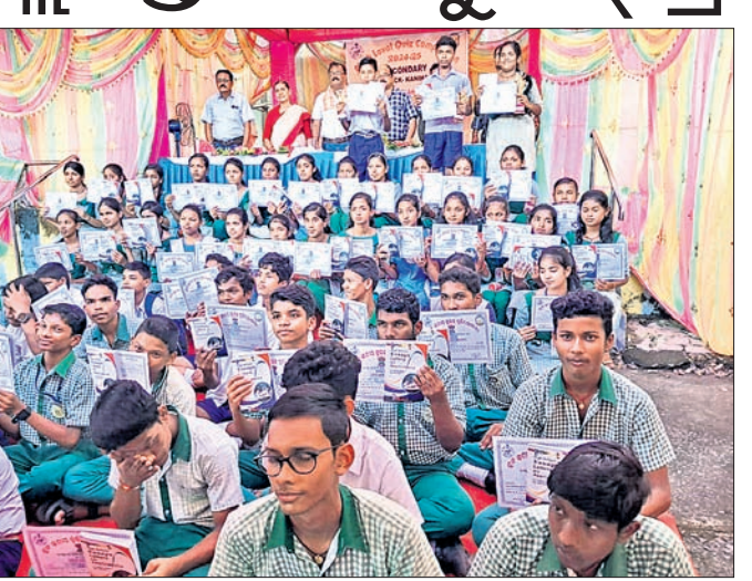
ଅତିଥିମାନଙ୍କ ସହ କୃତୀ ପ୍ରତିଯୋଗିତାମାନେ।