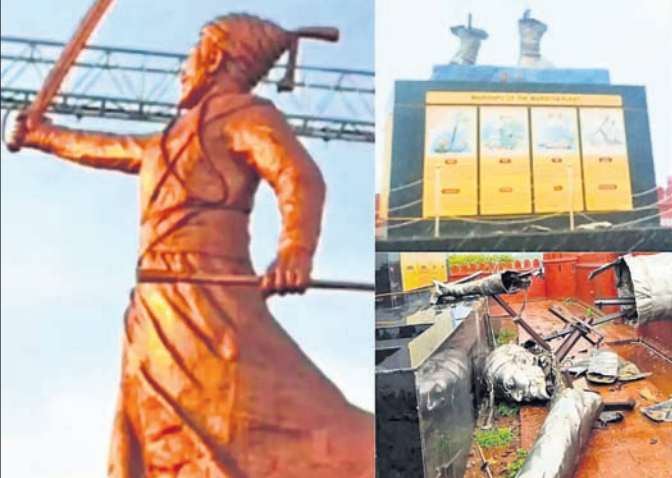
ଶିବାଜୀଙ୍କ ପ୍ରତିମୂର୍ତ୍ତି ଭାଙ୍ଗିବା ପରେ