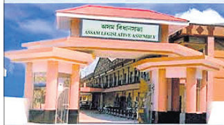
ଗୁଆହାଟୀ, ୩୦୮ (ପି.ଟି.)

ଆସାମ ବିଧାନସଭାରେ ମୁସଲମାନ ବିଧାୟକମାନଙ୍କ ନମାଜ ପାଠ ପାଠ ଶୁକ୍ରବାର ଦିଆଯାଉଥିବା ୨ ଘଣ୍ଟା ବିରତିକୁ ଉଠାଇ ଦିଆଯାଇଛି। ବିଧାନସଭାର ଆଗାମୀ ଅଧିବେଶନରୁ ଏହା କାର୍ଯ୍ୟକାରୀ ହେବ। ବିଧାନସଭାର ଏହି ନିଷ୍ପତ୍ତିକୁ ଆସାମ ମୁଖ୍ୟମନ୍ତ୍ରୀ ହମିଦ୍ ବିଶ୍ୱଶର୍ମା ସିଦ୍ଧାନ୍ତନୀକ ଭାବେ ଦେଖିଛନ୍ତି। ୧୯୩୭ରେ