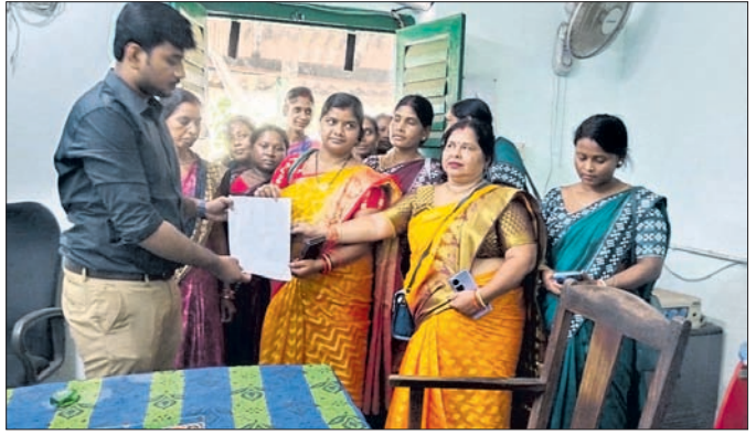
ସ୍ୱୟଂ ସହାୟକ ଗୋଷ୍ଠୀ ସଦସ୍ୟାମାନେ ଦାବିପତ୍ର ପ୍ରଦାନ କରୁଛନ୍ତି।