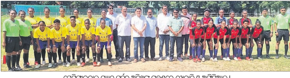
ସେମିଫାଇନାଲ ମ୍ୟାଚ ପୂର୍ବରୁ ଅତିଥିକ ଗହଣରେ ଖେଳାଳି ଓ ଅତିଥିଆଇ।

ବରଗଡ଼ ଲେଖା ମିଶ୍ର ମିନି ଷ୍ଟାଡ଼ିୟମରେ ଚାଳିଥିବା ଆଷ୍ଟ ଲିଗା ସିନିୟର ପି.ସି. ବେହେରା ମହିଳା ପୁରସ୍କାର ପ୍ରତିଯୋଗିତାରେ ଶୁଭକାରୀ ଅନୁଷ୍ଠିତ ହେଉଥିବା ପ୍ରଥମ ପଦକ ହାସଲ କରିଛନ୍ତି। ପାରାଲିମ୍ପିକ୍ସରେ ପ୍ରଥମ ଥର ପାଇଁ ପଦକ ହାସଲ କରିଛନ୍ତି। ପାରାଲିମ୍ପିକ୍ସରେ ପ୍ରଥମ ଥର ପାଇଁ ପଦକ ହାସଲ କରିଛନ୍ତି।