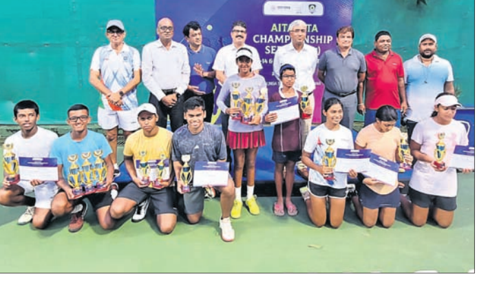
ଅତିଥିକ ଗହଣରେ ପୁରସ୍କୃତ ଚେନିଏ ଖେଳାଳିମାନେ।

ଭୁବନେଶ୍ୱର, ୩୦।୮ (ପଦମ ସାହୁ) ରାଜ୍ୟ କ୍ରୀଡ଼ା ଓ ଯୁବସେବା ବିଭାଗର ସହଯୋଗରେ ଓଡ଼ିଶା ଚେନିଏ ଆସୋସିଏସନ (ଓଟିଏ) ଆରମ୍ଭରେ କଳିଙ୍ଗ ଷ୍ଟାଡ଼ିୟମ ପରିସରରେ ୧୪ ଓ ୧୬ ବର୍ଷରୁ କମ୍ ଏଆଇଟିଏ-ଓଟିଏ ଚାମ୍ପିୟନଶିପ୍ ସିରିଜ (ସିଏସଏ) ଚେନିଏ ଚେନିଏ ଷ୍ଟାଡ଼ିୟମରେ ଶେଷ ହୋଇଛି। ୨୬ ଚାମ୍ପିୟନ ଆରମ୍ଭ ହୋଇଥିବା ଏହି ପ୍ରତିଯୋଗିତାରେ ପଶ୍ଚିମବଙ୍ଗ, ଝାଡ଼ଖଣ୍ଡ, ଉତ୍ତର ପ୍ରଦେଶ, ଆନ୍ଧ୍ର ପ୍ରଦେଶ, ବିହାର, ତାମିଲନାଡୁ, ମହାରାଷ୍ଟ୍ର, ଗୁଜରାଟ, ଆସାମ, ତେଲଙ୍ଗାନା ଓ ଆନ୍ଧ୍ରପ୍ରଦେଶ