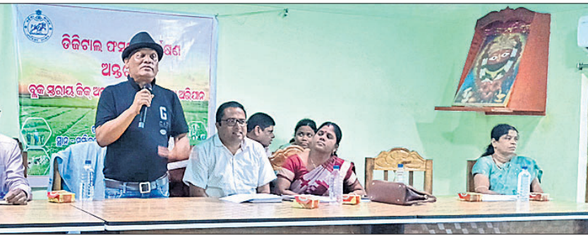
ବୈଠକରେ ଉପସ୍ଥିତ ଅଧିକାରୀମାନେ।