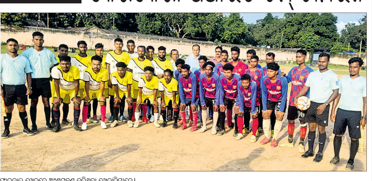
ପାଇନାଲ ଖେଳରେ ଅଂଶଗ୍ରହଣ କରିଥିବା ଖେଳାଳିମାନେ।