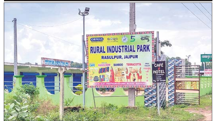
ଶାଢ଼ି, ଟେରାକୋଟା, ବାଉଁଶ ସାମଗ୍ରୀ ବିକ୍ରିରେ ସାମିତ କାରବାର

ମାତ୍ର ଏସବୁ ସାମଗ୍ରୀ ଗ୍ରାମୀଣ ଶିଳ୍ପ ଉଦ୍ୟାନରେ ସ୍ଥାନ ପାଇପାରୁନାହାଁ