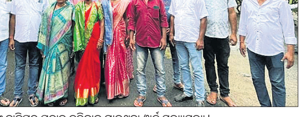
ଉପଜିଲ୍ଲାପାଳଙ୍କୁ ଦାବିପତ୍ର ପ୍ରଦାନ କରିବାକୁ ଯାଇଥିବା ଖାର୍ଡ ସଭ୍ୟାସଭ୍ୟା।

ଅନୁଗୋଳ ଜିଲ୍ଲା ଛେଡ଼ିପଦା ବ୍ଲକ୍ ଅନ୍ତର୍ଗତ ବାଲିପଦା ଗ୍ରାମ ପଞ୍ଚାୟତରେ ସୁନିତି ଅଭିଯୋଗ ଓ ସରପଞ୍ଚଙ୍କ ମନମୁଖ୍ୟ କାର୍ଯ୍ୟକୁ ନେଇ ପଞ୍ଚାୟତର ଖାର୍ଡ ସଭ୍ୟାସଭ୍ୟାମାନେ ଶନିବାର ଅନୁଗୋଳ ଉପଜିଲ୍ଲାପାଳଙ୍କ ପାଖରେ ଅନାସ୍ଥାପ୍ରସ୍ତାବ ଆଣିଛନ୍ତି। ଦୀର୍ଘଦିନ ହେଲା ସରପଞ୍ଚ ଖାର୍ଡ ସଭ୍ୟାସଭ୍ୟା ଓ ନାଏବ ସରପଞ୍ଚଙ୍କୁ ନ ଜଣାଇ ପଞ୍ଚାୟତର ସମସ୍ତ କାର୍ଯ୍ୟ ନିଜେ କରୁଥିବା ଅଭିଯୋଗ କରିଛନ୍ତି। ଗ୍ରାମରେ ଅନୁତ ସରୋବର ଯୋଜନାରେ ପୋଖରୀ ଖୋଳା କାର୍ଯ୍ୟ ପାଇଁ ୧୦ଲକ୍ଷ ଟଙ୍କା