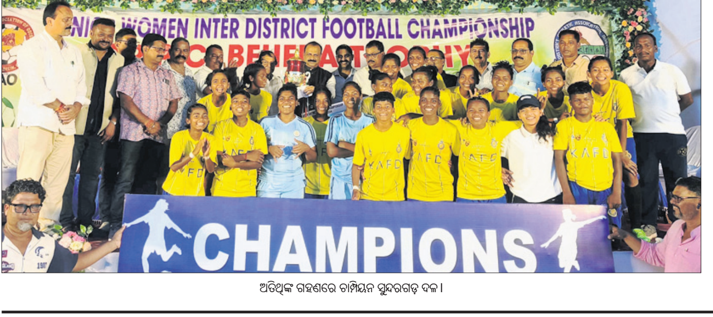
ଅତିଥି ଗହଣରେ ଚାମ୍ପିୟନ ସୁନ୍ଦରଗଡ଼ ଦଳ।