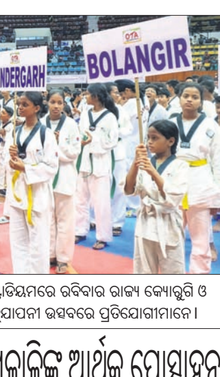
କଟକ ଜବାହରଲାଲ ନେହେରୁ ଇନ୍ଡୋର ସ୍ମୃତିୟମରେ ରବିବାର ରାଜ୍ୟ କୋର୍ଟ୍ସ୍ ଓ ପୁରସ୍କାର ଚାଷକୋଷ୍ଠା ଚାମ୍ପିୟନଶିପ୍ରେ ଉଦ୍‌ଯାପନା ଉତ୍ସବରେ ପ୍ରତିଯୋଗୀମାନେ।