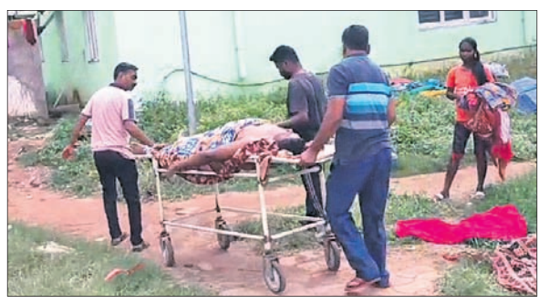
ସମ୍ପର୍କୀୟ କ୍ଷେତ୍ରରେ ମୃତଦେହ ନେଉଛନ୍ତି ।

ଜିଲ୍ଲା ପୁଖ୍ୟ ଚିକିତ୍ସାଳୟ ୫୦ରୁ ଉର୍ଦ୍ଧ୍ୱ ରୋଗୀ ଚିକିତ୍ସିତ