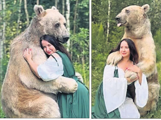
ଖାଇବାରେ ଲାଗିଛି। ତେବେ ଉକ୍ତ ଭାଲୁଟି କିଲିକି ଏଡେମାଗ୍ରାରେ ଶାନ୍ତ ଓ ଭଦ୍ର ସ୍ୱାଭାବର ହୋଇପାରିଛି ବୋଲି ଭିଡିଓ ଦେଖି ଏନେକ ଯୁକ୍ତ ସମ୍ପର୍କ କରିଛନ୍ତି।

ବଲିଉଡ଼ ଅଭିନେତା ରାଜକୁମାର ରାଓ ଶନିବାର ତାଙ୍କର ୪୦ ତମ ଜନ୍ମଦିନ ପାଳନ କରିଛନ୍ତି। ଏହି ଅବସରରେ ସେ ତାଙ୍କର ପରବର୍ତ୍ତୀ ଚଳଚ୍ଚିତ୍ର ନାମ 'ମାଲିକ' ହୋଇଥିବା ଘୋଷଣା କରି ନିଜ ପ୍ରଶଂସକଙ୍କୁ ଜନ୍ମଦିନ ଉପହାର ଦେଇଛନ୍ତି। ରାଜକୁମାର ନିଜ ଜନସ୍ୱାଗ୍ରାମ ଆଇଡିରେ 'ମାଲିକ' ଫିଲ୍ମର ପୋଷ୍ଟର ଶେୟାର କରିଛନ୍ତି। କ୍ୟାମ୍ପେନ୍ରେ ସେ ଲେଖିଛନ୍ତି, " ମାଲିକଙ୍କ ଦୁନିଆକୁ ଆପଣଙ୍କୁ ସାଗତ। ଶୁଟି ଆରମ୍ଭ ହୋଇ ସାରିଛି, ଖୁବ୍ଶୀଘ୍ର ଆପଣଙ୍କ ସହ ଭେଟ ହେବ"। ଫିଲ୍ମରେ ରାଜକୁମାରଙ୍କ ଆକ୍ରମ୍ ଅବତାର ଦେଖିବାକୁ ନିର୍ଦ୍ଦେଶ ଦେଇ ଅନୁମାନ କରାଯାଇଛି।