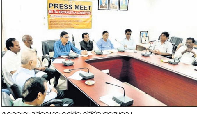
ଖବରଦାତା ସମ୍ମିଳନୀରେ ଉପସ୍ଥିତ କମିଟିର ସଦସ୍ୟବୃନ୍ଦ।

ବ୍ରହ୍ମପୁର, ୧୯ (ସ୍ମୃତି ରଞ୍ଜନ ମହାଲିକ) ଦକ୍ଷିଣ ଓଡ଼ିଶାର ଗଂଜାମ, ଗଜପତି, କନ୍ଧମାଳ ଓ ରାୟଗଡ଼ା ଜିଲ୍ଲାରେ ବହୁ ପ୍ରତିଷ୍ଠିତ ରେଲ ପ୍ରକଳ୍ପ ଦୀର୍ଘ ବର୍ଷ ଧରି ଅବହେଳାରେ ସମ୍ମୁଖୀନ ହେଉଛି।