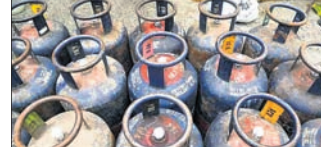
୧୬୪୪ ଟଙ୍କା ଏବଂ ୧୮୫୫ ଟଙ୍କାରେ କାରବାର ହେଉଥିଲା ବେଳେ ଉପରୋକ୍ତ ସହରଗୁଡ଼ିକରେ ଘରୋଇ ଗ୍ୟାସ୍ ଦର ଯଥାକ୍ରମେ ୮୨୯ ଟଙ୍କା, ୮୦୨.୫୦ ଟଙ୍କା ଏବଂ ୧୮୮.୫୦ ଟଙ୍କାରେ କାରବାର ହେଉଛି।

କ୍ରମାଗତ ଦ୍ୱିତୀୟ ମାସ ଲାଗି କମର୍ସିଆଲ ଗ୍ୟାସ୍ (୧୯କି.ଗ୍ରା.) ଦରରେ ବୃଦ୍ଧି ଘଟିଥିବାବେଳେ ଘରୋଇ ଗ୍ୟାସ୍ (୧୪.୨କି.ଗ୍ରା.) ଦର ପୂର୍ବପରି ସ୍ଥିର ରହିଛି।