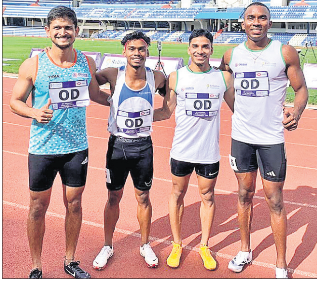
କାମେଶ୍ୱରୀ ଓପନ ଆଥଲେଟିକ୍ସ ଚାମ୍ପିୟନଶିପ୍ରେ ସର୍ବ ପଦକ ବିଜୟୀ ଓଡ଼ିଶା ପୁରୁଷ ଓ ଦ୍ରୋଣୀ ବିଜୟୀ ମହିଳା ଦଳ।