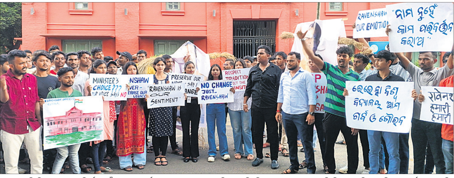
ରେଭେନ୍‌ଶା ବିଶ୍ୱବିଦ୍ୟାଳୟର ନାମ ପରିବର୍ତ୍ତନ ପାଇଁ କେନ୍ଦ୍ର ମନ୍ତ୍ରୀ ଧର୍ମେନ୍ଦ୍ର ପ୍ରଧାନ ଦେଇଥିବା ମତ୍ତବ୍ୟକୁ ବିରୋଧ କରି ରବିବାର ଛାତ୍ରାଭିଯାନକାରୀ ଦଳର ବିଶେଷ ପ୍ରଦର୍ଶନ କରାଯାଇଛି ।