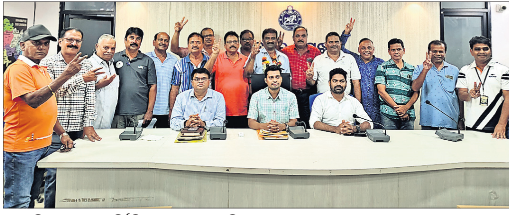
ଗଞ୍ଜାମ ଜିଲା କ୍ରୀଡ଼ା ସଂଘର ନିର୍ବାଚିତ ନେତୃବୃନ୍ଦ ଓ ପ୍ରଶାସନିକ ଅଧିକାରୀ।