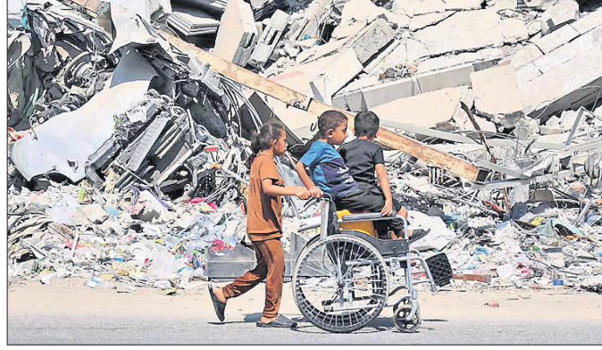
ପରେ ୪୦,୫୦୦ ଲୋକଙ୍କର ମୃତ୍ୟୁ ଘଟିଛି। ସେହିପରି ୧୯ ହଜାର ଶିଶୁ ଅନାଥ ହୋଇଛନ୍ତି କିମ୍ବା ସେମାନେ ନିଜର