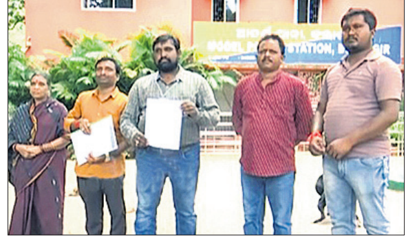
ମାଲକାନଗିରି ଜିଲାର ଜମାକାରୀମାନେ ବଲାଙ୍ଗୀର ଥାନା ଆଗରେ ଜମା ସମ୍ପର୍କିତ କାର୍ଯ୍ୟ ଦେଖାଇଛନ୍ତି।