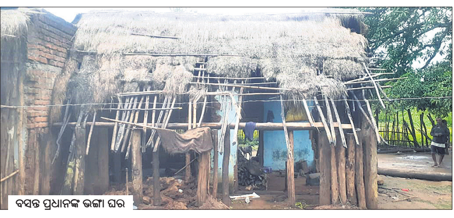
ବସନ୍ତ ପ୍ରଧାନଙ୍କ ଭଙ୍ଗା ଘର