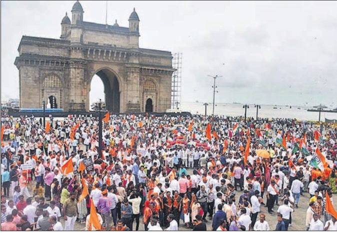
ପୁୟାରେ ଗେରୱେ ଅଫ୍ ଇଣ୍ଡିଆ ନିକଟରେ ଏମ୍.ଜି.ଏ ମେଣ୍ଟର ବିରୋଧ।