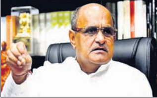
ତ୍ୟାଗୀ ବାରମ୍ବାର କେନ୍ଦ୍ର ସରକାରଙ୍କ ନୀତିକୁ ସମାଲୋଚନା କରୁଥିଲେ।

ସଂଯୁକ୍ତ ଜନତା ଦଳ (କେଡିୟୁ) ମୁଖପାତ୍ର ପଦକୁ କେ.ସି. ତ୍ୟାଗୀ ଇସ୍ତଫା ଦେଇଛନ୍ତି। ଦଳ ଅଧ୍ୟକ୍ଷ ନୀତୀଶ କୁମାର ତାଙ୍କ ସ୍ଥାନରେ ରାଜୀବ ରଞ୍ଜନ ପ୍ରସାଦଙ୍କୁ ଜାତୀୟ ମୁଖପାତ୍ର ନିଯୁକ୍ତ କରିଛନ୍ତି। ତ୍ୟାଗୀ ବ୍ୟକ୍ତିଗତ କାରଣରୁ ଇସ୍ତଫା ଦେଇଥିବା ଦଳ ପକ୍ଷରୁ କୁହାଯାଇଛି।