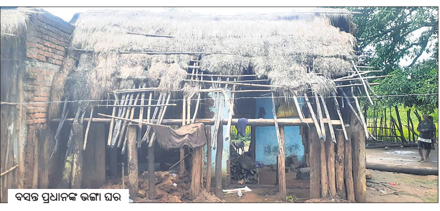
ବସନ୍ତ ପ୍ରଧାନଙ୍କ ଭଙ୍ଗା ଘର