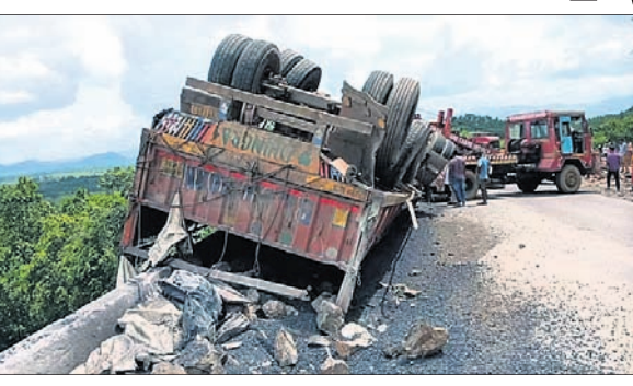
ରାସ୍ତାରେ ଓଲଟି ପଡ଼ିଥିବା ଆଇରନ ବୋହେଇ ଟ୍ରକ୍ ।

ବାଙ୍କିଚିପୋଷି, ୧୮ (ସଞ୍ଜୟ କୁମାର ଅଗ୍ରୱାଲ) ମୟୂରଭଞ୍ଜ ଜିଲ୍ଲା ବାଙ୍କିଚିପୋଷି ଦେଇ ଯାଇଥିବା ୪୯ ନମ୍ବର ଜାତୀୟ ରାଜପଥର ଦ୍ୱାରଶୁଣୀ ଘାଟି ରାସ୍ତାରେ ରବିବାର ଏକ ଆଇରନ ବୋହେଇ ଟ୍ରକ୍ ଓଲଟି ପଡ଼ିଛି । ଦୁର୍ଘଟଣାରେ ଚାଳକଙ୍କ ମୃତ୍ୟୁ ଘଟିଥିବା ବେଳେ ହେଲ୍‌ପର ଗୁରୁତର ହୋଇଥିବା ଜଣାପଡ଼ିଛି । ଉଭୟଙ୍କ ପରିଚୟ ମିଳିପାରିନାହିଁ । ସୂଚନା ଅନୁଯାୟୀ, ଆଇରନ୍ ବୋହେଇ ଟ୍ରକ୍ (ନଂ-୧୨ ଏଚି ୧୪୯୩୯୧) ବାଙ୍କିଚିପୋଷି ଆସିଲାବେଳେ ଯାଉଥିଲା । ଦ୍ୱାରଶୁଣୀ ଘାଟି ରାସ୍ତାରେ ଭାରସାମ୍ୟ ହରାଇ ରାସ୍ତାକଡ଼ରେ ଥିବା ସୁରକ୍ଷା