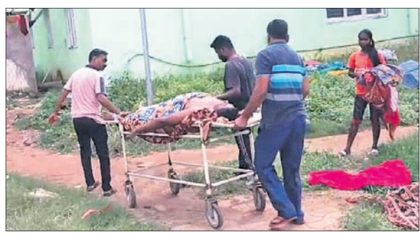
ସମ୍ପର୍କୀୟ କ୍ଷେତ୍ରରେ ମୃତଦେହ ନେଉଛନ୍ତି ।

ରଖି ଚିକିତ୍ସା ଆରମ୍ଭ କରାଯାଇଥିଲା । ଶରୀରର ତାପ ଡେଇଁ ଖାତୁକି ନିଆଯାଇଥିଲା । ବିକଳ ରାତିରେ ଡାକ୍ତର ଚିକିତ୍ସା ଆରମ୍ଭ କରିଥିଲେ । ରବିବାର ସ୍ୱାସ୍ଥ୍ୟାବସ୍ଥା ଦୂର୍ବଳ ହେବାରୁ ଡାକ୍ତର କଟକ ଗ୍ଲାମାନ୍ତର କରାଯାଇଥିଲା । ମାତ୍ର ଆହୁଲ୍ୟାପୁରେ ନେବା ବେଳେ ଡାକ୍ତର ମୃତ୍ୟୁ ଘଟିଥିବା ସନ୍ଦେହ ହେବାରୁ ପ୍ରାୟତଃ ଡାକ୍ତରଙ୍କୁ ଯାଞ୍ଚ କରିବାକୁ କହିଥିଲେ । ଯାଞ୍ଚରେ ମୃତ ବୋଲି ଜଣାପଡ଼ିଥିଲା । ତେବେ ରୋଗୀଙ୍କ ଅବସ୍ଥା ସକଳପଦ ଥିଲେ ହେଁ ଆଇସିୟୁ ବ୍ୟବସ୍ଥା କରାଯାଇ ନ ଥିବା ସମ୍ପର୍କରେ ଅଭିଯୋଗ କରିଛନ୍ତି । ଏପରିକି ଡେଇଁ ଆକ୍ରାନ୍ତ ଥିଲେ ହେଁ ଜେନରାଲ ଖର୍ଚ୍ଚରେ ରଖାଯାଇଥିଲା । ପୁଖ୍ୟମନ୍ତ୍ରୀ