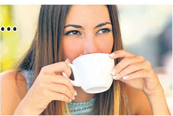
ପାଇଥିଲେ। କେବଳ ସେତିକି ନୁହେଁ, ଏଥିଯୋଗୁଁ ଯେତେ ଅଳ୍ପ ବା ଏସିତିକି ବଢ଼ିଯାଇଥାଏ। ଅନ୍ୟପକ୍ଷରେ ଆବଶ୍ୟକତାଠାରୁ ଅଧିକ ଥର ଚା' ପିଇଲେ ତାହା ନିଦ୍ରାରେ ବ୍ୟାଘାତ ସୃଷ୍ଟି କରିବାର ଆଶଙ୍କା ରହିଛି ବୋଲି ବିଶେଷଜ୍ଞମାନେ ସତର୍କ କରାଇ ଦେଇଛନ୍ତି।

କ୍ଳାନ୍ତ ମନକୁ ହାଲୁକା କରିବା ପାଇଁ ଅନେକେ ଚା' କିମ୍ବା କଫି ପିଇଥାଆନ୍ତି। ହେଲେ ଯଦି ଆପଣ ଅଧିକ ସମୟ ଚା' ପିଇଛନ୍ତି ତେବେ ଏପରି ଅଭ୍ୟାସଠାରୁ ନିଜକୁ ଯଥାସମ୍ଭବ ଦୂରରେ ରଖନ୍ତୁ। ଏଭଳି ମତବ୍ୟକ୍ତ କରିଛନ୍ତି ଖଣିଷ୍ଟନୀ ମୁନିରାଜିଙ୍କ ବିଶେଷଜ୍ଞମାନେ। ଏକ ସନ୍ଧ୍ୟାରେ ସର୍ବୋତ୍ତମ ସେମାନେ ଜାଣିପାରିଛନ୍ତି ଯେ ଆବଶ୍ୟକତାଠାରୁ ଅଧିକ ଥର ଏବଂ ପରିମାଣର ଚା' ପିଇଲେ ତାହାର ଖରାପ ପ୍ରଭାବ ଶରୀର ଉପରେ ପଡ଼ିଥାଏ। ଏହି ସର୍ବୋତ୍ତମ ଉଚ୍ଚ ମୁନିରାଜିଙ୍କ ବିଶେଷଜ୍ଞମାନେ ଜାଣିପାରିଛନ୍ତି ଯେ, ଏଭଳି ଅଭ୍ୟାସ ଦ୍ୱାରା ରୁକ୍ଷିମତା ପ୍ରଭାବିତ ହେବାର ଆଶଙ୍କା ରହିଛି। କାରଣ ସର୍ବୋତ୍ତମ ପରିସରଭୁକ୍ତ ବ୍ୟକ୍ତିମାନଙ୍କର ରୁକ୍ଷିମତାକୁ ତଳ ତଳ କରି ତର୍କମା କରିବା ପରେ ସେମାନେ ଏଭଳି ବିଷୟରେ ଜାଣିବାକୁ ପାଇଥିଲେ। କେବଳ ସେତିକି ନୁହେଁ, ଏଥିଯୋଗୁଁ ଯେତେ ଅଳ୍ପ ବା ଏସିତିକି ବଢ଼ିଯାଇଥାଏ। ଅନ୍ୟପକ୍ଷରେ ଆବଶ୍ୟକତାଠାରୁ ଅଧିକ ଥର ଚା' ପିଇଲେ ତାହା ନିଦ୍ରାରେ ବ୍ୟାଘାତ ସୃଷ୍ଟି କରିବାର ଆଶଙ୍କା ରହିଛି ବୋଲି ବିଶେଷଜ୍ଞମାନେ ସତର୍କ କରାଇ ଦେଇଛନ୍ତି।