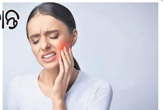
ଦାନ୍ତ ବିକ୍ଷା ଓ ସେଲ୍ ଶୀର୍ଷକ ବିଷୟବସ୍ତୁକୁ ନେଇ ସେମାନେ ଗବେଷଣା କରିବା ସମୟରେ ଏପରି କଥା ଜାଣିପାରିଥିଲେ। ଏହି ସମୟରେ ସେମାନେ କୋଷ(ସେଲ୍)ଗୁଡ଼ିକୁ ତଳ ତଳ କରି ପରୀକ୍ଷା କରି ଏପରି ତଥ୍ୟ ବିଷୟରେ ଅଧିକ ସୂଚନା ପାଇଥିଲେ।

ସାଧାରଣତଃ ଥଣ୍ଡା ପ୍ରକୋପରେ କିମ୍ବା ଦାନ୍ତ ମୂଳରେ ଇନ୍ଫେକ୍ସନ୍ ହେଲେ ଦାନ୍ତମୂଳ ବିକ୍ଷିପାଏ। ତେବେ ଏହାର କାରଣ ତାଲିକାରେ ନିକଟରେ ଆଉ ଏକ କଥା ଯୋଡ଼ାଯାଇଛି। ଏକ ଗବେଷଣାକୁ ଜଣାପଡ଼ିଛି ଯେ, ଦାନ୍ତ ବିକ୍ଷାର କୋଷ ବା ସେଲ୍ ସହ ସମ୍ପର୍କ ରହିଛି। ଏଭଳି ବିଷୟରେ କାଲିଫର୍ନିଆ ବିଶ୍ୱବିଦ୍ୟାଳୟର ବିଶେଷଜ୍ଞମାନେ ଗବେଷଣା କରି ନୂଆ ତଥ୍ୟ ପ୍ରକାଶ କରିଛନ୍ତି। ଉକ୍ତ କୋଷର ନାମ ହେଲା 'ଆମେଲୋବ୍ଲାଷ୍ଟ'। ଏହା ଭିତରେ ଥିବା ପ୍ରୋଟୋଷ୍ଟିଲିଭେନ୍ ଏବଂ ଡୁ ବେରିକ ନାମକ ତତ୍ତ୍ୱ ବଢ଼ିଗଲେ ଥଣ୍ଡା ଯୋଗୁଁ ଦାନ୍ତମୂଳ ବିକ୍ଷିପାଏ ବୋଲି ପ୍ରକାଶିତ ରିପୋର୍ଟରେ ଉଲ୍ଲେଖ କରାଯାଇଛି। ବେଳେବେଳେ ଏହା ଯୋଗୁଁ ଦାନ୍ତର ଏନାମେଲ୍ ଖରାପ ହୋଇ, ଦାନ୍ତ ନଷ୍ଟ ହେବାର ଆଶଙ୍କା ରହିଛି। 'ଥଣ୍ଡାକୁ