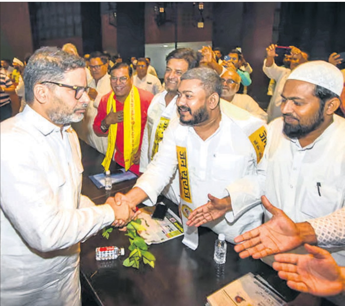
ବିହାର ରାଜଧାନୀ ପାଟଣାଠାରେ ଜନ ସୁରକ୍ଷା ମୁଖ୍ୟ ପ୍ରଶାନ୍ତ କିଶୋର ଏକ ଦକାୟ ବୈଠକରେ ମୁଖ୍ୟମନ୍ତ୍ରୀଙ୍କୁ ଭେଟୁଛନ୍ତି।

ଯେ, ପ୍ରତ୍ୟେକ ୬ ବର୍ଷରେ ଦଳର ସଦସ୍ୟତା ଅଭିଯାନ କରାଯାଇଥାଏ। ଏଥିସହ ପ୍ରତ୍ୟେକ ୩ ବର୍ଷରେ ଦଳର ସାଙ୍ଗଠନିକ ନିର୍ବାଚନ ହୋଇଥାଏ। ୫ଟି ପ୍ରସ୍ତରରେ ଦଳର ସାଙ୍ଗଠନିକ ନିର୍ବାଚନ କରାଯାଏ। ବୁଦ୍ଧ, ମଣ୍ଡଳ, ଜିଲା, ରାଜ୍ୟ ଏବଂ କେନ୍ଦ୍ରୀୟ ପ୍ରସ୍ତରରେ ସାଙ୍ଗଠନିକ ନିର୍ବାଚନ ହୋଇଥାଏ। ଦଳର ରାଷ୍ଟ୍ରୀୟ ଅଧ୍ୟକ୍ଷ ପଦଠାରୁ ଆରମ୍ଭ କରି ରାଜ୍ୟ ସଭାପତିଙ୍କ ପର୍ଯ୍ୟନ୍ତ ନିର୍ବାଚନ କରାଯାଏ।