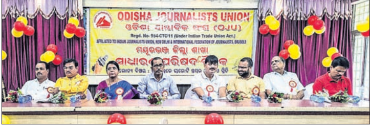
ସମ୍ମିଳନୀରେ ଉପସ୍ଥିତ ଅତିଥିମାନେ।

ବାରପଦା, ୧୯ (ନାଳାପ୍ରି ବିହାରୀ ବଡ଼ପାଟ) ଗଣତନ୍ତ୍ରରେ ମୁଖ୍ୟ ଗତି ପ୍ରାୟ ବ୍ୟବସ୍ଥାପିତା, କାର୍ଯ୍ୟପାଳିକା ଏବଂ ନ୍ୟାୟପାଳିକାର ଠିକ୍ ପରିଚାଳନା ପାଇଁ ଚତୁର୍ଥ ପ୍ରାୟ ଗଣମାଧ୍ୟମର ଗୁରୁତ୍ୱପୂର୍ଣ୍ଣ ଭୂମିକା ରହିଛି।