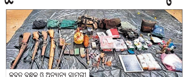
ଜବତ ବସ୍ତୁ ଓ ଅନ୍ୟାନ୍ୟ ସାମଗ୍ରୀ

ମାଲକାନଗିରି, ୧୯ (ସୂର୍ଯ୍ୟୋଧନ ପାତ୍ର) ଛତ୍ରଗଡ଼ ବସ୍ତର ଜିଲ୍ଲାରେ ପୋଲିସ ଓ ମାଓବାଦୀଙ୍କ ମଧ୍ୟରେ ଉତ୍ତରାଧିକାରୀ ଦିନମଧ୍ୟ ଘଟିଥିଲା। ସୁରକ୍ଷା କର୍ମୀଙ୍କ ଗୁଳିରେ ୩ ମହିଳା ମାଓବାଦୀଙ୍କ ମୃତ୍ୟୁ ଘଟିଥିବାବେଳେ ଘଟଣାସ୍ଥଳକୁ ଅସୁଖସ୍ୱ ଓ ଅନ୍ୟାନ୍ୟ ସାମଗ୍ରୀ ଜବତ ହୋଇଛି। ମୃତକମାନେ ହେଲେ ଯିଏକ୍ଲିଏ କମ୍ପାନୀ ନ.୫, ୫, ଉତ୍ତର ମାଲକାନଗିରିର ସଦସ୍ୟା ତଥା ମାଲକାନଗିରି ଜିଲ୍ଲା ନିବାସୀ ଜଣାଣ। ତାଙ୍କ ଉପରେ ୮ ଲକ୍ଷ ଟଙ୍କାର ପୁରସ୍କାର ଘୋଷଣା କରାଯାଇଥିଲା। ସେହିପରି ପଞ୍ଜାପୁର ସିପିଆ କମିଟି ସଦସ୍ୟା ସବିତାଙ୍କ ଉପରେ ୫ ଲକ୍ଷ ଟଙ୍କାର ପୁରସ୍କାର ଘୋଷଣା କରାଯାଇଥିଲା। ଅନ୍ୟଜଣେ ବିଜାପୁର ଜିଲ୍ଲା ନିବାସୀ