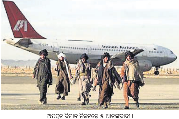
ଅପହୃତ ବିମାନ ନିକଟରେ ୫ ଆତଙ୍କବାଦୀ।