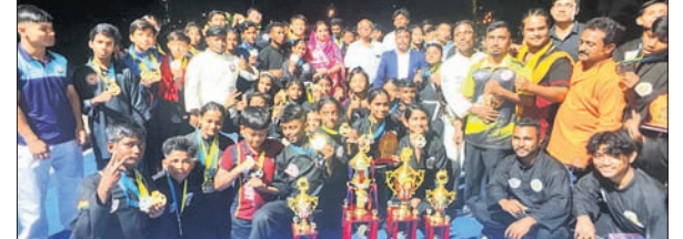
କୃତୀ ପ୍ରତିଯୋଗୀମାନେ ଟ୍ରଫି ସହ ଅତିଥିକ ଗହଣରେ।