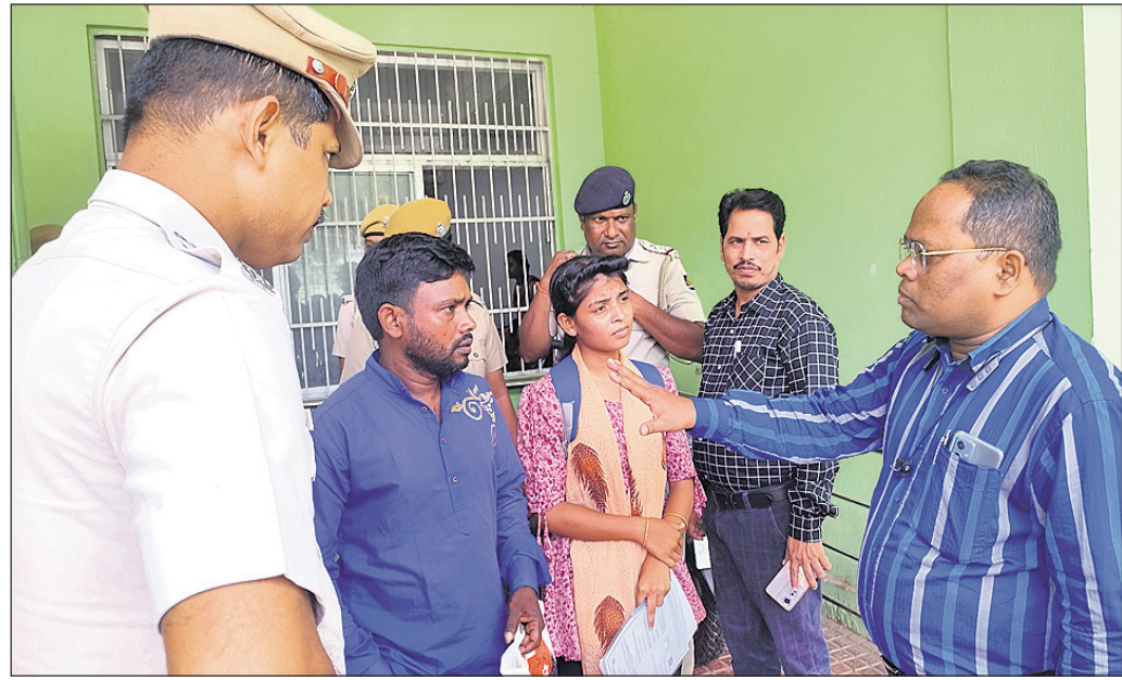
ଜିଲାପାଳଙ୍କ କାର୍ଯ୍ୟାଳୟ ସମ୍ମୁଖରେ ବୁଲୁ ଅନଶନରତ ହିତାଧିକାରୀଙ୍କୁ ଆଇଆଇସି ଓ ଜିଲା ଶ୍ରମ ଅଧିକାରୀ ବୁଝାଶୁଣା କରୁଛନ୍ତି।