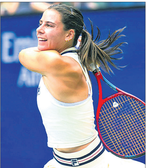
ଚିଚିରି ଶର୍ ଖେଳିବା ଅବସରରେ ଏମ୍ମା ନାଭାରୋ।

କ୍ଲ୍ୟୁଭର୍, ୨୯ (ପି.ଟି.) ବର୍ଷର ଅନ୍ତିମ ଚେମ୍ପିୟନ୍ ଗ୍ରାଣ୍ଡସ୍ଲାମ ଯୁଦ୍ଧ ଓପନର ପୁରୁଷ ସିଙ୍ଗଲ୍ କ୍ୱାର୍ଟର ଫାଇନାଲରେ ପ୍ରବେଶ କରିଛନ୍ତି ଆଲେକ୍ସାନ୍ଦ୍ରା ପାବଲୋଭିଚା ଓ ପ୍ରାନ୍ସିସ ଚିଆପୋ। ସେହିପରି ମହିଳା ସିଙ୍ଗଲ୍ କ୍ୱାର୍ଟର ଫାଇନାଲରେ ପ୍ରବେଶ କରିଛନ୍ତି କ୍ଲେମେନ୍ଟିନ ପୋକ୍ ଓ ଆରିନା ସାବାଲେଙ୍କା ଓ ଏମ୍ମା ନାଭାରୋ।