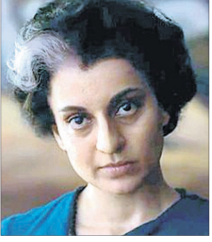
ଏମକେସିରେ କମ୍ପାନୀ ରଖାଯିବ। କହିଲେ, 'ଏମକେସି ସେକ୍ସୁଆଲ୍ ବୋର୍ଡ୍ ଅଫ୍ ଫିଲ୍ଡ୍ ସାର୍ଟିଫିକେଶନ୍ (ସିଏଏସିଏ) ପ୍ରମାଣପତ୍ର ପାଇବା ପାଇଁ ସଂଗ୍ରାମ କରୁଛି। ପ୍ରକାଶ ଯେ, ପୂର୍ବତନ ପ୍ରଧାନମନ୍ତ୍ରୀ ଇନ୍ଦିରା ଗାନ୍ଧୀ ୧୯୭୫ରେ ଜାରି କରିଥିବା ୨୧ ମାସିଆ ଜରୁରିକାଳୀନ ପରିସ୍ଥିତି ଉପରେ ଆଧାରିତ 'ଏମକେସି'ର ପ୍ରକ୍ରିୟାକୁ ଏକାଧିକ ଥର ପୁଞ୍ଜାଳ ଦିଆଯାଇଛି।