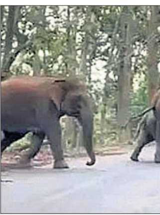
କେନ୍ଦୁଝର, ୨୧ (ଦୀପକ ମିଶ୍ର)

କେନ୍ଦୁଝର ଜିଲାରେ ହାତୀ ଉପଦ୍ରବ ବଢ଼ିଯାଇଛି। ସନ୍ଧ୍ୟା ହେଲେ ହାତୀ ଗାଁରେ ପଶି ଘର ଭାଙ୍ଗିବା ସହ ଚାଷ ନଷ୍ଟ କରୁଛନ୍ତି। ଏଥିସହ ହାତୀଙ୍କ ପାଇଁ ହେଉଥିବା ବିଦ୍ୟୁତ୍ କାଟ ଯୋଗୁ ଜନ ସମ୍ପତ୍ତି ଲୋକେ ଅଧାରରେ କଳବଳ ହେଉଥିବା ଅଭିଯୋଗ କରିଛନ୍ତି। ସୂଚନା ଅନୁଯାୟୀ, କେନ୍ଦୁଝର ଜିଲା ସଦର ବନାଞ୍ଚଳ ଅନ୍ତର୍ଗତ ବେଲଦା ବିଂ ମଇଦାନକେଲ ସଂରକ୍ଷିତ ଜଙ୍ଗଲରେ ୯ ଚିକିଆ ହାତୀପଲ ଉପାତ ଭାରି ରଖୁଛନ୍ତି। ସନ୍ଧ୍ୟା ହେଲେ ହାତୀ ଚାଷ ଜମି