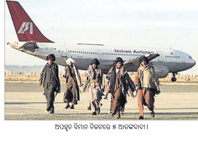
ଅପହରଣ ବିମାନ ନିକଟରେ ୫ ଆତଙ୍କବାଦୀ।

୧୯୯୯ ଡିସେମ୍ବର ୨୫ରେ ଉଡ୍ଡିଆନ୍ ଏୟାରଲାଇନ୍‌ର ଏକ ବିମାନକୁ ଆଫଗାନିସ୍ତାନର କାନ୍ଦାହାରରେ ହାଇଜାକ୍ କରାଯାଇଥିଲା। ଏହି ବହୁଚର୍ଚ୍ଚିତ ଘଟଣା ଉପରେ ନିର୍ଦ୍ଦେଶିତ ଅନୁଭବ ସିଦ୍ଧା ଏକ ଫ୍ରେନ୍ଦ୍‌ସିପ୍ ନିର୍ମାଣ କରିଛନ୍ତି। ଓଡିଟି ପ୍ଲାଟଫର୍ମ ନେଟ୍‌ୱାର୍କରେ ପ୍ରସାରିତ 'ଆଇସି ୧୪: ଦି କାନ୍ଦାହାର ହାଇଜାକ୍'ରେ ଅପହରଣକାରୀମାନଙ୍କ ନାମ ଚିତ୍ତ, ଡକ୍ଟର, ବର୍ତ୍ତର, ଭୋଲା ଓ ଶଙ୍କର ରଖାଯାଇଛି। ତେବେ ହିନ୍ଦୁ ଦେବତାଙ୍କ ନାମାନ୍ୱୟରେ ପୂର୍ଣ୍ଣା ଆତଙ୍କବାଦୀଙ୍କ ନାମକରଣକୁ ନେଇ ଭାରତରେ ବିବାଦ ସୃଷ୍ଟି ହୋଇଛି। କେନ୍ଦ୍ର ସରକାର ସୋମବାବ ନେଟ୍‌ୱାର୍କର ଉଡ୍ଡିଆନ୍ ହେଡ୍ ମୋନିଟାରିଂ ଗୋର୍ଡ୍‌କୁ ଏନେଇ ସମାନ କରିଛନ୍ତି।