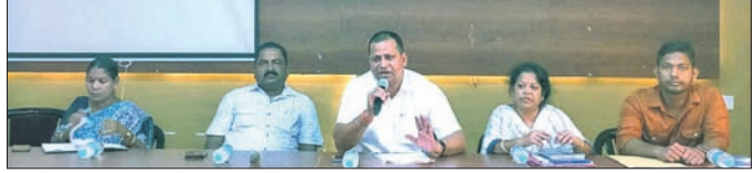
ସଚେତନତା ଶିବିରରେ ଉପସ୍ଥିତ ଅଧିକାରୀ ଓ ଅନ୍ୟମାନେ।

ରାଜବାଲି, ୨୯ (କିଷାନ ପାତ୍ର) ମୋ ସେବା କେନ୍ଦ୍ରର ପ୍ରତିନିଧିମାନଙ୍କୁ ଚାନ୍ଦବାଲି ବ୍ଲକ୍ ସଭାଗୃହରେ ବିତିତ ଚଳୁଥିବା ‘ସୁଭଦ୍ରା’ କର୍ମଶାଳାରେ ଅଭିଭାବକ ଓ ଅଭିଭାବିକାଙ୍କୁ ସଚେତନ କରିବା ପାଇଁ ଏକ କର୍ମଶାଳା ଆୟୋଜନ କରାଯାଇଛି। ସୋମବାର (୨୮) ଏ ନେଇ ନାଳଗିରି ଆନାରେ ସୋମବାର ଏକ ଅପମୃତ୍ୟୁ ମାମଲା (ନଂ. ୨୮୩/୨୪) ଚଳୁ ହୋଇ ମୃତଦେହ ବ୍ୟବସ୍ଥା କରାଯାଇଛି। ଏହି ରାଜପଥରେ ପଞ୍ଚମୁଖୀ ହରୁମାନ ମନ୍ଦିର ନିକଟରେ ଗଣେଶ ପୂଜା ପାଇଁ ଟ୍ରକ୍ ଓ କ୍ୟାମ୍ପୁସ୍ ଚାନ୍ଦା ଆଦାୟ ହେଉଥିଲା। ଏହି ସମୟରେ ଏକ ଅକ୍ଷୟ କ୍ୟାମ୍ପୁସ୍ କିଶୋରଙ୍କୁ ଧକ୍କା ଦେଇ ତମ୍ପର ମାରିଥିଲା। ଦୁର୍ଘଟଣାରେ ଆହତ କିଶୋରଙ୍କୁ ଗୁମାସ୍ତା ଲୋକେ ଉଦ୍ଧାର କରି ନାଳଗିରି ଉପଖଣ୍ଡ ଚିକିତ୍ସାଳୟକୁ ନେଇଥିଲେ। ସେଠାରେ ତାଙ୍କୁ ଡାକ୍ତରୀ ଦେବାକୁ ମୃତ ଘୋଷଣା କରିଥିଲେ। ଗୁମାସ୍ତା ଅଞ୍ଚଳର ସିଏଚ୍‌ଇ ଚିତ୍ତରାଜ ପୂର୍ବକ ନାଳଗିରି ପୋଲିସ୍ ପକ୍ଷରୁ ଚକ୍ର କାଟି କରାଯାଇଛି।