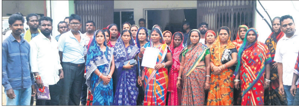
ତହସିଲ କାର୍ଯ୍ୟାଳୟ ଆଗରେ ତାଳପଦା ପଞ୍ଚାୟତରାସ୍ତା ଲୋକେ।

ସରକାରୀ ରାସ୍ତାକୁ ଅବରୋଧ କରି କୋଠାଘର ତିଆରି କରିଛନ୍ତି ଜଣେ ପ୍ରଧାନ ଶିକ୍ଷକ। ଏଥିଯୋଗୁ ୩ ପଞ୍ଚାୟତର ଅଧିକାରୀଙ୍କ ସହ ସ୍କୁଲ ଛାତ୍ରାଛାତ୍ରୀ ଦୁର୍ଦ୍ଦଶା ଭୋଗୁଛନ୍ତି। ହାଇକୋର୍ଟଙ୍କ ନିର୍ଦ୍ଦେଶ ପରେ ବି ଜବରଦସ୍ତୀ ଭଲ୍ଲେଦ ଦିଗରେ ପଦକ୍ଷେପ ନିଆଯାଇ ନ ଥିବାରୁ ତିନିଜଣ ତହସିଲ ଅଧୀନ ତାଳପଦା ପଞ୍ଚାୟତରାସ୍ତା ତାତିଲେ। ସେମାନେ ସୋମବାର ପଞ୍ଚାୟତରାସ୍ତା ଯୋଗାଯୋଗ ବନ୍ଦ କରିଛନ୍ତି। ସେମାନେ ସୋମବାର ପଞ୍ଚାୟତରାସ୍ତା ଯୋଗାଯୋଗ ବନ୍ଦ କରିଛନ୍ତି। ସେମାନେ ସୋମବାର ପଞ୍ଚାୟତରାସ୍ତା ଯୋଗାଯୋଗ ବନ୍ଦ କରିଛନ୍ତି।