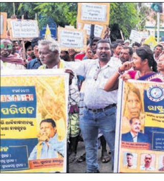
ଜିଲାପାଳଙ୍କ କାର୍ଯ୍ୟାଳୟ ଆଗରେ ଆଦିବାସୀ ସଂଗଠନ ବିକ୍ଷୋଭ କରୁଛନ୍ତି।

ରାଷ୍ଟ୍ରୀୟ ଆଦିବାସୀ ଏକତା ପରିଷଦ ପକ୍ଷରୁ ଜଙ୍ଗଲ ସଂରକ୍ଷଣ ସଂଗୋଧନ ଅଧିନିୟମ-୨୦୨୩କୁ ବିରୋଧ କରି ଦେଶର ୩୧ଟି ରାଜ୍ୟର ୫୭୦ଟି ଜିଲାରେ ଏକକାଳୀନ ଅଗଷ୍ଟ ୨ରୁ ଆନ୍ଦୋଳନ ଆରମ୍ଭ ହୋଇଛି। ଏହି ଅବସରରେ ସାମାଜିକ କେନ୍ଦୁଝର ଜିଲ୍ଲାପ୍ରସ୍ତରେ ସହରର ଧୋବାଡ଼ିଆଠାରୁ ଶତାଧିକ ଆଦିବାସୀ