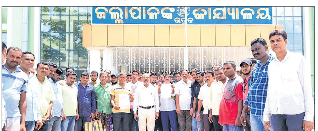
ଜିଲ୍ଲାପାଳଙ୍କ କାର୍ଯ୍ୟାଳୟ ସମ୍ମୁଖରେ ଉଠାଦୋକାନୀ ମହାସଂଘ ସଭ୍ୟମାନେ।

ଭଦ୍ରକ ସହର ରାସ୍ତାପାର୍ଶ୍ୱରେ ଉଠା ଦୋକାନୀମାନେ ବ୍ୟବସାୟ କରି ପରିବାର ପ୍ରତିପୋଷଣା କରୁଥିଲେ। ବର୍ଷାଋତୁରେ ଦୋକାନ ଉଲ୍ଲେଦ କରାଯିବାରୁ ସେମାନେ ଜୀବିକା ହରାଇଲେ। ଏବେ ସେମାନଙ୍କ ପରିବାର ଭୋକ ଉପାସରେ ଦିନ କାଟୁଛନ୍ତି। ସେମାନଙ୍କୁ ଅଭିଯୋଗ କରାଯିବା ସହ ଆର୍ଥିକ ସାହାଯ୍ୟ ଯୋଗାଇ ଦେବାକୁ ଦାବି କରାଯାଇଛି। ଏନେଇ ଭଦ୍ରକର