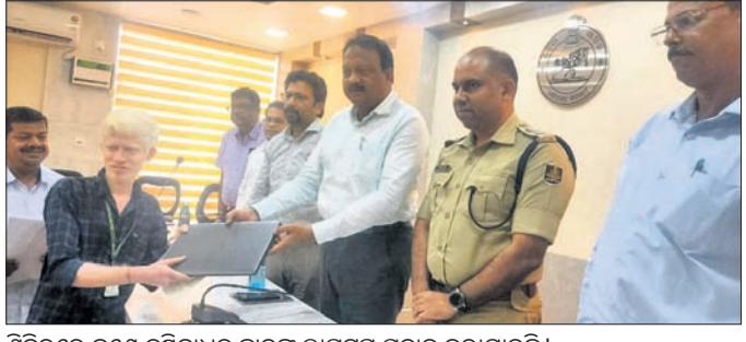
ଶିବିରରେ ଜଣେ ଦୃଷ୍ଟିବାଧିତ ଛାତ୍ରଙ୍କୁ ଲାପ୍‌ଟପ୍ ପ୍ରଦାନ କରାଯାଇଛି।

ଭଦ୍ରକ ଜିଲ୍ଲାପାଳଙ୍କ କାର୍ଯ୍ୟାଳୟର ସର୍ବଭାବନା ସଭାଗୃହରେ ଜିଲ୍ଲାପାଳ ଓ ଏସ୍‌ପିଙ୍କ ମିଳିତ ଜନଶୁଣାଣି ଶିବିର ସୋମବାର ଅନୁଷ୍ଠିତ ହୋଇଯାଇଛି। ଜିଲ୍ଲାପାଳ ଦିଲ୍ଲୀପ କୁମାର ରାଉତରାଏ ଓ ଏସ୍‌ପି ବରୁଣ ରୁଷ୍ଟିପାଲି ଶିବିରରେ ଯୋଗଦେଇ ମୋଟ ୧୭୭ଟି ଅଭିଯୋଗ ଶୁଣିଥିଲେ। ସେଥିମଧ୍ୟରେ ୧୩୮ଟି