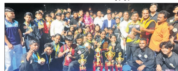
ଝାରସୁଗୁଡ଼ା ପ୍ରତିଯୋଗୀମାନେ ଗ୍ରୀଟ୍ ସହ ଅତିଥିକ ଗଣସଭାରେ ।