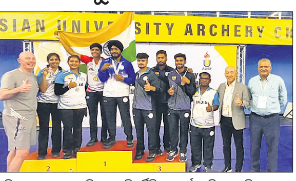
ଇଣ୍ଡିଆନ୍ ଯୁନିଭର୍ସିଟିଜ୍ ଆର୍ଚେରୀ ଚିମ୍ବର ପ୍ରତିଯୋଗିତା

ଇଣ୍ଡିଆନ୍ ଯୁନିଭର୍ସିଟିଜ୍ ଆର୍ଚେରୀ ଚିମ୍ବର ସଫଳତା ଗୋଲ୍ଡେନ୍ ଲଗ୍ ଲୋଡ଼ିଣ୍ଡା ପ୍ରତିଯୋଗିତାରେ ପ୍ରତିଯୋଗିତାରେ ଶ୍ରେଣୀ କ୍ରମେ ୨୮ ନମ୍ବର ସିଡ୍ ଆଲୋକ ପ୍ରଦାନ କରୁଥିବା ବେଳେ ଏହା ଗଲ୍ ପାଲି କଳ୍ପସାଧା ଥିବା କହିଛନ୍ତି ଚିଆପୋ।