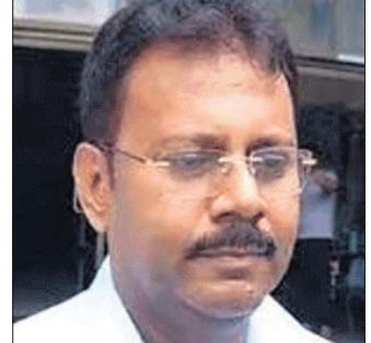
କୋଲକାତା, ୨୯ (ପି.ଟି.)