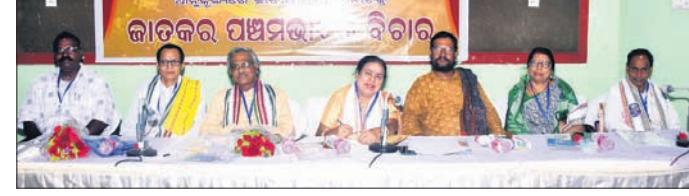
ଆଲୋଚନାଚକ୍ରରେ ଯୋଗଦେଇଥିବା ଅତିଥିବୃନ୍ଦ।

ଧୂବକୋଟି ଗବେଷଣା ପ୍ରତିଷ୍ଠାନ ଆନୁକୂଲ୍ୟରେ ଯୋଗବାର ଯୁକ୍ତ ହସ୍ତେଇ ପରିସରରେ ‘ଜାତକରେ ପଞ୍ଚମ ଭାବର ବିଚାର’ ଶୀର୍ଷକ ଜାତୀୟ ଆଲୋଚନାଚକ୍ର ଅନୁଷ୍ଠିତ ହୋଇଯାଇଛି।