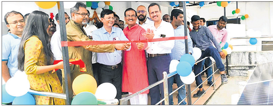
ସୌରଶକ୍ତୀକରଣ ଯାତ୍ରାର ଶୁଭାରମ୍ଭ କରାଯାଇଛି।

ବାଲେଶ୍ୱର, ୨୧ (ବାସ୍ତାନିଧି ବେ) ଚିପିଏନ୍‌ଓଟିଏଲ୍ (ଚିପିଏନ୍‌ଓଟିଏଲ୍) ପକ୍ଷରୁ ମିଶନ୍ ସୂର୍ଯ୍ୟାୟତ୍ତ ପ୍ରକଳ୍ପର ଶୁଭାରମ୍ଭ କରାଯାଇଛି। ସୌରଶକ୍ତି ଜରିଆରେ କର୍ପୋରେଟ୍ କାର୍ଯ୍ୟାଳୟ ଓ ସରକାରୀ କାର୍ଯ୍ୟାଳୟଗୁଡ଼ିକର ଅତିରିକ୍ତ ବିଦ୍ୟୁତ୍ ଆବଶ୍ୟକତା ପୂରଣ କରିବା ଲାଗି ସୌରଶକ୍ତୀକରଣ ଲାଗି ଲକ୍ଷ୍ୟ ରଖାଯାଇଛି। ଏକ କୋର୍ଟ ରକ୍ତର ପ୍ରକଳ୍ପ ମୂଲ୍ୟ ସହିତ ଏଥିରେ ଚିପିଏନ୍‌ଓଟିଏଲ୍ କର୍ପୋରେଟ୍ କାର୍ଯ୍ୟାଳୟରେ ୬୫ କିଲୋୱାଟ୍ ଓ ବାଲେଶ୍ୱରର ସରକାରୀ କାର୍ଯ୍ୟାଳୟରେ ୩୦ କିଲୋୱାଟ୍ ରୁଫଟପ୍ ସହ ଯୋଗାଣ କରାଯାଇଛି।