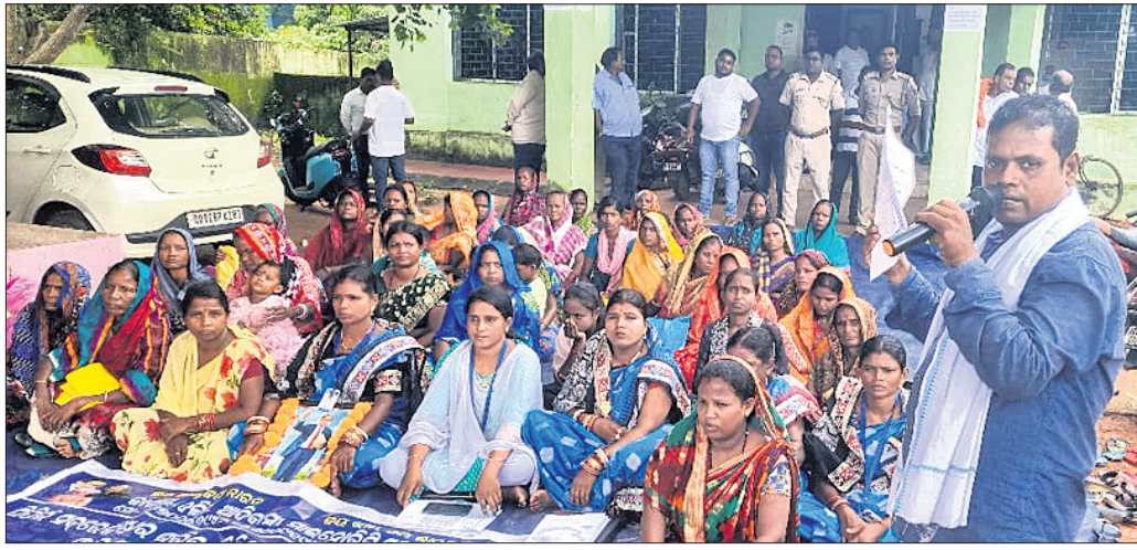
କାର୍ଯ୍ୟାଳୟ ଦଳିତ ଆଦିବାସୀ ମାଲିକାନା ମହାସଂଘ ପକ୍ଷରୁ ସର୍ବରେକ୍ଷିତ୍ୱାରକ୍ଷକ କାର୍ଯ୍ୟାଳୟ ଯେଉଁଲି କରାଯାଇଛି ।

କରିଥିଲେ ମଧ୍ୟ ଆଜିପର୍ଯ୍ୟନ୍ତ ତାଙ୍କୁ ଦଳିତ ମିଳି ନ ଥିବା ଅଭିଯୋଗ କରିଛନ୍ତି। ଏନେଇ ସେ ସର୍ବରେକ୍ଷିତ୍ୱାରକ୍ଷକ ପ୍ରାପ୍ତ ଭୋଲକ୍ଷ୍ମୀ ଦିବି କରିଥିଲେ। ଏହି ବାବଦରେ ପ୍ରାପ୍ତ ସମସ୍ତ ଅଂଶଦାତାମାନଙ୍କୁ ସେମାନଙ୍କ ପ୍ରାପ୍ତ ଟଙ୍କା ଦେଇ ଏକାଠି କରିଥିଲେ।