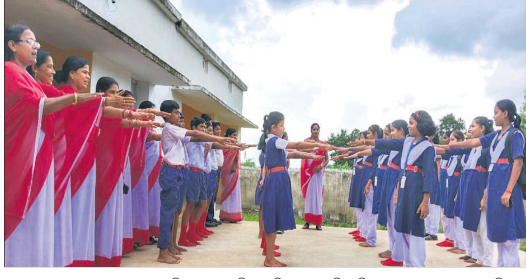
ସ୍ୱଚ୍ଛତା ପକ୍ଷ ପାଳନ ଅବସରରେ ବେଗୁନିଆ ବୁକ ପୋଡ଼ାଢ଼ି ଗ୍ରାମସ୍ଥିତ ଭାରତୀୟ ବିଦ୍ୟା ନିକେତନ ଛାତ୍ରାଛାତ୍ରୀ ଶପଥ ନେଉଛନ୍ତି।

ଭୁବନେଶ୍ୱର, ୨୯ (ବନ୍ଦନା ସେଠୀ): କୋଠଘର ଆମ ସାହିତ୍ୟ ପରିବାର ପକ୍ଷରୁ ଖଣ୍ଡଗିରିରୁ ବାଣୀପାଣି ଶିଶୁ ବିଦ୍ୟା ମନ୍ଦିର ଆଲୋଚନା କ୍ଳାସରେ ପରିସରରେ ଚାରାଚୋପଣ କାର୍ଯ୍ୟକ୍ରମ ଅନୁଷ୍ଠିତ ହୋଇଯାଇଛି।