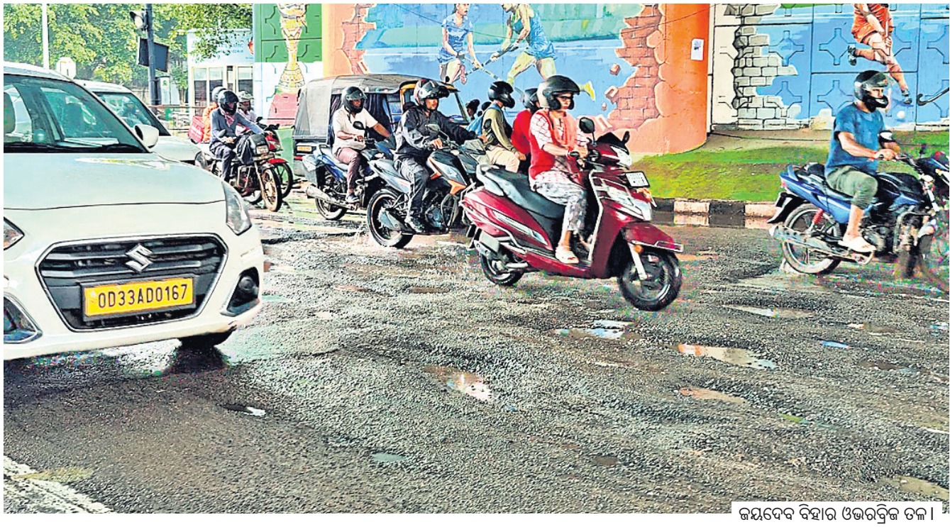
ଜୟଦେବ ବିହାର ଓଭରବ୍ରିକ ଡଳା

ସଂକ୍ଷେପରେ କୋଠଘର ପକ୍ଷରୁ ବୃକ୍ଷରୋପଣ, କବିତା ଆସନ ଭୁବନେଶ୍ୱର, ୨୧ (ବନ୍ଦନା ସେଠା)