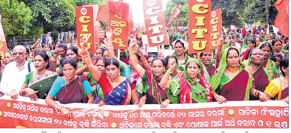
ସର୍ବନିମ୍ନ ମାସିକ ବରମା ୨୬ ହଜାର ଟଙ୍କା ଏବଂ ଅନ୍ୟାନ୍ୟ ଦାବି ନେଇ ଓଡ଼ିଶା ମଧ୍ୟାହ୍ନ ଭୋଜନ ପାଟିକା- ସହାୟିକା ସଂଘ ପକ୍ଷରୁ ମଙ୍ଗଳବାର ଭୁବନେଶ୍ୱର ଲୋକସଭା ପ୍ରଦର୍ଶନ କରାଯାଇଛି ।