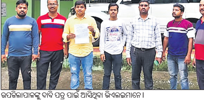
ଉପକଳାପାଳକୁ ଦାବି ପତ୍ର ପାଇ ଆସିଥିବା ଭିକଲମାନେ।

ବ୍ରହ୍ମପୁର, ୩୧ (ସୁଜିତ ରଞ୍ଜନ ମହାଲିକ) ରାଜ୍ୟ ସରକାରଙ୍କ ସୁଭଦ୍ରା ଯୋଜନାରେ ଆବେଦନ ଫର୍ମ କ୍ଷେତ୍ରରେ ଜନ ସେବା କେନ୍ଦ୍ର ରୂପେ ସରକାରଙ୍କ ପକ୍ଷରୁ ଅର୍ଥ ପ୍ରଦାନ କରିବା