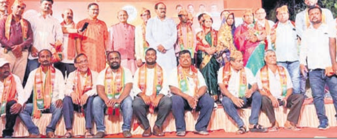
ଭାଜପାରେ ଯୋଗଦେଇଥିବା ଉପାଧ୍ୟକ୍ଷ ଓ କାର୍ଯ୍ୟକର୍ତ୍ତାମାନେ।