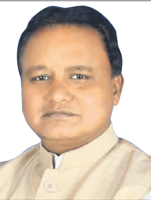
ମୋହନ ଚରଣ ମାଝୀ