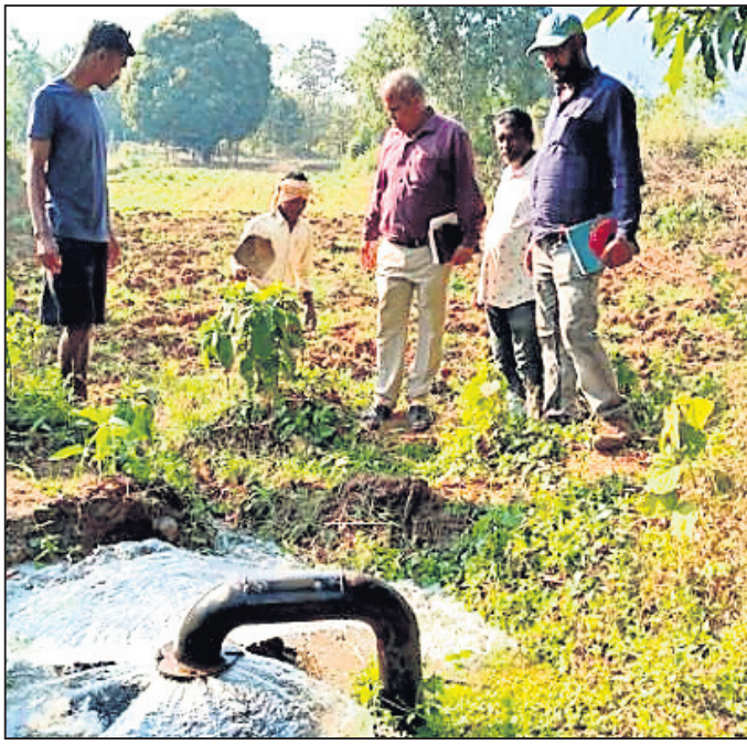
ବୁଦ୍ଧିଜୀବୀଙ୍କୁ ନିଜର ଉପାଦାନ ପ୍ରକଳ୍ପ ଅଧିକାରୀମାନେ ଅନୁଧ୍ୟାନ କରୁଛନ୍ତି।

ମୃତ୍ୟୁ ପୂର୍ବକାଳୀନ କ୍ଷେତ୍ରରେ ଜମିକୁ ଜଳସେଚିତ କରିବାରେ ଦାୟିତ୍ୱଭାର ଦିଆଯାଇଛି।