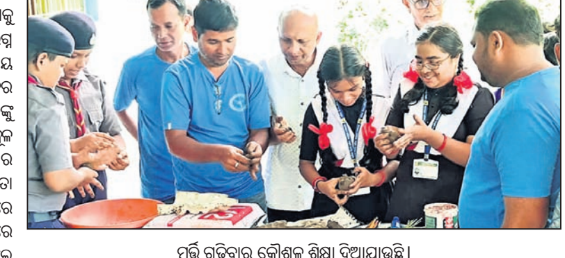
ମୂର୍ତ୍ତି ଗଢ଼ିବାର କୌଶଳ ଶିକ୍ଷା ଦିଆଯାଇଛି।

ଏବଂ ତା ମଧ୍ୟରେ ସଜନା ମଞ୍ଜି ରୋପଣ ସହ ଧଳା, କଳା ଓ ନାଲି ବିଧିରେ ଗଣେଶ ପ୍ରତିମାକୁ ରଙ୍ଗ କରିବେ।