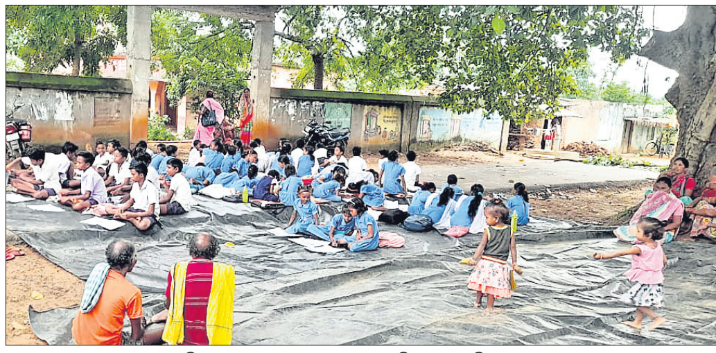
ଉଚ୍ଚିଆକଟା-କଦଳୀପୁର ରାସ୍ତା ଉପରେ ବସି ପାଠ ପଢୁଛନ୍ତି ଛାତ୍ରଛାତ୍ରୀ।

ସରକାରୀ ସ୍କୁଲ ପାଇଁ ଜମି ଦେଇଥିଲେ ମଧ୍ୟ ଜମି ମାଲିକଙ୍କ ସମ୍ପର୍କରେ କିଛି ରୋଷେୟା ଭାବେ ନିୟୁତ୍ତି ମିଳିଲା ନାହିଁ। ଏଥିରେ ଖାସ୍ତା ହୋଇ ଜମି ଉପରେ ମାଲିକାନା ଦାବି କରୁଥିବା ବ୍ୟକ୍ତି ଜଣକ ଜମି ବାବଦ କ୍ଷତିପୂରଣ ଦାବି କରି ଉକ୍ତ ସରକାରୀ ବିଦ୍ୟାଳୟରେ ମଙ୍ଗଳବାର ତାଲା ପକାଇ ଦେବାକୁ ରାସ୍ତା ଉପରେ ବସି ପାଠ ପଢ଼ିଛନ୍ତି ଛାତ୍ରଛାତ୍ରୀ। ଏପରି ଏକ ଘଟଣା ଦେଖିବାକୁ ମିଳିଛି ଅନୁଗୋଳ ଜିଲ୍ଲା କିଶୋରନଗର ବ୍ଲକ୍ କଦଳୀପୁର ପଞ୍ଚାୟତର ସାନରେହିଲା ଗ୍ରାମରେ ଥିବା ସରକାରୀ ଉଚ୍ଚ ପ୍ରାଥମିକ ବିଦ୍ୟାଳୟରେ। ଘଟଣାକୁ ପ୍ରକାଶ, ସାନରେହିଲା ସରକାରୀ ଉଚ୍ଚ ପ୍ରାଥମିକ ବିଦ୍ୟାଳୟ ଏକ ଘରୋଇ ଜମିରେ ସ୍ଥାପନ ହୋଇଛି। ଏଥିପାଇଁ ଦୀର୍ଘବର୍ଷ ତଳୁ ଗ୍ରାମର ଜଣେ ବ୍ୟକ୍ତି ଜମି ପ୍ରଦାନ କରିଥିଲେ। ଏବେ ମଧ୍ୟ