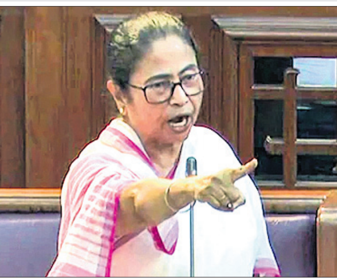
ପଶ୍ଚିମବଙ୍ଗ ବିଧାନସଭାରେ ମୁଖ୍ୟମନ୍ତ୍ରୀ ମମତା ବାନାର୍ଜୀ

ବୋଷାସାଧ୍ୟକ୍ଷ ହେବେ, ସେମାନଙ୍କ ପାଇଁ ଦିନା ପାରୋଲରେ ଆଶ୍ରୟ କେନ୍ଦ୍ରକୁ ବନ୍ଦ କରିବା ପାଇଁ ବିଲ୍ ଗ୍ରହଣ କରାଯିବ। ବିଲ୍ ଗ୍ରହଣ ପରେ ଅନ୍ୟପକ୍ଷରେ ମହିଳାମାନଙ୍କ ସୁରକ୍ଷା ପାଇଁ ସ୍ୱୀକୃତି ଦେବା ନିମନ୍ତେ ବିରୋଧୀ ଦଳ