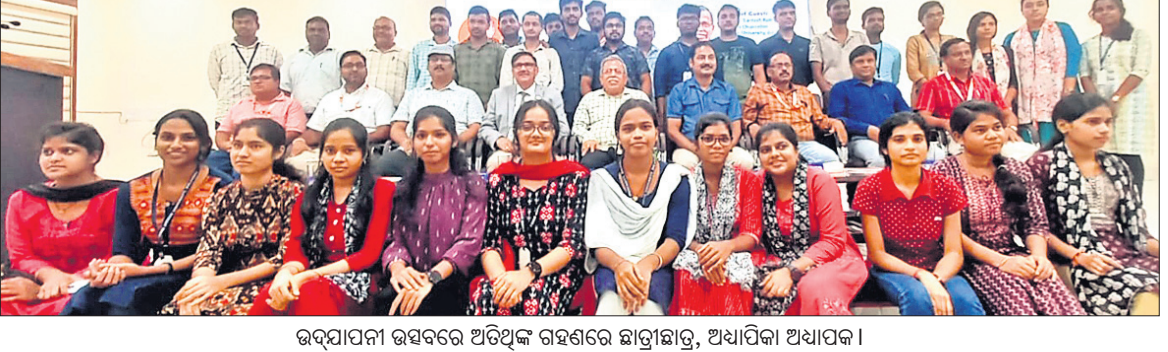
ଉଦ୍‌ଯାପନା ଉତ୍ସବରେ ଅତିଥିଙ୍କ ଗହଣରେ ଛାତ୍ରାଛାତ୍ରୀ, ଅଧ୍ୟାପିକା ଅଧ୍ୟାପକ।

ସର୍ବୋତ୍ତମ। ଆଉ ଏକ ନୂତନ ପୃଥୁବା ସମ୍ମାନରେ ମଣିଷ ଅଗ୍ରସର ହେଉଛି। ବର୍ତ୍ତମାନ ମହାକାଶ ବିଜ୍ଞାନ ସାହାଯ୍ୟରେ ଅନ୍ୟ ଏକ ବସାସ ଯୋଗ୍ୟ ଗ୍ରହର ଅନୁସନ୍ଧାନରେ କରାଯାଉଥିବା ପଦକ୍ଷେପ ପ୍ରଶଂସନୀୟ ବୋଲି ମତବ୍ୟକ୍ତ କରିଥିଲେ।